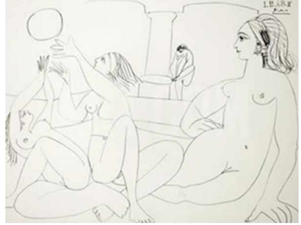
Resim 6. Pablo Picasso, Türk Hamamı, 1968. (Büyükkol ve Arda 2016: 2056)

Hamam kültürünün edebiyata konu olduğu ve sıklıkla Klasik Türk edebiyatı içerisinde yer alan divan şiirinde işlendiği görülmektedir. Divan edebiyatında, hamamların konu olarak işlenmesi hammâmiye olarak geçen şiir türünde âşıkların birbirlerini gördüğü ya da buluşma ümidini besledikleri mekânlar olarak yer almaktadır. Konu işlenmesinde, bazı durumlarda hamamlar mimari yapı olmaktan çıkıp insani duygu taşıyan varlıklar biçiminde şiirlerde yer alabilmektedir.