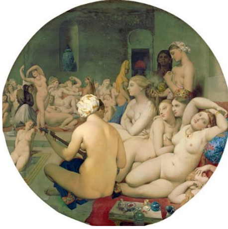
Resim 5. Jean Auguste Dominique Ingres, Türk Hamamı, 1862 (Lemaire 2008: 203, Büyükkol ve Arda 2016: 2054)

hamamı teması, Ingres'in eserinde oryantalist, Picasso'nun eserinde modernist bir yaklaşımla işlemiş olduğu söylenebilir (Kodaman ve Özkartal 2010: 136).