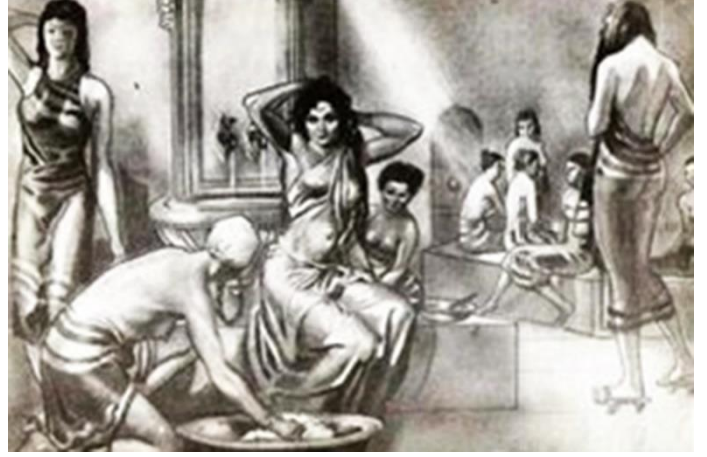
Resim 4. Münif Fehim Özerman, Kadınlar Hamamı. (Büyükkol & Arda, 2016:2052)