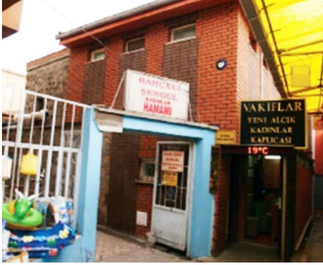
Resim 1. Alçık hamamı giriş cephesi.