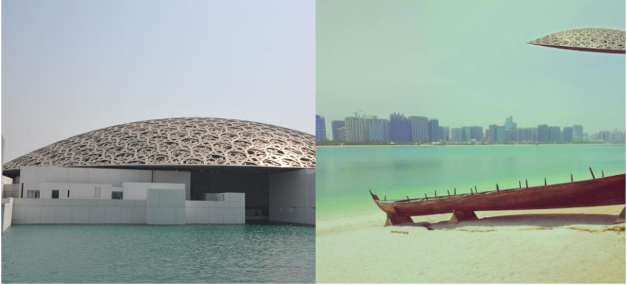
Louvre Abu Dhabi

Sergi, sanat sosyologları tarafından sıkça vurgulanan postmodern müze mimarisi bağlamında geç kapitalizmin kültür atılımlarına ve bu bağlamda şekillenen yeni müze algısına odaklanıyor. Müzeciliğin koleksiyon odağından ziyaretçi odağına ve mimari odağına nasıl evrildiğini Birleşik Arap Emirlikleri, Azerbaycan ve Katar örnekleriyle irdelemenin yanı sıra, sergide incelenen müzelerin yerel kültüre ne düzeyde uyum sağladıkları ve çağdaş müzecilik işlevlerine ne ölçüde bağlı oldukları da eleştirel bir dille ele alınıyor.