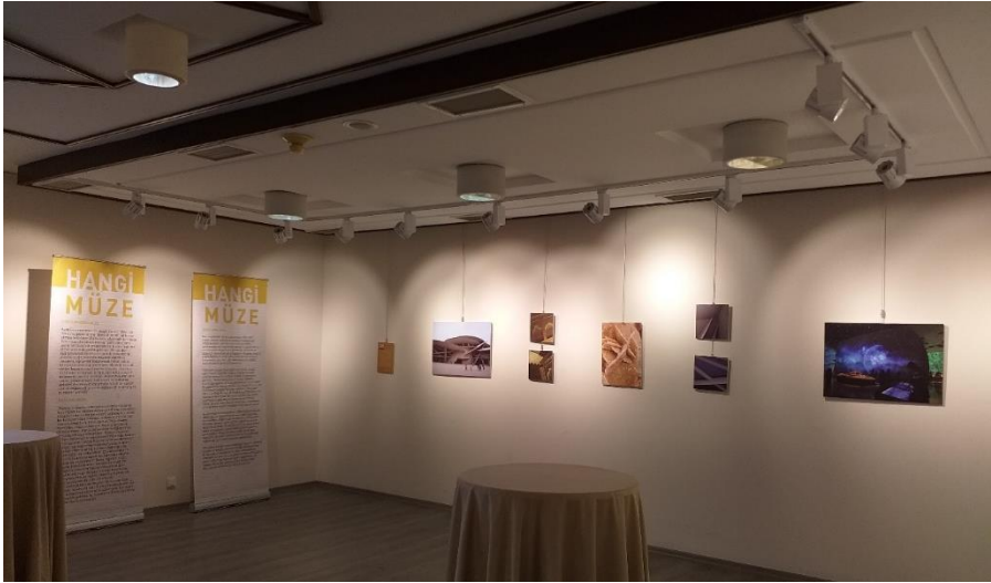
Sergi salonu genel görünüm

ortamı yarattığı da söylenebilir. Buna rağmen müze, toplama, bakım-onarım, sergileme ve eğitim işlevlerinin yanı sıra halkla buluşma ve geç kapitalist düzende dünyanın içinde bulunduğu sosyo-ekonomik süreçleri izleyicilere aktarma sorumluluklarını da yerine getirmelidir. Bu sorumlulukları yerine getirirken müzenin karşı karşıya olduğu kimlik sorunu da göz ardı edilmemelidir. Bu kimlik sorununun en önemli göstergesi, her şeyin müze haline gelmesi ve müzelerin önüne geçilmez bir hızla sayıca artmasıdır. Geç kapitalizm sürecinde ortaya çıkan yeni müze dalgası yaşantı sağlamaya, deneyim üretmeye odaklanmakta... Bu deneyim üretilirken yeni bir hafıza oluşturmak, geç kapitalizmin belleğini kurgulamak ve zamansallık duygusunu gündeme getirmek de amaçlanmakta!