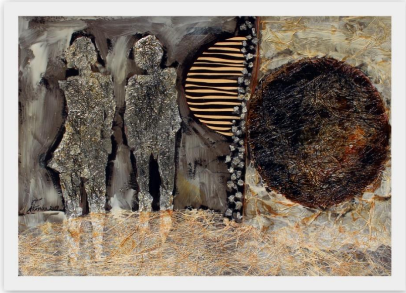
Görsel 1. “Cinsler Arası İkilik”, Karışık Teknik (Asamblaj+Akrilik), 41x56 cm.

sarf eder. İyi-kötü/ doğru-yanlış/ gündüz-gece/ siyah-beyaz/ kadın-erkek/ var-yok vb. kavramlar gibi insanın iç dünyasında var olan kavramlar, birini fark edebilmek, anlayabilmek, içselleştirebilmek ve sorgulayabilmek için diğerine ihtiyaç duyar. Bu anlamda sergi, “İkilik” (Dualite) kavramını, insanın kendisiyle olan ilişkisini tekrar gündeme getirmek ve irdelemek üzerine izleyicisiyle buluşuyor. Resimde yer alan figürler ikiyeşerli ve birbirleriyle iletişim kuracak şekilde kompoze edilmektedir. Aslında, ikili figürler tek bir insanı anlatır ancak görünen iki form, kişinin kendi ile olan çatışmasının ya da barışık olma durumunun görünür halidir. Sanat alıcısı, sergideki resimleri kendi dilinden okumaya başladığı zaman doğal olarak kendi iç ikiliklerini sorgulamaya başlayacaktır ki serginin ana amacı budur.