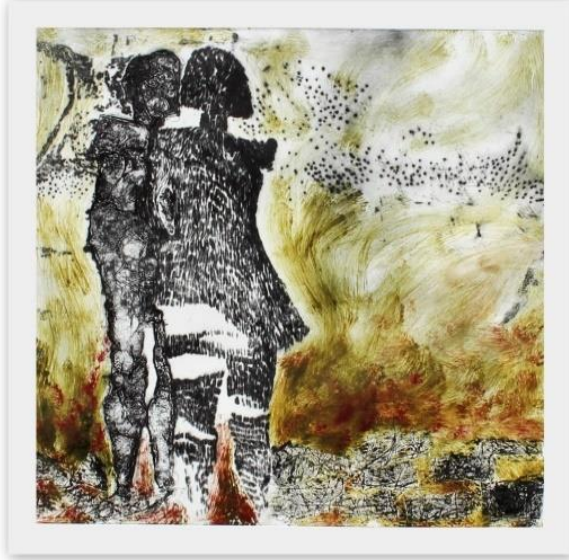
Görsel 4. "Kendine Sırtını Dönmek", Collograph, 43x56cm.