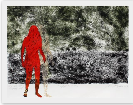
Görsel 2. “Kendine Küsmek”, Collography, 62x58 cm.