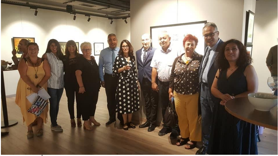
Görsel 6. “İkilik” Sergisinin açılışından bir fotoğraf, Sevgi Sanat Galerisi, 18 Eylül 2019