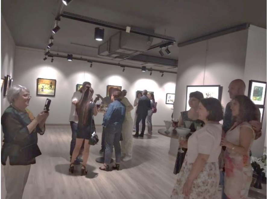
Görsel 7. “İkilik” Sergisinin açılışından iki fotoğraf, Sevgi Sanat Galerisi, 18 Eylül 2019