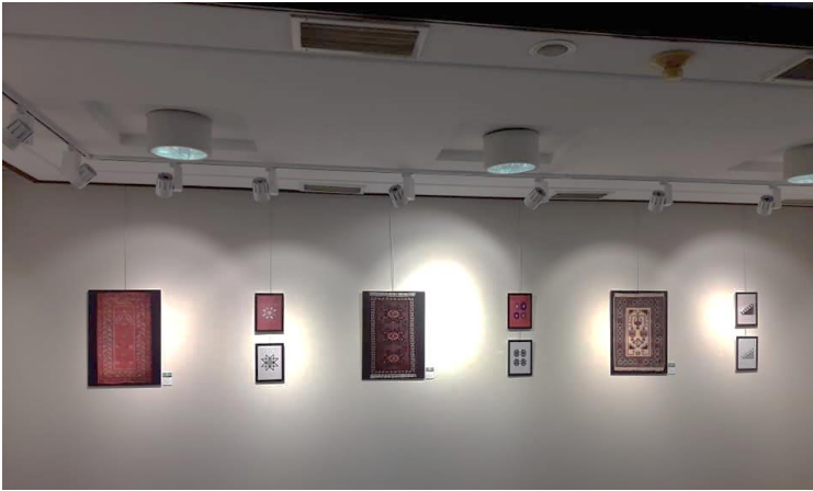
Sergi salonu genel görünüm

Sergi devamında köklü geçmişi olan Ankara Üniversitesi Ev ekonomisi Yüksekokulu'nun eğitim öğretimine devam ettiği 1950'li yıllarda halı atölyesinde usta dokuyuculara ve öğrencilere dokuma yapmaları için Yüksek Ziraat Enstitüsü dönemine ait olduğu düşünülen halı paftaları sergilenmiştir. 2007 yılında Ev Ekonomisinin kapanması nedeniyle geçmişi 1930'lu yıllara dayanan kültürel miras olarak devralınan paftalar artık Güzel Sanatlar Fakültesi bünyesindedir. Sergileme de geniş derin çerçeveler seçilerek koruma altına alınmıştır.