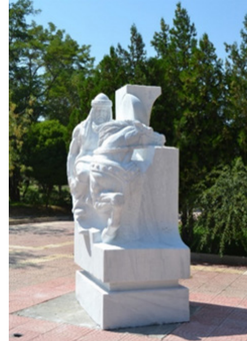
Görsel 5. Cengiz Gögebakan, Battal Gazi, 2014, Mermer Yontu.

Kuru çay üzerine neden köprü kurulduğu sorusu bir zamanlar bu nehrin gür olduğunu işaret ederken diğer yandan da nehrin simgelediği değerler sorgulanmalıdır. Bunlar zamanla değişen hayat, kültürel değerler, kişilikler gibi insana ait olan tüm değerlerdir.