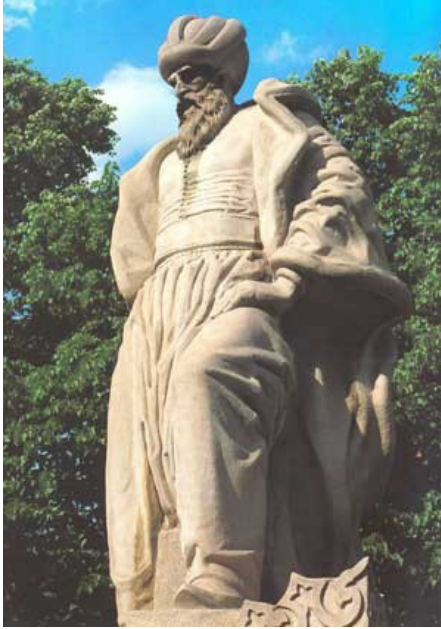
Görsel 3. Hüseyin Özkan, Mimar Sinan, 1956, Mermer Yontu.

Bu yapıt sanatçının aldığı, batının biçimleme dilini, içinde var olduğu kültüre entegre etmeyi başaran önemli bir örnektir. Batıda eğitim aldıktan sonra yurda dönerek sanatsal çalışmalarını sürdüren bir başka sanatçı ise Hüseyin Özkan'dır.