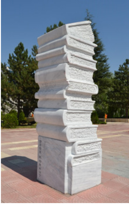
Görsel 6. Aysun Altunöz, "Dedem Korkut Deli Dumrul", 2014, Mermer Yontu.

Bu açıdan bakıldığında bir üniversite yerleşkesinde konumlandırılan seçilmiş kültür kişiliklerinin heykelleri yeni nesile öğretilerle yol gösterirken günümüzde de hak ettiği değeri bulması bakımından birçok kültür sanat etkinliklerinde ve bilimsel araştırmalarda konu edilmelidir.