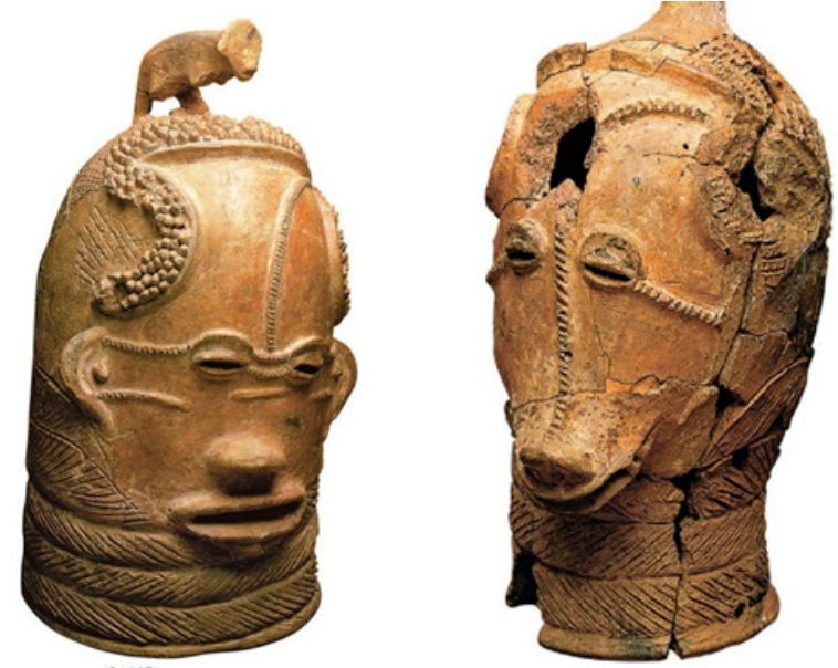
Görsel 9. Lydenburg Kafası, M.Ö. 500-700, 38x26x25.5 cm., Cape Town Üniversite Koleksiyonu, Güney Afrika Müzesi, Cape Town

Bu kullanım eşyalarının yanı sıra; sadece ağız, burun ve gözlerinin göreceği kısımları boşlukta bırakan tüm baş kısmını kaplayan miğferler üretilmiştir. Bu miğferlerin dini ritüellerde ve tiyatro sahnelerinde kullanıldığı bilinmektedir (Delafosse, 2012: 21).