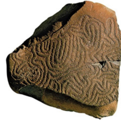
Görsel 1. Taş üzerine oyulmuş geleneksel Güney Afrika deseni, M.Ö.2000-1000, 53x54x24 cm., Mc Gregor Müzesi, Kimberley

Güney Afrika; sömürge dönemlerinde uzun bir süre etkisi altında kaldığı ülkelerin kültürü ve disiplini ile yönetilseler de kendi yaşam, kültür ve geleneklerinden ödün vermeyip yaşamlarını sürdürmeye devam etmişlerdir. Ülke; 1990'lı yılların başına kadar ırk çatışmalarının yoğun yaşandığı bir coğrafya olmasına rağmen, kendi özgün kimliğini her zaman korumuş ve bu özgünlük sanat eserlerine de yansımıştır. Geçmişten günümüze özenle korunmaya çalışılan kültür ve geleneksel değerler bugün Güney Afrika toplumunun ürettiği el sanatlarında ve artistik çalışmalarında farklı yansımalarla izlenmektedir.