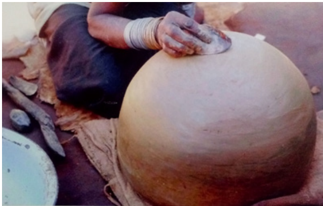
Görsel 11. Güney Afrika Çömlekçiliğinde elle şekillendirilen küp

Güney Afrika çömlekçiliği incelendiğinde çamur hazırlamadan ürünün bitim aşamasına kadar geçen süre oldukça ilkel şartlarda gerçekleşmektedir. Fakat teknik şartların zorluğuna rağmen kültürün ürüne yansması ve el becerisinin ortaya çıkardığı güzel örneklerle sonlanır. Afrika çömlekçiliğinde geleneksel olarak elle biçimlendirilen formlar; küpler, çanaklar, büyük su kapları ve tencereler gibi günlük kullanımda işlevsel özelliğe sahip büyük boyutlu formlardan oluşmaktadır.