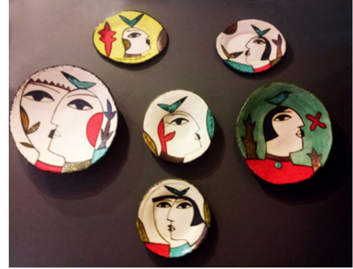
Görsel 6. Günümüzde seramik atölyeleri tarafından üretilen özgün hediyelik duvar seramikleri

sıttığı görülmektedir. Ortaya çıkan tabloda özellikle hediyelik eşya konusunda ülkemizde ve birçok ülkede olduğu gibi yozlaşmış ve ithal ürünler görülmezken kendi tasarım ve sanatsal tarzlarını ortaya koymaları ve kendi kimliklerine sahip çıkmaları hayranlık uyandırmaktadır. Ülkedeki el sanatları, tasarım ve sanat üretim grupları incelendiğinde genel olarak; geleneksel dokuma kumaşlardan üretilmiş tasarım kıyafet ve güncel kullanım tekstil üretimleri, ağaç üretimleri, takı tasarımı ve üretimi, boynuz ve kemik üretimleri, deri üretimleri, atık malzeme üretimleri, değişik malzemelerden yapılmış heykeller olduğu görülür. Bu üretimlerin başında ise; M.Ö. 7000'lerden beri günlük hayatın içinde her daim var olan, farklı biçimlerde üretilen ve günümüzde de üretilmeye devam eden geleneksel çömlekçilik sanatı ve çağdaş üretimleri gelmektedir.