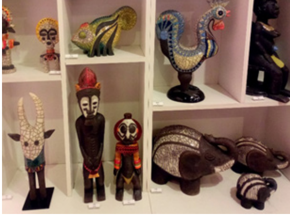
Görsel 2. Seramik ve ahşaptan oluşan ve günümüzde üretilen hediyelik eşyalar.

kullanım eşyaları), Örgü, tekstil ürünleri, boncuk işlemeciliği, takı tasarımı ve üretimi, boynuz ve kemik ürünleri, deri çalışmaları, atık malzemelerden hediyelik eşyalar, değişik malzemelerden yapılmış heykeller, geleneksel çömlekçilik ve çağdaş yorumlamaları ön sıraya çıkmaktadır.