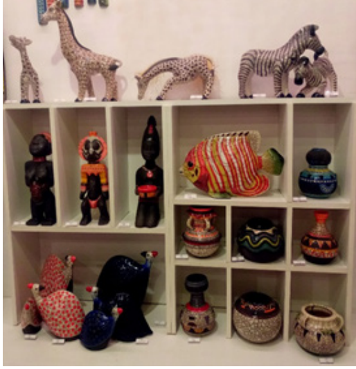
Görsel 5. Günümüz Güney Afrika özgün hediyelik eşya üretimleri

özgün üretimlere baktığımızda hangi toplumda ve ne zaman üretildiğini anlayabiliriz. Bu anlaşılabilirlik, net ve yalın olduğunda özgün üretimler çağını yansıtmakta ve aynı zamanda belgesel olma niteliğini de kazanmaktadır.