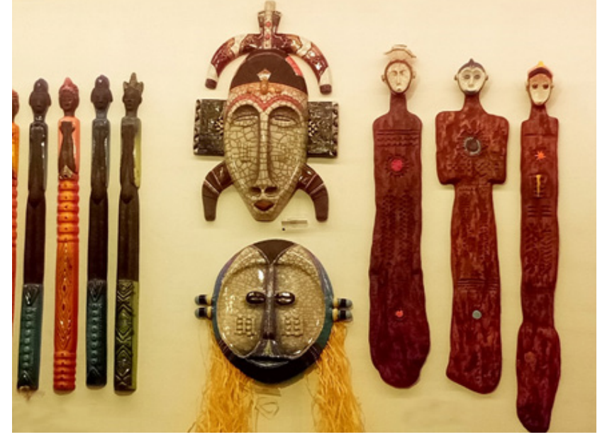
Görsel 4. Geleneksel kültürü yansıtan özgün hediyelik eşyalar

Ülkenin geleneksel yapısını, kültürünü yansıtan bu özgün üretimler; geleneksel ve çağdaş versiyonları olmak üzere özgün ve nitelikleri bozulmadan üretilmekte aynı zamanda da ülkenin geçmişten günümüze gelen uygarlık sürecinin bir göstergesi konumu olmaktadır.