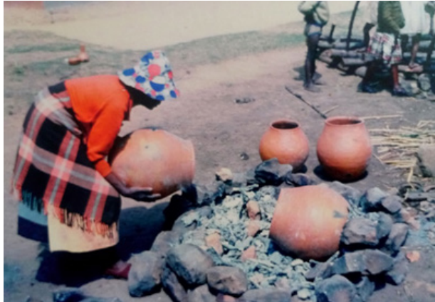
Görsel 8. Yiyecek ve sıvı taşımak için biçimlendirilen çömleklerin açık havada pişirimi

Ortaya çıkan antik seramik parçalar Afrika toplumlarının kültürel değişimleri hakkında fikir verirken, sürdürdükleri yaşamı, gelişimlerini, ihtiyaçlarını ve sahip oldukları becerileri de ortaya koymaktadır. Bu bilgi ve belgeler Afrika sakinlerinin izlerini sürmek için önemli ipuçlarını oluşturmaktadır. Kazılar sonucunda ortaya çıkan çömlekçi ürünler; su taşımak, yiyecekleri saklamak, sıvı ve sütün depolanması, yemek pişirmek, servis yapmak ve içki içmek için kullanılmışlardır 3 .