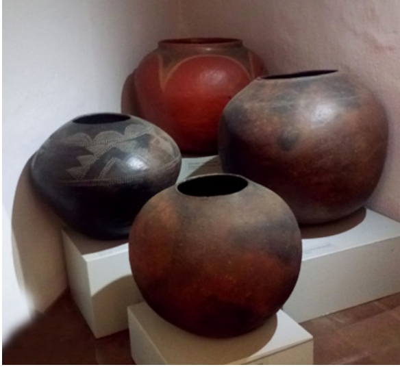
Görsel 10. Güney Afrika'da üretilen ilk çömleklerden örnekler, Iziko Müzesi, Cape Town

Güney Afrika çömlekçiliği incelendiğinde çamur hazırlamadan ürünün bitim aşamasına kadar geçen süre oldukça ilkel şartlarda gerçekleşmektedir. Fakat teknik şartların zorluğuna rağmen kültürün ürüne yansması ve el becerisinin ortaya çıkardığı güzel örneklerle sonlanır. Afrika çömlekçiliğinde geleneksel olarak elle biçimlendirilen formlar; küpler, çanaklar, büyük su kapları ve tencereler gibi günlük kullanımda işlevsel özelliğe sahip büyük boyutlu formlardan oluşmaktadır.