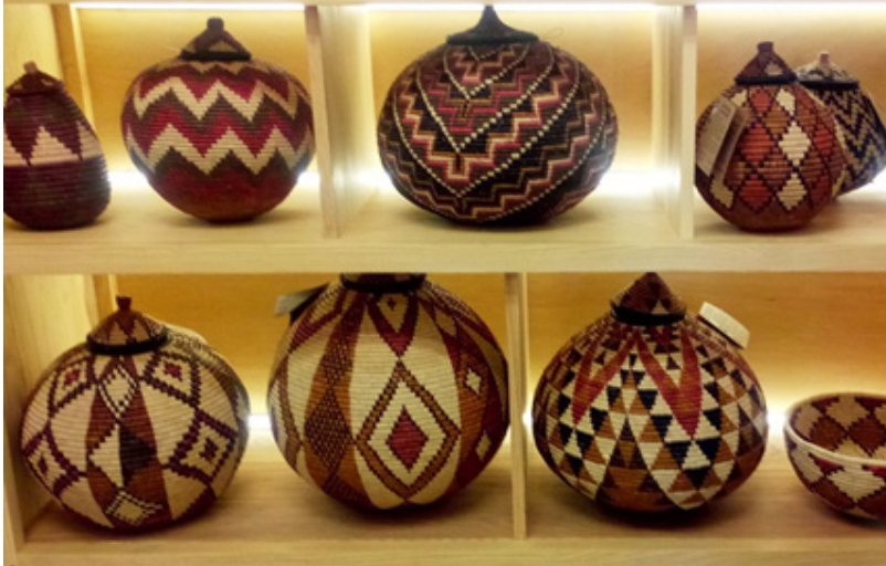
Görsel 3. Örgü geleneği ile günümüzde üretilmiş hediyelik eşyalar

Özellikle örgü geleneği farklı biçimlerde saçlarda ve el sanatları olarak üretilen ürünlerde çoğunlukla yerel dokumalarda modern tarzda ve farklı biçimlerde görülmektedir (Haour, 2010:86).