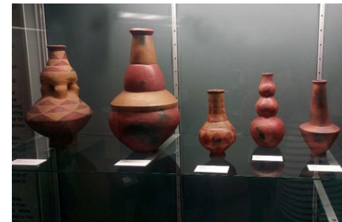
Görsel 19. Arkeolojik kazılardan elde edilen seramikler, Iziko Müzesi

Kendi kültürel kimliklerini kaybetmeden büyük bir gayretle sanatını sürdüren yukarıda bahsi geçen sanatçıların dışında Güney Afrika'da seramik sanatına ve sanatçılara destek vererek seramik eserleri bünyesinde barındıran Iziko Müzesi gibi kurumlar da bulunmaktadır. Iziko, Güney Afrikalı sanatçıların çağdaş eserlerinin yanı sıra Asya, Avrupa, Afrika seramiklerine de sahiptir. Müzedeki seramikler; yüz yıldan fazla bir süredir arkeolojik kazılardan, özel bağışlardan, sanat galerilerinden, açık arttırmalardan ve hepsinden önemlisi de sanatçılardan satın alınarak elde edilmektedir.