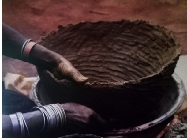
Görsel 7. Geleneksel yöntemle çömlek şekillendirme

Ortaya çıkan antik seramik parçalar Afrika toplumlarının kültürel değişimleri hakkında fikir verirken, sürdürdükleri yaşamı, gelişimlerini, ihtiyaçlarını ve sahip oldukları becerileri de ortaya koymaktadır. Bu bilgi ve belgeler Afrika sakinlerinin izlerini sürmek için önemli ipuçlarını oluşturmaktadır. Kazılar sonucunda ortaya çıkan çömlekçi ürünler; su taşımak, yiyecekleri saklamak, sıvı ve sütün depolanması, yemek pişirmek, servis yapmak ve içki içmek için kullanılmışlardır 3 .