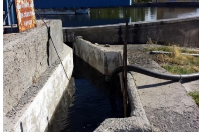
Şekil 1. Arıtma Tesisi çıkış suyu

yıllar ortalama yağış miktarı 388,5 mm (Anonim, 2016) olup yarı kurak iklime sahiptir. Denemede kullanılan artırılmış atık su, çalışma alanına yaklaşık 5 km mesafede bulunan Van İskele Atıksu Arıtma Tesisi'nden temin edilmiştir. Tesise giren işlenmemiş atık su öncelikle fiziki arıtmadan geçerek ön çökeltim havuzuna, oradan da havalandırma havuzuna aktarılmaktadır. Havalandırılarak bakteri havuzundan geçen atık su son çökeltim ünitesine aktarılmakta ve buradan da deşarj edilmektedir.