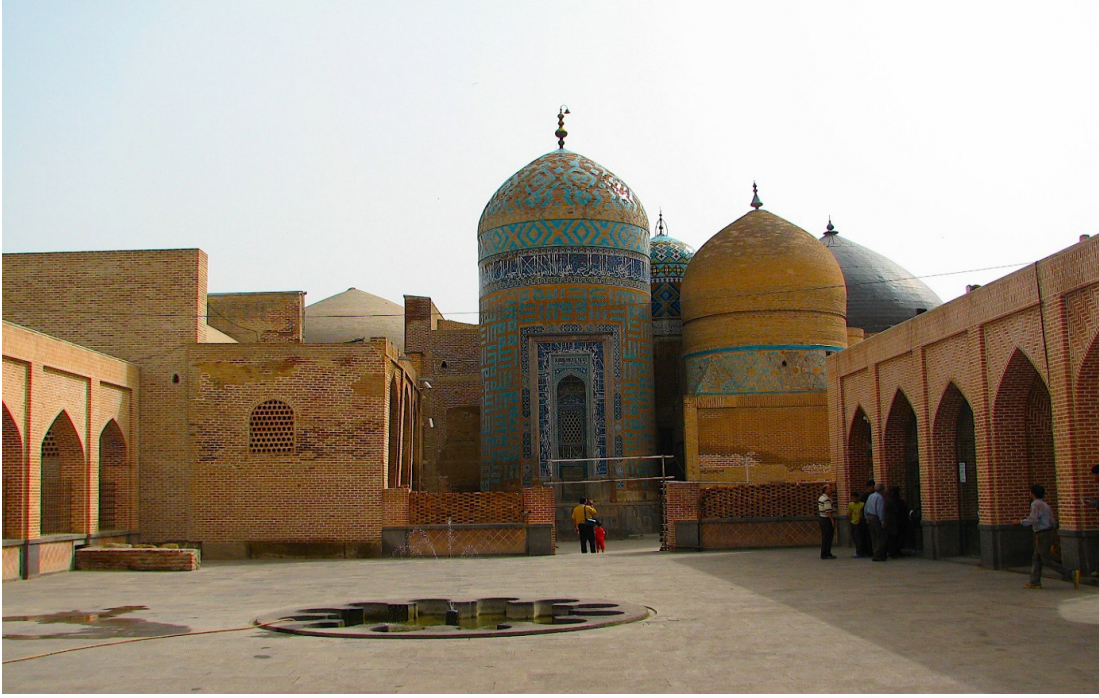
FOTOĞRAF 1. Şeyh Safiyüddin İshak Erdebilî Türbesi ve Dergâhı (Allah Allah Kümbeti)