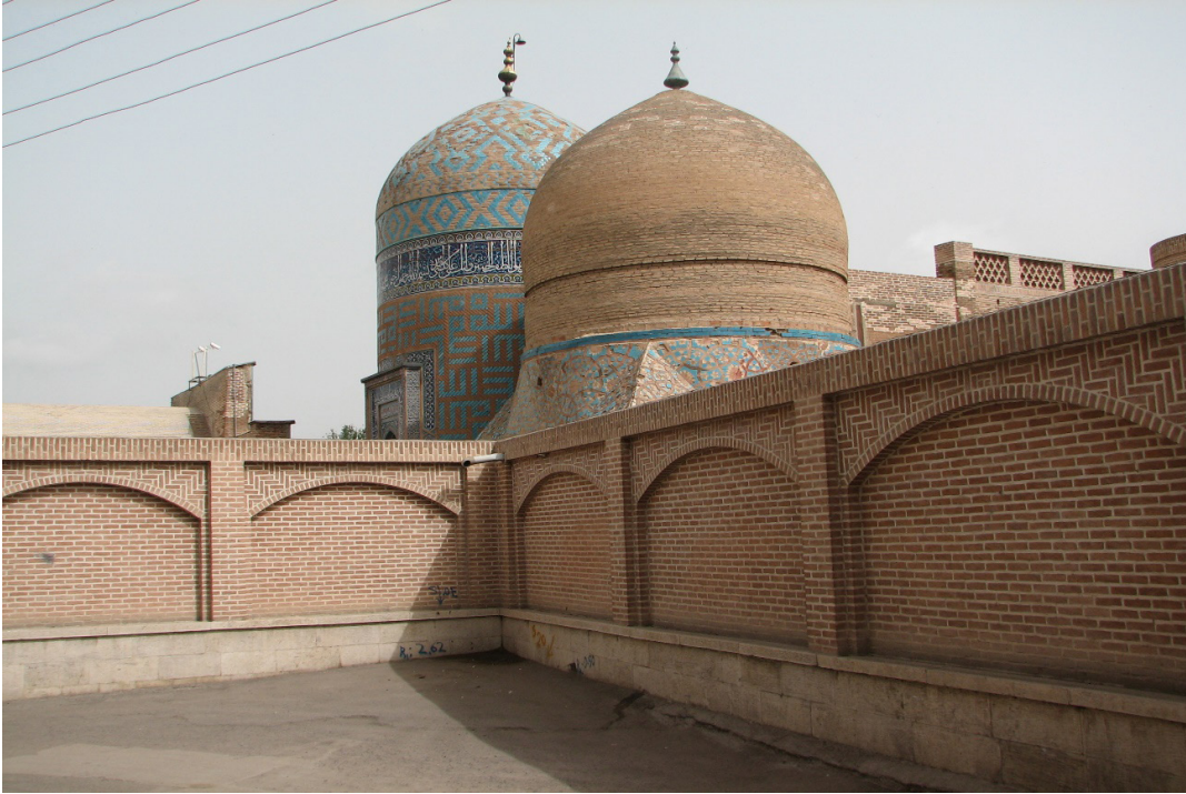
FOTOĞRAF 4 Şeyh Safiyüddin İshak Erdebilî Türbesi ve Dergâhı (Allah Allah Kümbeti)