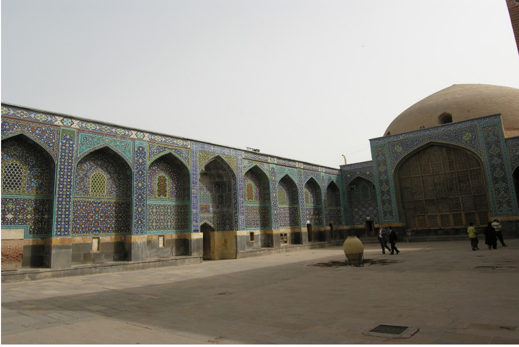
FOTOĞRAF 3. Şeyh Safiyüddin İshak Erdebilî Türbesi ve Dergâhı (Allah Allah Kümbeti)