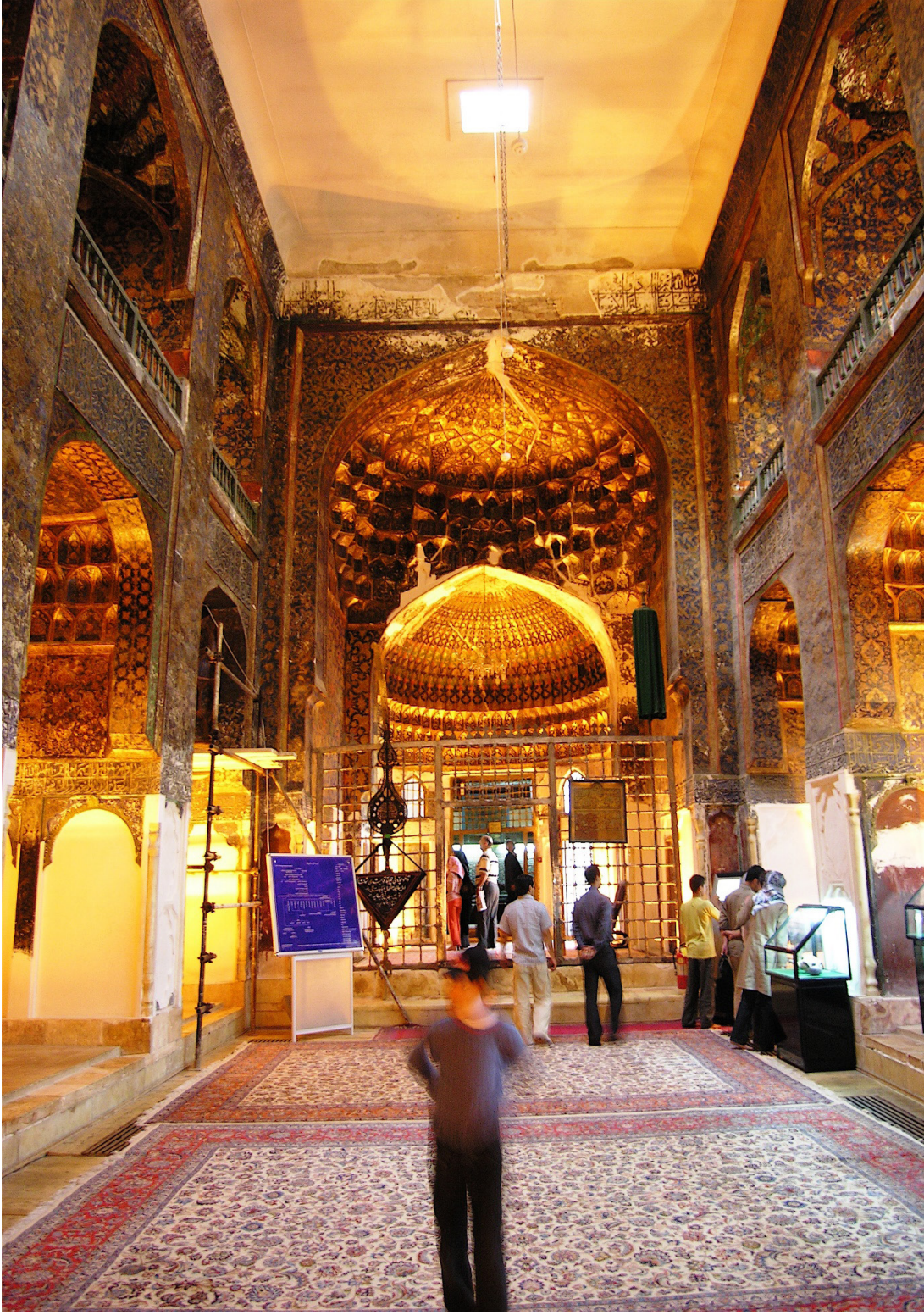
FOTOĞRAF 6. Şeyh Safiyüddin İshak Erdebilî Türbesi ve Dergâhı (Allah Allah Kümbeti)İç Görünüm