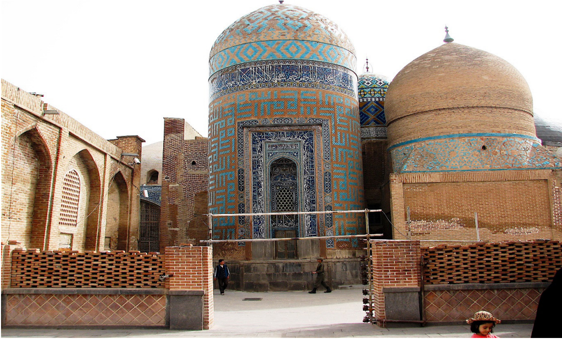
FOTOĞRAF 2. Şeyh Safiyüddin İshak Erdebilî Türbesi ve Dergâhı (Allah Allah Kümbeti)