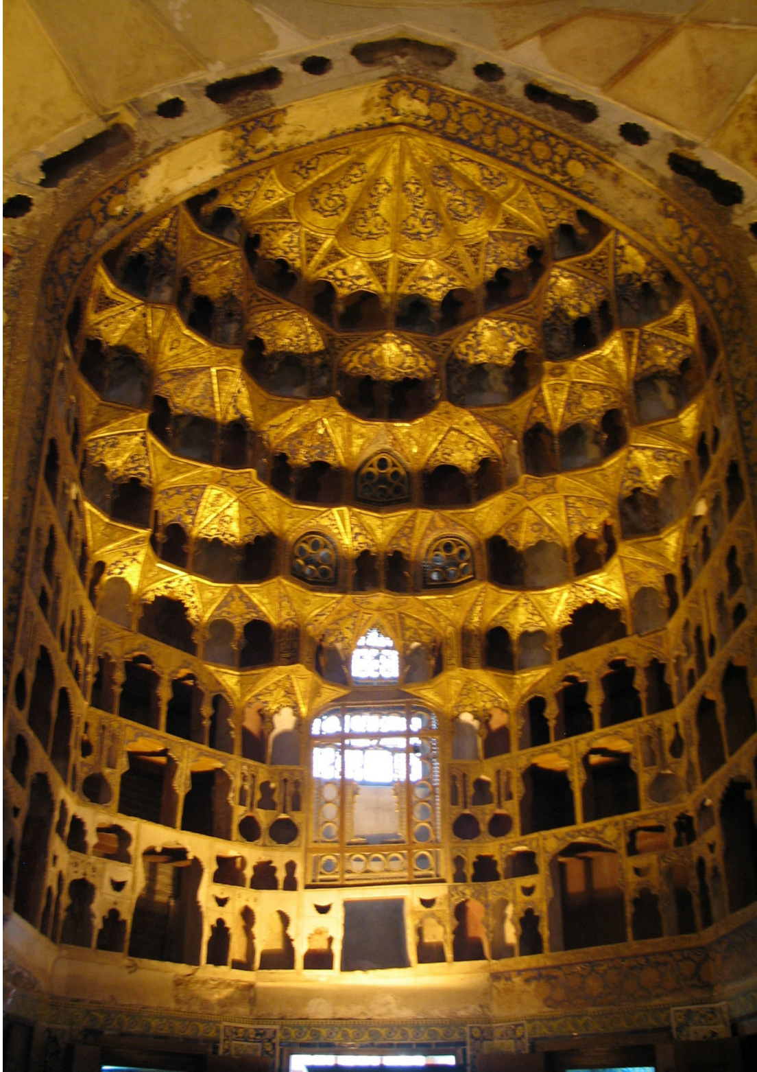
FOTOĞRAF 7. Şeyh Safiyüddin İshak Erdebilî Türbesi ve Dergâhı (Allah Allah Kümbeti) İç Görünüm