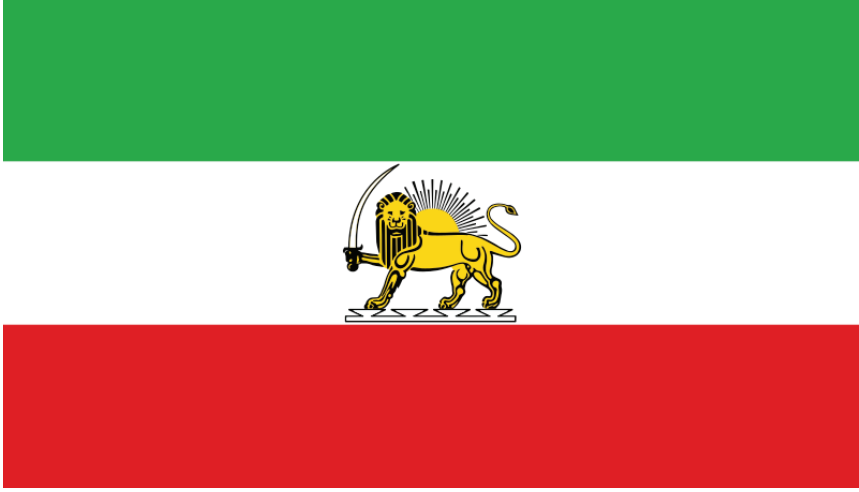
Resim 1: Pehleviler Dönemi İran Bayrağı.

1925 ve 1979 yılları arasında İran, kırmızı, beyaz ve yeşilden oluşan üç renkli ve tam ortasında elinde kılıç tutan bir aslan ve güneş sembolü bulunan bir bayrak kullanmıştır (Resim 1). 40 Bayrakta aslan ile sembolize edilen, İran mitolojisinin efsanevi kahramanlarından Rüstem'dir. 41 Güneş'in ise İranzemin'i ve efsanevi İran Şahı Cemşid'i temsil ettiğine inanılmaktadır.