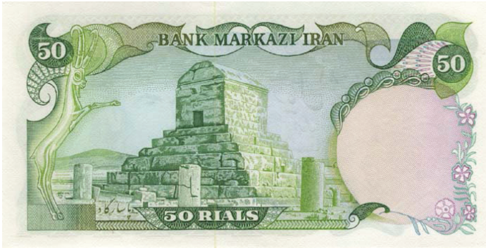
Resim 6: Persepolis

50 riyal değerinde bulunan banknotta ise Pers İmparatorluğu'nun başkenti Persepolis'ten bir görsel bulunmaktadır (Resim 6). Bu sembol, Muhammed Rıza Şah Dönemi'nin önemli bir unsuru halini almıştır ve hanedanın Pers milliyetçiliğini yeniden icat etmesinde kullanılan temel unsurlardandır.