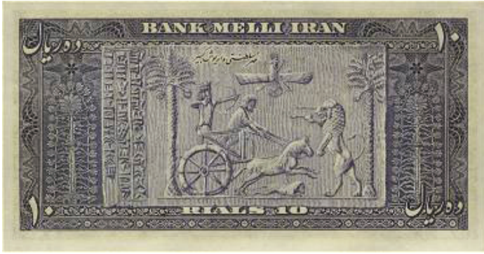
Resim 5: Darius Mührü.

50 riyal değerinde bulunan banknotta ise Pers İmparatorluğu'nun başkenti Persepolis'ten bir görsel bulunmaktadır (Resim 6). Bu sembol, Muhammed Rıza Şah Dönemi'nin önemli bir unsuru halini almıştır ve hanedanın Pers milliyetçiliğini yeniden icat etmesinde kullanılan temel unsurlardandır.