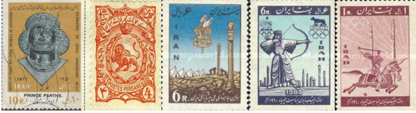
Resim 7: Pers Prensi (1), Aslan Sembolü (2), Persepolis (3), Pers Savaşçıları(4-5).

Benzer bir durum posta pullarında da söz konusudur (Resim 7). Tıpkı banknotlar gibi posta pullarında da rejimin temel söylemi, antik Pers tarihi ve mirası üzerine inşa edilmiştir.