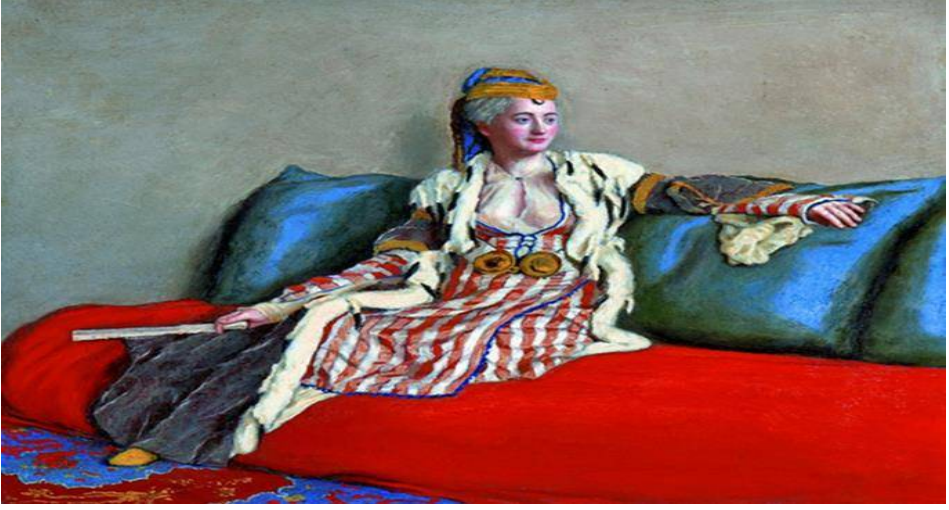
Resim 3. Türk kıyafeti ile Leydi Montagu- Ressam; Jean-Étienne Liotard, 1756, Royal Historical Society University College London. (Varşova Ulusal Müzesi, Polonya'dan sergilenmek üzere getirilmiş) (5)

Fatma Hanım'ın üzerinde Montagu'nün tablolarında (resim 2, 3, 4, 5) kendisinin giymiş olduğu kıyafetleri anlattığı gibi değerli bir kumaştan yapılmış şalvar, üzerine giyilen simlerle çevrelenmiş ince tül den bir gömlek ve sırmalarla süslenmiş dıba bir elbise giydiğini; ayağındaki terliklerin sırmalarla süslenmiş olduğunu; beline taktığı kemerin elmaslarla bezenmiş olduğunu; her iki kollunda elmastan yapılmış bilezikler bulunduğunu dile getirir. Başında ise karanfil renginde sırmalar ile işlenerek süslenmiş bir yemeni bulunduğunu, ayaklarına kadar inen simsiyah saçlarının örülmüş ve başının bir yanına elmastan yapılmış tokalar ile zarif bir şekilde toplanmış olduğunu ilave eder. Resim 4'te de görüldüğü gibi Montagu'nün ilk kez 1819 yılında, James Sarayı'nda kayda geçen, muhtemelen kendi yaptırdığı yağlı boya portrede, başında bulunan tül bendin zarif sarı kırmızı ipekten yapılmış, üzerinde inci ve tüy süslemelerin bulunduğu, saçlarının ise beyaz ve pembe çiçeklerle süslenmiş birçok örgü şeklinde resmedildiği görülmektedir.