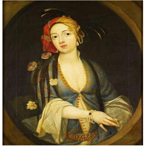
Resim 4. İlk olarak 1819'da James Sarayı'nda kayda geçen Montagu Portresi, Royal Collection Trust (Kraliyet Koleksiyonu), Londra.(6)

Fatma Hanım'ın üzerinde Montagu'nün tablolarında (resim 2, 3, 4, 5) kendisinin giymiş olduğu kıyafetleri anlattığı gibi değerli bir kumaştan yapılmış şalvar, üzerine giyilen simlerle çevrelenmiş ince tül den bir gömlek ve sırmalarla süslenmiş dıba bir elbise giydiğini; ayağındaki terliklerin sırmalarla süslenmiş olduğunu; beline taktığı kemerin elmaslarla bezenmiş olduğunu; her iki kollunda elmastan yapılmış bilezikler bulunduğunu dile getirir. Başında ise karanfil renginde sırmalar ile işlenerek süslenmiş bir yemeni bulunduğunu, ayaklarına kadar inen simsiyah saçlarının örülmüş ve başının bir yanına elmastan yapılmış tokalar ile zarif bir şekilde toplanmış olduğunu ilave eder. Resim 4'te de görüldüğü gibi Montagu'nün ilk kez 1819 yılında, James Sarayı'nda kayda geçen, muhtemelen kendi yaptırdığı yağlı boya portrede, başında bulunan tül bendin zarif sarı kırmızı ipekten yapılmış, üzerinde inci ve tüy süslemelerin bulunduğu, saçlarının ise beyaz ve pembe çiçeklerle süslenmiş birçok örgü şeklinde resmedildiği görülmektedir.