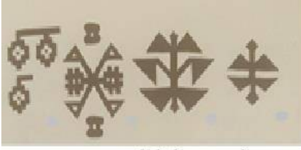
Resim 2 (Erbek 1986: 15)