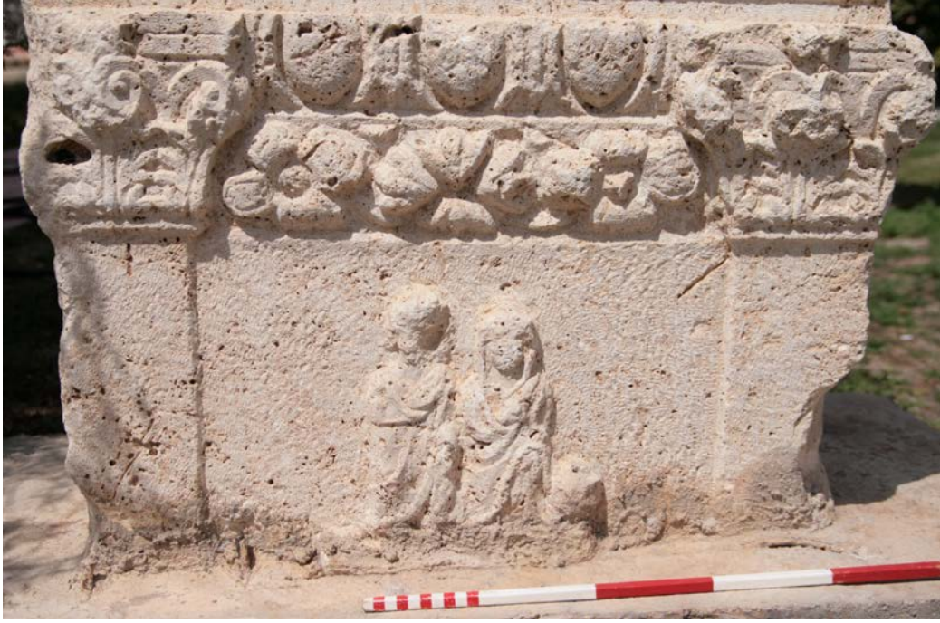
Figür 5: Figüratif Bezeme Alanı