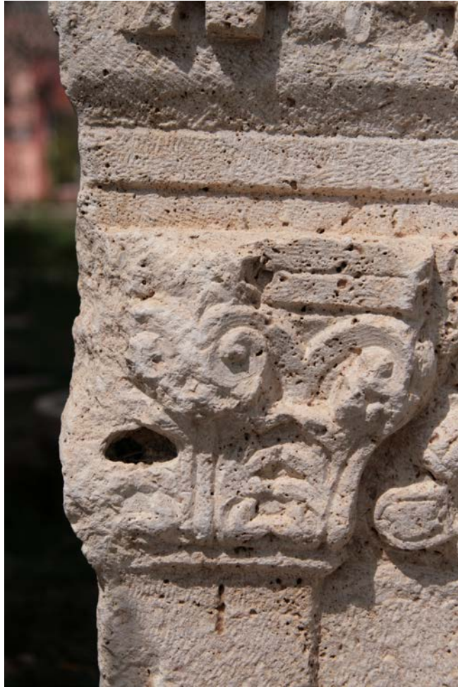
Figür 4: Figüratif Bezeme Alanını Sınırlandıran Plasterlere Ait Başlıklar (Detay)