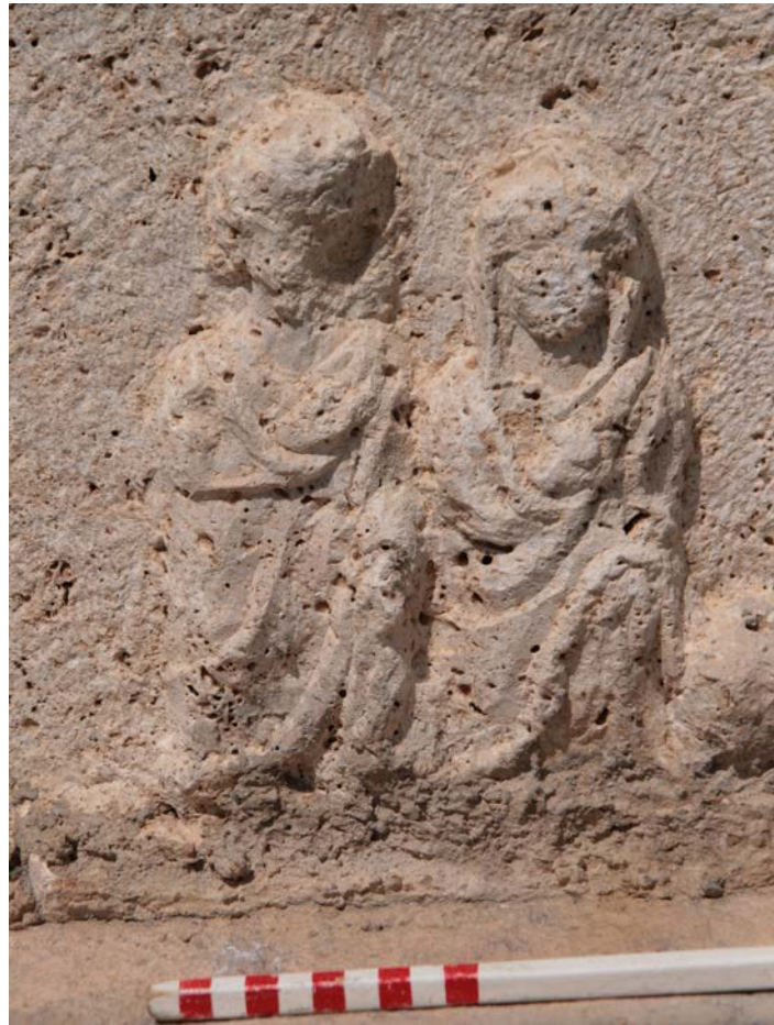
Figür 6: Erkek ve Kadın Figürleri (Detay)