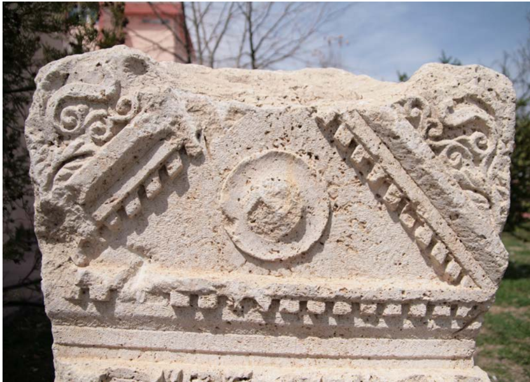
Figür 2: Stel Alınlık Kısmı (Detay)