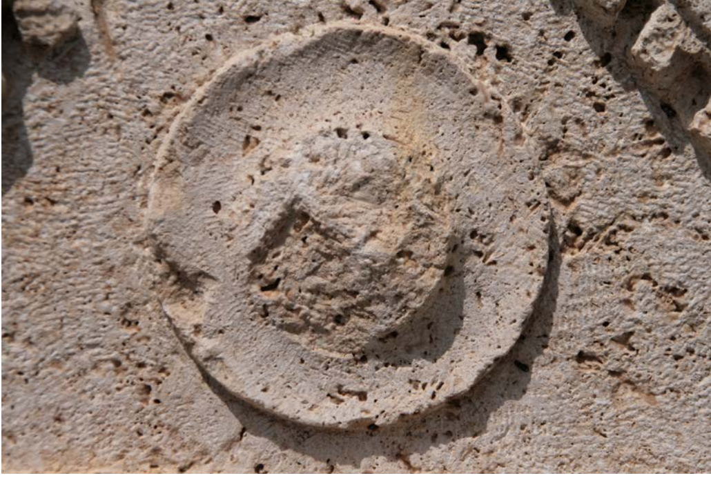
Figür 3: Stelin Alınlık Kısımındaki Kalkan Kabartması (Detay)