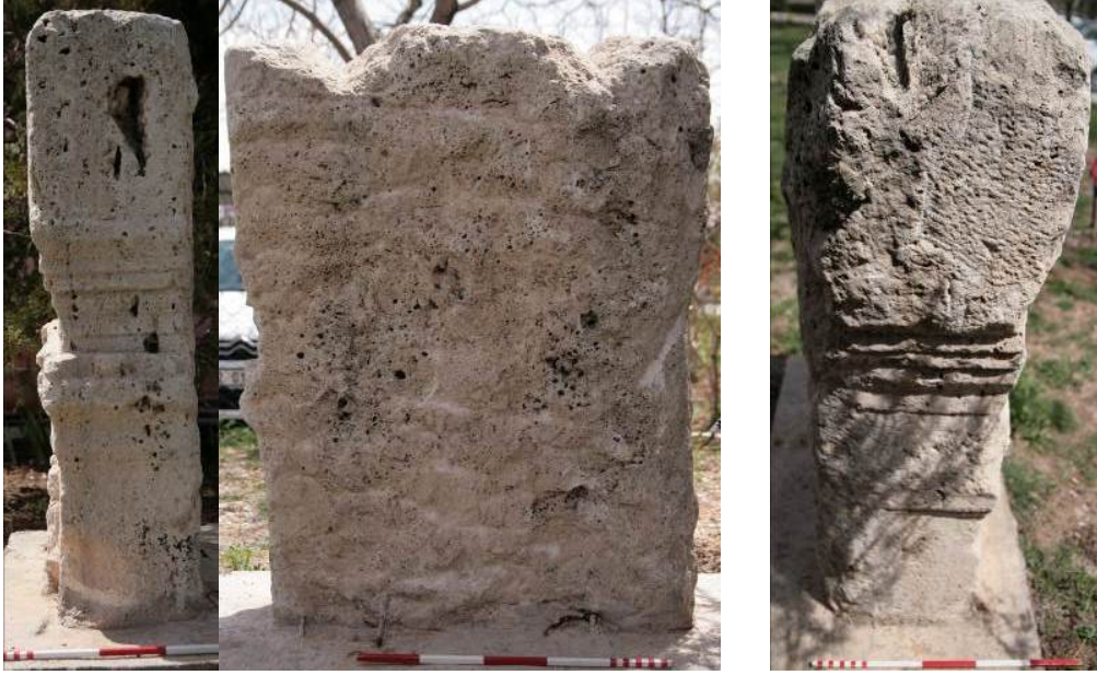
Figür 7: Stelin Sağ Kısa, Arka ve Sol Kısa Yüzleri