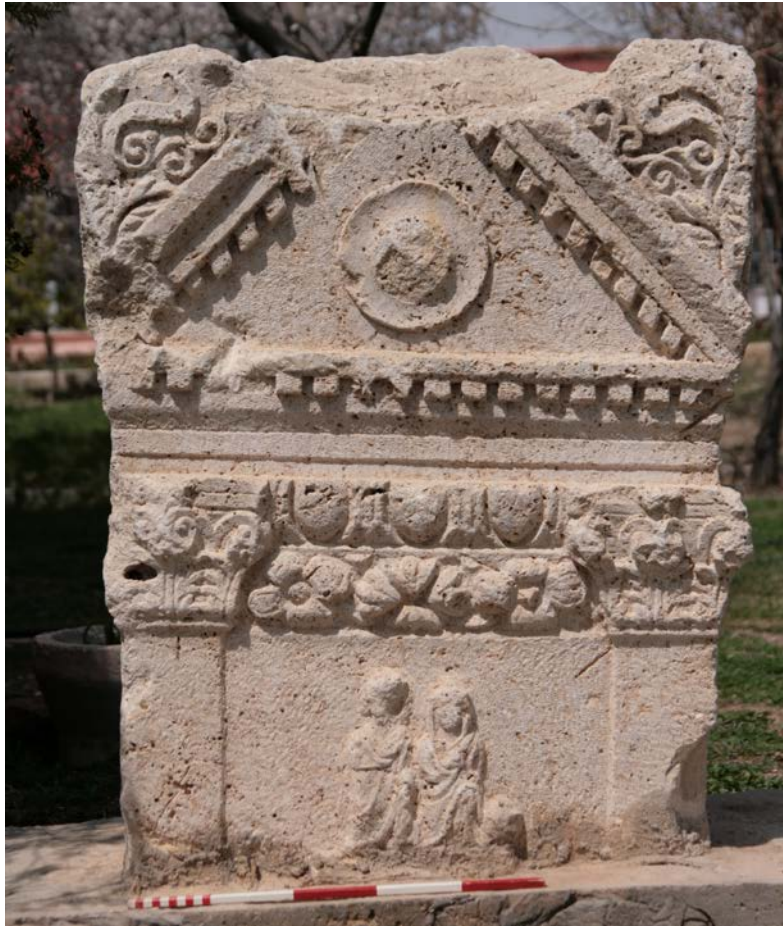
Figür 1: Stel (Genel Görünüm)