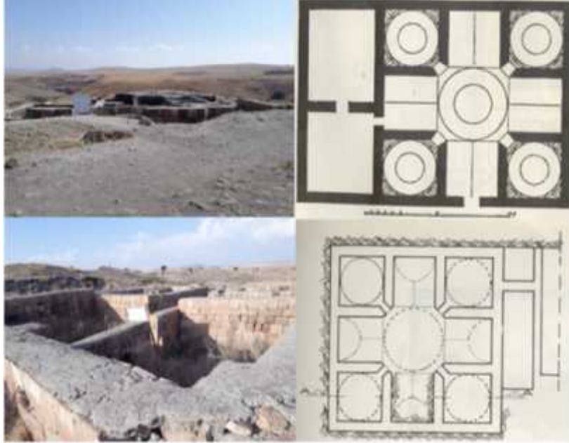
ekil 15: Küçük Hamam ve Büyük Hamam'ın planları ve genel görünüşleri.

Küçük Hamam ise Arpaçay'ın kuzeybatısındadır ve Bey Sekisi Kapısı'nın yüz metre güneyinde yer almaktadır. Selçuklu mimari tarzında yapılan hamamın süslemeleri de dikkat çekmektedir. Yapılan arkeolojik ara tırmalar sonucu yıkanma yerleri, halvet odaları, eyvanlar ortaya çıkarılmıştır. 28