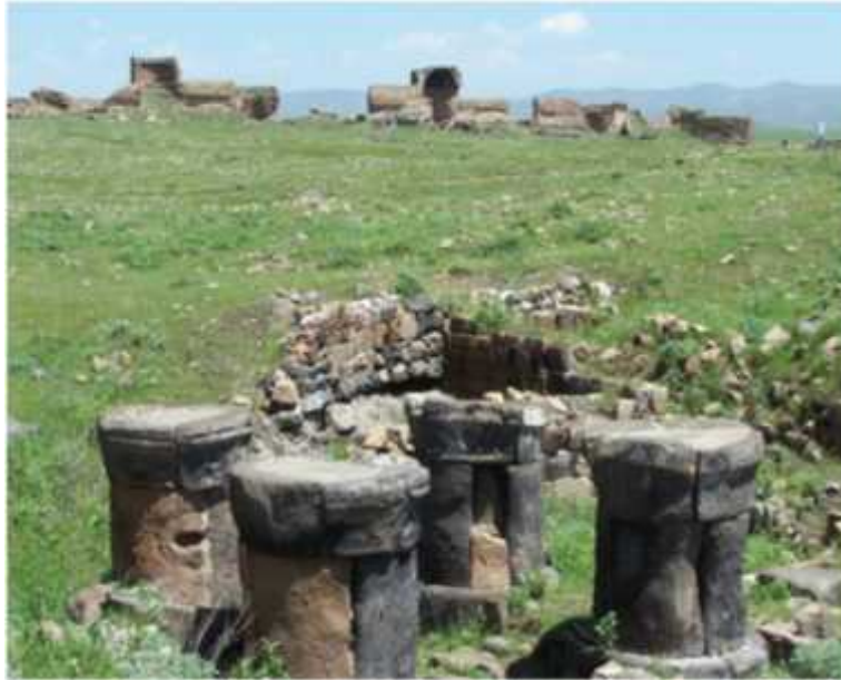
ekil 14: Ate gede Tapına ından bir görünüm.

Ate gede Tapına ı: Yapım tarihi tam olarak bilinmemektedir. I.- IV. yüzyıllar arasında yapıldı ı tahmin edilen tapına ın yapılan ilk hali Zerdü t dinine uygun olarak yapıldı ını dü ündürmektedir. Bu olasılık do ru ise Ani'deki ilk yapı bir Zerdü t tapına ıdır. Yeniden do u u sembolize eden Ate gede tapına ı genellikle dört destekli dairevi planlı bir mekân içerisinde in a edilmi tir. Yapılan kazılarda duvar parçaları bulunmu tur. Bu duvar parçaları ile Zerdü t tapına ının apele dönü türüldü ü görülmektedir. 26 ( ekil 14).