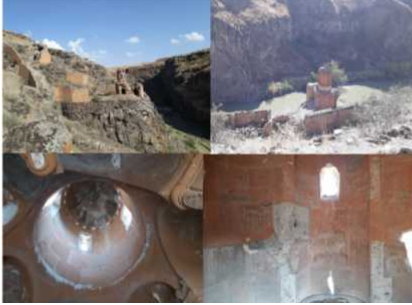
ekil 9: Genç Kızlar Kilisesi dışı ve iç mekânından görünüm.

pek Yolu Köprüsü: pek yolu köprüsü Ören yerinin güneyinde ve Arpaçay nehrinin üzerindedir. 10.yüzyılda yapıldı ı tahmin edilmektedir. Divin Kapısı önünden iki yakayı birle tirmektedir. Kesme ta ile yapılan köprü iki katlı olarak in a edilmi tir. pek yolunun Kafkaslar üzerinden Anadolu'ya giri noktasında in a edilen köprünün ilk katı kervanların geçi i için kullanılmı ken, ikinci katı askerlerin ve yayaların geçi i için kullanılmı tir. Günümüze kadar ise sadece köprünün ayakları ula abilmi tir ve kemeri tamamen yıkılmı tir. 21