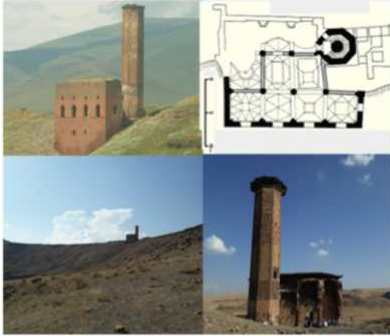
ekil 10: Ebul Manuçehr camii planı, restorayon öncesi ve sonrası görünümler (Foto: A.Avcıo ullarından).