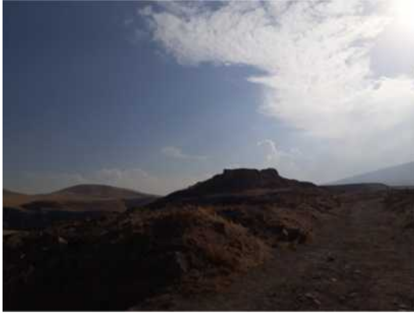
ekil 13:Gün batımında ç Kale'den bir görünüm (Foto: A.Avcıo ullarından).

Ate gede Tapına ı: Yapım tarihi tam olarak bilinmemektedir. I.- IV. yüzyıllar arasında yapıldı ı tahmin edilen tapına ın yapılan ilk hali Zerdü t dinine uygun olarak yapıldı ını dü ündürmektedir. Bu olasılık do ru ise Ani'deki ilk yapı bir Zerdü t tapına ıdır. Yeniden do u u sembolize eden Ate gede tapına ı genellikle dört destekli dairevi planlı bir mekân içerisinde in a edilmi tir. Yapılan kazılarda duvar parçaları bulunmu tur. Bu duvar parçaları ile Zerdü t tapına ının apele dönü türüldü ü görülmektedir. 26 ( ekil 14).