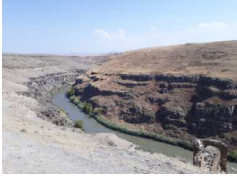
ekil 4: Arpaçay Nehrinden bir görünüm (Foto: A. Avcıo ullaharından).

Sibirya yüksek basınç merkezinin etkisi altında olan Kars ili karasal bir iklime sahiptir. Do u Anadolu'nun en so uk sahasıdır. Kı ları yakla ık olarak yedi ay sürmektedir. Yılın yakla ık elli günü kar ya ılı geçer ve toprak yakla ık yüz gün boyunca karlarla örtülüdür. Yazları ise ılık ve serin geçer. Baharlar ise oldukça kısa sürmektedir. Toplam ortalama ya ı miktarı 252-500mm arasındadır. Çayır ve meraların toplam arazinin %70'ini olu turdu u Kars ilinin %20'si ekili alanlardan, %5'i ise tarıma elveri siz alanlardan olu ur ve orman varlı ı pek yoktur. 11