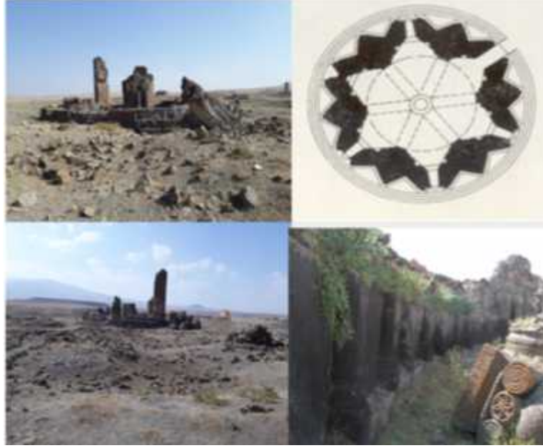
ekil 19: Gagik Kilisesi planı, iç ve dış mekân görünüşleri.

Selçuklu Sarayı: Selçuklu Sarayı ören yerinin kuzeybatısında Bostanlar deresinden yükselen sarp kayalıklar üzerinde iki katlı olarak inşa edilmiştir. Selçuklu dönemine dikdörtgen planlı inşa edilen sarayın en dikkat çekici özelliği, yıldız motifleri ile süslenen giriş kapısıdır. Yapım tarihi kesin olarak bilinmeyen sarayın, mimari özellikleri ve taç kapının belirlenmesi ile 12.-13. yüzyıllara ait olduğu tahmin edilmektedir. Saray büyük bir salon ve bu salonun etrafına da ılımlı odalardan oluşmaktadır. 35 (ekil 20).