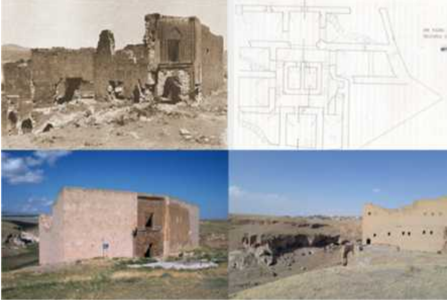
ekil 20: Selçuklu sarayı planı, restorasyon öncesi ve sonrası görünüşler (Foto: A.Avcıo ularından).

Selçuklu Sarayı: Selçuklu Sarayı ören yerinin kuzeybatısında Bostanlar deresinden yükselen sarp kayalıklar üzerinde iki katlı olarak inşa edilmiştir. Selçuklu dönemine dikdörtgen planlı inşa edilen sarayın en dikkat çekici özelliği, yıldız motifleri ile süslenen giriş kapısıdır. Yapım tarihi kesin olarak bilinmeyen sarayın, mimari özellikleri ve taç kapının belirlenmesi ile 12.-13. yüzyıllara ait olduğu tahmin edilmektedir. Saray büyük bir salon ve bu salonun etrafına da ılımlı odalardan oluşmaktadır. 35 (ekil 20).