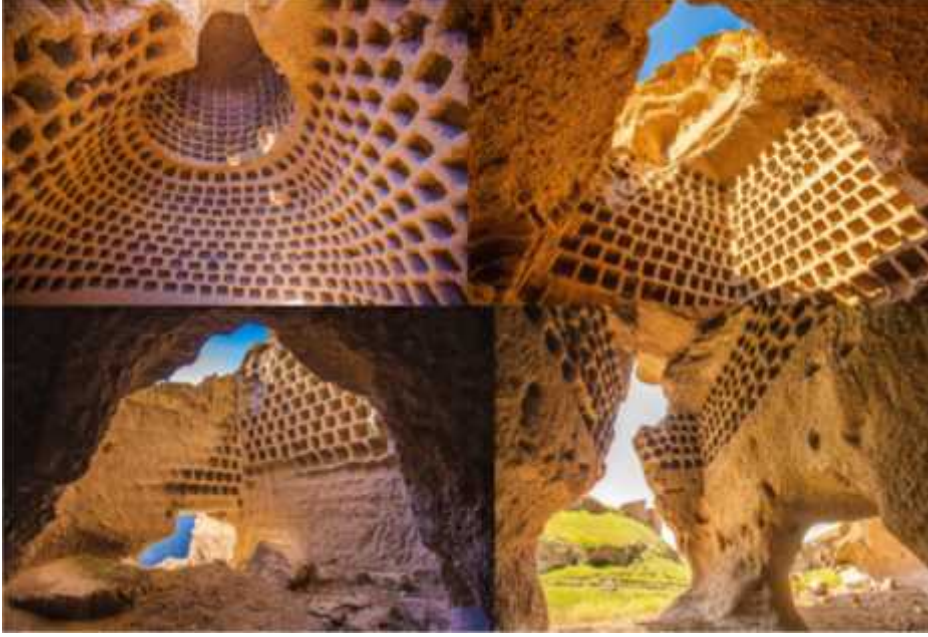
ekil 22: Güvercinliklerden görünüm (Akçayöz, 2016).