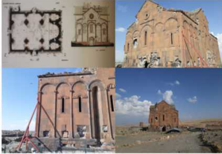
ekil 7: Katedral'in planı ve dışarıdan görünüm (Foto: A.Avcıoğullarından).

yılında ehri ele geçiren Gürcüler bu yapıyı tekrar kiliseye çevirmişlerdir. Kilisenin apsis bölümünde iç mekandaki fresklerin 13. yüzyılda yapıldığı tahmin edilmektedir. Günümüzde kubbe kısmı çöken eser, Ani Ören Yeri'nde günümüze kadar sağlam kalabilen önemli bir yapıdır. 20 ( ekil 8).