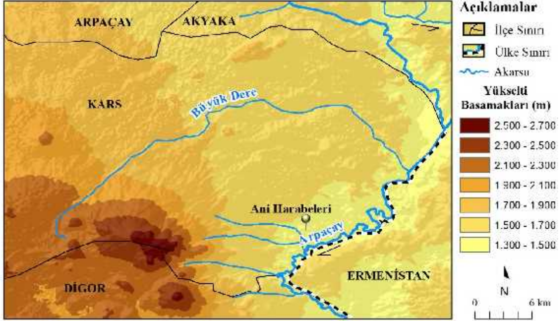
ekil 3: Ani Ören yeri ve çevresinin yükselti basamakları haritası

zemin hazırlayan kültür varlıklarını zenginleştirir. Ayrıca Ani şehrinin bulunduğu yer II. dereceden deprem alanıdır. M.Ö. 550-M.S. 1900 yılları arasında 47 kez deprem olduğu tespit edilmiştir. 1605'te 5.6 büyüklüğünde ve 20 km derinlikte VIII şiddetinde olan deprem sonucunda şehir tamamen terk edilmiştir. Yakın zamanda meydana gelen 1926 (5.7) Kars, 1936 (6.2) Kötek, 1975 (5.1) Susuz, 1983 (6.8) Erzurum-Kars, 1988 (6.9) Akyaka depremleri de Tarihi Ani şehrini etkilemiştir. 9 (ekil 3).