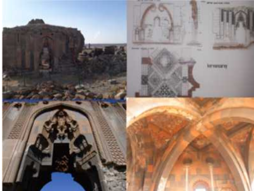
ekil 17: Kervansaray'ın planı, iç ve dı mekân görünümeleri.

Selçuklu Kervansarayı: Kervansaraylar genelde develerin gidebilece i mesafe dikkate alınarak in a edilen Selçuklu dönemine ait ticari yapılardır. Ani Ören Yeri'nin merkezinde yer alan kervansaray ise Selçuklu mimarisini yansıtan özellikleri ve 10.yüzyılda in a edilen Arekletos Kilisesi ile birle tirilerek in a edilmi dokusuyla önemli bir kültürel mirastır. Özellikle giri kapısında yer alan süslemeler oldukça dikkat çekmektedir ( ekil 17). Kervansarayların özellikleri dikkate alındı ında büyük bir olasılıkla Ören Yeri'nin 30-40 km kadar do usunda ve batısında da kervansaraylar in a edilmi olabilir. Çünkü bu mesafe günlük bir devenin yürüyebilece i mesafeye denk gelmektedir. 30