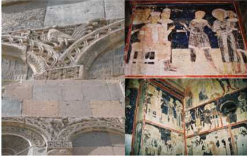
ekil 6: Tigran Honenst Kilisesi süslemeleri (Foto: A. Avcıo ullarından).

Katedral (Fethiye) Camii: Katedral (Fethiye Camii) Ani Ören Yeri'nin güneyinde yer almaktadır. n ası Kral Gagik'in e i Katramide tarafından 1001 yılında tamamlanan bu eser, zamanın tanınmı mimarlarından aynı zamanda stanbul'daki Ayasofya'sının da onarımını yapan Trdat tarafından yapılmı tur. Kırmızı tüf ta ından bazilika planlı olarak in a edilen yapıda; yöreye özgü yo unlu u az volkanik kayalar ve farklı renklerdeki ta lar temeli olu turmu tur. Zemini sa lam bir kaya üzerine oturtulmu tur. Batıda halk kapısı, kuzeyde patrik kapısı ve güneyde kral kapısı ekinde üç giri kapısı vardır. Dar pencerelerle süslenmi tir. 18 ( ekil 7).