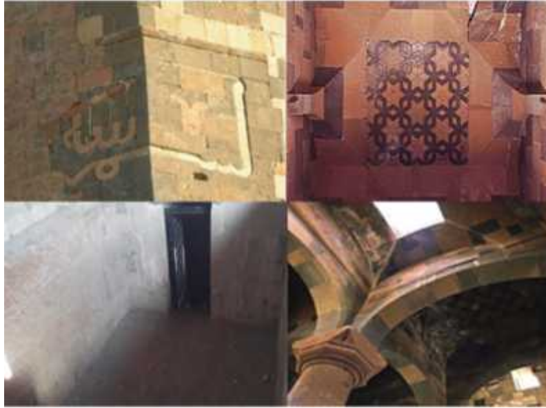
ekil 11: Ebul Manuçehr camii minaresinde yer alan kufi yazı ve iç mekan görünümleri (Foto: A.Avcıo ullarından).

Kız Kalesi ve Rahibeler Manastırı: Kız kalesi ve Rahibeler manastırı, Ören yerinin güneyinin en uç noktasında Arpaçay nehrinin gömük menderes olu turarak aktı ı vadi üzerinde ula ılması çok zor bir konumda bazilikal planlı olarak in a edilmi çok özel bir yapıdır ( ekil 12). Surlardan buraya ula mak yakla ık bir saattir. Bu yüzden me akkatli bir yolu vardır. Kim tarafından ve ne zaman yapıldı ı bilinmemektedir. yi korunmu bir yapıdır ve muhtemelen de en son terk edilen yerlerdendir. Bunun sebebi ise ev temelleri en son terk edilen yer oldu unu göstermektedir. 13. yüzyıla ait bir kilise bulunmaktadır. 24