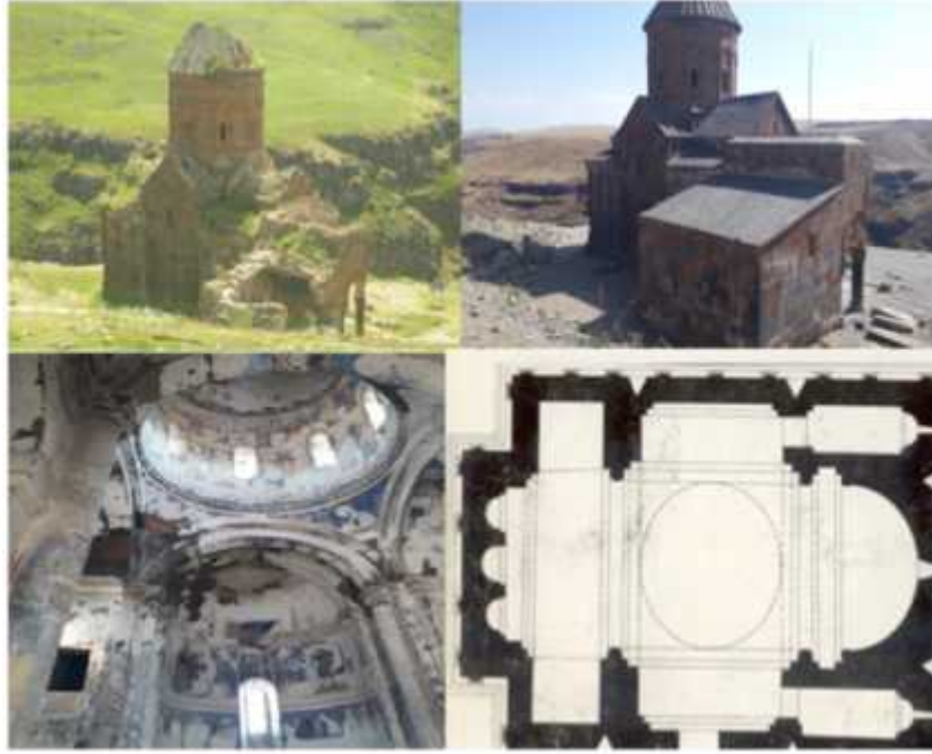
ekil 5: Tigran Honenst Kilisesi ve planı.