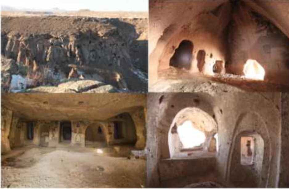
ekil 21: Manaralardan görünüm (Akçayöz, 2016).

Manaralar hakkında ilk çalışmaları 20. yüzyılın başlarında önce Orbeli daha sonra D.A. Kipidze gerçekleştirmiştir. Kipidze'nin ani vefatı nedeniyle yarım kalan yayın çalışmasını 1972 yılında N.M.Tokarski tamamlamış ve 2000'li yıllarda R.Bixio ve ekibi tarafından kapsamlı araştırmalar yürütülmüştür. Tokarski yaptığı araştırmalarda Ani ve çevresinde 832 adet manara kompleksine ulaşmıştır ancak manaralar tek tek sayılamada bu sayının 1500'ü bulacağını belirtmiştir. 37