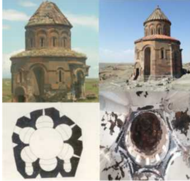
ekil 18: Abughamrents Kilisesi planı restorasyon öncesi ve sonrası ile iç kubbeden görünüm (Foto: A.Avcio ullarından).

Dı tan düzgün olmayan on iki kenarlı bir plana sahip olan yapı, içten de bir orta alanın çevresinde her biri yuvarlak, altı apsis ni i ile biçimlendirilmi tir. Güneybatı cephe ortasındaki giri in üzerinde yuvarlak kemerli bir alınlık vardır. Alınlı ın üzerinde bütün yapıyı dolanan yarım yuvarlak görünü lü silmeler yer alır. 32 Günümüzde restore edilmi tir.