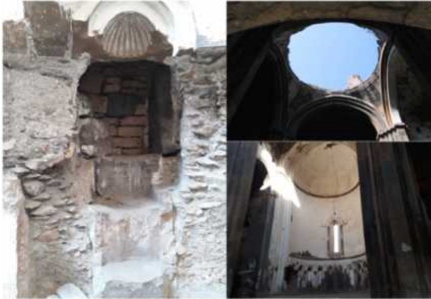
ekil 8: Katedral'in iç mekânından görünüm (Foto: A.Avcıoğullarından).

Genç Kızlar Kilisesi: Genç kızlar Kilisesi Türkiye-Ermenistan sınırını ayıran Arpaçay nehrinin batı yanında Ören yerinin en uç noktasında yer almaktadır. Etrafı sur duvarları ile çevrili kilise silindirik planda kervan yolunun başlangıç noktasında inşa edilmiştir. Kervan yoluna başlangıçta bir galeri ile sağlanmıştır. Günümüzde galerinin önemli bir kısmı yıkılmıştır. Kubbesi çadır şeklindedir. Yapı malzemesi tuftür. 13.yüzyılın karakteristik özelliğini taşımaktadır (Türkiye Turizm Portalı) ( ekil 9).