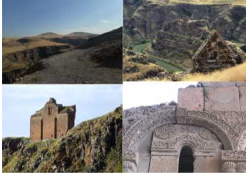
ekil 12: Kız Kalesi ve Rahibeler Manastırından görünüm (Foto: A.Avcıo ullanından).

ç Kale : ç Kale Ören yerinin güneybatısında masa görünümlü bir saha üzerinde yer almaktadır. Günümüzde üzerinde çe itli yapı kalıntıları bulunan ç Kale, Karsaklar tarafından yapılmı tır. ç Kale savunmaya uygun bir arazi üzerinde kuruldu undan Ani antik kentine göre ula ılması çok zor bir konumdadır. Kırzıo lu'nun ehri ilk yerle im çekirde i olarak tanıttı ı Kamsarakan Kalesi'ne ait harçsız ta lardan in a edilmi hisarlara ait temeller, 1904 yılında yapılan kazılarda ortaya çıkarılmı tır. Topografik yapısı ve etrafını çevreleyen surlarının ehre kattı ı peyzaj de erinin yanı sıra ç Kale'nin içinde barındırdı ı yapılarda önemlidir. Kaleden günümüze dı cephe surlarının bir bölümü, kale burcu, iki tapınak kalıntısı ve bir saray kalıntısı ula abilmı tir. Saray kompleksi, az sayıda günümüze ula abilen saray yapılarının nasıl programlandı ının, hangi yapılardan olu tu unun anla ılması bakımından önemlidir. Ayrıca ilk Hıristiyan yapısı da Saray Kilisesi'dir. ç Kale'deki surlar ile sur içerisindeki yapı kalıntıları mimari açıdan antik kentteki mevcut yapıların öncüsüdür. Surların bir kısmı Kamsaragan Dönemine aittir. Geçmi dönemlerde surların yapılması ehri o zamanlardaki önemine de ba ka bir örnektir. ç Kale'ye Ebu'l Manuçehr Camisinin önünden geçen yolun güney batıya uzanan tarafında patika bir yol ile bu yapıya ula ılmaktadır. 25 ( ekil 13).