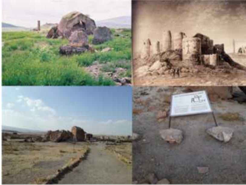
ekil 16: Ebül Muammeran Cami'nin yıkık minaresi, tabelası ve gravürü (Texier, 1842)'den görünümeler.

Selçuklu Kervansarayı: Kervansaraylar genelde develerin gidebilece i mesafe dikkate alınarak in a edilen Selçuklu dönemine ait ticari yapılardır. Ani Ören Yeri'nin merkezinde yer alan kervansaray ise Selçuklu mimarisini yansıtan özellikleri ve 10.yüzyılda in a edilen Arekletos Kilisesi ile birle tirilerek in a edilmi dokusuyla önemli bir kültürel mirastır. Özellikle giri kapısında yer alan süslemeler oldukça dikkat çekmektedir ( ekil 17). Kervansarayların özellikleri dikkate alındı ında büyük bir olasılıkla Ören Yeri'nin 30-40 km kadar do usunda ve batısında da kervansaraylar in a edilmi olabilir. Çünkü bu mesafe günlük bir devenin yürüyebilece i mesafeye denk gelmektedir. 30