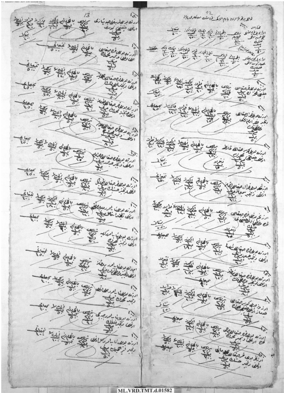
Ek 2. 1582 numaralı Bergama Temettuat Defteri (ML.VRD.TMT.d.01582.00006)