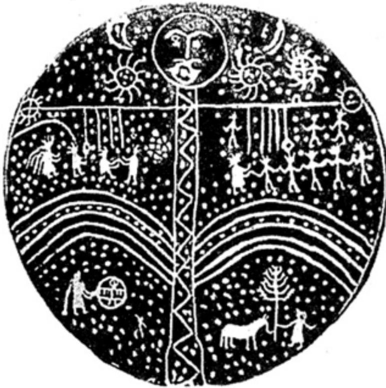
Resim 9: Altay Şaman Davulu (Bayat, 2006, s. 206).

Davulların üzerinde, şamanların savaşçılıklarını tanımlayan emareler bulunabilir. Bir takım şaman davullarında onların savaşçı niteliklerini gösterebilecek ok, yay ve silahlanmış karakterler görülebilir. Bunu destekleyen ifadeyi Bayat şöyle açıklamaktadır; “Şamanlar yanlarında taşıdıkları yay okla beraber davullarına da yay ok çizmekle toplumun savaşçısı olduğunu kanıtlamış olur” (Bayat, 2006, s. 167). Bu ifade davulun müzikal ve ritüel kullanımlarından daha fazlası olduğunu, şamanın kimliğinin çizimler aracılığıyla tanımlandığını göstermektedir.