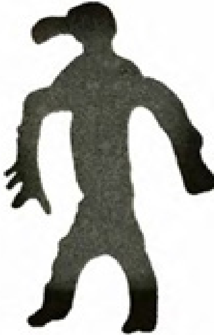
Resim 5: Şaman Simgesi, Kartal Başlı İnsan Bedeni (Hoppal, 2015, s.58).

Bir diğer çeşit davul betimlemesinde ise şamanlar; davullar, hayvan biçimli yardımcı ruhlar ve insanlar bir arada olacak biçimde simgeleştirilmiştir. En çok dikkat çeken sembollerden biri de kartal insan karışımı figürdür. Bu figür için Hoppal şu açıklamayı yapmıştır; “Kartalın şamanların atası ve koruyucusu olduğuna inanılır, şaman giysilerinin kollarına kartal kanatları iliştilir, başlığı da kartal kafası ile süslenirdi. Davullarıyla birlikte tasvir edilen diğer şaman imgeleri ise oldukça gerçekçidir.” (Hoppal, 2015, s.60). Davula işlenen bu figür, ruhlarla kurulan iletişimde kartalın ne kadar önemli olduğunu göstermektedir (Resim 5).