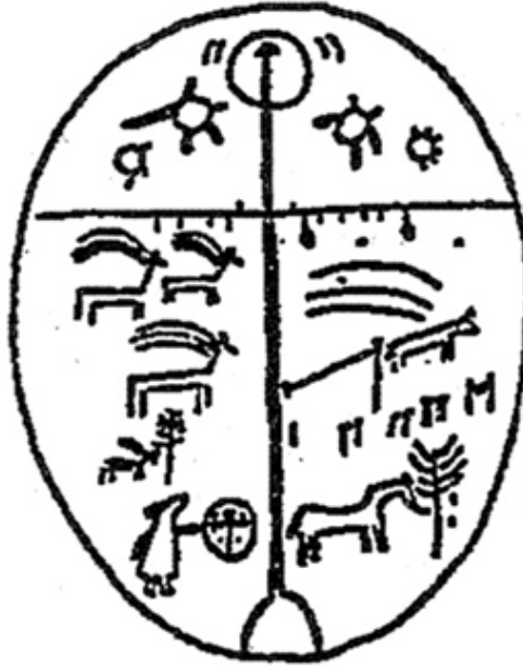
Resim 4: Şaman Davulu Figürleri (Bayat, 2006, s. 197).