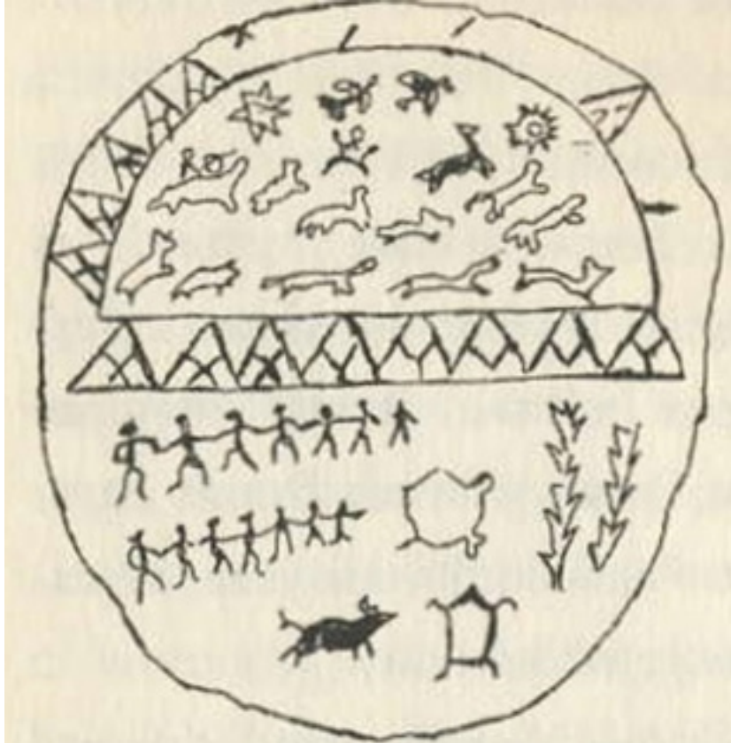
Resim 9: Minusink Bölgesinden Bir Şaman Davulunun Ön Tarafı (Çoruhlu, 2002, s. 84).

Görseldeki davulda (Resim 9), davulun yukarı kısmı göğü ifade etmektedir ve aşağı kısımdan bir şeritle ayrılarak üçgen çizimleriyle tamamlanmıştır. Burada çizilen üçgenlerin yerdeki kutsal dağları temsil ettiği düşünülebilir ve bir eğri şeklinde davulu boydan boya geçer. Bazı şaman topluluklarında dağlara tanrısal vasıflar yüklenmiş ve kutsal ruhları olduğu düşünülmüştür. Çoruhlu'nun tanımlamasında davul hakkındaki diğer detaylar şu şekilde verilmiştir; “Burada görülen atlar ve kuşlar şamanın elçileridir. Üst kısımda yer alan kafesler, gök varlıklarının muhafızı olan, kuş şeklindeki ruhları yakalamak için şamanlar tarafından kullanılır. Davulun yüzeyinin sağ yanı boyunca, Dünya Ağacını simgeleyen tasvirler bulunur.” (Çoruhlu, 2002, s. 84). Göğü temsil eden üst kısımda ay, güneş ve bir takımyıldızlar birlikte sembolize edilmiştir.