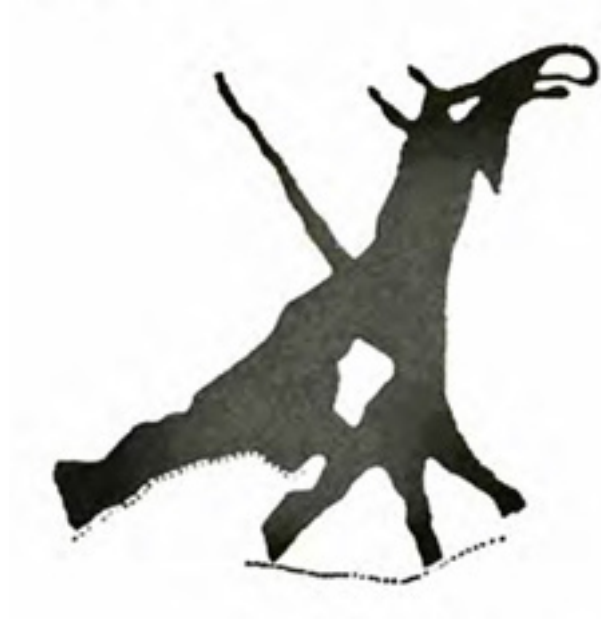
Resim 6: Av Büyüsü (Hoppal, 2015, s.78).