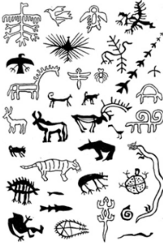
Resim 3: Şaman Davulunun Üst Bölümündeki Bazı Şekil ve Semboller (Bayat, 2006, s. 160).

küçük daire, fecirle şafağı temsil eder. Bunların arasındaki noktalar yıldızları gösterir. Ayrıca Ülgen'in kızlarını tasvir eden resimler ile kuş, geyik, ağaç vs. şekiller de vardır (Radlof, 2008, s. 129).