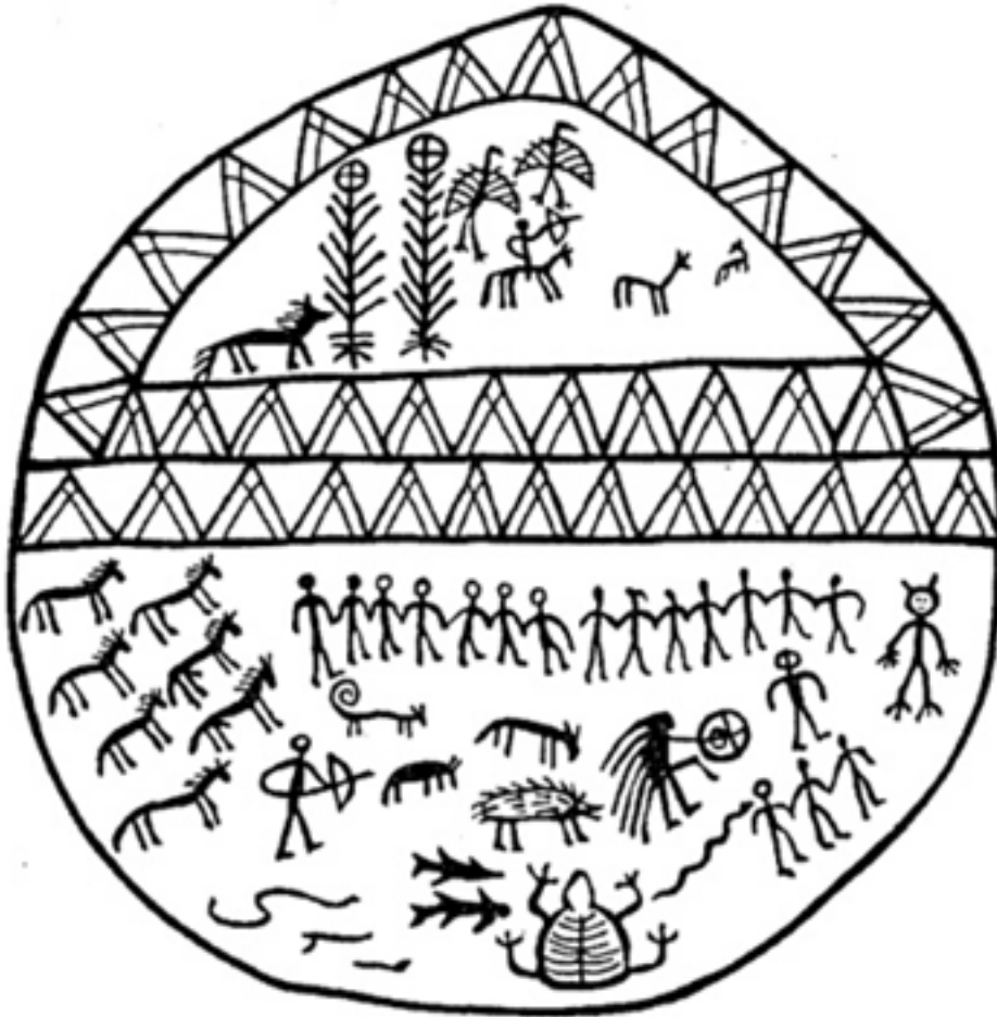
Resim 8: Koçin Şaman Davulu (Bayat, 2006, s. 207).

Resim 8'de görüldüğü gibi, Orta Asya Şamanist felsefeyi benimsemiş topluluklarda çoğunlukla davul biçimsel olarak merkezden çizilen çizgilerle ikiye bölünür (Resim 8). Bölüntülerden biri yer altı diğeryse gökyüzü âlemini yansıtmaktadır. Bölüntülenen bu çizimlerin, Şamanizm felsefesindeki evreni temsil ettiği düşünülebilir.