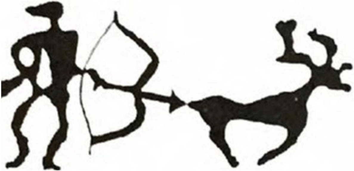
Resim 7: Av Sahnesi (Hoppal, 2015, s.104).

Av sahneleri ve hayvan-insan karışımı ruhani varlıkların dışında, şaman davullarında gökyüzü sahnelerinin çokça işlendiği görülebilir (Resim 7). Bunun birincil sebebi, şamanların gök inancı ve göğe verdikleri kutsallıktır. Bir şaman davulu üzerine yıldızların sembolleri işlenmiş ve bu sembollerin işlendiği davulu kullanan şamanın, yıldızların yaydığı ışık aracılığıyla yollarını aydınlattıklarına inanmışlardır. Bu inanişe Roux farklı bir yorum getirerek şu ifadeyi kullanmıştır; “Belki de, bunlar ölünün karanlık dünyasına (eğer öte dünya, karanlık bir dünya sayılır ise) girmesi anında, ışıktan oluşan varlığı hatırlatmak istemektedirler.” (Roux, 1994, s. 105). Her ne amaçla kullanılıyor olsa da, gökyüzü için kullanılan sembollerin şamanlar için çok önemli olduğu anlaşılabilmektedir.