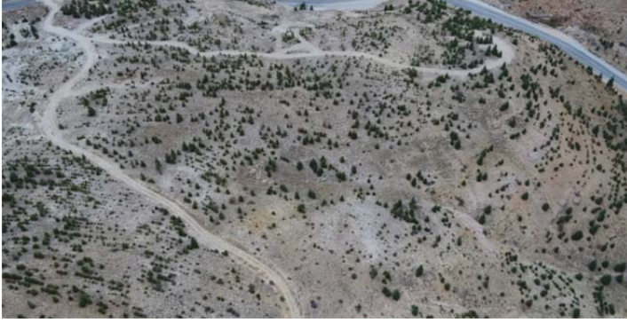
Filobad'ın Hava Fotoğrafi