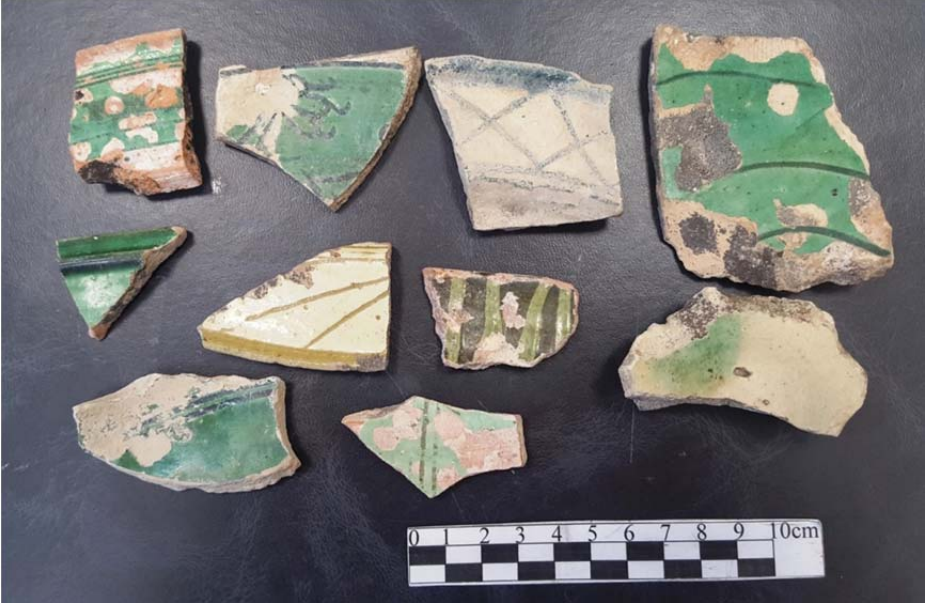
Filobad Seramik Buluntuları