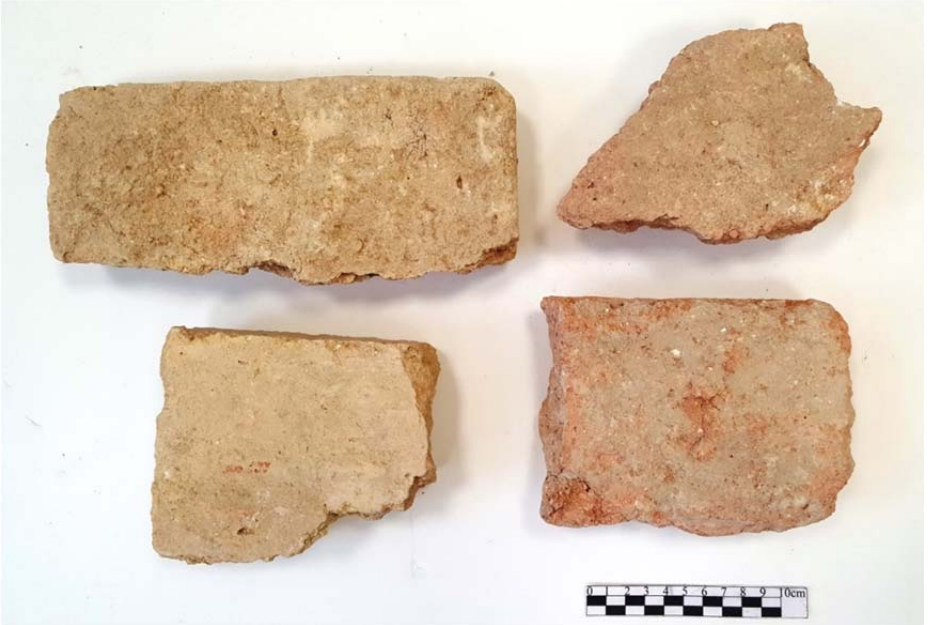
Filobad Tuğla Buluntuları