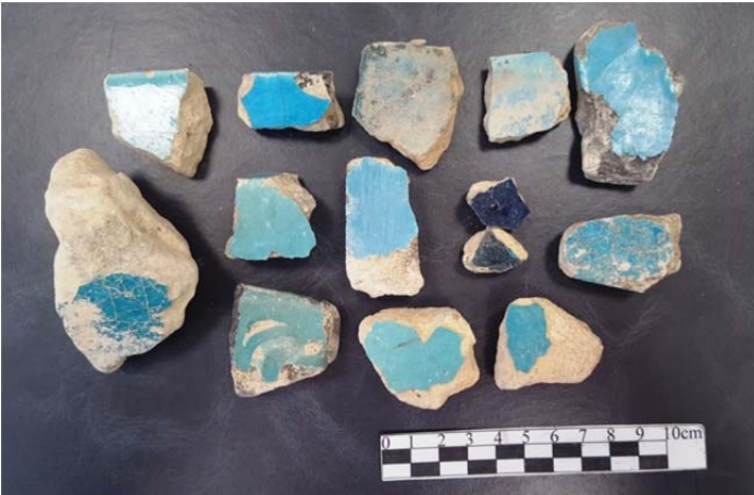
Filobad Çini Buluntuları