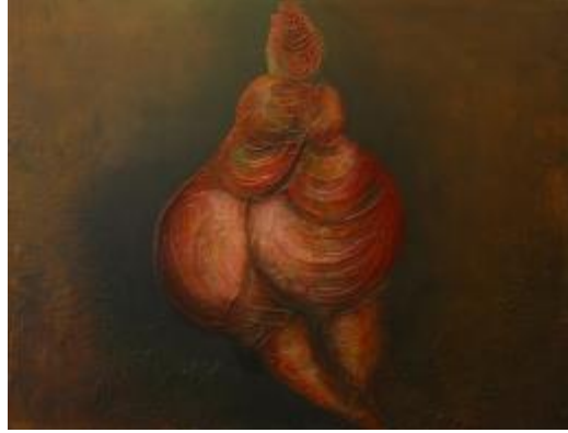
Görsel 12. Metin Erkan Kafkas, “Ana Tanrıçaya Dokunmak”, 2015, Karışık Teknik, 120x100.

uygarlıkların beşiği, Antik Anadolu'nun somut olmayan Tanrı algısını anlama, anlamlandırma, çabasıdır. Ve günümüz için Somut Olmayan bir kültürel miras olarak her şeyden bağımsız zaten yaşamakta olan yaratıcılık, bereket ve analığı kaynaştırmış olan bu mirasın varislerinden biri olduğumu kanıtlama ve hak etme çabasıdır. 8000 yıl öncesinin Tanrı Anasıyla günümüzün Kaman, Koman, Kamana, Komanaları arasındaki binlerce yıllık soyağacını anlama arzudur (Alp, 2011:50).