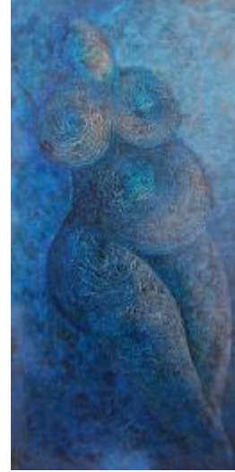
Görsel 11. Metin Erkan Kafkas “Ana Tanrıçaya Dokunmak” 2015, Karışık Teknik, 183x93.

Sayılmazsın” (Borges, 1989:46) yaklaşımıyla düşündüm ki; anlamadığın kavramı resmedemezsin. Benim çabam esas olarak o nesnelere resmetmek değil, o nesnelere arka planını anlama gayretidir. O nedenle ‘Tanrı Ana’yı anlamak istedim. Bu nedenle resimlerim 6000, 7000, 8000 yıl önce yaşamış insanların Tanrıların resimleri değildir. O insanların Tanrı algılarını anlama çabasıdır. (Görsel 10, 11) Antik Anadolu’nun, sözcüğün gerçek anlamıyla