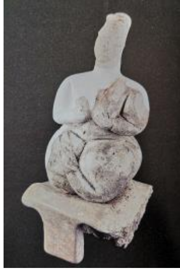
Görsel 7. “Çağlar Boyu Anadolu’da Kadın / Anadolu Kadınının 9000 Yılı” Sergi Kataloğu.