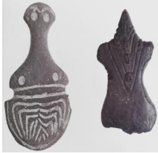
Görsel 9. Çağlar Boyu Anadolu’da Kadın / Anadolu Kadınının 9000 Yılı” Sergi Kataloğu.

Acaba “Tanrı Ana” heykellerini de ilk üretmeye başladıklarında 1/1 ölçeklerine yakın boyutlarda yapmışlar mıydı? Yoksa teknik nedenlerle hep küçük boyutlarda mı üretmişlerdi? Bu küçücük nesnelere nasıl bir ruhani ve düşünsel ilişki kurmuşlardı? Ana ile evrenin yaratıcısı arasında nasıl bir düşünsel bağ kurarak “Tanrı Ana” kavramı ve fikri üretmişlerdi? Yeryüzündeki tüm canlılarda çoğalmanın, var olmanın kadın doğurganlığı ile ilişkisinden dolayı mı Tanrı kavramını Ana kavramıyla ilişkilendirmişlerdi? O nedenle mi yerleşik dönemle birlikte av ve