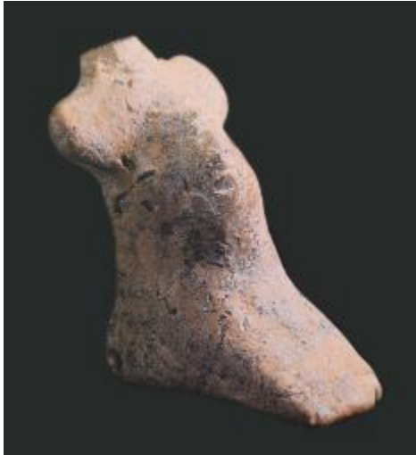
Görsel 2. Çağlar Boyu Anadolu’da Kadın / “Anadolu Kadınının 9000 Yılı” Sergi Kataloğu.

Çok etkileyici hatta sarsıcı diyebileceğim duygu ve düşünceler içindeydim. Zira yüzlerce Ana Tanrıça heykelciği ve idolleri, kimi arkeologlarımızın adlandırmasıyla “Tanrı Ana”, (Akurgal, 1998:5) kimilerinin adlandırmasıyla “Toprak Ana”, “Bereket Ana” (Sevin, 2002:69) heykelcikleri birer birer avuçlarımdan geçmekteydi.