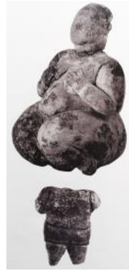
Görsel 5. Çağlar Boyu Anadolu'da Kadın / Anadolu Kadınının 9000 Yılı" Sergi Kataloğu.

İnsanın uygarlık düzeyinden ancak M.Ö. 10.000 – 8.000 yıl önce yerleşik düzene geçmesinden sonra söz edebiliyoruz. Dünyada bu dönemin en ileri düzeyde olan yerleşimleri Çayönü, Catalhöyük, Hacılar, Norşuntepe ve Köşk Höyük yerleşmeleridir (Akurgal, 1998:5). Bu merkezlerde kimi 6000, kimi 7000 – 8000 yıl önce yapılmış kutsiyeti olan, tapınç ya da ibadet nesnesi olarak kullanılmış bu heykelcikleri yapan usta/ustalar neler düşünmüş, neler hissetmişlerdi? Yaptıkları bu kült nesnelere binlerce yıl sonrasının insanların ellerinde olabileceğini tahayyül edebilmişler miydi? Bu eski ustalarla ve toplumlarıyla empati kurmaya çalışıp, onların düşünsel sınırlarını anlamaya gayret ederken bir soru fırtınasına kapılmış olduğumu söylemek abartı olmayacaktır.