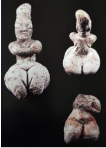
Görsel 8. Çağlar Boyu Anadolu’da Kadın / Anadolu Kadınının 9000 Yılı” Sergi Kataloğu.