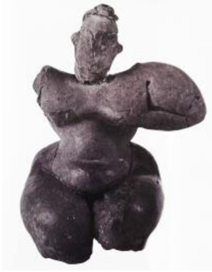
Görsel 6. “Çağlar Boyu Anadolu’da Kadın / Anadolu Kadınının 9000 Yılı” Sergi Kataloğu.