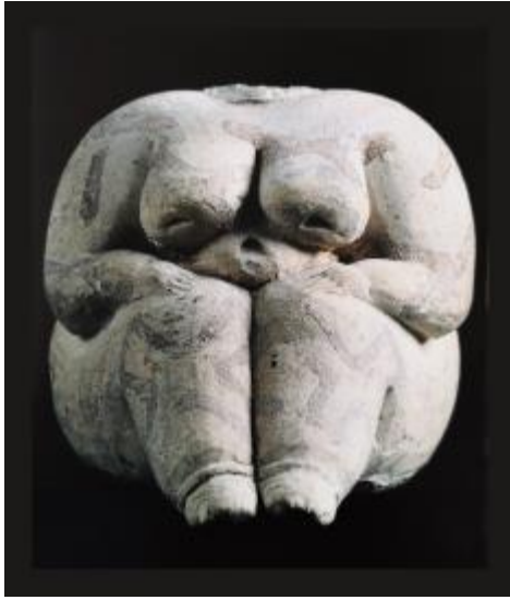
Görsel 4. Çağlar Boyu Anadolu'da Kadın / Anadolu Kadınının 9000 Yılı" Sergi Kataloğu.

İlk bakışta şaşırarak bir şey yokmuş gibi görülebilir. Ne de olsa tutmakta olduğunuz avuç içi kadar pişmiş toprak nesnelere! Sıra dışı denebilecek teknik özellikleri de yoktu üstelik! Oysa yaşadığım pratik bu kadar basit olmadı. Müzelerimize Anadolu'nun antik uygarlık merkezleri olan ve dünyanın ilk büyük yerleşim yerlerinden getirilmiş olan yüzlerce Tanrı Ana'nın kuşatması altındaydım (Görsel 2,3).