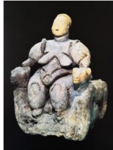
Görsel 3. Çağlar Boyu Anadolu’da Kadın / “Anadolu Kadınının 9000 Yılı” Sergi Kataloğu.