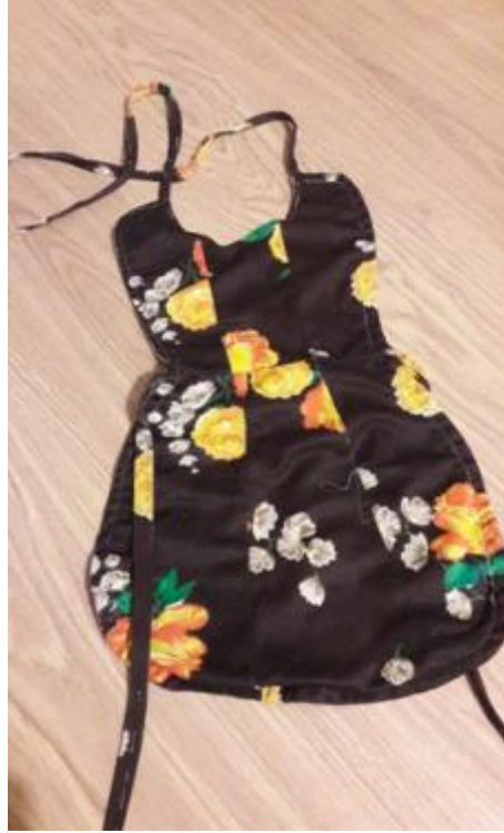
Görsel 24. Oyuncak mutfak önlüğü, 70x35 cm., Artık Kumaş, 2019, Eğirdir, Balkırı Köyü/Isparta.