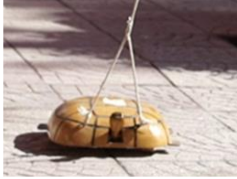
Görsel 17. Oyuncak Kaplumbağa, 25x25x10 cm., Ahşap, İbrahim Gönendi, 2018 Gönen/Isparta.