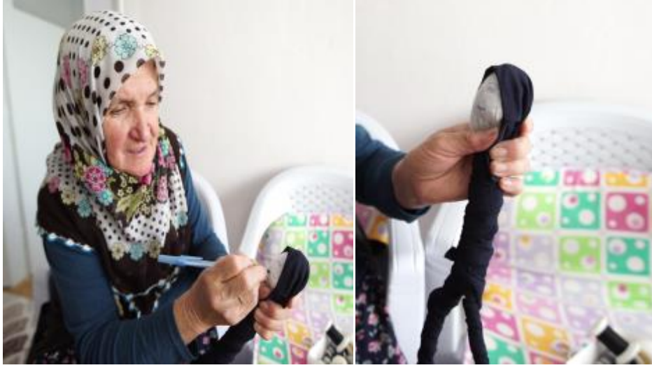
Görsel 2. "Değnek Bebek" yapımı, 2018, Gönen/Isparta.