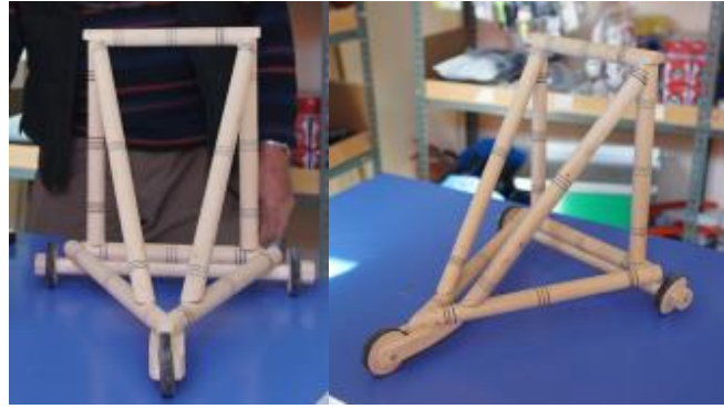
Görsel 11. Yürüteç olarak da kullanılan bir oyuncak araba, 70x60x70 cm., Ahşap, İbrahim Gönendi, 2018, Gönen/Isparta.