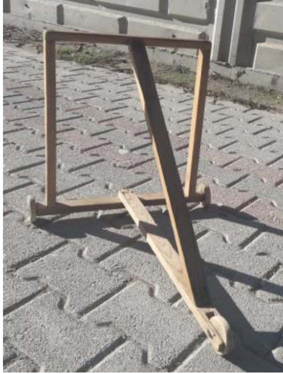
Görsel 26. Yürüteç Araba, 70x65x80 cm., Ahşap, 2019, Eğirdir, Balkırı Köyü/Isparta.