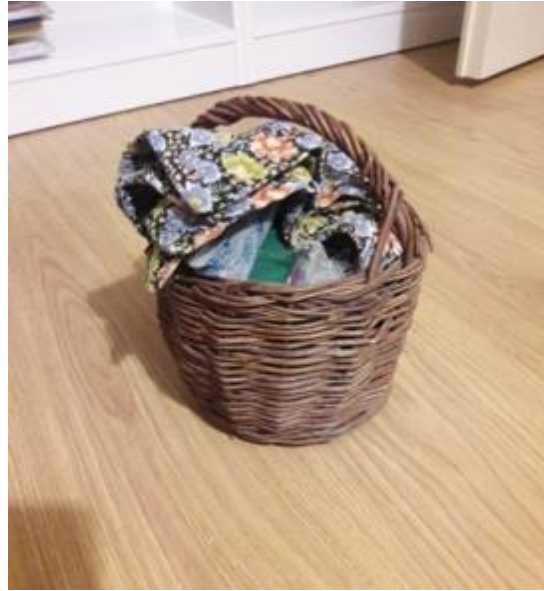
Görsel 23. Oyuncak Sepet 20x20x25 cm., 2019, Kargı, Eğirdir, Balkırı Köyü/Isparta.