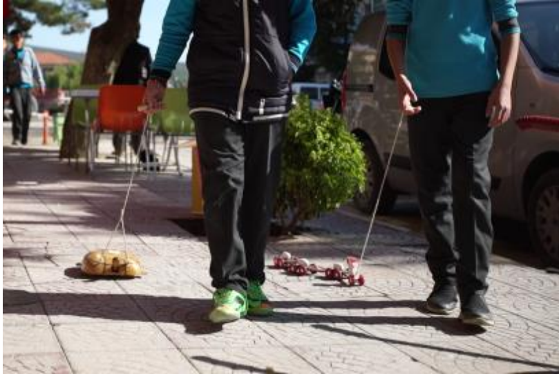
Görsel 16. Oyuncak kaplumbağa ve Oyuncak Ördek, Ahşap ve Su bazlı boya, İbrahim Gönendi, 2018, Gönen/Isparta.