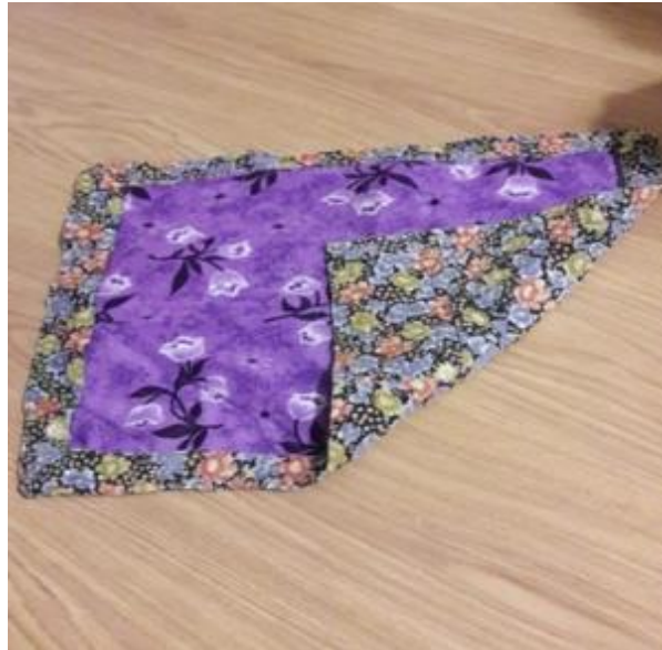
Görsel 25. Oyuncak Yorgan, 40x40 cm., Artık Kumaş, 2019, Eğirdir, Balkırı Köyü/Isparta.