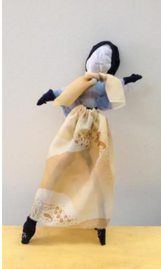
Görsel 5. "Değnek Bebek", 2018, Gönen/Isparta.