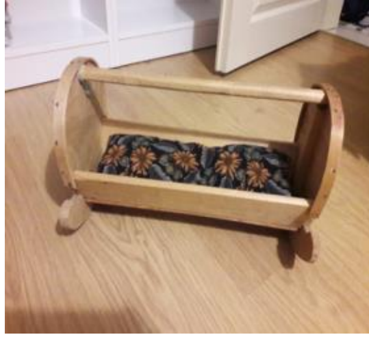
Görsel 22. Oyuncak Beşik,45x25x20 cm., Ahşap, 2019, Eğirdir-Balkırı Köyü/Isparta.