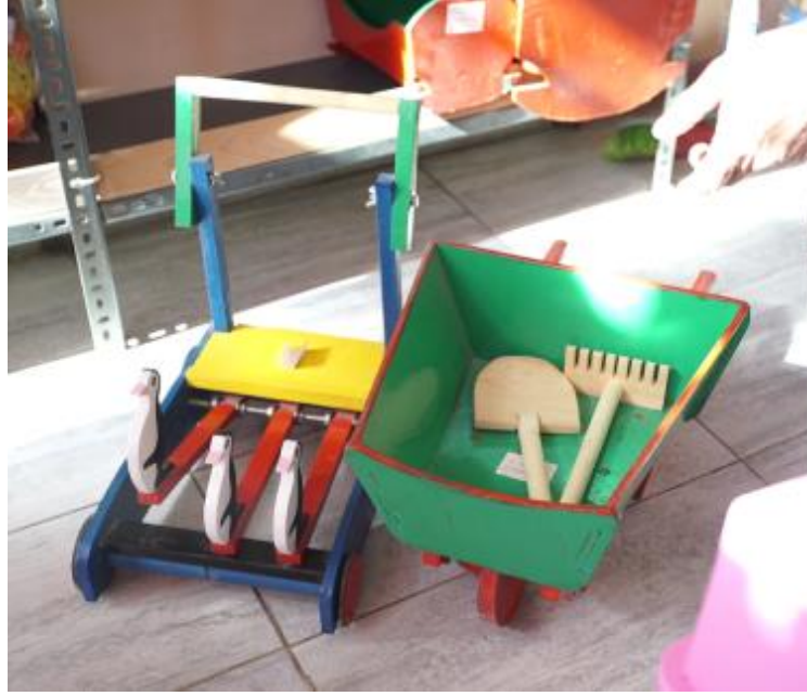
Görsel 15. Oyuncak El Arabası ve Mekanik/ Hareketli Oyuncak, yaklaşık 70x50x40 cm. boyutlarında, Ahşap, Su bazlı boya, İbrahim Gönendi, 2018, Gönen/Isparta.