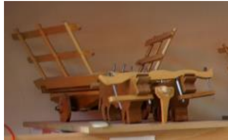
Görsel 12. Oyuncak Kağrı, 35x25x30 cm., Ahşap, İbrahim Gönendi, 2018, Gönen/Isparta.