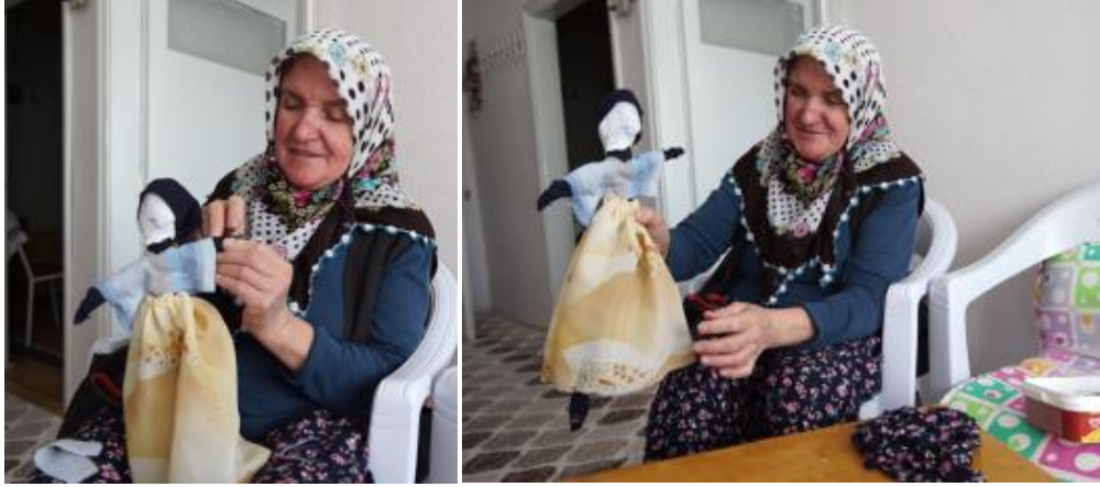
Görsel 4. "Değnek Bebek" yapımı , 2018, Gönen/Isparta.