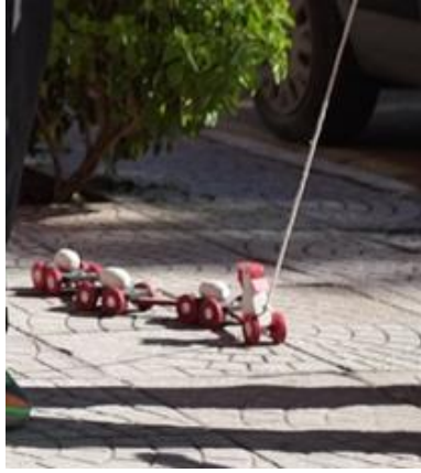
Görsel 18. Oyuncak Ördek, 65x15x10 cm., Ahşap, Su bazlı boya, İbrahim Gönendi, 2018, Gönen/Isparta.