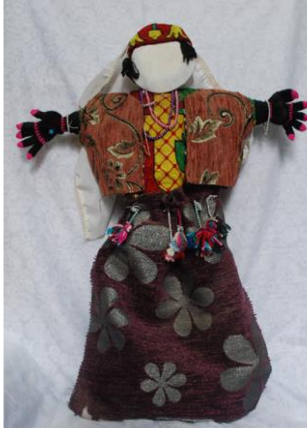
Görsel 6. Yaşar Doğan, oyuncak bebek, 2018, Keçiborlu/Isparta.

Oyuncak bebek yapımı konusundaki başka bir örnek ise Isparta'nın Keçiborlu ilçesinde yaşayan Yaşar Doğan'ın ürettiği oyuncak bebeklerdir. Erkek ve kız oyuncak bebekleri çocukluğundan bu yana yaptığını söyleyen Doğan, bunları artık günümüzde hediye amaçlı ürettiğini dile getirmiştir. Oyuncak bebekleri yaparken işe önce baş, gövde, bacak ve kolları oluşturmak için kuru dalları kumaş parçaları ile birbirine bağlayarak bebeğin iskeletini oluşturmakla başladığını anlatıyor. Sonra da elbiselerini yapmak için artık kumaş parçalarını birbirine ekleyip diktğini söylüyor. Oyuncak bebeğin yüzünü yaparken de düzgün bir yüzey oluşturması için şişe kapaklarından yararlandığını belirtiyor. Bebeğin saçlarını örgü iplerinden, ellerini ise tığ ile ördüğü küçük eldivenlerden oluşturduğunu anlatıyor.