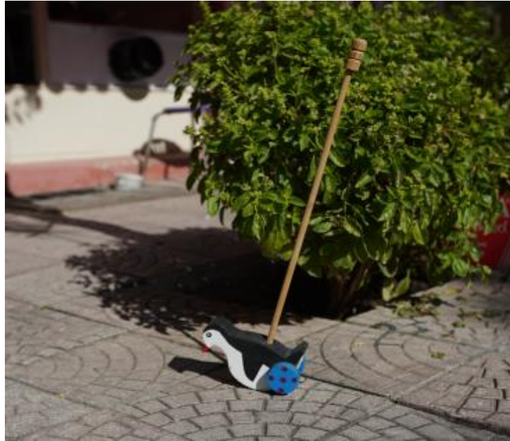
Görsel 14. Oyuncak Penguen, 80x15x10 cm., Ahşap, Su bazlı boya, İbrahim Gönendi, 2018, Gönen/Isparta.