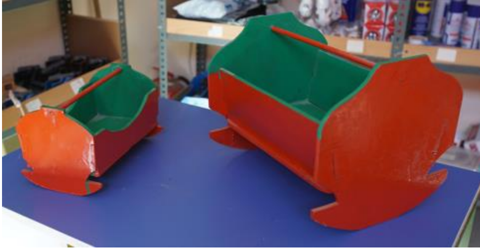
Görsel 13. Oyuncak Beşikler, 30x15x15 cm./40x25x25 cm., Ahşap, Su bazlı boya, İbrahim Gönendi, 2018, Gönen/Isparta.