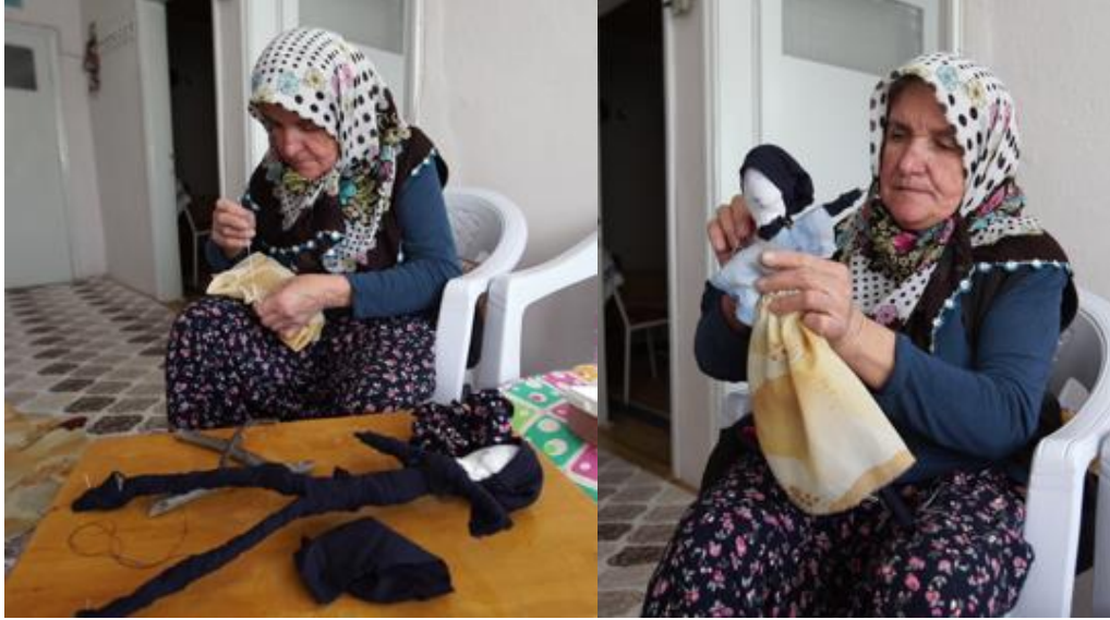
Görsel 3. "Değnek Bebek" yapımı, 2019, Gönen.