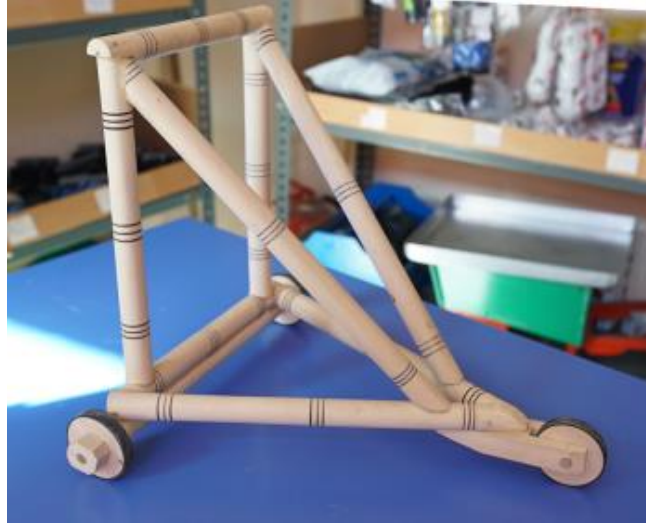
Görsel 10. Yürüteç olarak da kullanılan bir oyuncak araba, 70x60x70 cm., Ahşap, İbrahim Gönendi, 2018, Gönen/Isparta.