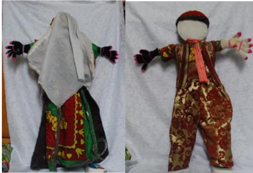
Görsel 7. Yaşar Doğan'ın oyuncak bebekleri, 2018, Isparta/Keçiborlu.