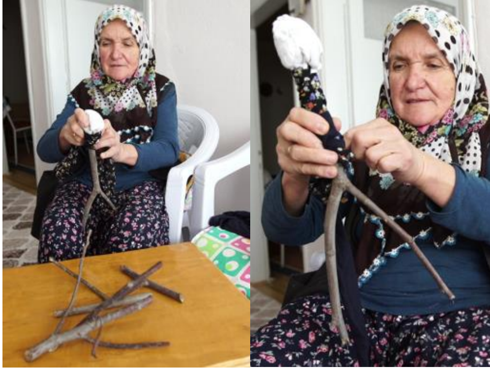
Görsel 1. “Değnek Bebek”, (75 cm., eski kumaşlar ve dal parçaları), 2018, Gönen/İsparta.

Değnek bebeğin kol kısmını yapabilmek için ise ince ve daha kısa bir kuru dal parçası alıp bunu ana gövdeye yine kumaşlar yardımıyla bağladı. Bebeğin üzerine eski parça kumaşlardan yelek ve etek dikerek oyuncak bebeğin yapımını tamamladı.