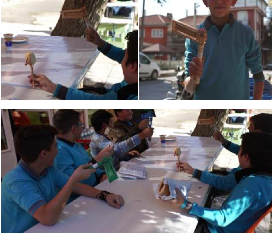
Görsel 20. Bir sap etrafında çevrilen, çevrildikçe takırtılı ses çıkaran çocuk oyuncakları. Çıngırak, Cırcır/Kaynana zırlıtısı (Altta) 2018, Gönen/İsparta.