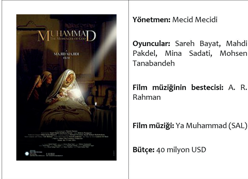
Resim 1. Film Tanıtım Görseli

Yönetmenliğini ve senaristliğini Mecid Mecidi’nin yaptığı Hz. Muhammed: Allah’ın Elçisi filmi; 7. yüzyılda Mekke’de, İslam peygamberi Hz. Muhammed’in çocukluk döneminde etrafında gelişen olayları konu edinmektedir. Filmin ilk gösterimi 12 Şubat 2015’te İran’da gerçekleştirilmiştir.