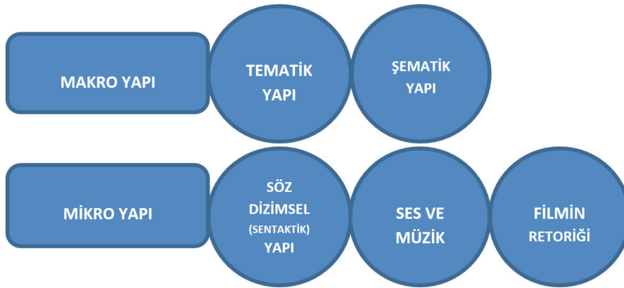
Tablo 1. Van Dijk'ın geliştirdiği söylem çözümlemesinin sinema filmlerine uyarlanması

Tablodan hareketle filmde makro yapı ve mikro yapı birbiri ardınca değerlendirilir. Öncelikle makro yapı içerisinde yer alan tematik yapı incelenir. Burada filmin ana teması, filmdeki konunun yaşandığı zaman dilimi ve coğrafi bölge ele alınır. Daha sonra konunun detayları, olay örgüleri ve karakterler de değerlendirilerek bir bütün içinde filmdeki şematik yapı ortaya çıkarılır. Mikro yapıda ise öncelikle sözdizimsel (sentaktik) yapı çerçevesinde filmin anlatım diline bakılır; filmde üretilen söylem dili, karakterlerin diyalogları ve eylemleri ile çözümlenir. Daha sonra söylemi destekleyici unsurlar olarak ses ve müzik ilişkisi irdelenir. Film boyunca kulla-