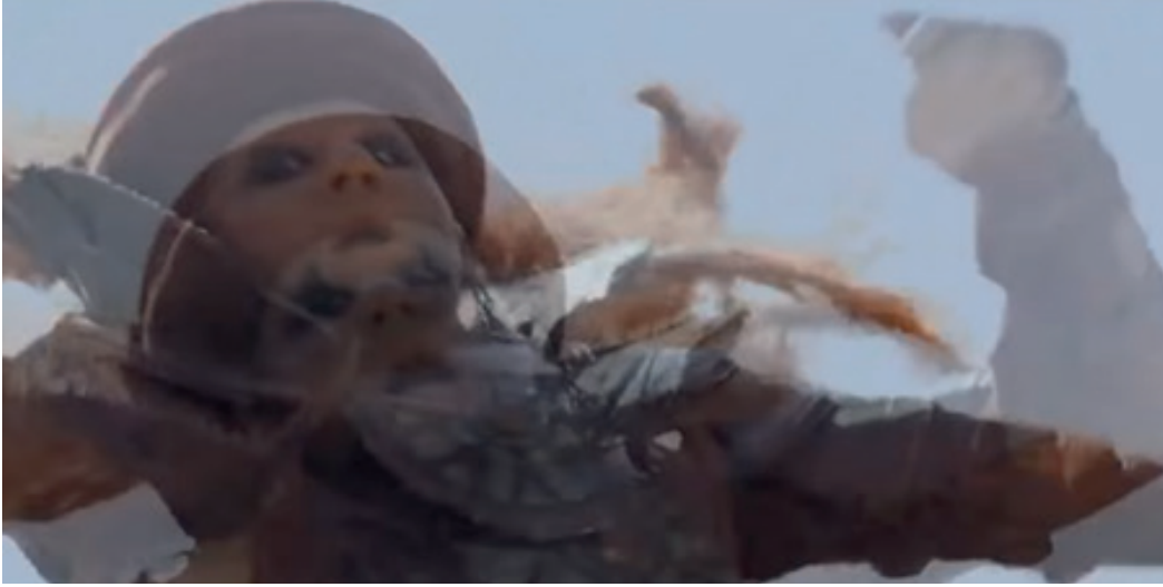
Resim 9. Kabe'yi yıkmaya gelen Ebrehe'nin filin üzerinden düştüğü sahne.

Film boyunca seyircinin ilgisi efekt müzik kullanımlarıyla devamlı canlı tutulmuştur. Ses ve müzik anlamın ve duygunun sağlanmasında söylemin yardımcı olarak kullanılmıştır.