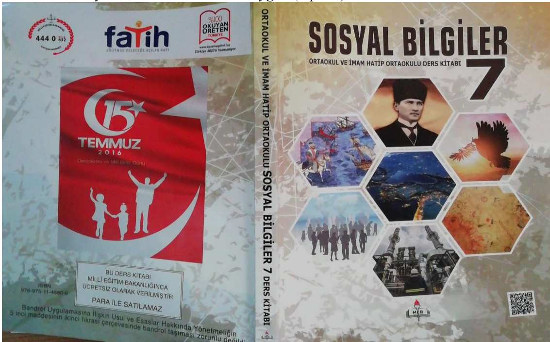
Resim 8: Türkiye ders kitabı 40. madde uygun (2 puan) özellik

Resim 7’de görüldüğü üzere İran sosyal bilgiler ders kitabında ön ve arka kapak bir bütün olarak tasarlanmamıştır.