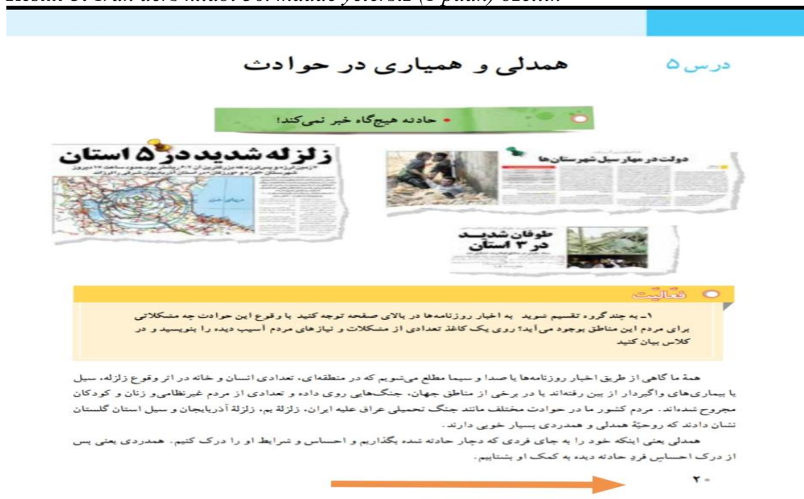
Resim 5: İran ders kitabı 36. madde yetersiz (1 puan) özellik

Tablo 3’te görüldüğü üzere sayfa tasarımında toplam puanda Türkiye ders kitabı en yüksek puanı almıştır. Türkiye ders kitabı “karşılıklı iki sayfanın birlikte düzenlenmesi” maddesinden “yetersiz”, “boşlukların etkili kullanılması” maddesinden yeterli ve geri kalan 6 maddeden “oldukça uygun” değeri almıştır. İran sosyal bilgiler ders kitabı “sayfa numarasının ayrı bir tasarım ögesi olarak düzenlenmesi” ve “karşılıklı iki sayfanın birlikte düzenlenmesi” maddelerinden “yetersiz”, “görsel öğelere yeterince yer verilmesi” ve “görsel öğelerin okuma akışını engellememesi” maddelerinden “uygun” geri kalan 4 maddeden “oldukça uygun” değerini almıştır. “Karşılıklı iki sayfanın birlikte düzenlenmesi” maddesinde her 2 ülke sosyal bilgiler ders kitabı “yetersiz” özellik göstermiştir.