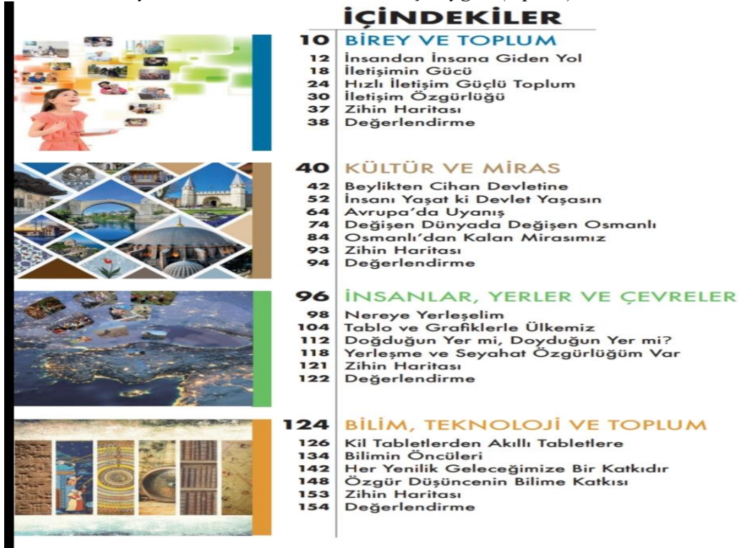
Resim 2: Türkiye ders kitabı 10. madde oldukça uygun (3 puan) özellik

Resim 1'de görüldüğü üzere İran sosyal bilgiler ders kitabında içindekiler listesinin işlevsel biçimde düzenlenmesine dikkat edilmemiştir.