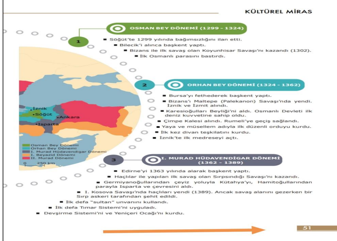
Resim 6: Türkiye ders kitabı 36. madde oldukça uygun (3 puan) özellik

Resim 6'da görüldüğü üzere Türkiye sosyal bilgiler ders kitabında sayfa numarası ayrı bir tasarım ögesi olarak düzenlenmiştir.