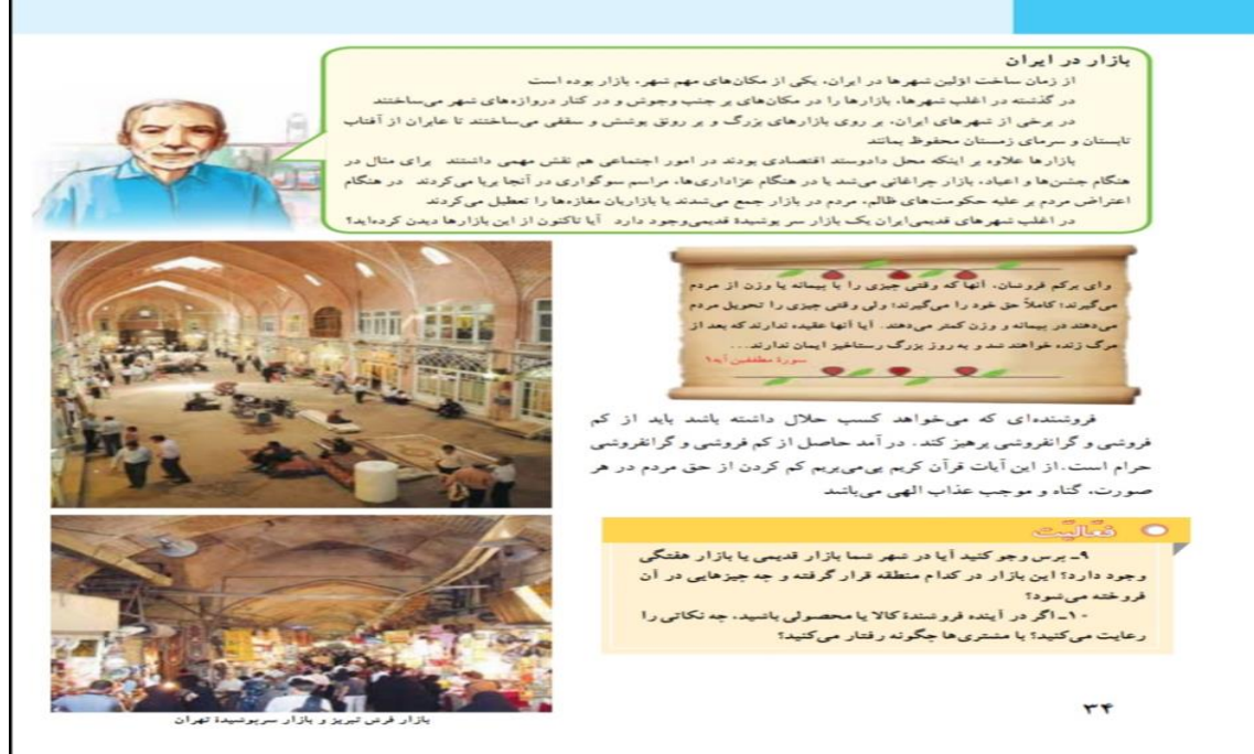
Resim 3: İran ders kitabı 20. madde yetersiz (1 puan) özellik

Resim 3'te görüldüğü üzere İran sosyal bilgiler ders kitabında görsel öğede vurgulamanın etkili kullanımına dikkat edilmemiştir. Kullanılan görsellerde mesaj taşıyan herhangi bir öge ön plana çıkartılmamıştır.