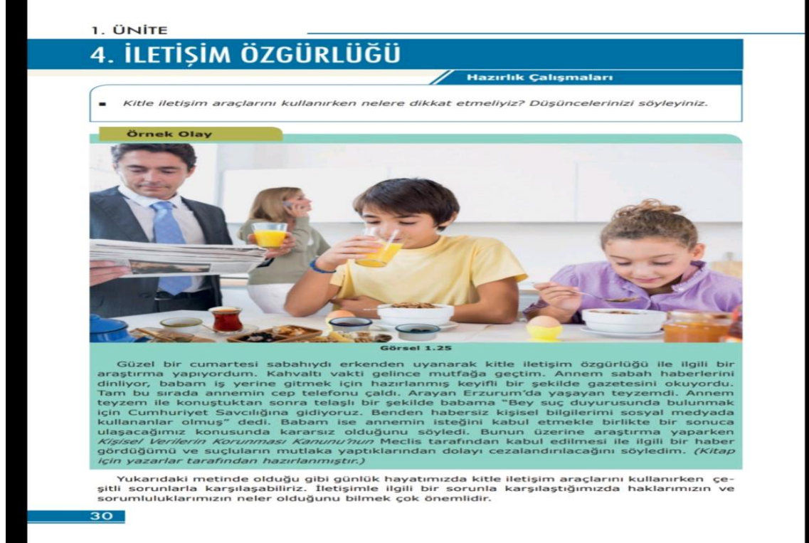
Resim 4: Türkiye ders kitabı 20. madde uygun (2 puan) özellik.

Resim 4'te görüldüğü üzere Türkiye sosyal bilgiler ders kitabında görsel öğede vurgulamanın etkili kullanımına dikkat edilmiştir.