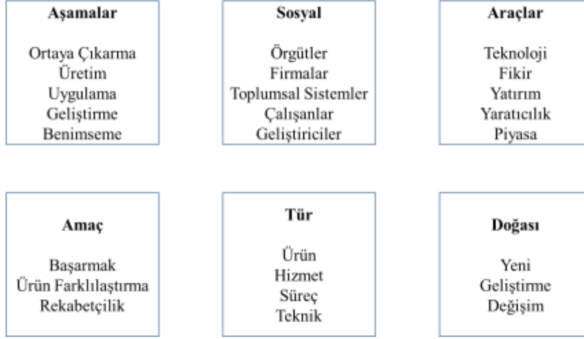
Şekil-1: Yenilikçiliğin Boyutları