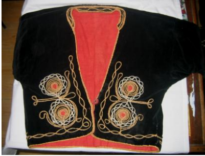
Cepken Ön Görünüm