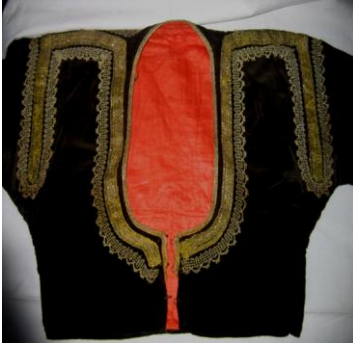
Cıbba Ön ve Arka Görünüm