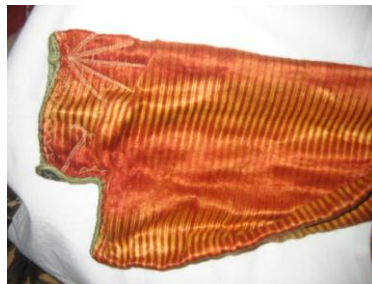
Kol Ağzı Detay Görünüm