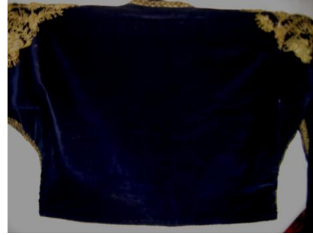
Sarka Arka Görünüm