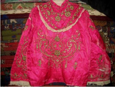
Mıhlama Önden Mıhlama Yaka Görünüm