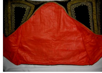
Cıbba İç Görünüm