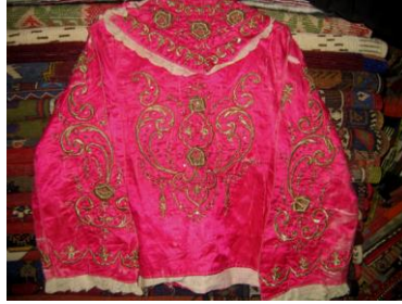
Mıhlama Arka Görünümü