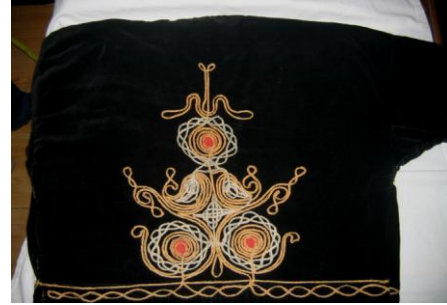
Cepken Arka Görünüm

Konya ilinde bulunan kıyafetlerde saten, kutnu, kadife kumaşı ve kıvratma kumaşlarının kullanıldığı görülmektedir. Yardımcı malzeme olarak; dikiş ipliği, pamuklu astar kullanılmış ve kapamaları agrafla sağlanılmıştır. İncelenen kıyafetlerde süsleme malzemesi olarak; simli ip, dantel, kurdele ve hazır kordonların kullanılmıştır.