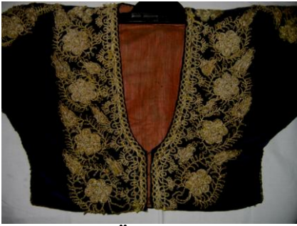
Sarka Ön Görünüm