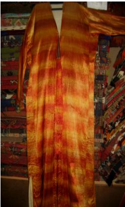
Entari Ön Görünüm