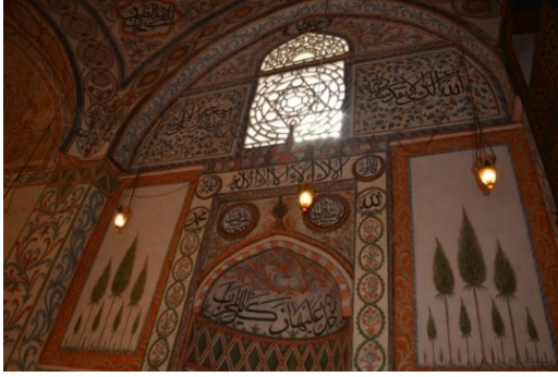
Resim 17. Servi Tasvirleri

Hadım Camisi'ndeki boyalı nakışlar arasında kubbeye yapılmış yıldız tasvirleri vardır (Resim 6). Son bezeme grubu ise ağaç tasvirlerinden oluşur. Çoğunlukla servi ağaçlarından oluşan bu tasvirler son cemaat yerinde, harim duvarlarında, tromplarda ve kubbeye yer almaktadır. Çoğunlukla farklı boydaki ağaçların yan yana uygulandığı bu resimler bir bütün olarak incelendiğinde ayrıntıya girilmemiş doğa resmi şeklinde değerlendirilebilir (Resim 18-19).