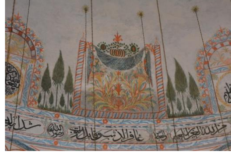
Resim 13. Meyve Düzenlemesi ve Perde Tasviri