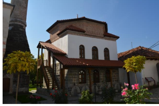
Resim 24. Kütüphane

Hadım Camisi'nde duvar resimlerinin olduğu bir diğer bölüm ise kubbedir. Kubbede birbirinden farklı üç duvar resmi vardır. Bunların ikisi yapı tasviri, biri ise kent tasviridir. Yapı tasvirlerinin ilki, sur içerisinde, üç kubbeli, iki minareli ve dört bölümlü son cemaat yeri olan bir camidir. Minarelerin şerefe sayısı üçtür. Bu durum caminin bir sultan yapısı olduğunu göstermektedir. Yapı tasvirinde çoğunlukla kahverengi, beyaz ve turuncu renkler kullanılmıştır. Ayrıca resimde düzgün kesme taşlar, pencerelerin formları, sütun ve sütun başlıkları gibi en ince ayrıntılar görülmektedir. Tasvir edilen yapının her ne kadar mimari ayrıntıları itinayla yapılmış olsa da kesin olarak hangi yapının resmedildiği anlaşılamamaktadır. Sanatçının bu tasvirle İstanbul'daki yapılara bir gönderme yaptığını söylemek mümkün. Cami tasvirinin etrafında küçük servi ağaçları bulunmaktadır. (Resim 27).