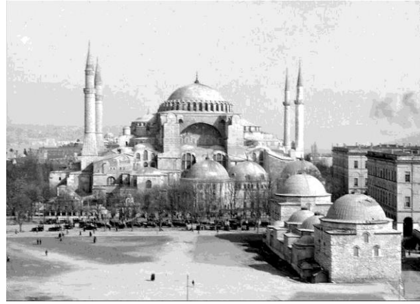
Resim 27. Ayasofya (Eski İstanbul, 2019)

Yukarıda bahsedilen cami tasvirinin mimari yapısı, minare ve şerefe sayısı incelendiğinde bir sultan yapısı olduğu anlaşılmaktadır. Yapının yanlara doğru genişlemesi, minarelerin konumları, ön düzlemdeki küçük türbeler ve duvarlardaki pembe, turuncu karşımı renk tasvir edilen yapının Ayasofya olma düşüncesini ortaya çıkarmıştır. Ancak duvar resmindeki yapıyla Ayasofya'nın şerefe sayıları birbiriyle örtüşmemektedir. Bu durum sanatçının tercihi olabileceği gibi kafasında yarattığı selâtin cami imgesi de olabilir. Yine de duvar resmindeki cami tasviri Ayasofya fotoğrafları ve eski gravürlerle karşılaştırıldığında bazı ortaklıklar görülmektedir (Resim 29).