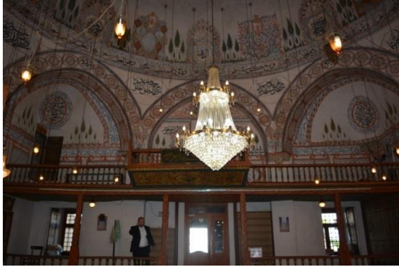
Resim 4. Hadım Cami Harim