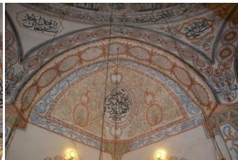
Resim 11. Tromp