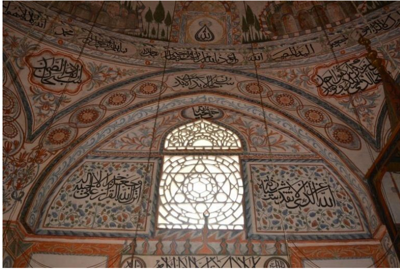
Resim 19. Hadım Camisi'ndeki Yazılar

Hadım Camisi'nin son cemaat yerinde, harim duvarlarında, mihrapta, minberde, tromplarda, pandantiflerde ve kubbeye boyalı nakışlar arasına yapılmış yazılar görülmektedir (Resim13-16-17-18-19-20). Buradaki yazıları kalıp kullanılarak yazıldığı anlaşılmaktadır. Yazılar Ali İmran Suresi, Araf Suresi, Zümer Suresi, En'am Suresi, Yasin Suresi, Bakara Suresi ve Mu'min Suresi'nden ayetler şeklindedir. Ayrıca yapıda Allah, Muhammed, dört halife, Hasan, Hüseyin, Talha, Zübeyir, Vel Abbas, Sad, Abdurrahman, Seyid, Ebu Ubeyde ve Hamza gibi İslam dini açısından önemli kişilerin isimleri okunmaktadır.