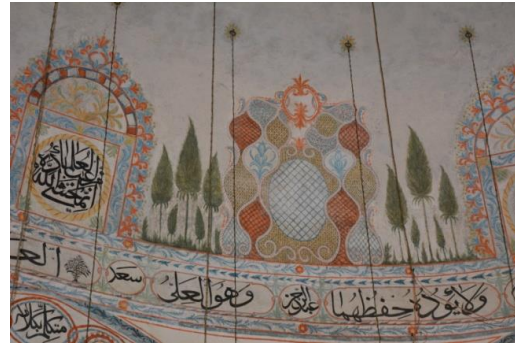
Resim 16. Vitray Tasviri