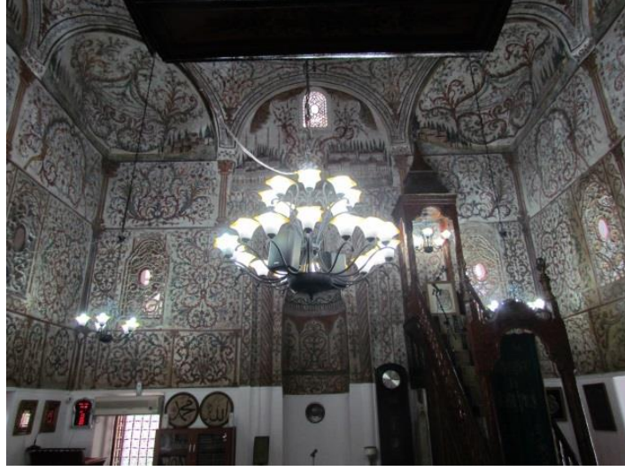
Resim 31. Tiran Ethem Bey Cami