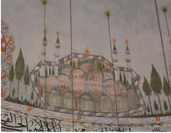
Resim 26. Yapı Tasviri