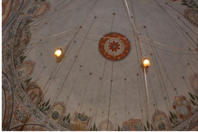
Resim 5. Hadım Cami Kubbe