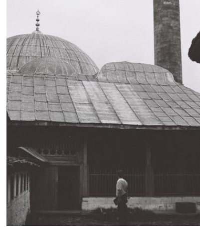
Resim 22. Hadım Cami'nin 1967 Yılına Ait Fotoğrafi