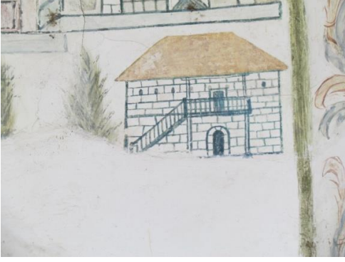
Resim 23. Kent Tasviri Ayrıntı