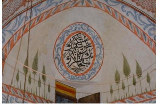
Resim 18. Servi Tasvirleri