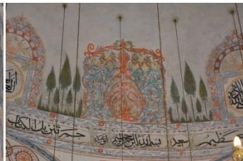
Resim 10. Kubbe