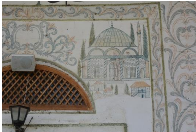
Resim 20. Kent Tasviri

Hadım Camisi'nin en önemli özelliklerinin başında yapıda bulunan beş duvar resmi gelmektedir. Son cemaat yerinde ve kubbeye yer alan bu resimler kent tasvirleri ve yapı tasvirlerinden oluşmaktadır. Camide duvar resimleri ilk olarak giriş kapısının hemen üzerinde görülmektedir. Burada yapı ve kent tasviri olmak üzere iki farklı duvar resmi vardır. Sol taraftaki kompozisyonda üç bölümlü son cemaat yeri olan, tek kubbeli ve tek minareli büyük bir cami tasviri görülmektedir. Tasvir edilen yapının düzgün kesme taşlardan yapılması, kubbesinin kurşunla kaplı olması, birbirinden farklı pencere formları ve son cemaat yerinde görülen niş tasvirleri sanatçının oldukça ayrıntılı bir şekilde çalıştığını göstermektedir. Cami tasvirinin hemen önünde C, S formlarında bir merdiven yer almaktadır. Bunun yanı sıra resmin çeşitli bölümlerinde ağaç tasvirleri vardır (Resim 21).