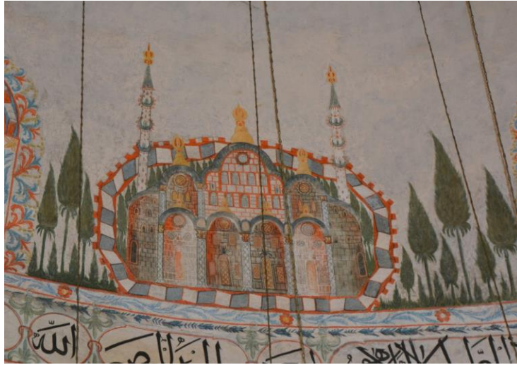
Resim 25. Yapı Tasviri

Hadım Camisi'nde duvar resimlerinin olduğu bir diğer bölüm ise kubbedir. Kubbede birbirinden farklı üç duvar resmi vardır. Bunların ikisi yapı tasviri, biri ise kent tasviridir. Yapı tasvirlerinin ilki, sur içerisinde, üç kubbeli, iki minareli ve dört bölümlü son cemaat yeri olan bir camidir. Minarelerin şerefe sayısı üçtür. Bu durum caminin bir sultan yapısı olduğunu göstermektedir. Yapı tasvirinde çoğunlukla kahverengi, beyaz ve turuncu renkler kullanılmıştır. Ayrıca resimde düzgün kesme taşlar, pencerelerin formları, sütun ve sütun başlıkları gibi en ince ayrıntılar görülmektedir. Tasvir edilen yapının her ne kadar mimari ayrıntıları itinayla yapılmış olsa da kesin olarak hangi yapının resmedildiği anlaşılamamaktadır. Sanatçının bu tasvirle İstanbul'daki yapılara bir gönderme yaptığını söylemek mümkün. Cami tasvirinin etrafında küçük servi ağaçları bulunmaktadır. (Resim 27).