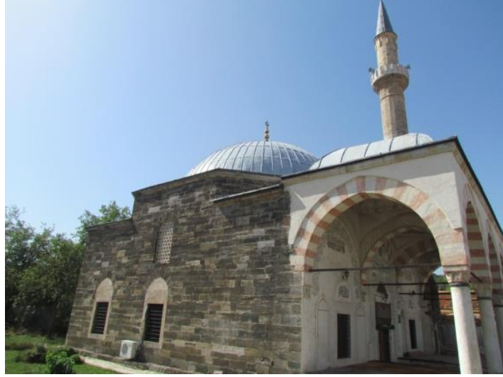
Resim 1. Hadım Camii

eserlerden bazıları günümüze ulaşmamıştır. 5 Yapının banisi Hadım Süleyman Ağa Bizeban'dır. 6 Kendisinin 1594-95 yıllarında bu camiyi yaptırdığı bilinmektedir (Kalesi ve Kornrumpf, 1967, s. 100; Ponosheci, 2006, s. 35; İbrahimgil ve Konuk, 2006, s. 13; Drançolli, 2007, s. 27; Avdiaj ve Avdiaj, 2015, ss. 103-104).