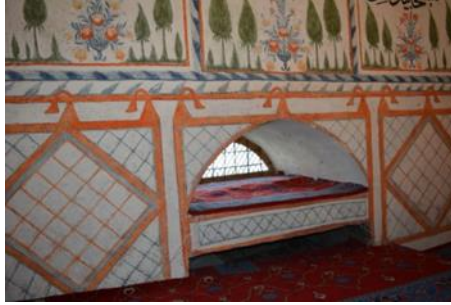
Resim 14. Perde Tasviri

Camideki boyalı nakışlar arasında bulunan bir diğer bezeme ise perde veya kumaş tasvirleridir. Biri yukarıda bahsedildiği gibi kubbede yer almaktadır ve iki minare arasına gerilmiştir. Bu tasvir uçları kenara doğru sarkan, kıvrımlı, turuncu ve mavinin tonlarında yapılmıştır (Resim 14). Diğeri ise kadınlar hariminin olduğu duvarda görülmektedir. Burada çengelle bir yere asılmış kare formunda, üzerinde geometrik bezemelerin olduğu duvar perdeleri tasvir edilmiştir (Resim 15).