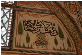
Resim 6. İkinci Sıra Pencere

Yapıdaki boyalı nakışlar arasında vazolar düzenlemeleri ve çiçek buketleri vardır. Vazo düzenlemeleri giriş kapısında, ikinci sıra pencerelerin etrafında, kadınlar hariminde, pandantifte ve kubbede yer almaktadır (Resim 7-8-9). Vazo düzenlemeleri arasında ikinci sıra pencerelerin etrafındakiler ve kadınlar hariminin ahşap yüzeyindeki örnek birbirine benzemektedir. Diğerleri ise farklılık göstermektedir. Çiçek buketleri ise mihrap, tromp, kubbe ve yine ikinci sıra pencerelerde bulunmaktadır. Bu düzenlemeler birbirinden farklı çiçeklerden oluşmaktadır (Resim 10-11-12).