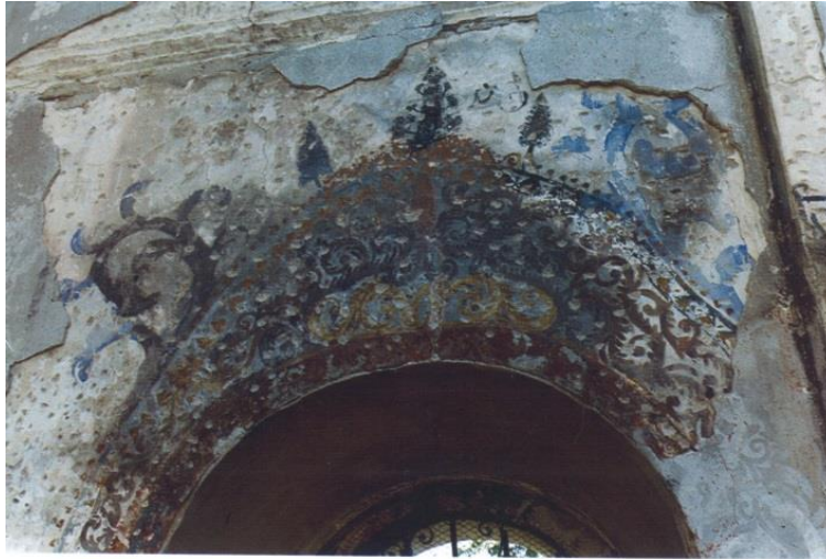
Resim 30. Peja Muhlis Ağa Cami (İbrahimgil ve Konuk, 2006, s. 362)

Hadım Camisi'nin bezemeleri renk ve üslup açısından Peja'daki Muhlis Ağa (Kızıl) Camisi'nin bezemelerine benzemektedir. 15 Yapının günümüze ulaşmayan bezemelerinde açık mavi, turuncu, hardal ve kiremit rengi gibi renkler görülmektedir. Bu renkler yoğun olarak Hadım Camisi'nde de karşımıza çıkmaktadır. Bir başka benzerlik ise Muhlis Ağa (Kızıl) Camisi'nin pencerelerin üstünde bulunan kıvrımlı, stilize bitkisel kompozisyonlardır. Buradaki düzenlemelerin benzer bir uygulaması Hadım Camisi'nde görülmektedir. Muhlis Ağa Camisi'ndeki bezemelerin kesin yapılış tarihi bilinmemekle beraber yapıdaki onarım kitabeleri ve bezemelerin üslupları göz önüne alındığında 18. yüzyılın sonu 19. yüzyılın başları olarak tarihlendirmek mümkündür (Resim 34).