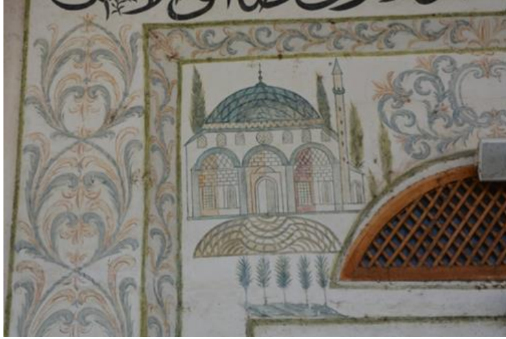
Resim 21. Yapı Tasviri

Hadım Camisi'nin en önemli özelliklerinin başında yapıda bulunan beş duvar resmi gelmektedir. Son cemaat yerinde ve kubbeye yer alan bu resimler kent tasvirleri ve yapı tasvirlerinden oluşmaktadır. Camide duvar resimleri ilk olarak giriş kapısının hemen üzerinde görülmektedir. Burada yapı ve kent tasviri olmak üzere iki farklı duvar resmi vardır. Sol taraftaki kompozisyonda üç bölümlü son cemaat yeri olan, tek kubbeli ve tek minareli büyük bir cami tasviri görülmektedir. Tasvir edilen yapının düzgün kesme taşlardan yapılması, kubbesinin kurşunla kaplı olması, birbirinden farklı pencere formları ve son cemaat yerinde görülen niş tasvirleri sanatçının oldukça ayrıntılı bir şekilde çalıştığını göstermektedir. Cami tasvirinin hemen önünde C, S formlarında bir merdiven yer almaktadır. Bunun yanı sıra resmin çeşitli bölümlerinde ağaç tasvirleri vardır (Resim 21).