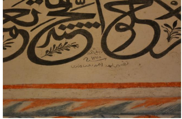
Resim 29. Harim Duvarındaki İmza