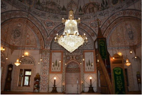
Resim 3. Hadım Cami Harimi

Kosova'nın ve hatta Balkanlar'ın bezeme açısından en zengin yapılarından biri Hadım Camisi'dir. Yapıda yoğun olarak boyalı nakışlar, duvar resimleri ve yazılar vardır. Bu bezemeler teknik olarak ikiye ayrılır. Duvar yüzeylerinde kuru sıva üzeri örnekler görülürken, giriş kapısı, kadınlar harimi, minber ve vaaz kürsüsünde ahşap üzerine bezemeler uygulanmıştır. Camideki bezemelerde turuncu renk yoğun olmakla beraber hardal sarısı, yeşil, mavi ve kırmızı rengin tonları da kullanılmıştır (Resim 4-5-6).