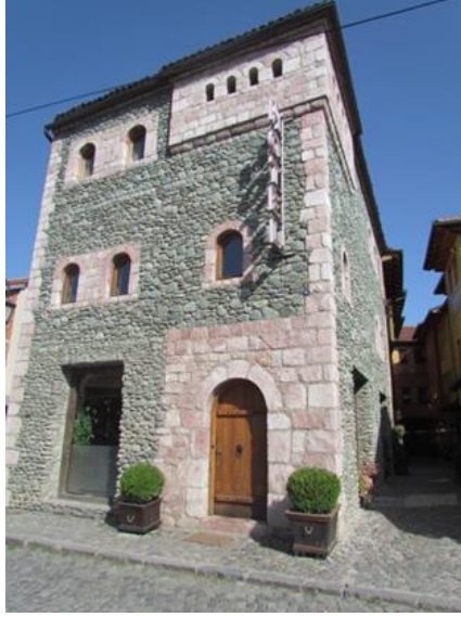
Resim 31. Yakova'daki Kula Mimarisi

Bazı araştırmacılar yukarıda bahsedilen kent tasvirinin Dukagini 10 (Dukagjini) bölgesi olduğunu belirtmektedir. 11 Resmedilen kent tasvirinin Dukagini olma ihtimaliyle beraber yapının bulunduğu Yakova kenti olma ihtimali de söz konusudur. Nedeni ise duvar resmindeki mimari yapıların Kosova'da kula denilen yerel mimari yapılarla benzerliğidir. Bu yüzden tasvir edilen kent panoramasının Kosova bölgesinden bir yer olma ihtimali oldukça yüksektir (Resim 31).