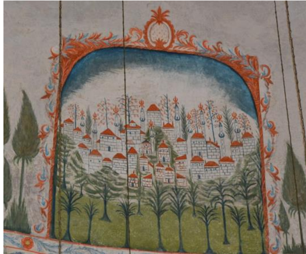
Resim 30. Kent Tasviri

Yukarıda bahsedilen cami tasvirinin mimari yapısı, minare ve şerefe sayısı incelendiğinde bir sultan yapısı olduğu anlaşılmaktadır. Yapının yanlara doğru genişlemesi, minarelerin konumları, ön düzlemdeki küçük türbeler ve duvarlardaki pembe, turuncu karşımı renk tasvir edilen yapının Ayasofya olma düşüncesini ortaya çıkarmıştır. Ancak duvar resmindeki yapıyla Ayasofya'nın şerefe sayıları birbiriyle örtüşmemektedir. Bu durum sanatçının tercihi olabileceği gibi kafasında yarattığı selâtin cami imgesi de olabilir. Yine de duvar resmindeki cami tasviri Ayasofya fotoğrafları ve eski gravürlerle karşılaştırıldığında bazı ortaklıklar görülmektedir (Resim 29).