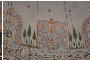
Resim 8. Kubbe