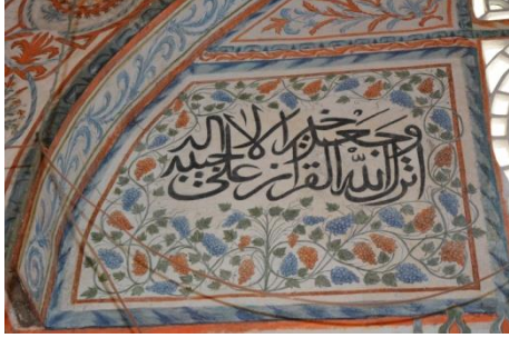
Resim 12. Üzüm Tasvirleri

Hadım Camisi'nde yer alan bir diğer bezeme ise meyve düzenlemeleridir ve yapının iki farklı yerinde karşımıza çıkmaktadır. Bunlardan biri üzüm salkımlarıdır ve güney duvarındaki ikinci sıra pencerenin etrafında yer almaktadır (Resim 13). Diğeri ise kubbede bulunmaktadır. İki minare arasına gerilmiş bir kumaş tasvirinin içerisinde dilimlenmiş karpuz resimlerinden oluşmaktadır (Resim 14).