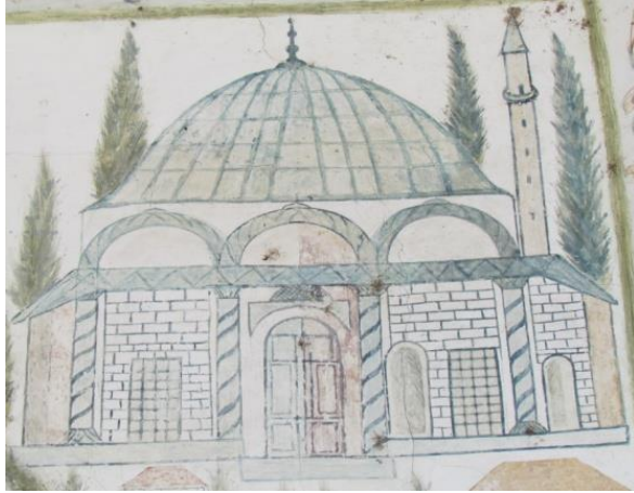
Resim 21. Kent Tasviri Ayrıntı

Duvar resminde cami tasviri dışında daha küçük boyutlu mimari yapılar görülmektedir. Bu yapı tasvirlerinin duvarları düzgün kesme taştır ve çatı ile örtülmüşlerdir. Kompozisyonun sağında bulunan yapı oldukça dikkat çekicidir. Bu mimari tasvir iki katlıdır ve dış cephesinde bir merdiven görülmektedir. Resmin sol tarafında ise birbirine benzer formlarda üç sivil mimari yer almaktadır. Ayrıca resimde farklı yerlere dağılmış ağaç tasvirleri vardır.