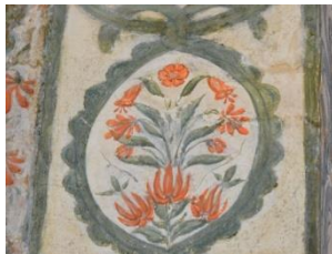
Resim 9. Mihrap