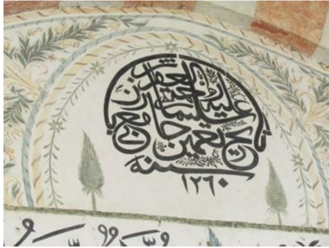
Resim 2. Hadım Camii Onarım Kitabesi

Hadım Süleyman Ağa hakkında ayrıntılı bilgiler olmamasına rağmen bazı yayınlarda az da olsa bilgi bulmak mümkündür. Kalesi ve Kornrumpf, Hadım Süleyman Ağa'nın Yakova civarındaki Guski köyünde dünyaya geldiğini belirtirler. Ayrıca İstanbul'a götürülerek devşirildiğini ve Sarayda önemli bir mertebeye yükseldiğini bununla birlikte çok iyi paralar kazandığını yazmışlardır (Kalesi, Kornrumpf, 1967, s. 100). Mehmet İbrahimgil ve Neval Konuk'un kitaplarında ise III. Murad döneminde (1574-1595) sarayda görevli olduğu öğrenilmektedir (İbrahimgil ve Konuk, 2006, s. 13).