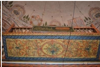
Resim 7. Kadınlar Harimi