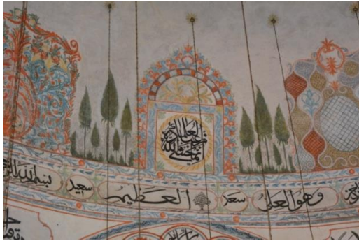
Resim 15. Pencere Tasviri

Yapıdaki bezemeler arasında on pencere tasviri bulunmaktadır. Pencere tasvirleri genellikle geometrik bezemeler, bitkisel bezemeler ve yazılardan oluşmaktadır. Bu tasvirlerin ikisi vitray formundadır ve farklı renklerle yapılmıştır (Resim 16-17).