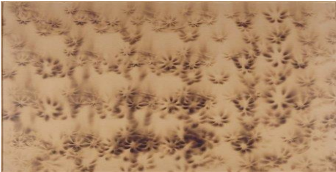
Yves Klein, Untitled Fire Painting with Charred Wall in Krefeld [F 45] , 1961, Tahta Üzerine Kaplanmış Kağıt Üzerine Pürmüzle İşleme, 68,5 x 99,5 cm, Museo Nacional Centro de Arte Reina, Sofia, Erişim Tarihi: 23 Aralık 2013, http://www.museoreinasofia.es/en/collection/artwork/pintura-al-fuego-sin-titulo-quemaduras-pared-fuego-krefeld-f-45-untitled-fire

Klein'in kendine özgü bir metotla yaptığı bir başka çalışma dizisi de pürmüz alevi ile yaptığı çalışmalardır. Sanatçı, Santa Cruz'daki Manos Mağarası ve Endonezya Borneo'daki, binlerce yıl önce yapılmış olan insana ait el imajlarının oluşturulmasında kullanılan püskürtme tekniğini hatırlatan, adeta püskürterek kullandığı alevin ısı ve isinin izlerini düzleme aktardığı Monochrome and Fire adlı bu seri kapsamında birçok resim hatta pürmüzlerden püskürttüğü alevle yerleştirme heykeller yapmıştır. Klein'nın tıpkı Anthropometries 'de yaptığı gibi Traces adlı çalışmalarında yüksek baskıda olduğu gibi nesne yüzeyini mühür gibi kullanarak doğrudan, Cosmogonies 'de ise şablon olarak kullandığı çeşitli nesne ve püskürtme boya kullanarak bir boyaresim-baskiresim kombinasyonu yaratmıştır.