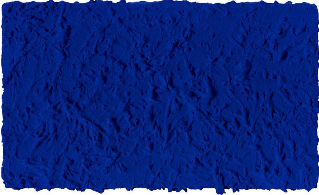
Yves Klein, Monochrome bleu sans titre (IKB 45) , 1960, Tahta Panele Yapıştırılmış Tuval Üzerine Sentetik Reçine ile Muamele edilmiş Kuruboya, 27 x 46 cm, Yves Klein Arşivi. Erişim Tarihi: 25 Aralık 2013, http://www.yveskleinarchives.org/works/large/ikb45.jpg

Klein, espası paketlediği kutusunu hatırlatan, boşlukla ilgili bir diğer çalışması da fotomontaj ile yaptığı 1960 tarihli Saut dans le vide (Leap into the Void) (boşluktan atlama) ve ardından gerçekleştirdiği uzay ve ay ile ilgili çalışmalarıdır. Yaptığı yazısız kitaplar, tasvirsiz resimler, güftesiz müzikler gibi tüm çalışmalarını sanat olarak görüyor ve bu sanat eserlerinin kendinden başka hiç bir şeyi tasvir ve temsil etmesini istemiyordu. Sanatçı böylece peşinde olduğu teorik-felsefik kombinasyon bağlamında yaptığı çalışmaların çözümlenmesi meselesini izleyenin anlayış ve idrakına bırakma yolunu seçmiş, merkeze aldığı izleyenin imgelemine depreştirmek, ortaya çıkarmak için ise derinlikli IKB mavisini kullandığı resimler yapmıştır.