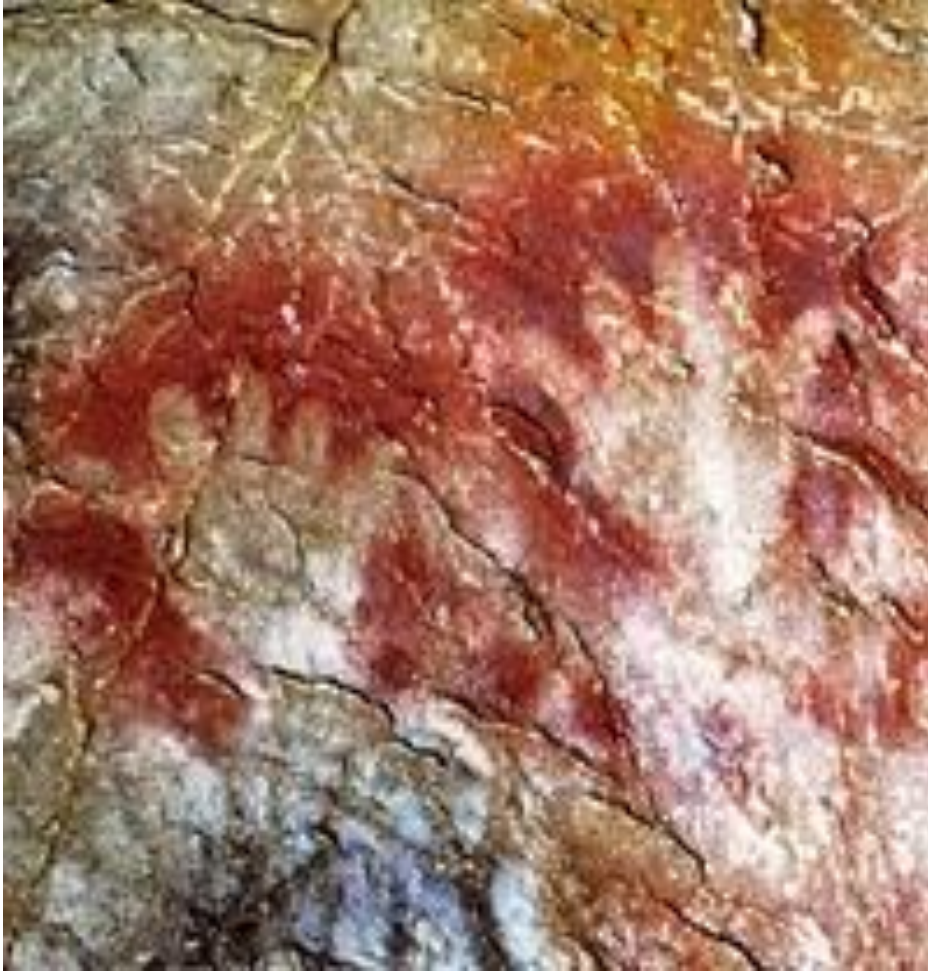
Grotte de Gargas Chamber I bölümünden El şablonu resimleri, M.Ö.25,000, Yüksek Pireneler, Güneybatı Fransa, http://www.visual-arts-cork.com/prehistoric/gargas-cave.htm