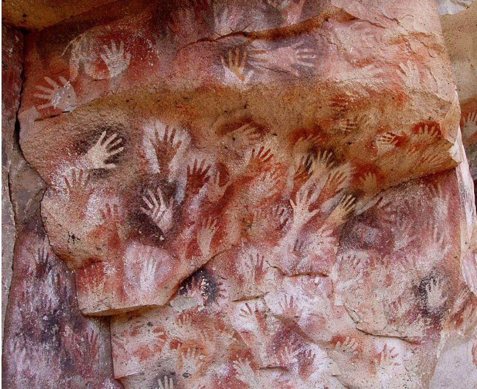
Manos Mağaralarından el şablonu resmi, M.Ö. 30.000, Santa Cruz yakınları, Perito Moreno, Manos Mağaraları Arjantin, http://www.visual-arts-cork.com/prehistoric/gargas-cave.htm