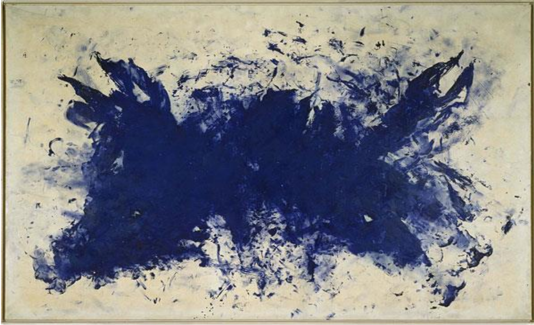
Resim 2.74. Yves Klein, Large blue anthropophagy, Homage to Tennessee Williams (Great battle) , 1960, Tuvale Marufle Edilmiş Kağıt Üzerine Saf Pigment ve Sentetik Reçine, 276 x 418 cm, Centre Pompidou Modern Sanatlar Müzesi Koleksiyonu, Erişim Tarihi: 01 Şubat 2014, http://mediation.centrepompidou.fr/education/ressources/ENS-klein-EN/ENS-klein-EN.htm

Yves Klein'in Large blue anthropophagy, Homage to Tennessee Williams (Great battle) adlı boyaresmi adından da çıkarsanabileceği gibi insan bedeninin kırılğan yapısı üzerinden yaratılabilecek kaosun gestural Klein mavisi boya sürüşüyle bir anlamda canlandırılmasına dair bir resimdir. Tennessee Williams'ın trajik ölüm anındaki bedeninin kaotik, savruk hareketlerinin adeta bir anatomisi olan resim, sanatçının kullandığı canlı fırça boya aktarımlarıyla dikkat çekmektedir. Bu resimdeki temel özellik sanatçının boyaresim-baskıresim kombinasyonu vücutbaskı (bodyprinting) antropometri işlerindeki boyalı beden hareketlerinin düzleme yansıyan izlerine benzeyen boyama özelliğinin yanı sıra kullanılan geleneksel Klein malzemesi mavi pigment, reçine ve tuvalle marufle edilerek birleştirilen kağıt ise resmin diğer önemli özellikleridir. Resmin hikayesi her ne kadar bir tasviri akla getirirse de renk, boya, boyama biçimi, düzlemi ve espası değerlendirme anlayışı Klein'in kendine özgü resim anlayışıyla örtüşmektedir.