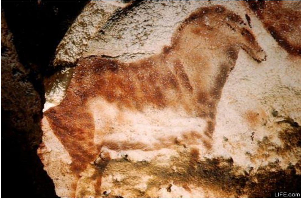
Lascaux Mağara Resmi, Yaklaşık 18.000, (detay) Mineral, Bitki, Kemik Pigmentleri ve Ateş İsi, Güney Fransa https://www.google.com.tr/search?q=lascaux+cave&source=Inms&tbn=isch&sa=X&ved=0ahUKEWjt1qfnxaPbAhVkJZoKHQp8AXcQ_AUICigB&biw=808&bih=552#imgrc=mtaGnP3wbG6M1M: