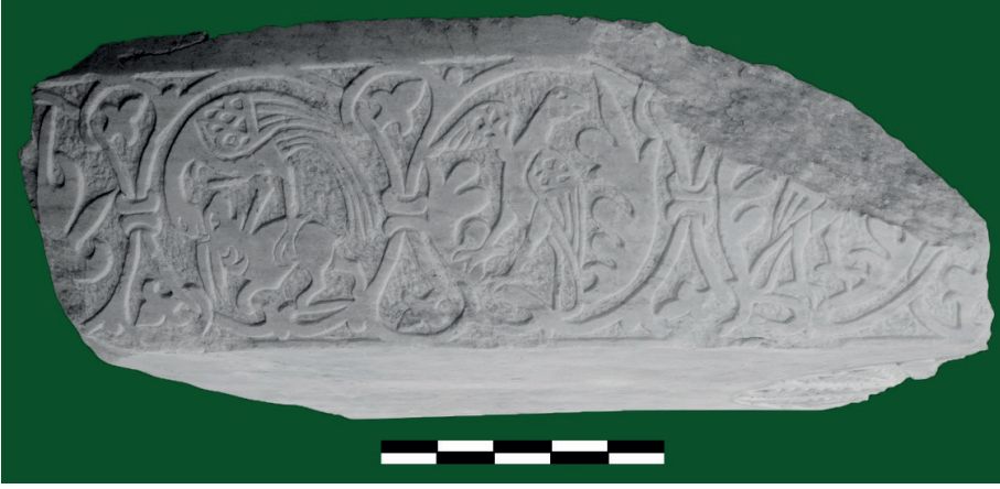
Figure 14. Orta Bizans Dönemi Mimari Plastik Eser.