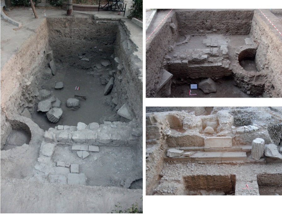
Figure 8. Geç Dönem İşlik ve Mekanları.