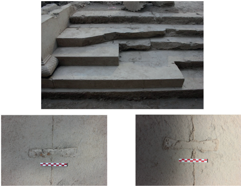
Figure 19. Krepis Sıraları ve Kenet Çeşitleri.