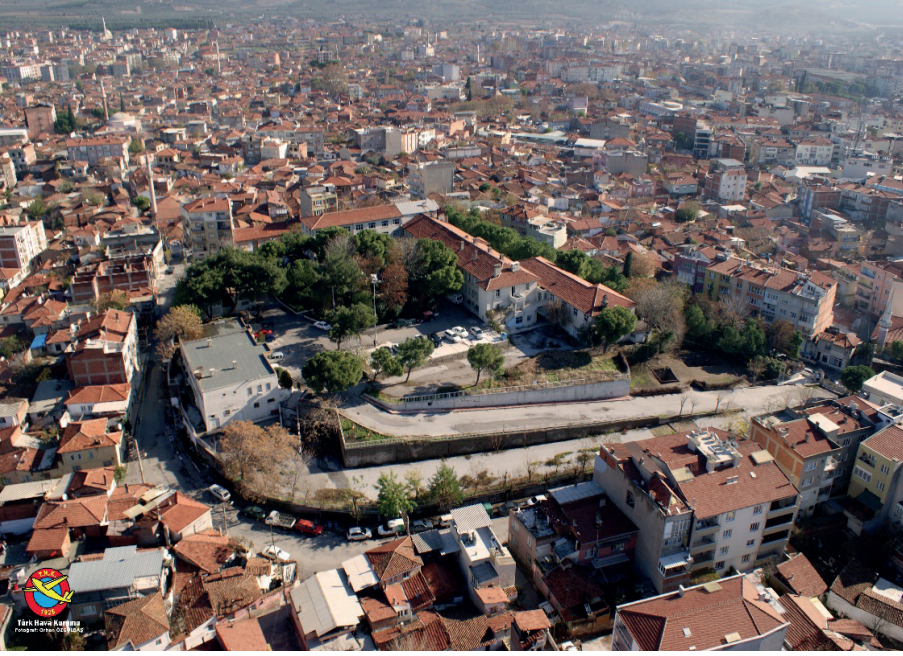
Figure 2. Hastane Höyüğü'nün Hava Fotoğrafi, Batıdan Görünüm.