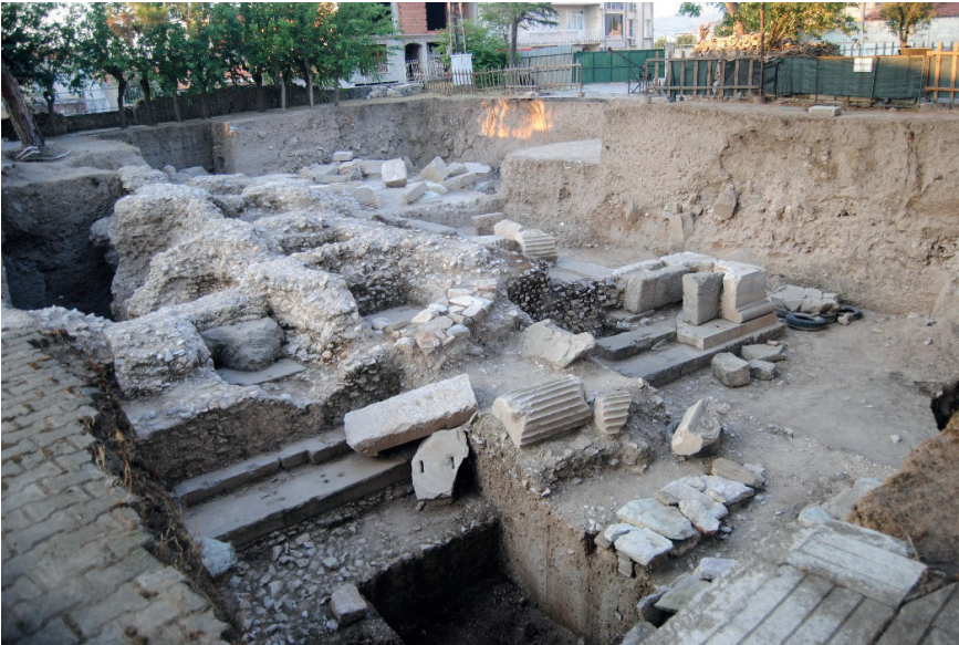
Figure 9. Tapınağın Üzerindeki Harçlı Alanların Güneybatıdan Görünüşü.