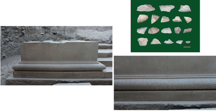
Figure 18. Güneydoğu Toikhobate Bloğu.