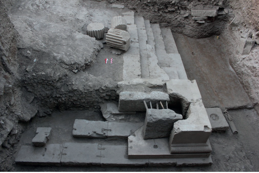
Figure 10. Güneydoğu Toikhobate Bloğunun İşlik Amaçlı Tahribatı.