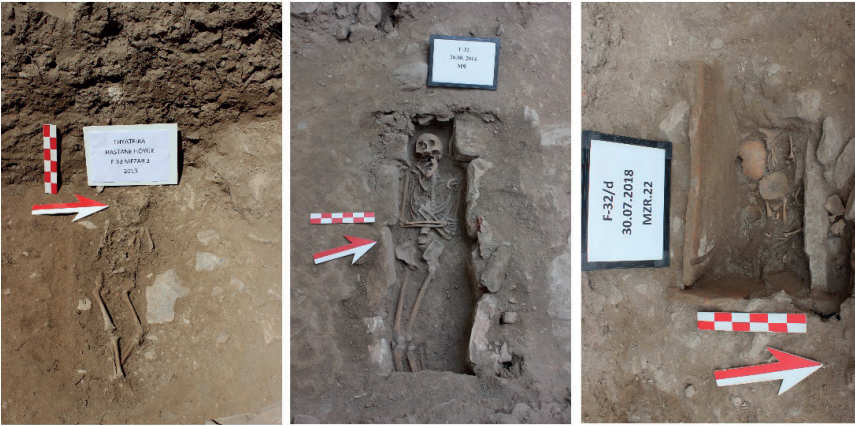
Figure 13. Nekropol Alanı Mezar Örnekleri.