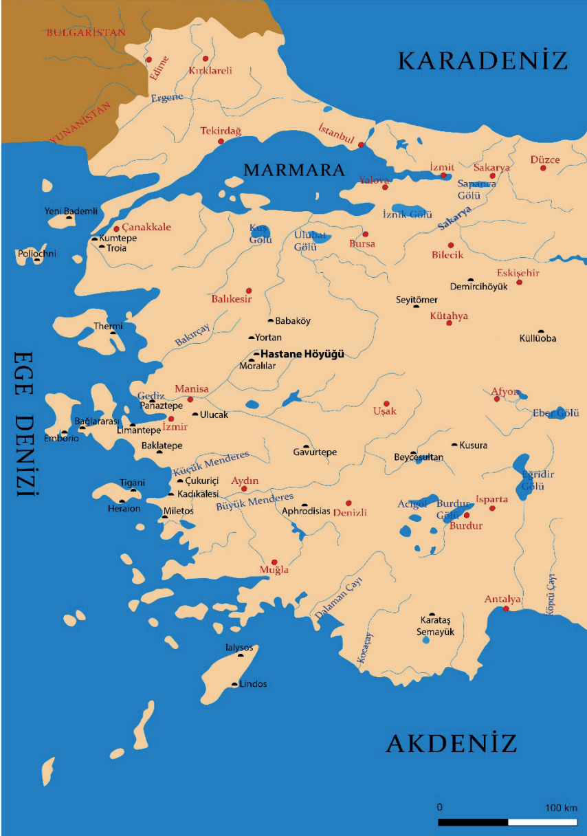
Figure 1. Hastane Höyüğü'nün Konumu.