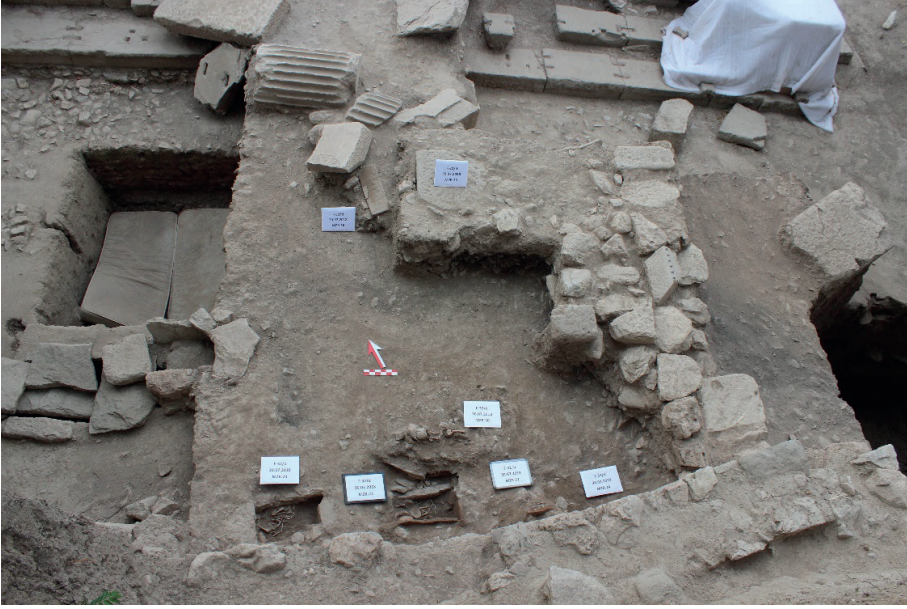
Figure 12. Tapınağın Güneyindeki Nekropol Alanı, Güneyden Görünüm.