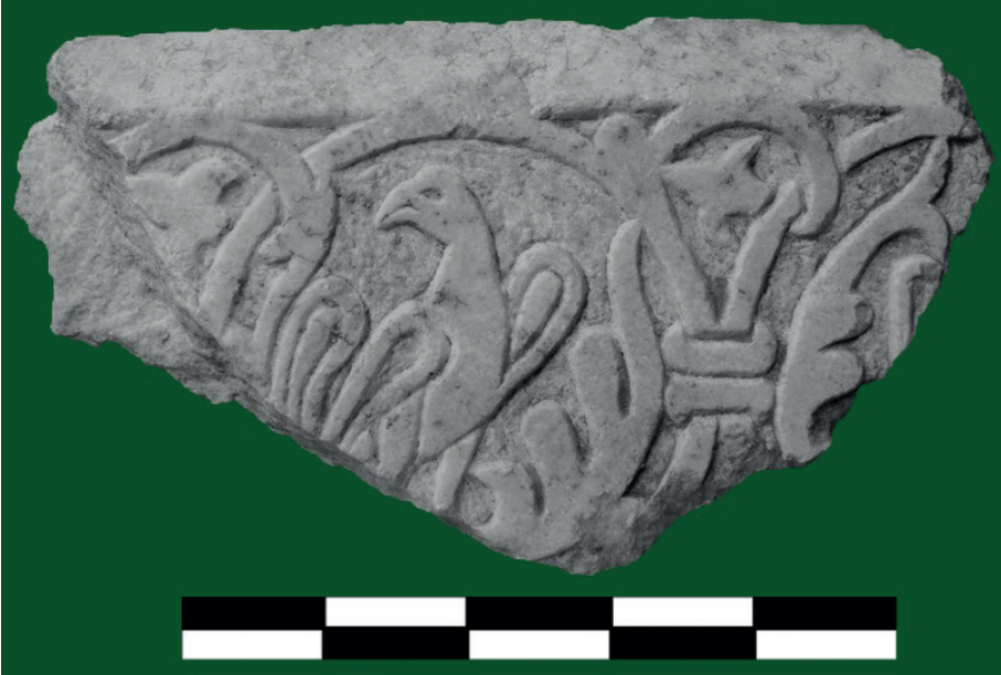
Figure 15. Orta Bizans Dönemi Mimari Plastik Eser.