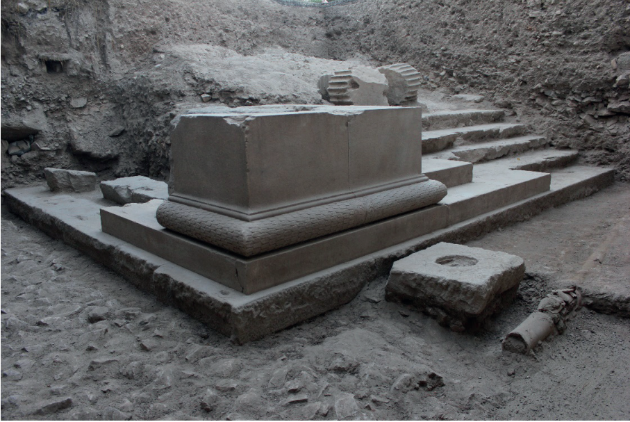
Figure 4. Tapınağın Güneydoğu Köşesi.