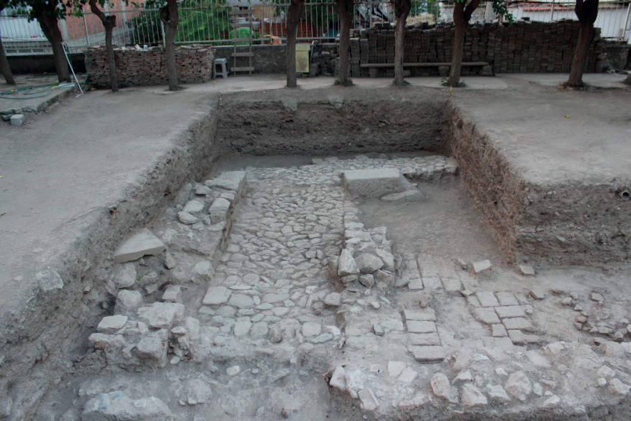
Figure 7. Geç Osmanlı Tabakası.