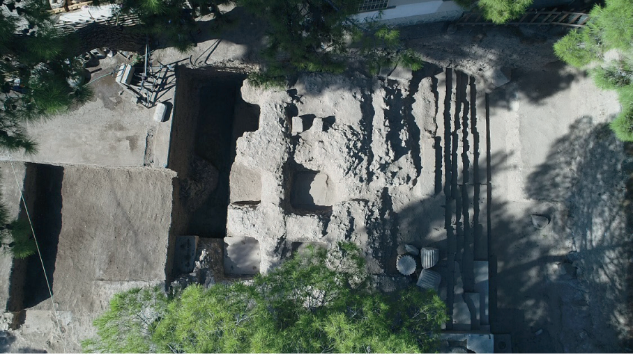
Figure 6. Tapınağın Hava Fotoğrafi.