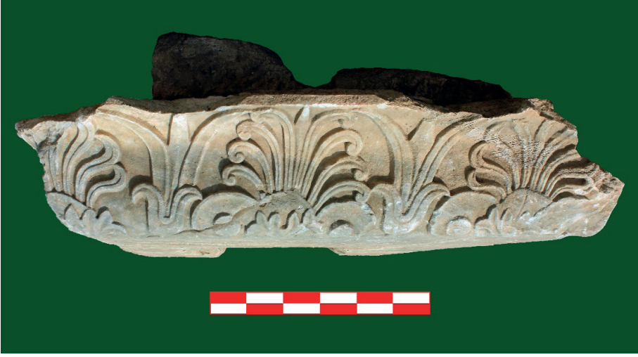
Figure 24. Sima Bloęu.