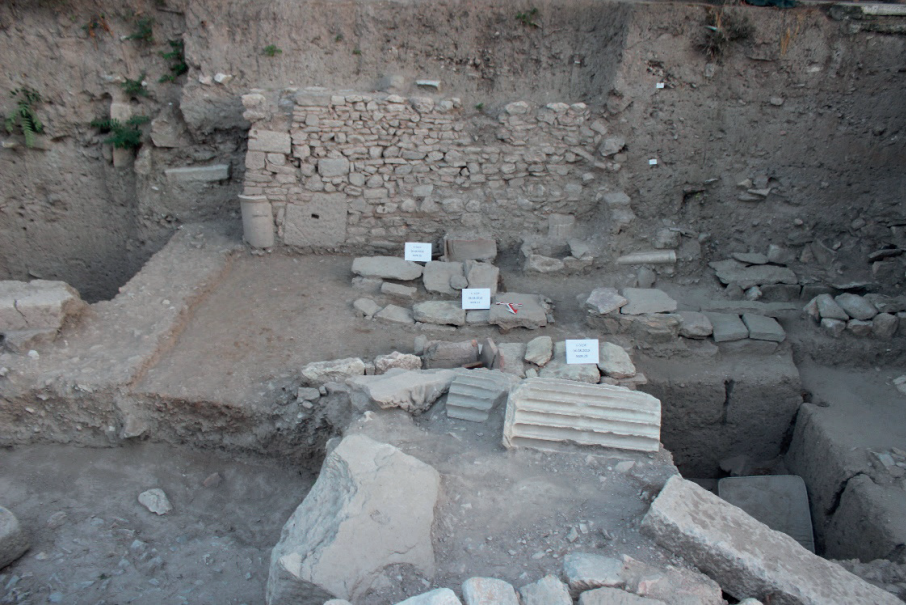
Figure 11. Tapınağın Güneyindeki Nekropol Alanı, Kuzeyden Görünüm.