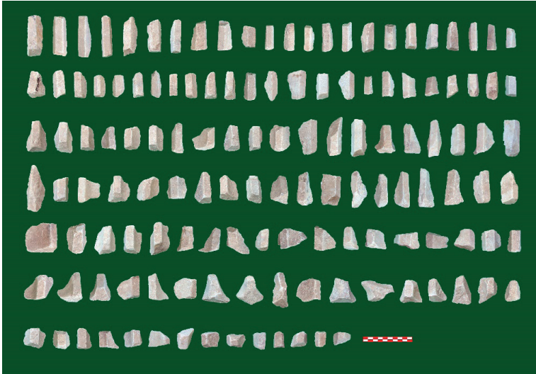
Figure 21. Sütun Tamburu Yiv Parçaları.