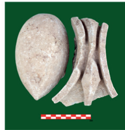
Figure 23. Ion Sütun Başlığı Parçaları.