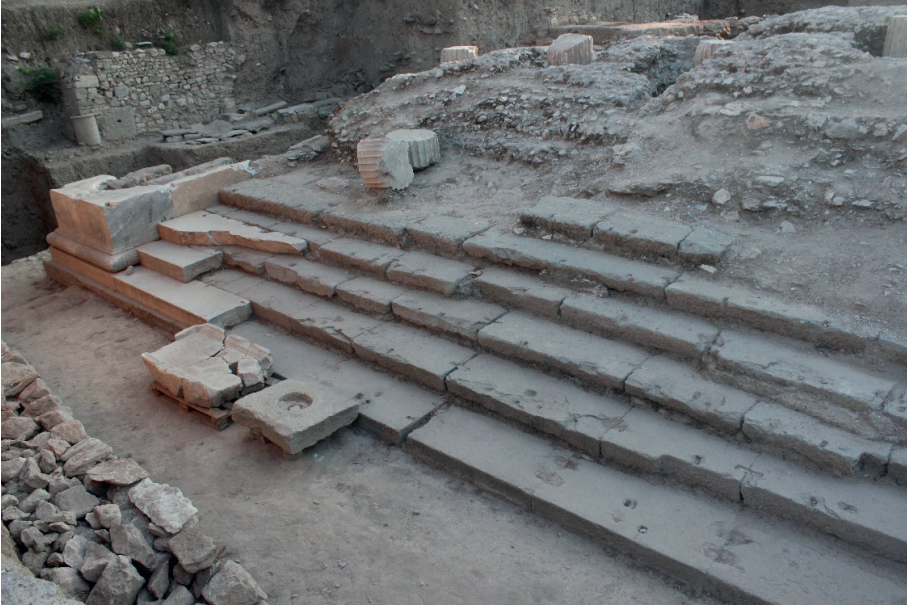
Figure 5. Tapınağın Doğu Yönündeki Girişi.