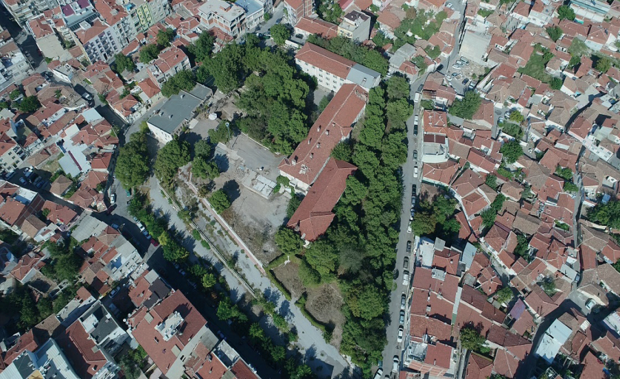
Figure 3. Hastane Höyüğü'nün Hava Fotoğrafi, Güneybatıdan Görünüm.