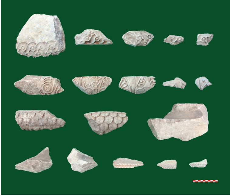
Figure 20. Sütun Kaidesi Parçaları.