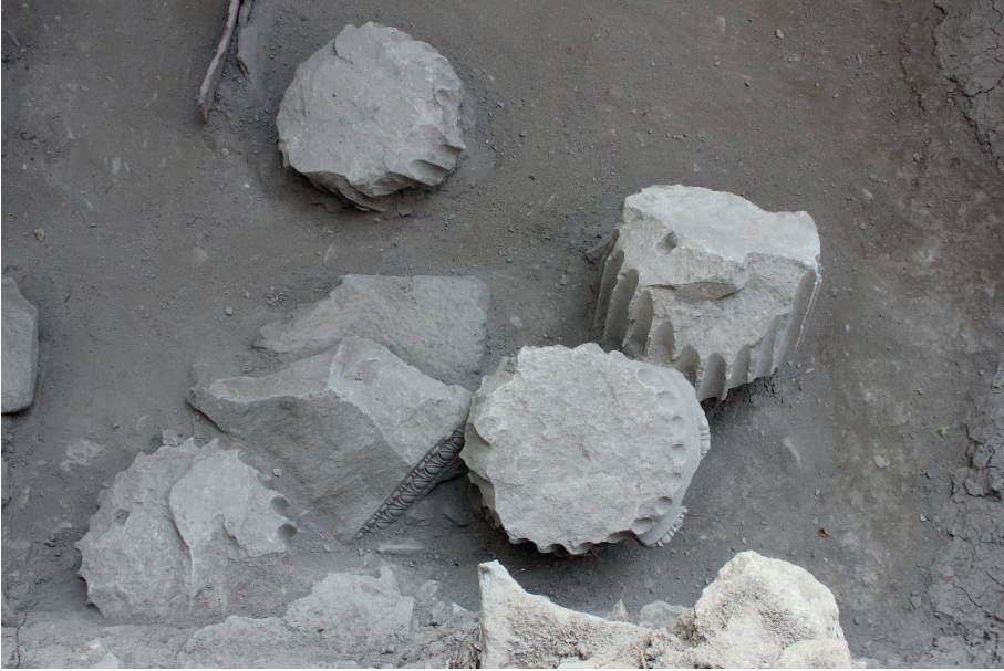
Figure 22. Sütun Tamburları.