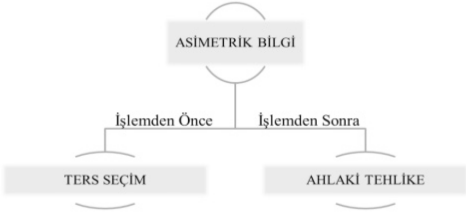
Şekil 1: Asimetrik bilginin sebep olduğu olumsuzluklar

Asimetrik bilgidен kaynaklanan çeşitli bilgi sorunları bulunmaktadır. Bunları ters seçim ve ahlaki tehlikedir. Aşağıdaki alt başlıklarda bu kavramlar ayrıntılı olarak açıklanmıştır.