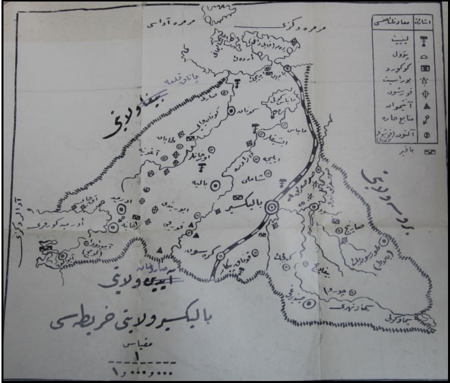
Foto 2: Eserin Son Kısmında Yer Alan Vilayetin 1/1.000.000 Ölçekli Haritası

“Balıkesir Vilayeti Coğrafyası” isimli eser Balıkesir İl Halk Kütüphanesi’ndeki nüshasına göre 150 sayfadan oluşmakta; kitapta 9 fotoğraf ve arka kapağa ilişkin bir harita (Foto 2) bulunmaktadır.