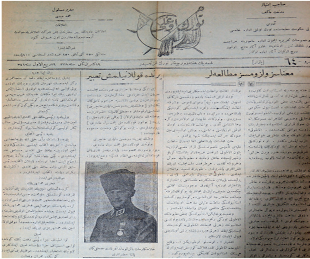
Fotograf-2: Türkoğlu gazetesinin Mustafa Kemal Paşa görseli içeren nüshası

Tek yaprak, iki sayfa olan gazetenin ilk sayfasının en üst kısmında ay yıldızlı sancaklı logosu, imtiyaz sahibi, mesul müdürü, basıldığı matbaa, idarehanesi, yıl, sayı, satış, abonelik bilgileri ve ilan tarifeleri ile “şimdilik haftada bir çıkan Türk gazetesidir” ibaresi bulunmaktadır. 15