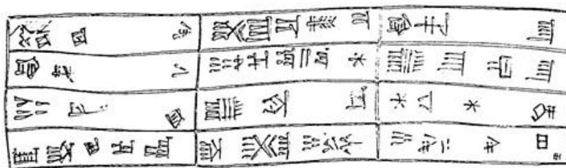
Рис.3. Прорисовка текста из Дербенди-Белула (по Э.Херцфельду).

В 1890 г. здесь побывал капитан Л. Бергер. Чуть позже Жак де Морган и эпиграфист его экспедиции, ассириолог В. Шейль, осмотрев этот памятник, осуществили первое научное издание надписи. 28 В 1924 г. Э. Херцфельд осмотрел рельеф и сверил сопроводительную надпись (см. рис. 3).