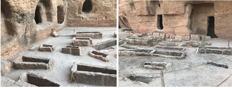
Şekil 14: Nekropol'deki Kaya ve Sandukalı Mezarlar