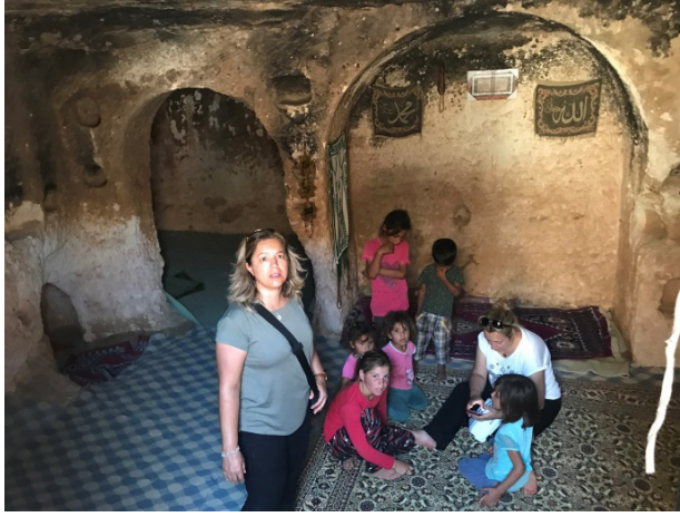
Şekil 4: Şuayb Peygamberin Makamı Olduğu Rivayet Edilen Mağara

müzde kadınların cuma günleri kullandığı mescid şeklinde bir de mağara bulunmaktadır (Şekil 4).