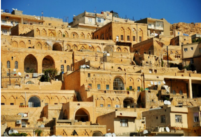
Şekil 11: Mardin Evleri 8