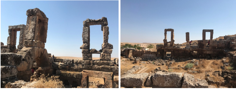
Şekil 10: Kentte Ayakta Kalan Yapı Elemanları

Bütün Roma kentlerinde olan Nekropolün (mezar yapıları)bu kentte de mağaralar halinde olduğu sanılmaktadır. Kentteki mağaraların bazıları mezar olarak kullanıldıysa da bazılarının barınma, depolama, belki de ibadet için oyulduğu tahmin edilmektedir. Kalker taşı özelliğinde olan kayaların kolay oyulması, pek çok mağara yapılmasına imkân sağlamıştır. Aslında bu mağaralar arasında geçişler olduğunun yöre halkı tarafından söylenmesi, burada bir yeraltı kenti(mağara kenti) olabileceği görüşünü de akla getirmektedir. Bu mağaralardan çıkarılan taşların, antik kenti oluşturan yapı malzemesi olarak kullanıldığı düşünülmektedir. Oldukça büyük boyutlarda kullanılan bu taşlardan yapılan bazı yapı öğeleri, kapı ve pencere kenarları, kemerler, duvarlar ve sütunlar (Şekil 10) hala ayakta kalmaktadır.