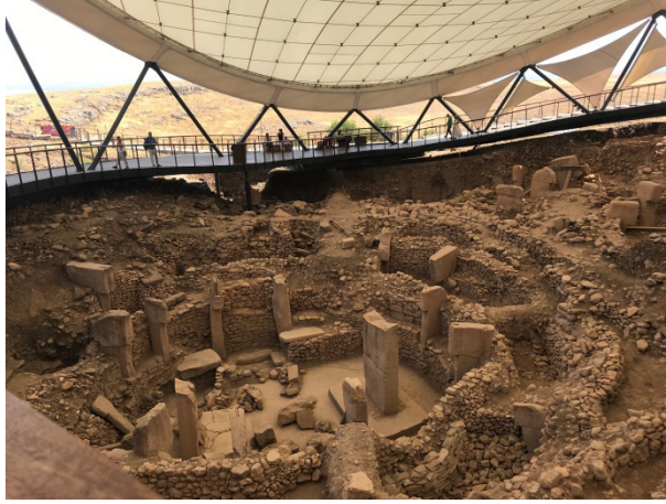
Şekil 2: Şanlıurfa Göbeklitepe Költ Yapılar Topluluğu

Bu tarihi yerleşim, dünyanın bilinen en eski költ yapılar topluluğudur. Günümüzde 6 yapı topluluğu kazılarla ortaya çıkarılmıştır. Bu yapıların ortak özelliği, yuvarlak planda dizilmiş ve araları taş duvar şeklide örülmüş, T formundaki 10-12 dikilitaş olması ve merkezde ise daha yüksek boyutlardaki iki adet dikili taşın karşılıklı olarak yerleştirilmiş olmasıdır. Dikilitaşların çoğunun üzerinde kabartılarak veya oyularak betimlenmiş çeşitli hayvan insan, el, kol ve soyut semboller yer almaktadır 4 .