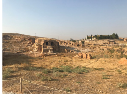
Şekil 17: Nekropol'den Görüntüler