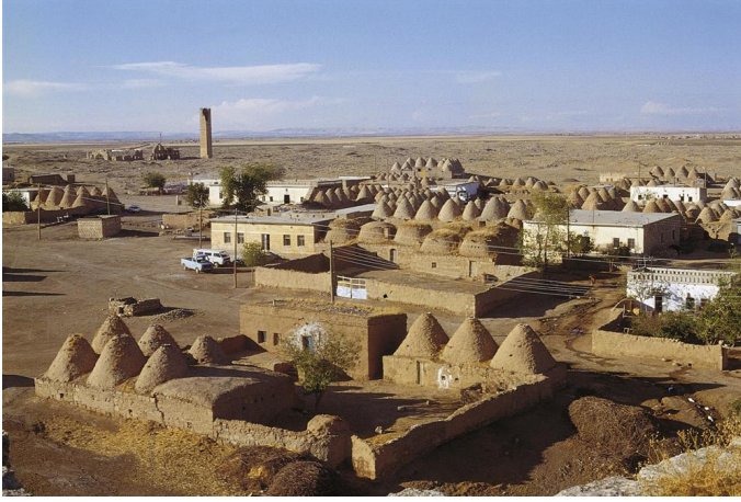
Şekil 3: Tarihi Harran Yerleşimi 5

Bilinen bilinmeyen, bilinip gün yüzüne çıkarılamayan birçok eseri bünyesinde bulunduran bu kent, sadece tarihi değerleri ile değil, yaşam tarzının ve kültürün geçmişten günümüze değişmeden yaşandığı bir yerleşimdir. Kentin bilinmeyen veya tanınmayan, Dünya Kültür Mirası Listesine aday olacak Antik kentlerinden biri de Şuayb kentidir.