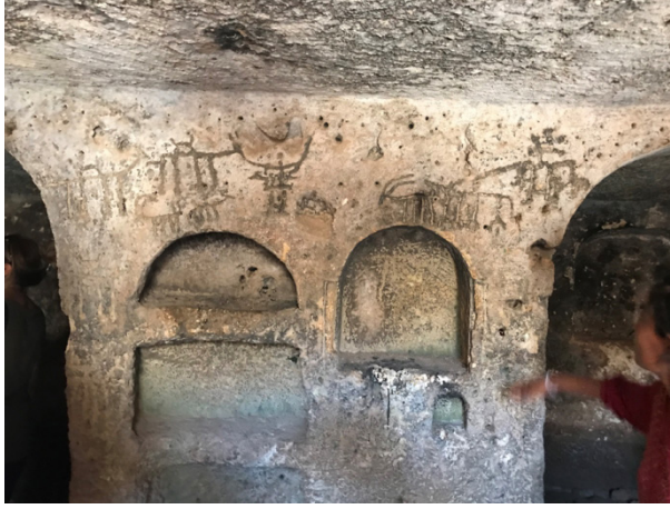
Şekil 9: Mağaralardan Birinde Yer Alan Duvar Resmi

Bütün Roma kentlerinde olan Nekropolün (mezar yapıları)bu kentte de mağaralar halinde olduğu sanılmaktadır. Kentteki mağaraların bazıları mezar olarak kullanıldıysa da bazılarının barınma, depolama, belki de ibadet için oyulduğu tahmin edilmektedir. Kalker taşı özelliğinde olan kayaların kolay oyulması, pek çok mağara yapılmasına imkân sağlamıştır. Aslında bu mağaralar arasında geçişler olduğunun yöre halkı tarafından söylenmesi, burada bir yeraltı kenti(mağara kenti) olabileceği görüşünü de akla getirmektedir. Bu mağaralardan çıkarılan taşların, antik kenti oluşturan yapı malzemesi olarak kullanıldığı düşünülmektedir. Oldukça büyük boyutlarda kullanılan bu taşlardan yapılan bazı yapı öğeleri, kapı ve pencere kenarları, kemerler, duvarlar ve sütunlar (Şekil 10) hala ayakta kalmaktadır.