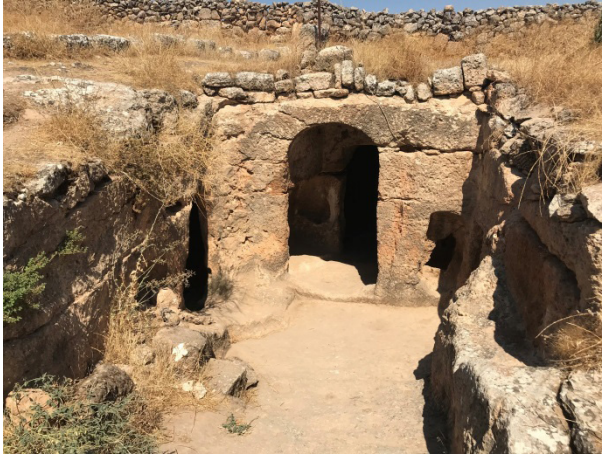
Şekil 6: Şuayb Kentinde Bir Mağara Girişi

Antik kenttin tepelik alana kurulmasının güvenlik nedeniyle çevreye hâkim olması amacıyla yapıldığı düşünülmektedir. Tepelik alanın verdiği imkânla, neredeyse yan yana gelecek şekilde pek çok mağaraya rastlanmaktadır. Kentte yaşayan kişilerin deyimiyle 2000 üzerinde mağara olduğu, son yıllara kadar köy halkının bu mağaralarda yaşadığı belirtilmiştir (Şekil 6). Zeminden 150-200 cm aşağıda olan genelde 5- 6 basamakla inilen mağaraların içinde eşya, kandil vb koymak için bazı nişler de yer almaktadır (Şekil 7). Günümüzde bu alanda yaşamını sürdüren insanlar, bu mağaraları depo, ahır, wc gibi kullanmaktadır. Özellikle depo amacıyla evin bir parçası olarak kullanıldığından, halkın çoğunun evi bu mağaraların hemen üzerinde veya yanında yer almaktadır (Şekil 8).