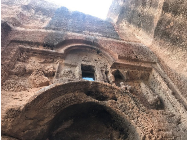
Şekil 15: Nekropol'deki Büyük Galeri Mezarlığın Giriş Kapısı