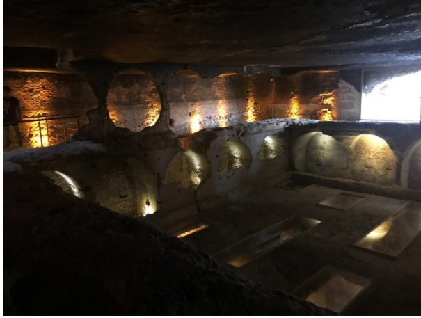
Şekil 16: Nekropol'deki Üç Katlı Büyük Galeri Mezarlık