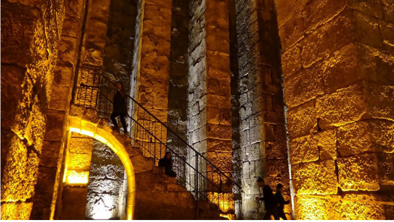
Şekil 13: Zindan Olarak Kullanılmış Olan Sarnıç 11

Özellikle büyük galeri mezar, tamamen kayaya oyularak üç katlı olarak yapılmış, boyutları, planı ve iç düzenlenmesi ile nekropol alanındaki en dikkat çekici yapıdır. Roma Dönemi'nde, 'Yeniden Diriliş' törenlerinin yapıldığı ve Dünyada başka örneğine rastlanmaya 1400 yıllık üç katlı bu galeri mezarlıkta 3 binden fazla kişiye ait kemikler yer almaktadır. (Şekil 15-16-17).