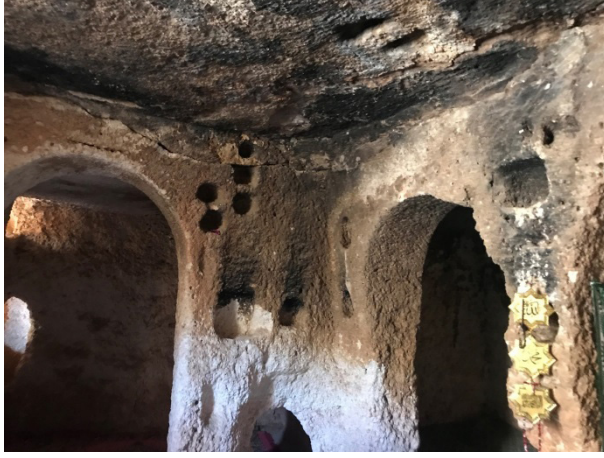
Şekil 7: Kentteki Mağaraların Bazılarının İç Kısmı