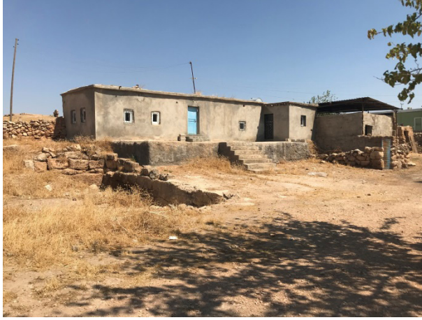
Şekil 8: Mağaraların Üzerinde Yapılan Evler

Mağaraların birinde, eski dönemlerden kaldığı sanılan duvar resmine de rastlanmaktadır. İnsan ve hayvan resimleri olduğu sanılan bu mağara için konu uzmanlarınca yeterli inceleme yapıldığında, buranın önemi daha da anlaşılacaktır (Şekil 9).