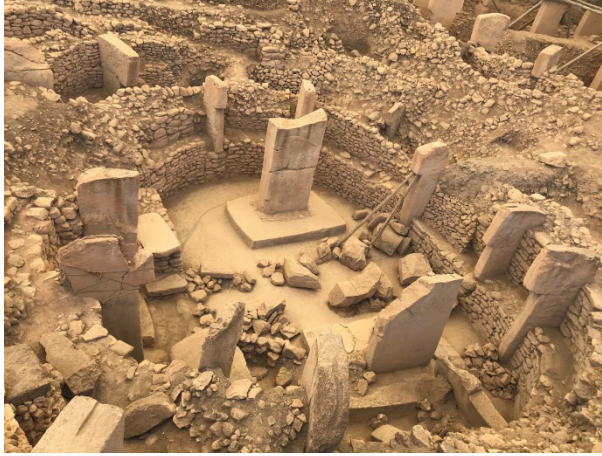
Şekil 1: UNESCO Dünya Kültür Mirası Listesine 2018 Yılında Giren Göbeklitepe