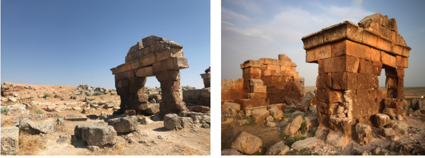
Şekil 5: Şuayb Kentinde Üçgen Alınlıklı Harabe Konumundaki Yapı Girişleri

çatılı şekilde yapıldığı sanılmaktadır. (Şekil5)