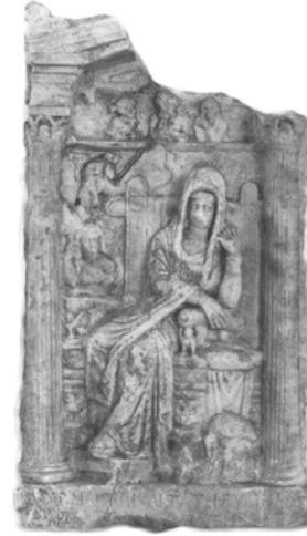
Res. 6. (Känel, Beilage 31.2)

Pamphylia stellerinin alınlık kısımlarında M.Ö. II. yüzyılın 2. yarısında karşımıza çıkan büst şeklindeki genç kız figürleri belirteçleri ve giysileri her ne kadar hizmetçileri andırırsalar da, herhangi bir izleyiciyi yansıtmamasının olası görünmediğini ve büyük