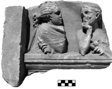
Res. 1. Side Müzesi'nden 138 Envanter Numaralı Mezar Steli Parçası

ği 16-25 cm. arasında değişmektedir. Figürlerin zeminden yüksekliği ise 5 cm. olarak ölçülmüştür. Alçak zeminde kabartma olarak büst şeklinde birbirine bakar vaziyetteki kadın figürlerinin omuz kısmına kadar olan yüksekliği 9 cm., baş kısımları ise 7 cm., her iki figürün toplam genişliği 26 cm. olarak işlenmiştir (Res. 1). Özgün yüksekliği yaklaşık 75-80 cm. olması gereken ve Hellenistik Dönem'e ait figürlü bir mezar stelinin en üst kısmında kalan 30 cm. yüksekliğinde dar bir resim alanına sahip bir stel parçasıdır 2 . Eser, benzer Pamphylia stellerinin 3 alınlık kısımlarının ölçüleri ve figürleri göz önünde bulundurulduğunda en sağ tarafta bir figür daha barındırıyor olmalıydı (Res. 7, 8, 9, 10) 4 .