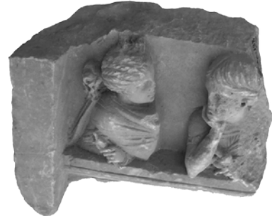
Res. 2. 138 Envanter Numaralı Mezar Steli Parçasının Genel Görünümü (Üst Kısım)

Sol tarafta betimlenmiş, kıvrımları derin olmayan bir himationa sarılmış kadın figürünün, dirsekten dik olarak kıvrılmış elbise içindeki sağ elinin avuç içi karşıdaki figüre dönük olup, sağ kolu altından öne çıkardığı sol elinde iğ ve