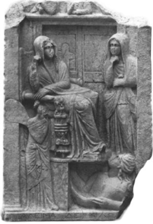
Res. 5. (Känel, Beilage 31.1)

duğu, dudakların dolgun olduğu anlaşılabilir. Tok ve yuvarlak çene ise kısmen seçilebilir. Kademeli etli boyun diğer figüre göre daha uzundur. Göz altındaki çukurluklar ve boyundaki yağlanmayı gösteren kademelenme dışında yüzde ifade oluşturacak herhangi bir kas işlenmemiştir. Yüzün sol tarafındaki harç kalıntısı sol gözün bir kısmını ve yanağı kapatmıştır.