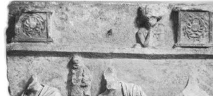
Res. 14. (Pfuhl-Möbius, Taf. 98 Nr. 646; Yaylalı, Kat. No: 121 Detay)

Sol tarafta betimlenmiş olan kadın figürü duruşuyla Olasılıkla Pamphylia Bölgesi içinden Aspendos kökenli olan ve özel bir koleksiyonunda bulunan Sbardia Tateis'in mezar steli'nin 45 alınlık