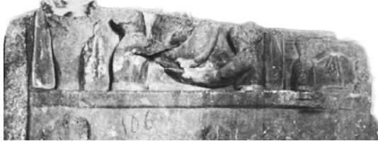
Res. 13. (Pfuhl-Möbius, Taf. 98 Nr. 641; Yaylalı, Kat. No: 108 Detay)

tasvir ile karşımıza çıkmaktadır 41 . Aynı alanda iki kadın büstünün çok nadiren karşımıza çıktığını 42 belirten Pfuhl ve-Möbius ilk örneklerin Hellenistik Dönem'de görüldüğünü ifade ederek en gösterişli, frontal görüntüdeki erken kadın protomunu M.Ö. I. yüzyılın ilk yarısına tarihlemiştir 43 . Pamphylia stellerinin alınlık kısımlarında ise M.Ö. II. yüzyılın 2. yarısında büst şeklinde