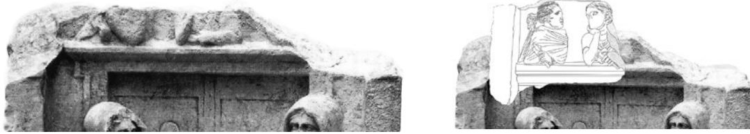
Res. 9-10. Kânel, Beilage 31.1 Detay ve 138 Env. Nolu Stel Parçasıyla Eşleştirilmesi.

yaşamı değil, alegorik bir formda insan kaderinin ölümden sonraki bakış açısını da yansıtmaktadır. Diğer bir karşılaştırma örneğimiz olan Sbardia Tateis'in mezar stelinde oturan kadın figürünün üzerindeki kadınlar da alegorik bir karakter sergilemektedirler. Bunlar ölen kadın için yas tutmayı, tersine hayatta kalanların acısını ifade etmektedirler. Oturan kadın figürünün solundaki Psykhe 26 figürü Sbardia Tateis'in ruhunun dünyevi vücudu terk ettiğini ve diğer dünyada yaşamını devam ettirdiğini simgelemektedir. Bu düşünce yukarıda alınlık bölümünde betimlenen Moira'larla da güçlenmektedir. Moira'lar aşağıdaki alanda geçen kaderi izlemektedirler 27 .