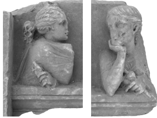
Res. 3-4. Büst Şeklinde Profilden Verilmiş Kadın Figürleri (detay)

Alın yüksek, dik ve öne çıkıktır. Alın ve kaşın önde olması sonucunda göz çukurları derinde kalmıştır. Uç kısmı kırık ve noksan olan burun yanlara doğru genişler şekilde kanatlı yapıdadır. Ağız, dudaklar ve çene büyük oranda kırık ve noksandır. Ancak korunmuş olan ve orta büyüklükteki ağzın hafif aralık ol-