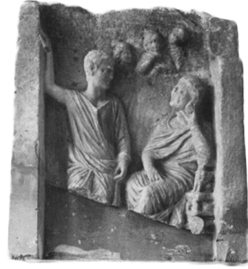
Res. 15. (Pfuhl-Möbius, Taf. 154 Nr. 1032)

kökenli, naiskos formlu stelin dar resim alanında büst şeklinde betimlenmiş, el kol duruşu 138 envanter numaralı stel parçası üzerindeki figürlere benzer görünüm yer almaktadır. En üst kısmı kırık ve noksan olan Zowaleima'nın mezar steli'nde soldaki figürün hafif öne eğilmesi, sağ elininin dirsekten dik olarak kıvrılmış olması, sağ kolu altından öne çıkardığı sol elinde ise bir şeyler (iğ ve öreke ?) tutması, aynı şekilde sağdaki figürün de sağ elini kıvrırma şekli (olasılıkla pudicitia hareketi içinde avuç içini çenesine yaslıyordu), kıvrırarak öne çıkarmış olduğu sol elinde bir şeyler (iğ ve öreke ?) tutması 138 envanter numaralı stel parçası üzerindeki figürlere neredeyse bire bir benzemektedir (Res. 5, 9, 10).