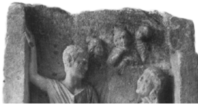
Res. 16. (Pfuhl-Möbius, Taf. 154 Nr. 1032 detay)

Pamphylia stelleri dışında 138 envanter numaralı stel parçası üzerindeki figürlerin tip olarak en yakın örneklerine Smyrna da rastlanılmıştır 52 . Bunlardan bir zamanlar İzmir'deki Euangelos okulunda bulunan stel 53 Yaylalı'ya göre figürlerinin stiliyle karşımıza tipik bir İzmir steli olarak çıkmaktadır 54 . Alttaki figürlerin üzerindeki çıkıntının üstünde ortada soldaki khiton giyimli iki erkek protomu yuvarlak bir tabelayı (kalkan) asmak için kaldırmaktadırlar. Erkek figürlerinin solun-