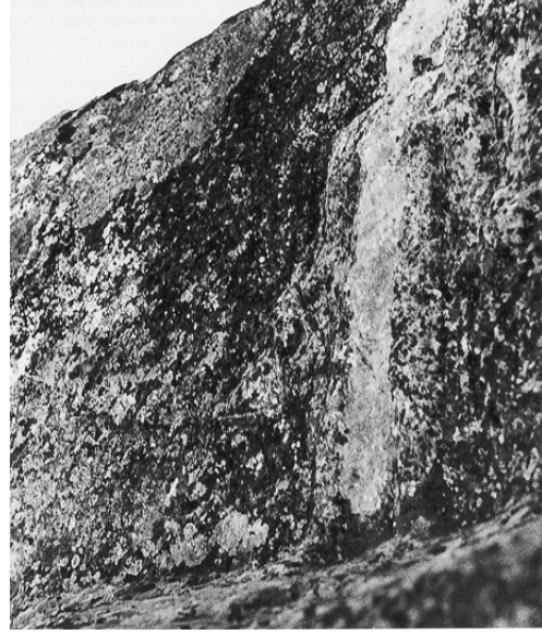
Fig. 9 (Waelkens - Loots 2000, fig. 244)

Labarre ve Özsait, Herakles kültürünün, yine atribüsü budaklı sopa olan Atlı Tanrılar kültürüne olan inanç benzerliğinden dolayı bölgede kolay bir şekilde yayıldığını belirtmişlerdir. Bu külte Pisidia Bölgesi'nin güneybatısında, Lykia ve Pisidia sınırında, antik Milyas'ta rastlanılır 37 . Bu iki araştırma-