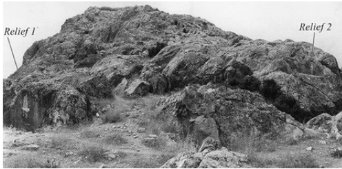
Fig. 3 (Labarre et al. 2010 fig. 25)

Yere sarkmış aslan postu ve dışı izleyiciye dönük sağ elle tutulan budaklı sopa atribüleri figürün Herakles olarak kimliklendirilmesini kolaylaştırmaktadır. Budaklı sopa ve aslan postu Herakles'in en bilindik atribüleridir 9 . Bu atribüler Erken Hellenistik Dönem'den başlayarak Pisidia sikkeleri üzerinde görülür 10 . Kabartmanın -betimlenişdeki sadeliği nedeniyle- Herakles'in görevlerinden ( athloi ), işlerinden ( prakseis ) ya da diğer işlerinden ( parerga ) herhangi birisi ile ilişkilendirilmesi zordur 11 .