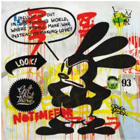
Fig. 3. Giacomo Spazio, Bomb the World, 2011, Ahşap üzerine karışık teknik. Contemporary İstanbul 2011 kataloğu.