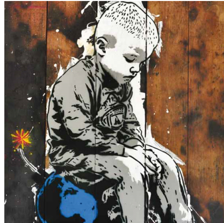
Fig. 4. Alias, You Need Me, 2011, Tuval üzerine karışık teknik. Contemporary İstanbul 2011 kataloğu.