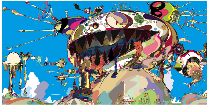
Fig. 9. Takashi Murakami, 'Tan Tan Bo Puking a.k.a. Gero Tan. 2002, panel üzerine akrilik, 2002. Fotoğraf: Elif Varol Ergen, Museum Moderne Kunst Frankfurt, 2008.