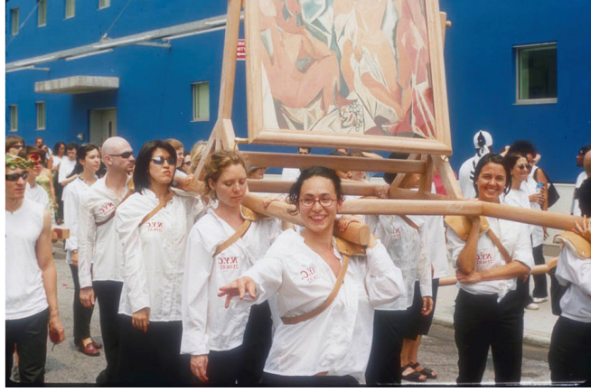
Fig 1. Francis Alÿs'in 'MOMA'nın taşınması' performans'ı. http://publicartfund.org/view/exhibitions/5997_the_modern_procession