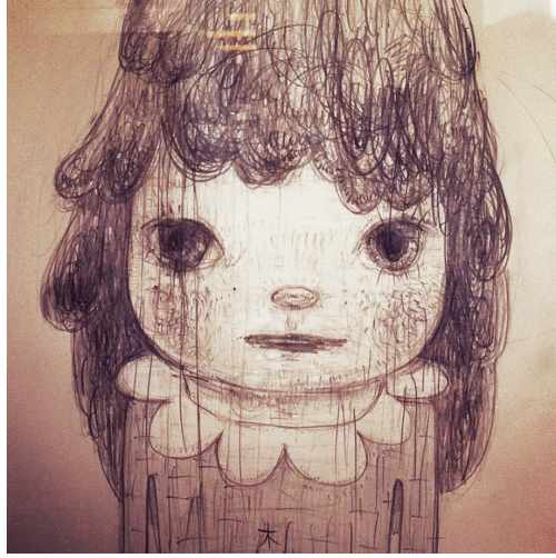
Fig. 2 Desen, Yoshimoto Nara. Art Basel 2012.