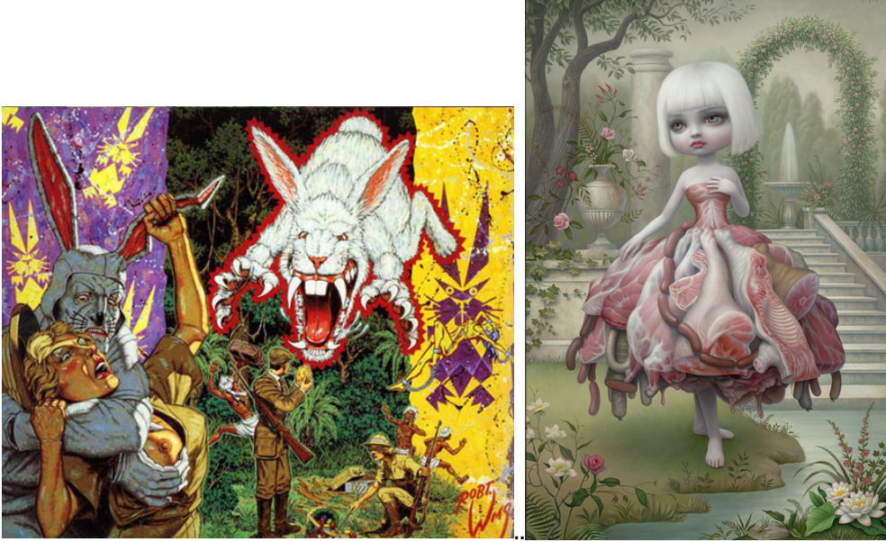
Fig. 7: 'Thumpert the fascist cotton tail', Robert Williams. ( http://www.robtwilliamsstudio.com/ ) Fig. 8. Mark Ryden, 'Incarnation' panel üzerine yağlı boya, 2009. http://www.markryden.com/paintings/gay_90s/index.html