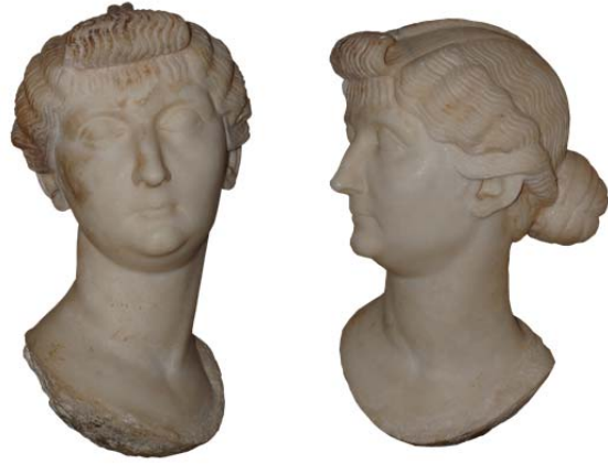
Fig. 3a-b. Ephesos/Yamaçevler Portresi

Ephesos Yamaçevler'de ele geçen Livia'nın büst şeklinde yapılmış portresi 3 (fig. 3a-b) aşağıya doğru daralan yüz şekli, hafif dışarı çıkıntılı çenesi, yüzün yumuşak dokusunda belli belirsiz hissedilen elmacık kemikleri, ince üst dudağa sahip ağız yapısı ve uzun burnu ile Marbury Hall tipi içinde değerlendirilmesine olanak sağlar. Diğer taraftan büyük gözleri ve kavisli kaşları, portreyi Fayum tipine yakınlştırır. Gıdığı ise her iki tipe göre de daha dolgun olarak gösterilmiştir. Ancak (profilden bakıldığında) yüzün şeklinin belirlenmesinde asıl önemli özelliklerin Marbury Hall tipinden almış olması, bu tipe daha yakın durmasına olanak sağlar.