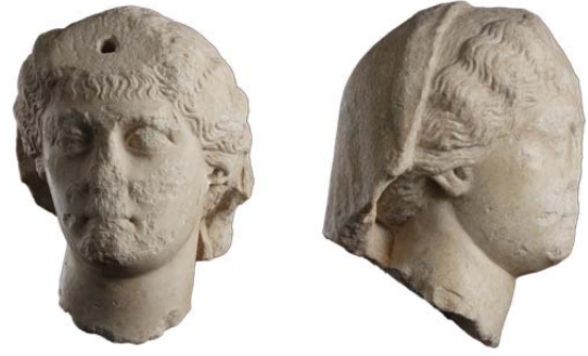
Fig. 6a-b. Aphrodisias Portresi (Smith 2006, lev. 61 / no. 80)

Portreler içinde irdelenecek en son eser, Aphrodisias'takidir 7 (fig. 6a-b). R.R.R. Smith 8 ve E. Bartman 9 tarafından Marbury Hall tipi içinde değerlendirilen portrede birkaç noktanın öne çıkarılmasında fayda vardır. Khiton ve himation giyimli, ayakta betimlenmiş bir heykele ait olan portrenin başı himation 'u ile yarıya kadar örtülmüştür. Başın üst kısmındaki delikten sonradan yapıлып takılmış olduğu anlaşılan nodus da şu anda kayıptır. Bu özelliği portrenin noduslu iki tipinden ya Marbury Hall ya da Fayum tipinden birisini temsil ettiğini düşünmemize olanak sağlar. Ancak bu iki tipi detayda birbirinden ayırmamıza olanak sağlayan nodusun kayıp oluşu, ayrıca başın örtülü olmasından dolayı arkasındaki saç düzenlemesinin bilinmemesi, sözü edilen tiplerden hangisini temsil ettiğini bildirmeyi olanaksızlaştırır.