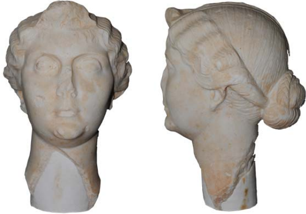
Fig. 5a-b. Bodrum Sualtı Arkeoloji Müzesi

Ephesos'taki diğer örnek ise Yukarı Agora'da bulunmuş khiton ve himation giyimli Livia heykeline aittir 4 (fig. 4a-b). Livia'nın yüzünün ovaliği, çenesinin kısıklığı, kavisli kaşları, büyük gözleri, belirgin elmacık kemikleri ve küçük ağzı, Fayum tipi ile benzerlikler içinde olduğunu kanıtlar. Ancak yüz ile ilgili bir noktanın üzerinde durulması gerekir. Portre küçük ağzı ile her ne kadar Fayum tipine benzerlik gösterse de, dudaklarının kalınlığı ve aralarının açıklığı Fayum tipinde rastlanılmayan unsurlardır 5 . Portrenin