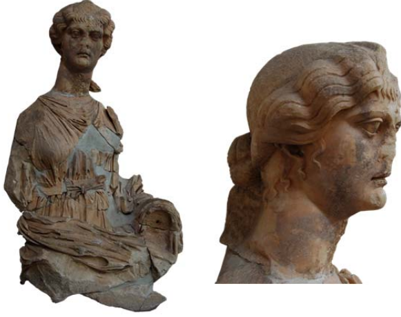
Fig. 4a-b. Ephesos/Yukarı Agora Portresi

alın ortasındaki nodusunun kırık, baş üzerindeki saçlarının ve topuzunun işlenmemiş olması saç düzenlemesi için detaylı inceleme yapmayı engeller. Buna karşın kulak önlerinde ve ense kökünde uygulanan küçük saç perçemlerinin tipolojik olarak Fayum tipindeki uygulamayı anımsattığı görülür. Ancak sadece bu özelliğinden hareketle saçlarda Fayum tipine sadık kalınmıştır demek yanlış olur. Çünkü yüzün her iki kenarında korunmuş olan dalgalı saçları tıpkı Ephesos-Yamaçevler'deki portre gibi hem Marbury Hall hem de Fayum tipine yabancı bir uygulamaya sahiptir. Bunun yanı sıra bu portrede tıpkı Ephesos Yamaçevler'deki gibi nodusun altında alnını boylu boyunca kaplayan ve yine her iki tipe yabancı olan küçük saç perçemlerine sahiptir.