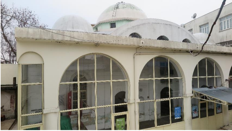
Resim 4. Çarşı Camii Genel Görünüş

çarpmaktadır. Bir diğere bacini yuvası da minare kaidesinin son bulduğı silmenin ortasına yerleştirilmiştir. Bacinilerin yoğun olarak görüldüğü diğere bir bölüm minarenin pabuç kısmıdır. Alt kısım kare şekilden sekizgene geçiş için pahlanmış şekildedir ve doğu cephesinin ortasına denk gelen bölgede eş kenar dörtgen (baklava dilimi) oluşturacak şekilde dört adet yeşil tek renk sırlı bacini yer almaktadır. Bunlardan yan düzlemde olan iki tanesi dökülmüş, dik düzlemde olanlar ise yerindedir. Sekizgen şekilli olan pabucun üst kısmında her cephede üç dilimli nişlerle hareketlilik sağlanmıştır. Eski saray camii minaresinde yer alan nişleri hatırlatan bu nişlerin ortadaki kemer diliminin içinde ve altta iki kenarda birer tane olmak üzere üçlü bir bacini düzenlemesi görülmekte fakat buradaki seramiklerin de tümü dökülmüştür. Kalan örneklerin boş olan alanların da tek renk yeşil sırlı seramik çanaklarla dolu olması gerektiği kanısındayız. Bacinilerin tutturulmasında mih kullanılmadığı göze çarpmaktadır.