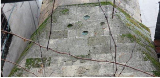
Resim 6. Çarşı Cami Minaresinde Bulunan Bacinilerden Detay