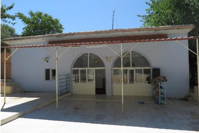
Resim 12. Üçgöz (Sofraz) Hasan Paşa Cami Genel Görünüm

Adıyaman Besni ilçesine bağlı Sofraz (Üçgöz) Beldesinde yer alan yapı, 1963 yılında betonarme olarak yenilediği için orijinalliğini yitirmiştir (Bayhan-Salman, 2004, 53). Minare kaidesinde yer alan kitabesine göre H. 1130/M. 1718 tarihlidir. (Kılavuz, 2005: 95). Caminin orijinal kalan bölümü olan minaresi kuzeybatı köşede bağımsız olarak yükselmekte olup, kare kaideli, çokgen gövdeli, tek şerefelidir. Minarenin konumuz kapsamında değerlendirilecek olan bacinileri, on ikigen gövdenin kuzey ve güney yönleri hariç diğer on kenarda yer almaktadır. Bugün tamamına yakını dökülmüş olan bacinilerden, minarenin kuzeybatı ve güneydoğu yüzünde üç adet örnek görülmektedir. Bu seramiklerin firuze renkli tek renk sırlı oldukları anlaşılmaktadır. Bacinilerin çakılı oldukları alanlardan seramiklerin çap ve derinlik olarak yakın özelliklerde oldukları anlaşılmaktadır. Ayrıca seramiklerin çakıldıkları mihlardan benzer şekilde çakıldıkları da anlaşılmaktadır. Kalan mihlardan seramiklerin merkezden değil, gövde kısmından üçgen oluşturacak şekilde çakıldıkları görülmektedir.