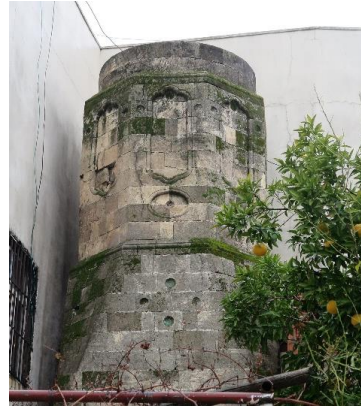
Resim 5. Çarşı Cami Minare Kaidesi