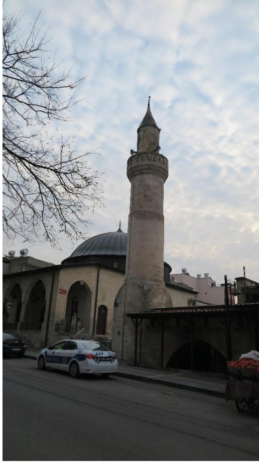
Resim 7. Kab Cami Genel Grnm