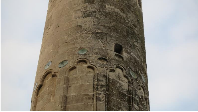
Resim 2. Eski Saray Cami Minaresi ve Bacini Detayları