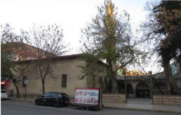
Resim 3. Eski Saray Cami Genel Görünüm