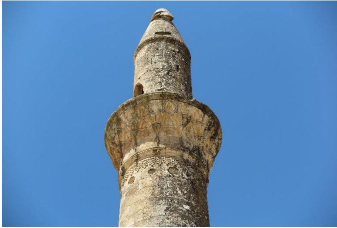
Resim 10-11. Üçgöz (Sofraz) Adsız Minare ve Bacini Detayları