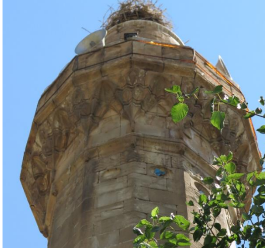
Resim 13-14. Üçgöz (Sofraz) Hasan Paşa Cami Minaresi ve Bacini