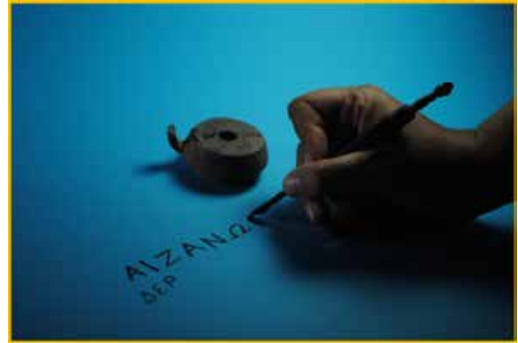
Fig. 10. Tramentarium ve Stylus

Mezar içinde bulunan unguentariumlar 45 parçalar halinde ve üç adettir. Definden sonra, içindeki sıvı veya parfüm, ölenin yakınları, asker arkadaşlarınınca mezara dökülerek bırakılmış olmalıdır. Latince unguent yani merhem kelimesinden türetilen unguentarium kokulu yağ, merhem ve sıvı ilaç konan küçük şişeciktir 46 . Özellikle nekropolislerde bulunan pişmiş toprak unguentariumların üretimi Erken Helenistik çağda başlamış ve MS VII. yüzyıla kadar devam etmiştir 47 . Unguentariumlarda ama malzeme olan kil geçiren olduğu için kısa sürede muhafaza ettiği sıvıyı sızdırıyordu. Mezardaki kötü kokuları engellemek için bu geçiren özelliğinden faydala-