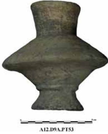
Fig. 11. Lykion , Aizanoi Kazı Arşivi

nılmış 48 olunabilir. Anderson-Stojanovic, unguentarium sayısının törene katılan kişi sayısını işaret ettiğini önermiştir 49 . Buna göre değerlendirilirse; gömü töreninde 3 kişinin unguentarium ları kullandığı düşünülebilir. Çavdarhisar yöresinde yapılan etno-arkolojik araştırmada ilginç bir bilgiye ulaşılmıştır. Şöyle ki “her kimin eşi ölmüşse ve tekrar evlenmek isterse; eşinin mezarı başına gelerek evleneceğini bildiriyor ve çömlek kırarak artık beni bırak” demektir. Mezarda kap kırmak antikçağ Aizanoi’undan, günümüz Çavdarhisar’ına geçmiş bir adet miydi, emin değiliz, ancak bölgede hem geçmişte hem şimdi, bazı mezarların başında kap kırıldığını artık bilinmektedir.