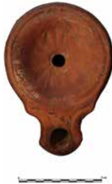
Fig. 8. Kandil