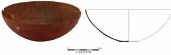
Fig. 4. İnce Cidarlı Kâse, Aizanoi Kazı Arşivi

Mezar dışına konulan bir diğer eşya kobalt mavisi cam unguentarium 22 (Fig. 5). Bu tür mavi, yeşil veya lacivert renkli cam unguentariumlar MS I. yüzyıl ortalarına kadar yaygın kullanılmıştır 23 . Üfleme tekniğiyle yapılan bu zarif, kobalt mavisi cam unguentarium , kandilli kâsenin hemen yanına