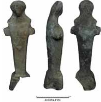
Fig. 9. Herrmes Hermesi, Aizanoi Kazı Arşivi