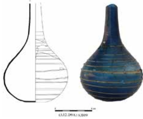
Fig. 5. Mavi Cam Unguentarium, Aizanoi Kazı Arşivi