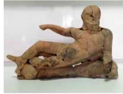
Fig. 12. Herakles Heykelciği

Mezar içinde bulunan ve mezar sahibinin mesleğine dair son noktayı koyan ise minyatür demir kalkan ve üstüne yerleştirilen terracotta Herakles heykelciğidir 55 (Fig. 12). Herakles, symposium tipindedir. Arslan postu üzerine uzanmış ve karşıya bakar biçimde betimlenmiştir. Kırık sol elinde benzerlerine göre değerlendirilirse; bir kantharos tutuyor olmalıdır. Sağ bacak diğeri üzerine çapraz atılmıştır. Kalıp tekniğinde olup, iki parçadır. Symposium tipi Herakles, yunan vazolarında MÖ VI. yüzyıldan itibaren betimlenir 56 . MÖ yaklaşık 360’lara verilen Kroton’daki