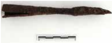
Fig. 7. Demir Mızrak Uçları

Mezarın içinde bir adet kandil 39 bulunmuştur (Fig. 8). Üstündeki is izinden yakılarak bırakıldığı