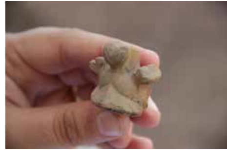
Fig. 13. Minyatür Miğfer

Mezar kenarında küçükbaş hayvanlara ait yanmış kemikler bulunmuştur. Roma döneminde mezar başında boğa, koyun, kuzu, tavuk gibi hayvanlar kesilir ve kanları ölünün ruhuna gitmesi için toprağa akıtılır 63 , Manes'e; onu beslemek ve güçlendirmek için sulandırılmış şarap/sütle adak sunu-