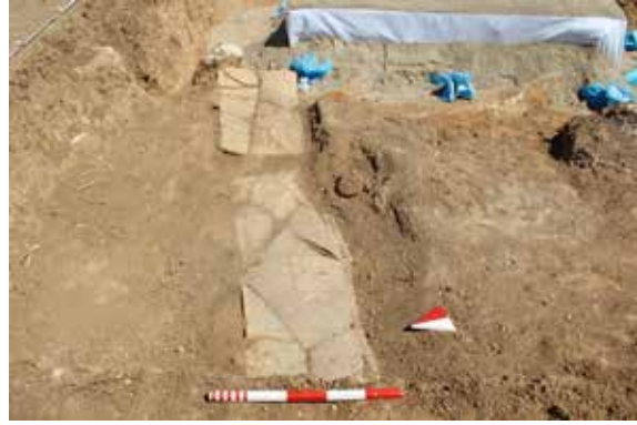
Fig. 2. Heraklesli Mezar

Tiyatronun kuzeyinde bulunan kuzey nekropolis'te 2012 yılında tespit edilen bu mezar; terracotta plaka kapakla örtülmüş basit toprak bir mezardır (Fig. 2). Uzunluğu 1,90 cm, genişliği 46 cm'dir. Mezarda bustum 7 yani birincil kremasyon uygulanmıştır. Ölü, rogus 8 üstüne yerleştirilen ahşap torusa yatırıldıktan sonra kremasyon başlatılmış olmalıdır. Tespit edilen demir çiviler ve köşebentler, bireyin torusa (sedye) konduğunu işaret eder 9 . Bununla birlikte çiviler ve köşebentler bazen eşyaların muhafaza edildiği ahşap kutu ya da sandığa da ait olabilir 10 . Nekropolis'te bazı mezarlarda bulduğumuz çiviler ise bu mezardaki örneklerden daha küçük olup, ayakkabı tabanlarında kullanılan kabaladır 11 , ancak bu mezardaki demir çivileri ebat ve mezardaki konumlarına göre torus ile ilişkilendirmek daha makuldür.