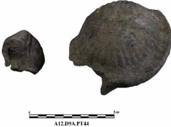
Fig. 6. İstiridye Kabuğu Biçiminde Kap, Aizanoi Kazı Arşivi