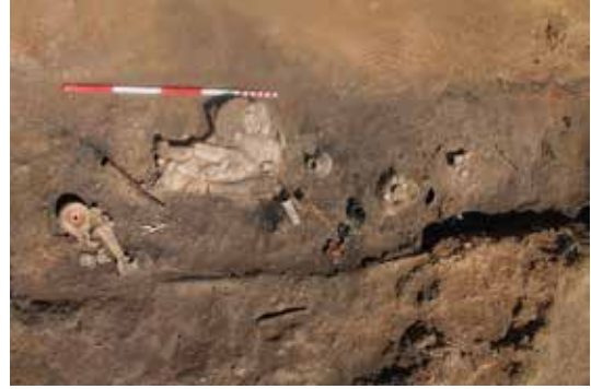
Fig. 14. Heraklesli Mezar