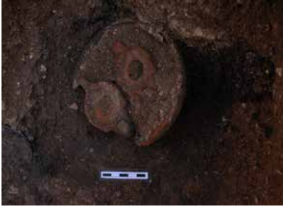
Fig. 3. Kandilli Kâse, Aizanoi Kazı Arşivi

Kapak kenarındaki yanık izine göre, kremasyon ardından, alan tam soğumadan terracotta kapakın bulunduğu anlaşılır. Mezar zemini nekropolis'teki diğer örnekler gibi sıkıştırılmış topraktır. Mezarın hem iç hem dışına eşyalar yerleştirilmiştir. Bunların bir kısmı ölenin olasılıkla şahsi, bir kısmı öteki dünyada muhtemelen ihtiyacı olacağı düşünülerek akraba veya arkadaşları tarafından bırakılan, diğerleri ise Aizanoi veya mezar sahibinin ait olduğu kültürün ölü gömme geleneğiyle ilişkili eşyalardır.