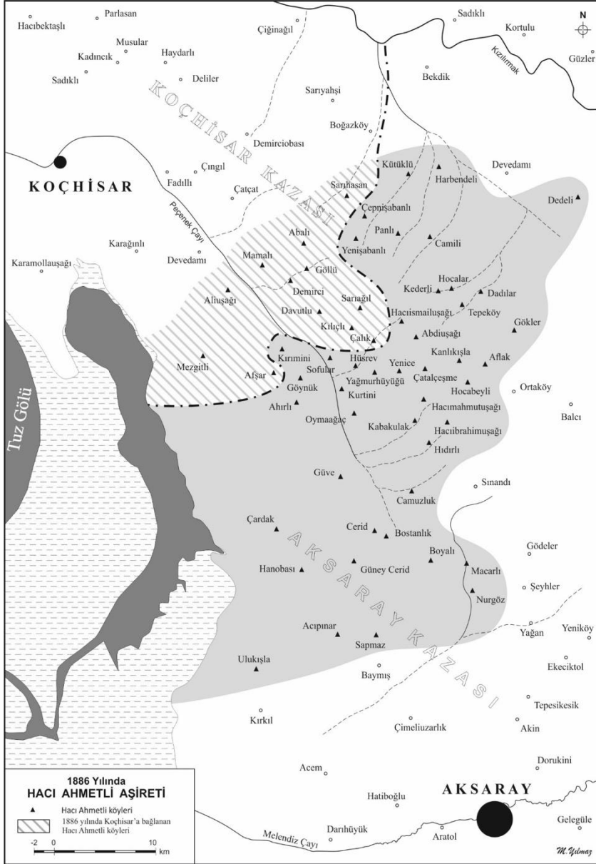
Harita II: 1886 Yılında Hacı Ahmetli Aşireti