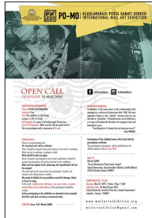
Şekil 12. 11 Haziran – 01 Temmuz 2019'da akademisyen Hikmet Şahin 'in küratörlüğünde Konya'da Selçuk Üniversitesi, Güzel Sanatlar Fakültesi, Grafik Bölümü 'nde organize edilen "PO-MO Uluslararası Posta Sanatı Sergisi" için hazırlanan açık çağrı metni (Eng.).

2019'da akademisyen Hikmet Şahin 'in küratörlüğünde Konya'da Selçuk Üniversitesi, Güzel Sanatlar Fakültesi, Grafik Bölümü çatısı altında "PO-MO Uluslararası Posta Sanatı Sergisi" takdim edilmiş ve sergide ziyaretçilerin ilgisine "Postmodern" teması altında toplanan eserler sunulmuştur. Etkinliğe 33 ülkeden 890 katılımcı 2000 eser ile başvurmuştur. 18