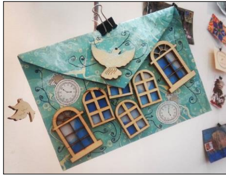
Şekil 7. "Barış" temalı "II. Uluslararası Posta Sanatı (Mail-Art) Sergisi ", Bahariye Sanat Galerisi, İstanbul, 04-10 Haziran 2016. Sergiden GörSELLER.