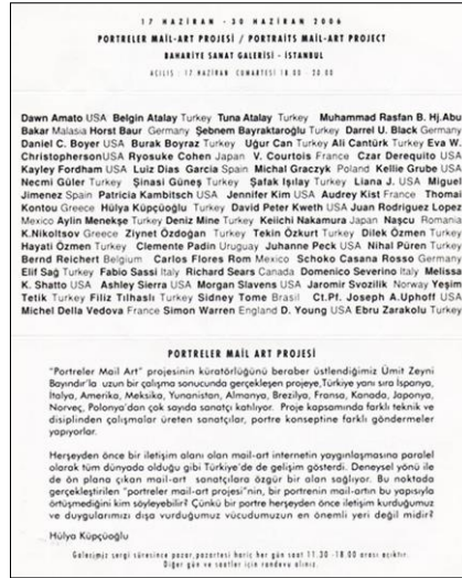
Şekil 4. "Portreler, Mail-Art Projesi" Bahariye Sanat Galerisi, İstanbul, 17 - 30 Haziran 2006, Davetiye. Kaynak. Bahariye Sanat Galerisi Arşivi.