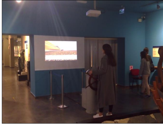
Şekil 2. Alanya Müzesi / Alanya. Ziyaretçiler ile etkileşime geçebilen sergilemeye yardımcı teknolojilerden biri. Ziyaretçinin / Kullanıcının bu teknoloji ile sanal ortamda antik bir gemi kullanma deneyimi yaşamaya hedeflenmiştir. 2018.

Sanat ortamlarının iletişim teknolojileri ile yaklaşması sadece sanat eserinin biçimselliğini ya da paylaşımını etkileyen bir durum da değildir. Vizyon sahibi sanat müzeleri ile galeriler iletişim teknolojilerindeki ilerlemeleri (hedef kitleri nezdinde) sergilemeye yardımcı araçlar için bir fırsat olarak görmekte 1 ve bu nedenle ilgili olanakların getirilerinden azami düzeyde yararlanmaya çalışmaktadır.