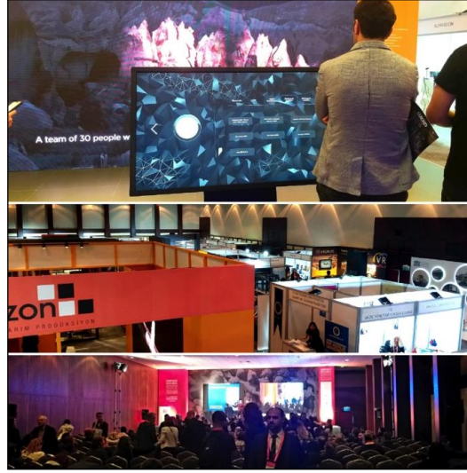
Şekil 3. Heritage İstanbul 2019 Restorasyon, Arkeoloji ve Müzecilik Teknolojileri Fuarı & Konferansı / İstanbul. Müzecilik disiplinine hitap eden fuar ve konferanslar söz konusu alanı ilgilendiren teknolojileri gözlemlemek için önemli platformlardır. 11-13 Nisan 2019.

Posta sanatı 4 etkinlikleri; iletişim konusunda eski yöntemleri tercih eden ve yukarıda betimlediğimiz yeni dünyada varlıklarını sürdürmeyi başaran sanat organizasyonlarıdır. Araştırmada bu etkinlikler Türkiye merkezli biçimde ele alınmıştır. Posta sanatı etkinliklerine 1970'lerin sonunda katılan sanatçılarımız olmasına rağmen 5 , etkinliğin yurt içindeki organizasyonlarının 2000'ler ile yaygınlaşması nedeniyle güncel bir çizgi takip edilmiştir. Literatür taraması eşliğinde incelenen temel konu; posta sanatının kültürel etkileşim adına Türkiye'ye sunduğu / sunabileceği olanaklardır. Bu olanakların etüt edilmesi için ilk olarak kültürel etkileşim kavramı irdelenmiştir. Ardından kısa bir tarihçe ile posta sanatına değinilmiş ve yurt içindeki etkinlik seçkisinden bilgiler sıralanmıştır. Sonuç başlığı altında da eldeki veriler üzerinden genel bir değerlendirme yapılmış, mevcut durum tartışılmıştır.