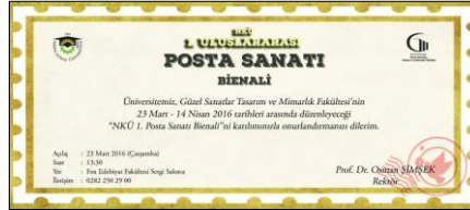
Şekil 9. Küratörlüğünü Mustafa Cevat Atalay 'ın yaptığı N.K.Ü. 1. Uluslararası Posta Sanatı (Mail-Art) Bienali'nin davetiyesi (Tur.). N.K.Ü. Güzel Sanatlar Tasarım ve Mimarlık Fakültesi, Tekirdağ, 23 Mart 2016.

2017'de Tekirdağ Namık Kemal Üniversitesi, Güzel Sanatlar Tasarım ve Mimarlık Fakültesi 'nde oldukça geniş katılımlı bir posta sanatı bienali (1. Uluslararası Posta Sanatı Bienali) hayata geçirilmiştir. Kurum akademisyenlerinden Mustafa Cevat Atalay ve ekibinin organize ettiği "Gelenek" temalı bu bienalde üniversite kapılarını ( Fen Edebiyat Fakültesi Sergi Salonu 'nda) 58 ülkeden 1.412 eser için açmıştır. Takiben (iki yıl sonra) "Kare" teması ile ikinci bir etkinlik daha gerçekleşmiş ve 32 ülkeden 855 sanatçıya ait 1155 çalışmanın sergilenmesi ile bienal çağrısı geniş bir yankı bulduğunu göstermiştir (2019). 15