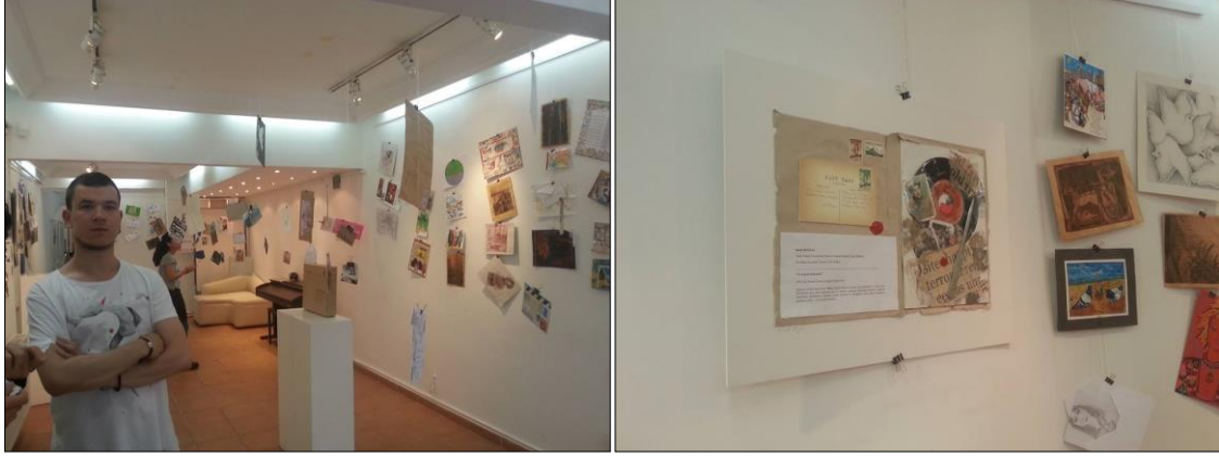
Şekil 5 ve 6. "Barış" temalı "II. Uluslararası Posta Sanatı (Mail-Art) Sergisi ", Bahariye Sanat Galerisi, İstanbul, 04-10 Haziran 2016. Sergiden GörSELLER.