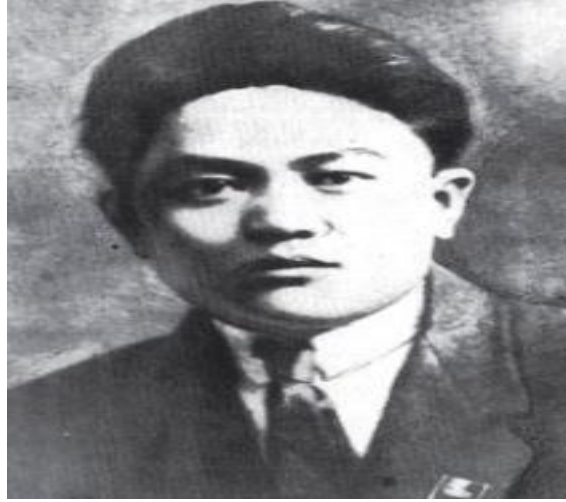
Resim 1. Cusup Abdrahmanov (1901-1938)