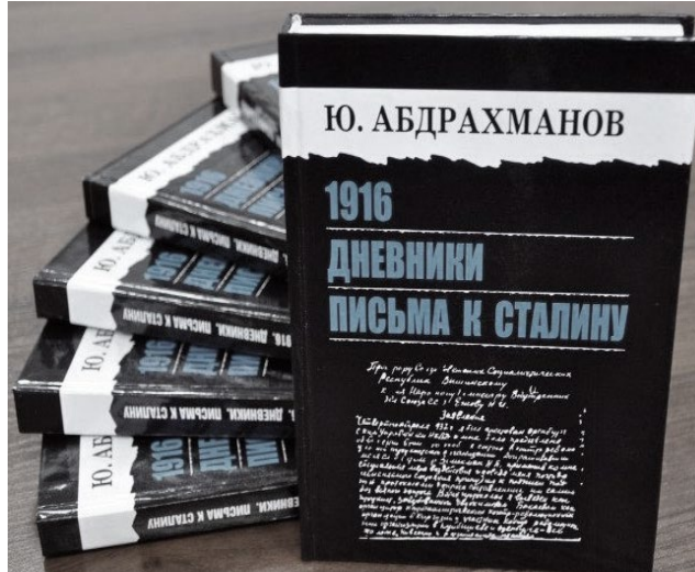
Resim 2. C.Abdrahmanov'un günlüğünün 2013'te Rusça yayınlandığı kitap hali