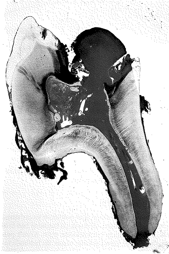
Resim 3: Pulpa polipinin histolojik görünümü - Yoğun iltihap hücreleri (65x), (H+E).