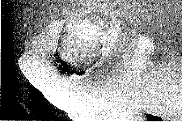
Resim 1: 46 nolu dişte pulpa polipi

Histolojik bulgular: Hiperplastik doku esasta granülasyon dokusudur ve ince bağ dokusu fibrillerinden oluşur. İltihabi hücre infiltrasyonu, lenfositler ve plazma hücreleri bazı olgularda da polimorf nükleer lökositlere rastlanmaktadır. Bazı olgularda fibroblast ve endotel hücre proliferasyonu öne çıkmaktadır. Bu granülasyon dokusu genellikle yüzeyine epitel hücrelerini implantasyonu sonucunda epitelize olur. Bu epitel tabakasının mesenkimal hücrelerin farklılaşması sonucunda da olabildiği ve % 12 ile % 23 olguda yüzeyin epitelle kaplı bulunduğu bildirilmiştir (3). Süt dişi poliplerinin sürekli dişlerinkinden daha sıklıkla epitelle örtülü olduğu görülmüştür. Bu epitel çok katlı yassı epiteldir ve ağız mukozasına çok benzer. Bazı olgularda yanak mukozası hiperplastik doku kitlesi ile değişim halindedir ve epitel hücrelerinin direkt olarak transplante olabileceği bildirilmiştir (1,2,3,4,5).