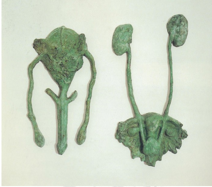
Resim 2: Kiki Smith, "Rahim", 56.9 x 43.2 ve 62 x 25.4 cm, 1986