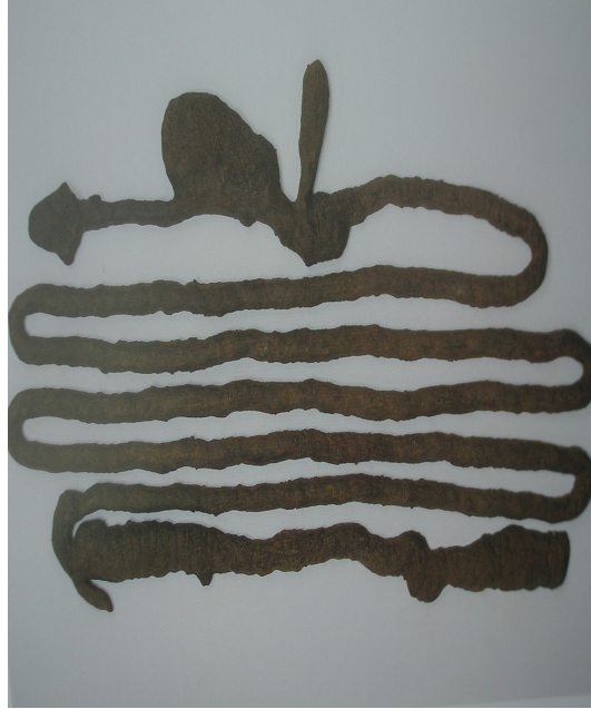
Resim1: Kiki Smith, "Sindirim Sistemi", 157.5 x 68.5 cm, 1998-2004

"Kiki Smith'in sanatı ayrıştırılmış, parçalanmış, yaralanmış vücut parçalarıyla ilgilidir." 9 İç organların sunumu aynı zamanda yaşayan vücudun kırılğanlığını da sembolize eder. "Kiki Smith'in içeriden dışarıya doğru olan çalışmaları, gerçekliğin bedensel duyularının tat, dokunuş, kokunun da görme kadar önemli" 10 olduğunu vurgular. (Resim1,2)