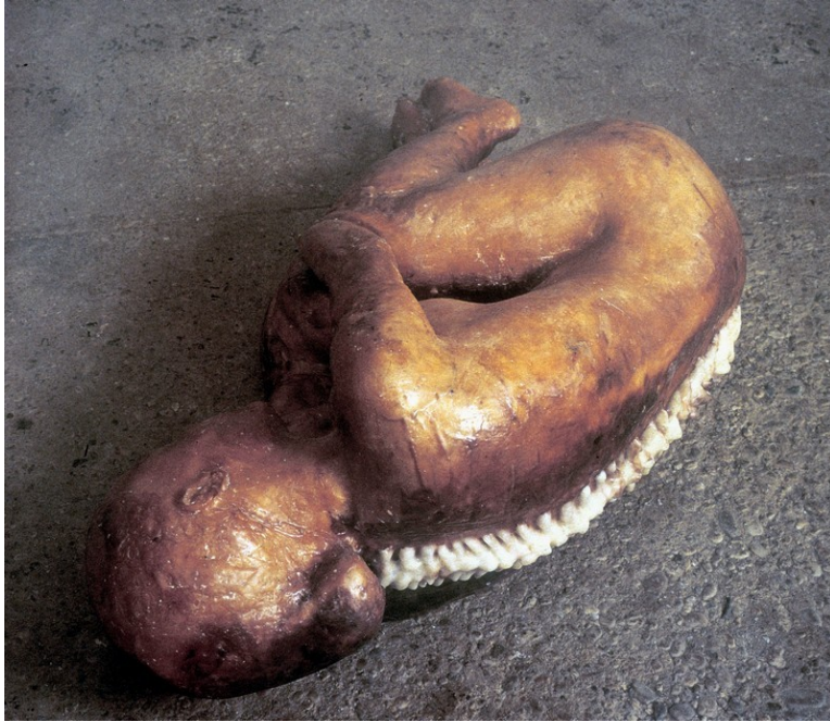
Resim 5: Kiki Smith, "Omurga", 1990

Bedenin diğer parçalarını olarak kemikler ve iç organların incelendiği çalışmalarda (Resim 3,4) görünmeyeni görünür yapan Kiki Smith; kadavraya benzer figürde ise, çürümüş beden üzerinde görülen