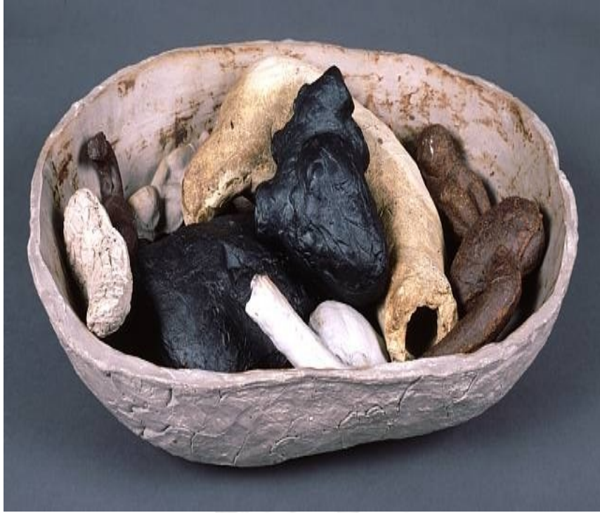
Resim 4: Kiki Smith, "İç Organlar", 1990