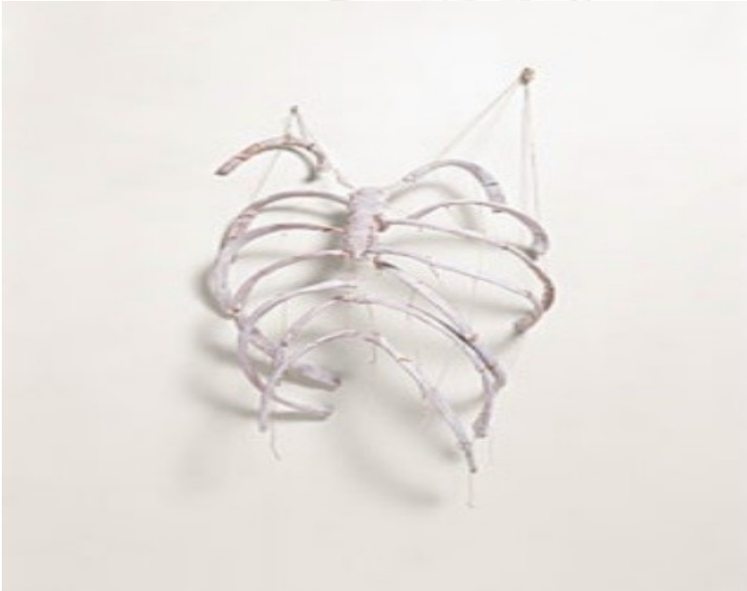
Resim 3: Kiki Smith, "Kaburgalar", 55.9 x 43.2 x 25.4 cm 1987