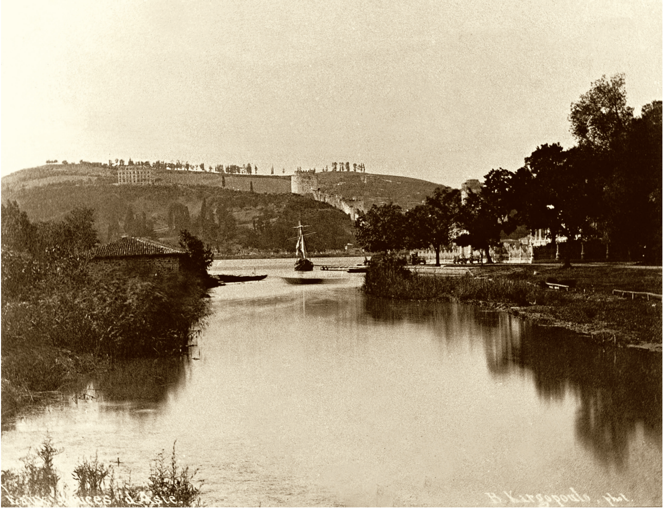
3 Göksu Deresi: İstanbul Boğazı'nın Anadolu Yakası'nda bulunan, Anadoluhisarı'nın yakınından denize dökülen dere. yaklaşık 1850

mültecilerindendi. Ebbüzziya Tevfik (1849-1913) 4