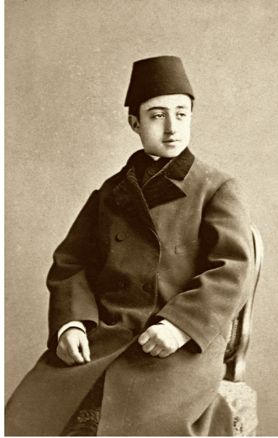
7 Yusuf İzzeddin Efendi (1857-1916) Sultan Abdülaziz'in Dürrinev Başkadınefendi'den doğan oğlu