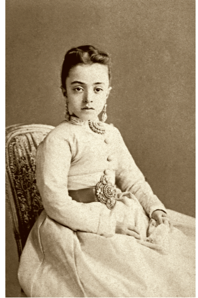
8 Sultan Sâliha (1862-1942) Sultan Abdülaziz'in Dürrinev Başkadınefendi'den doğan kızı