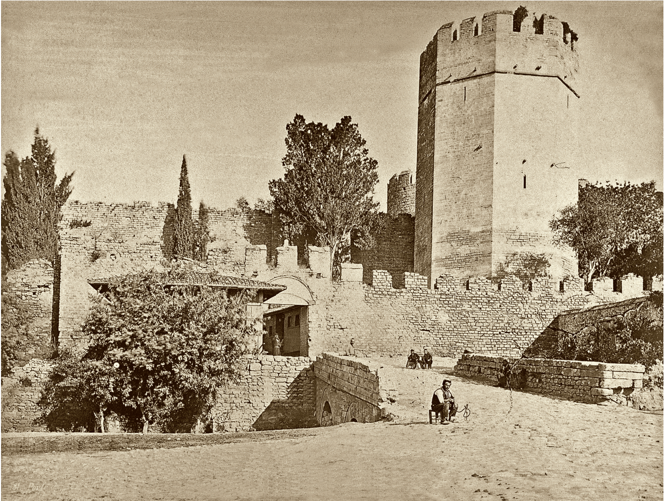
4 Yedikule: Bu b lge, Pascal S bah'ın fotođraflarında sık a kullanılmıřtır.  zellikle kule, kapı ve k pr y  i ine alan fotođraftaki b l m nerede ise aynı a ıdan deđiřik tipler kullanılarak yaratılan kompozisyonlarla  ekilmiřtir. Fotođraf: Pascal S bah, yaklaşık 1860.