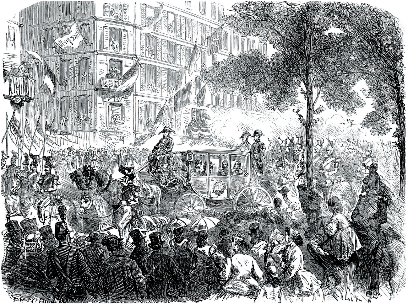
11 Sultan Abdülaziz'i Paris'te karşılayanlar

Abdullah kardeşler yurt dışındaki ilk büyük başarılarını, 1867 yılında Paris Uluslararası Sergisi'ndeki eserleriyle yakaladılar. Serginin açılışına davet edilen Sultan Abdülaziz, imparatorluk tarihi boyunca yurt dışına giden ilk sultan olacaktı. (Resim 11) Bu nedenle Paris sergisinin Osmanlı İmparatorluğu'na ayrılan bölümünde büyük bir