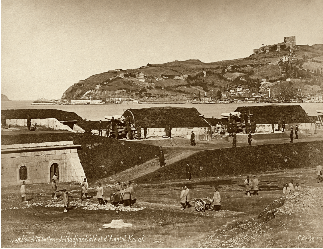
14 Anadolukavağı, Fotoğraf: Guillaume Berggren, 1890