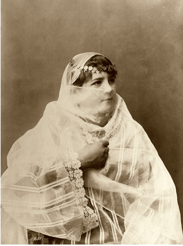
13 Genç Kadın, yaklaşık 1870