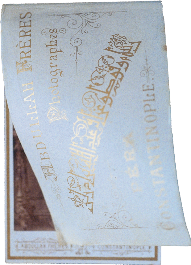
16 Fotoğraf Kartı

_____, Osmanlı İmparatorluğu'nda Fotoğrafçılık 1839-1923 , 2. bs., Yapı Endüstri Yayınları, İstanbul 2017.