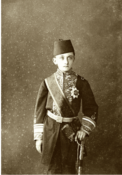
6 Şehzade Mahmud Celâleddin Efendi (1862-1888) Sultan Abdülaziz'in Edâdil Kadınefendi'den doğan oğlu