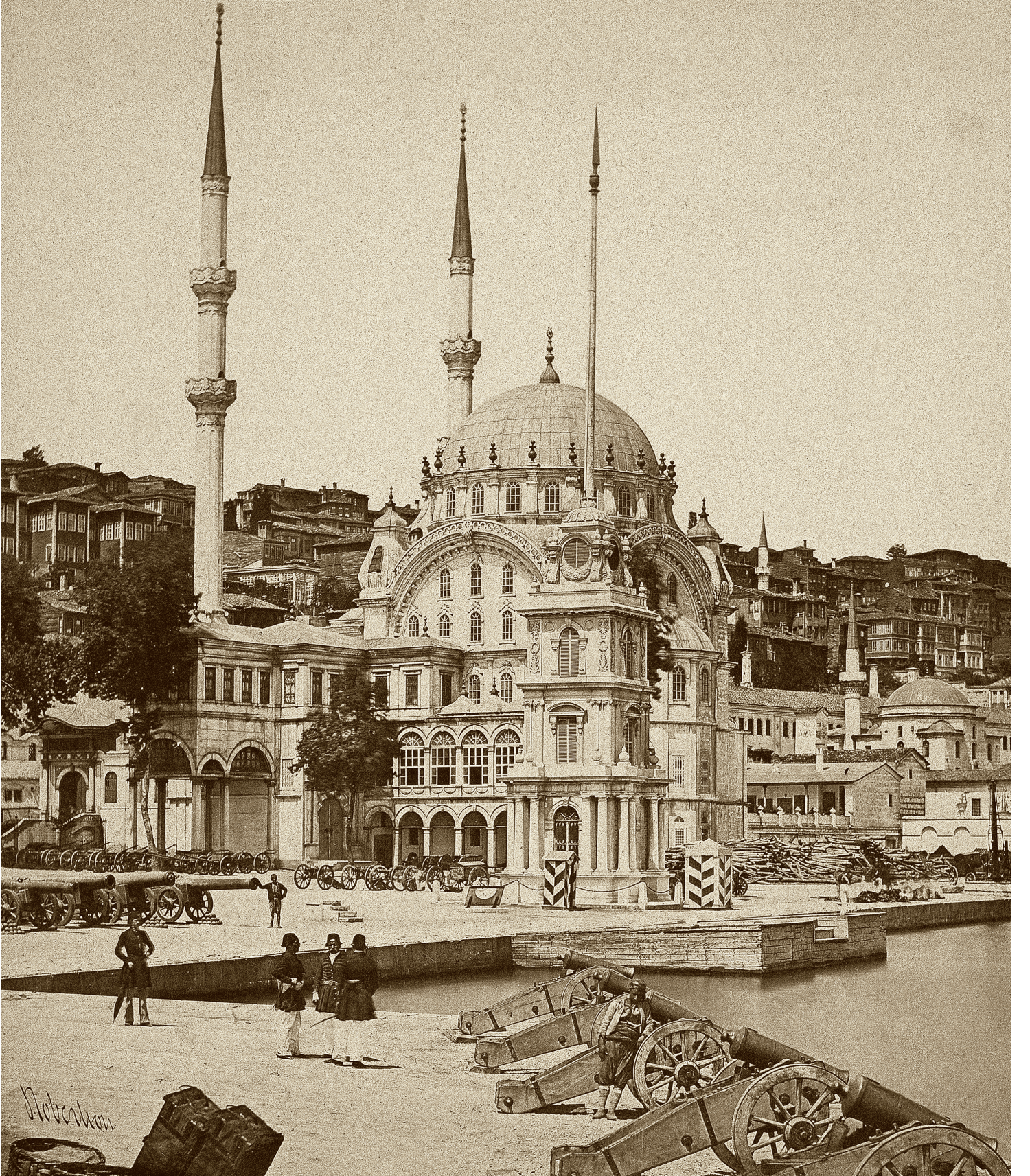
1 Nusretiye Camisi, İstanbul'un Tophane semtinde, 19. yüzyılda inşa edildi. 1826'da ibadete açıldı. Mimarı Osmanlı'ya saraylar, köşkler kazandırmış olan Balyan ailesinden Krikor Amira Balyan'dı. Fotoğraf: James Robertson, 1854