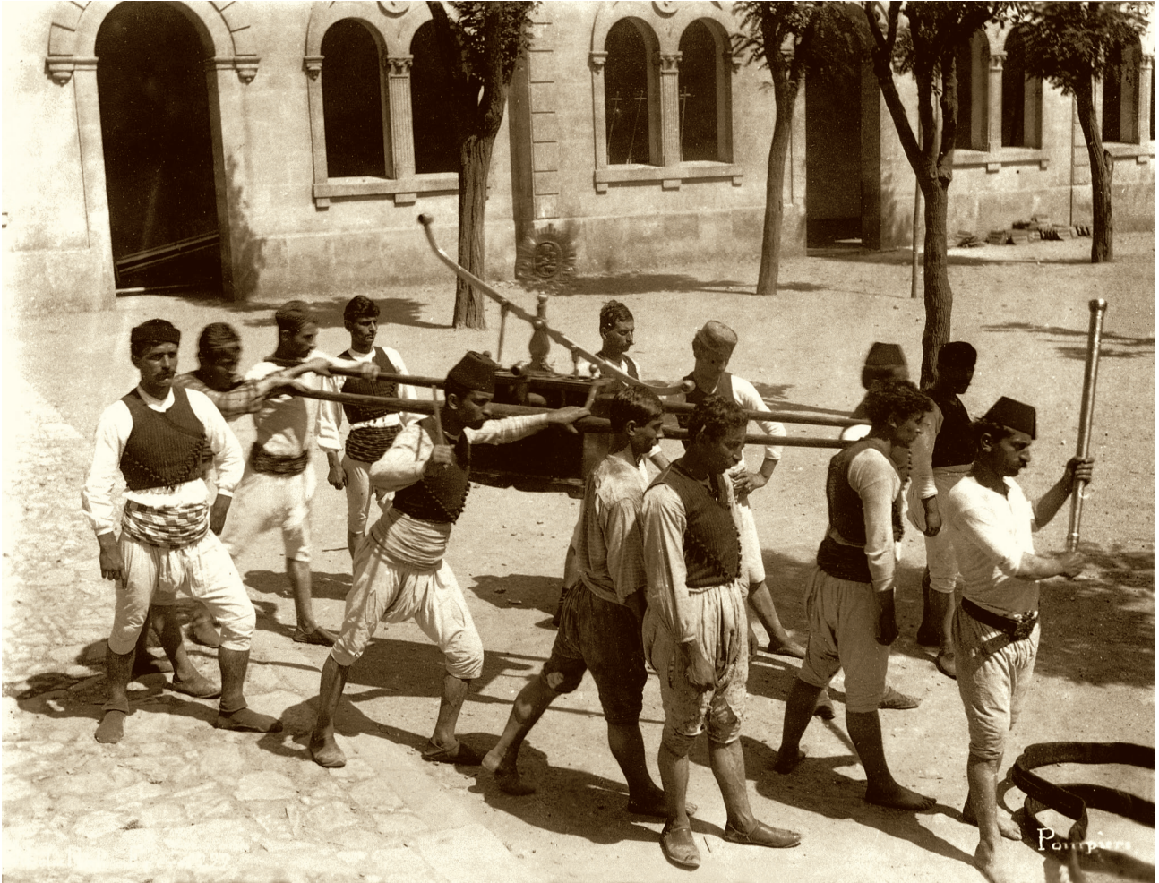
12 Tulumbaclar, Fotoğraf: Abdullah Frères, yaklaşık 1890

Abdullah kardeşler özellikle stüdyo fotoğraflarında ustaydılar. Bu nedenle de değişik desenli panolar, kadife perdeler, çeşitli sütunlar, günün modası kanepeler, Doğu'yu simgeleyecek sedef kakmalı