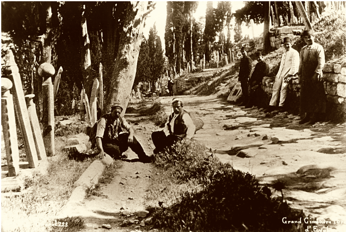
15 Eyüp Mezarlığı, 1890