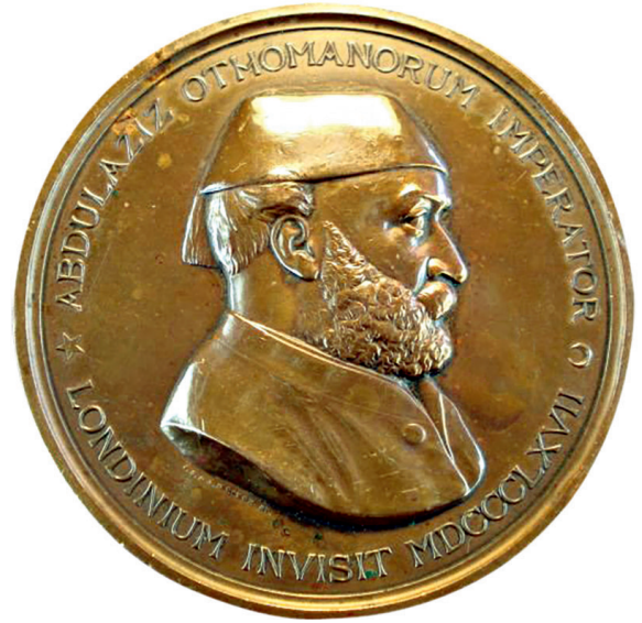
9-10 Aziziye fesi 8 ile Sultan Abdülaziz, Abdullah kardeşlerin çektiği fotoğraftan yararlanılarak Abdülaziz'in Londra seyahati nedeniyle yapılan madalya, 1869