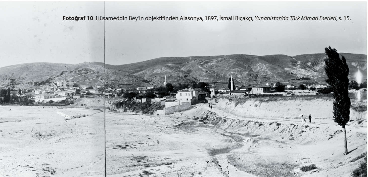
Fotoğraf 10 Hüsameddin Bey'in objektifinden Alasonya, 1897, İsmail Bıçakçı, Yunanistan'da Türk Mimari Eserleri , s. 15.