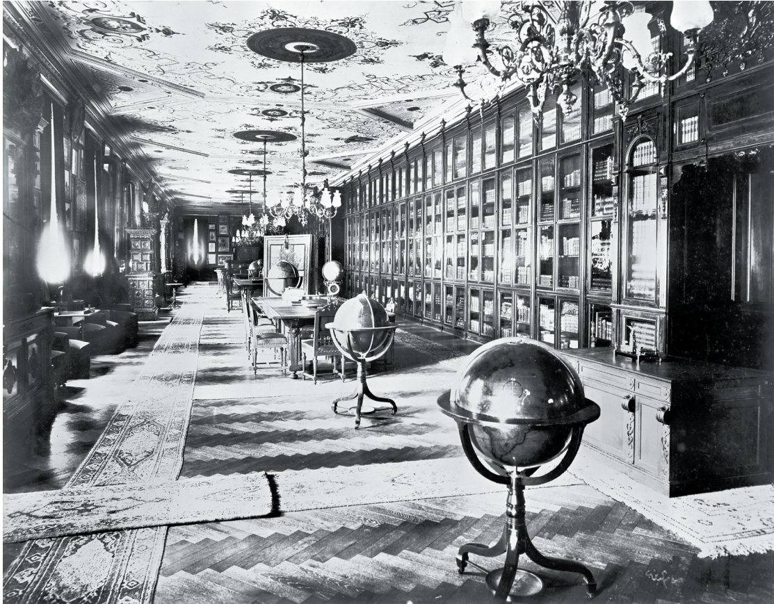
Fotoğraf 6 Yıldız Sarayı Kütüphanesi, Geçmişte Yıldız Sarayı , s. 73, foto: Hüsameddin Bey.