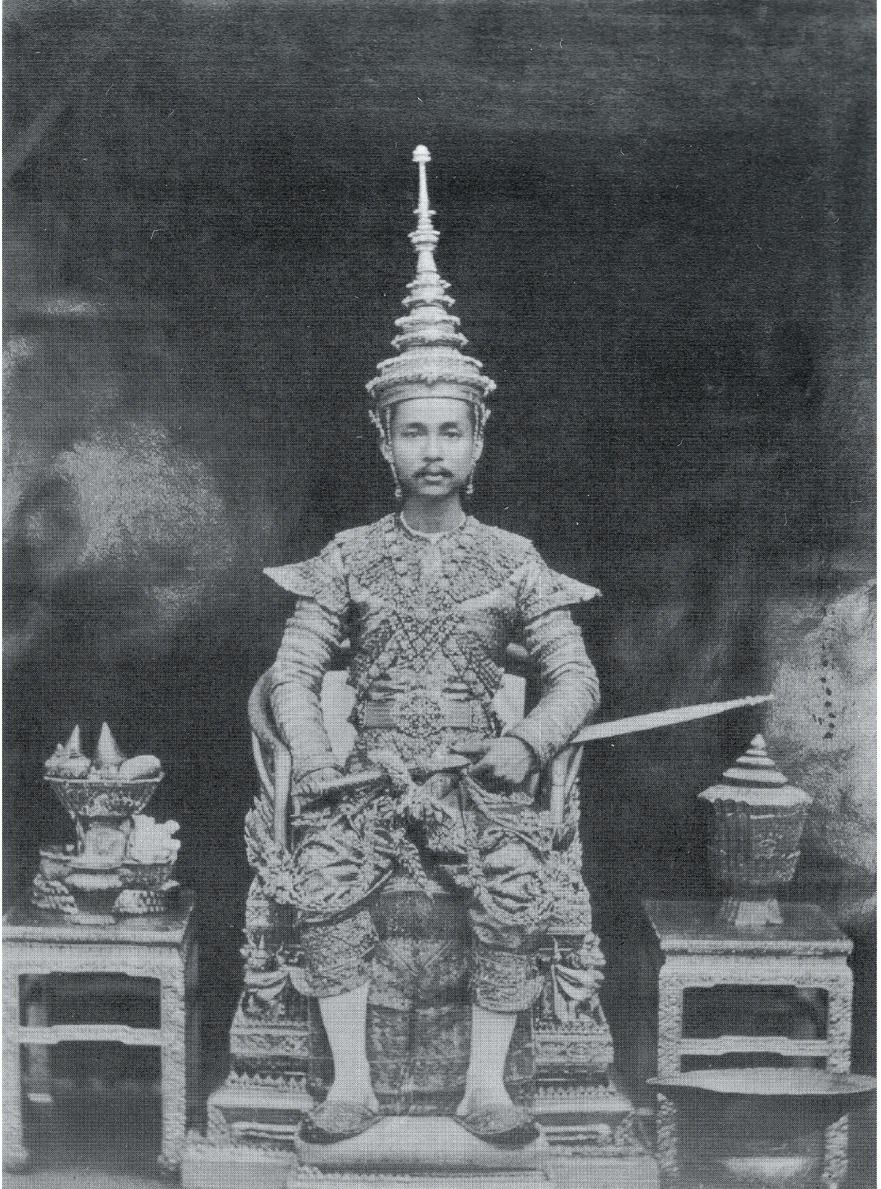
Fotoğraf 11 Francis Chit'in çektiđi ve Hüsameddin Bey'in kopya ettiđi Tayland (Siyam) Kralı Chulalongkorn'un fotoğrafı, Sultan II. Abdülhamid Arşivinden Dünya Liderleri , s. 168.