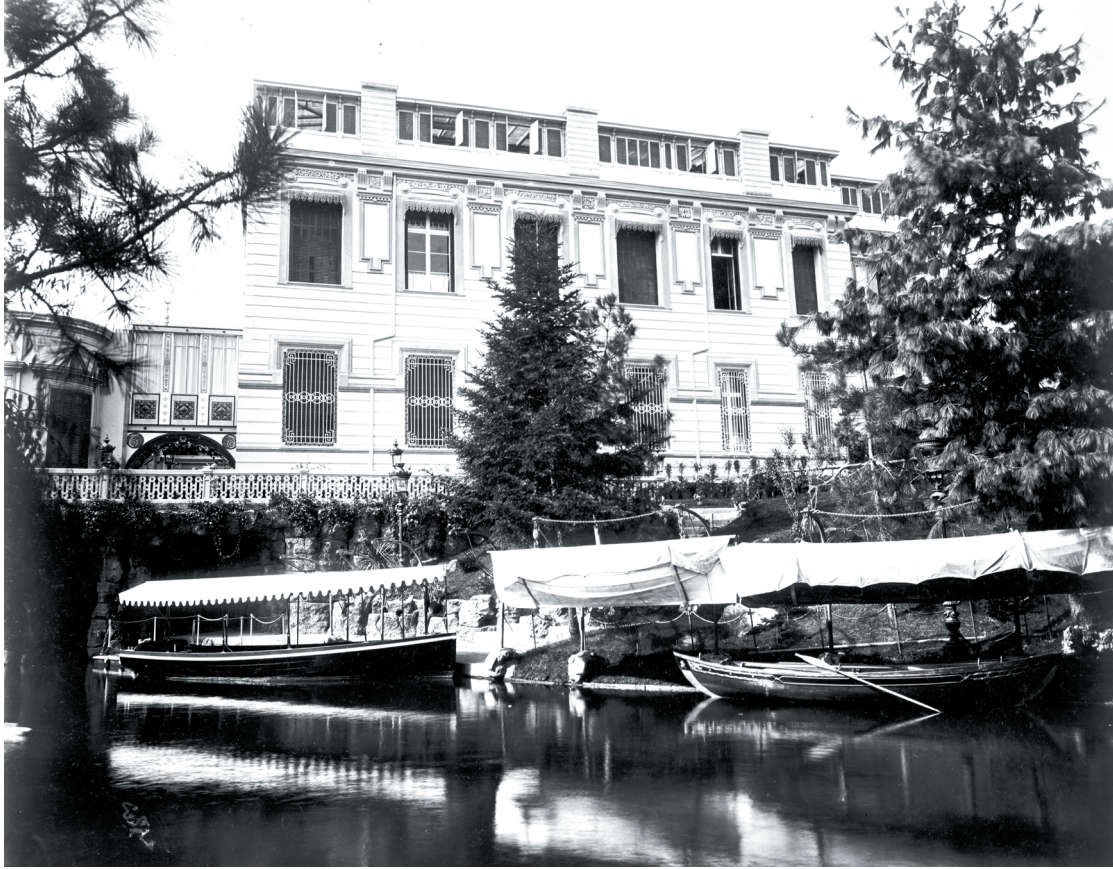
Fotoğraf 5 Hüsameddin Bey'in objektifinden Yıldız Sarayı Küçük Mâbeyn Köşkü, Geçmişte Yıldız Sarayı , s. 42.