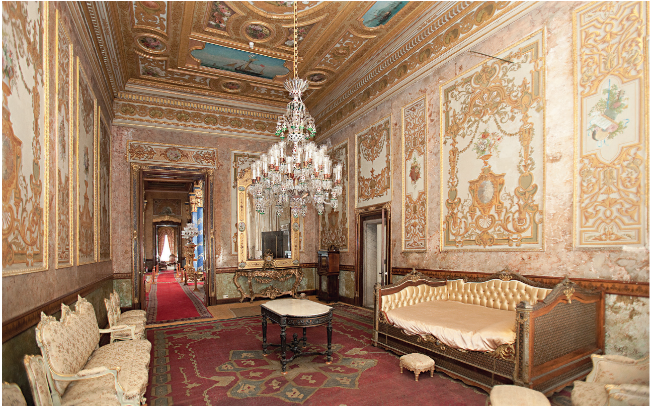
7 Beylerbeyi Sarayı 24 Numaralı Oda