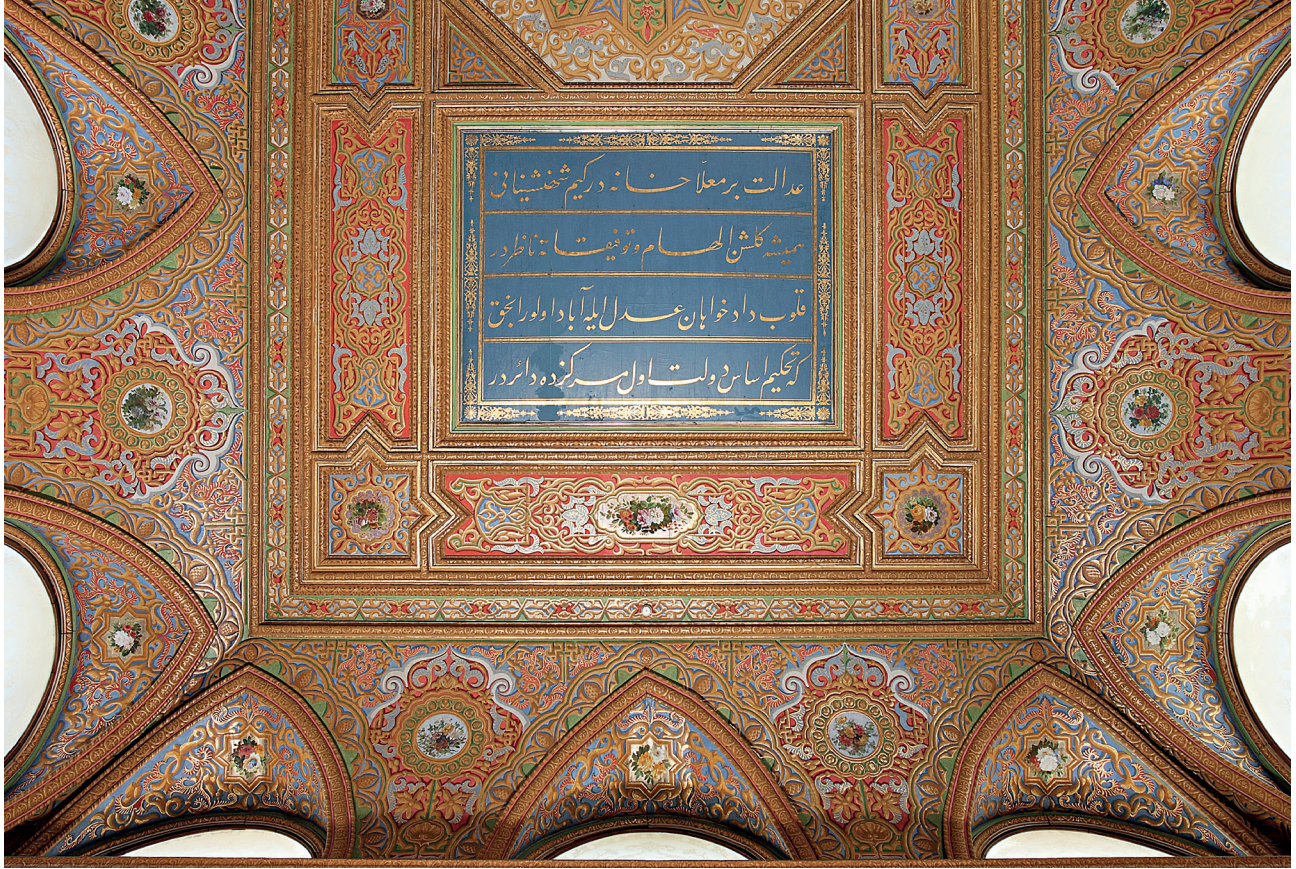
3 Beylerbeyi Sarayı 22 Numaralı Mavi Salon tavan detayı

Sultan Abdülaziz resim sanatını sever ve kendisi de resim yapardı. Devrinde yerli ve yabancı birtakım ressamlar Padişah'ın iltifat veya taltifine mazhar olmuşlardır. Rus Ressam Ayvazovski, 1874'te İstanbul'a gelmiş, 21 Ekim 1874 günü Sultan Abdülaziz tarafından kabul edilmiş, bu kabul sırasında sarayın başmimarı Sarkis Balyan da bulunmuştur. Abdülaziz, Ayvazovski'ye fevkalade iltifat ettikten başka ayrıca kendisine ikinci rütbeden büyük Osmanlı Nişanı da ihsanda bulunmuştur.