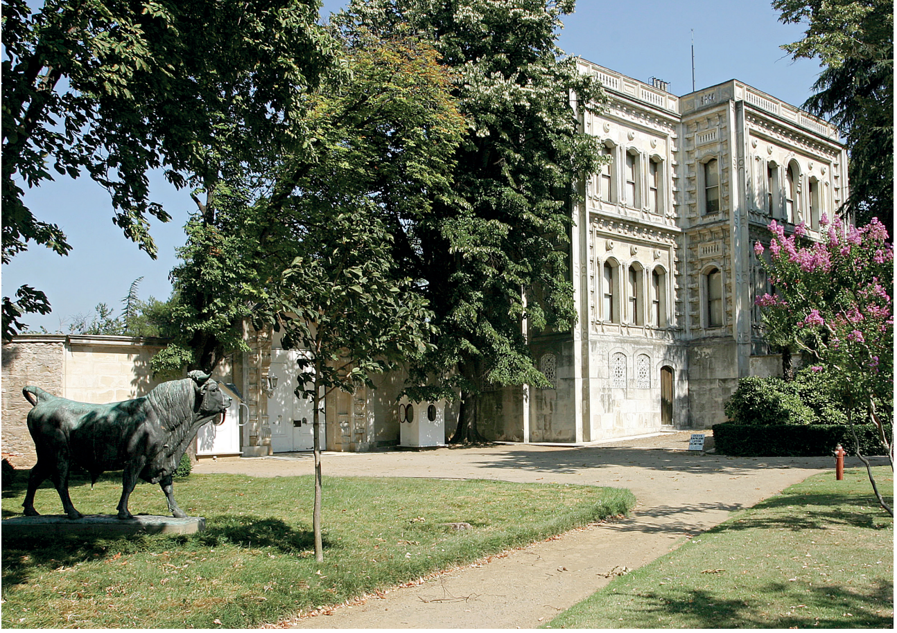
11 Sarı Köşk

hünkâr da bu kadını o hal-i hareminde görmeye tehâlük gösterdi. Bizler, kendisini Dolmabahçe'nin rıhtımında istikbal ettik. Kendisine layık olan ihtiram ile padişahın huzuruna isal olundu. Eugénie, İstanbul'a ilk seyahatinde pek küçük bir çocuk olarak tanıdığı Yusuf İzzettin'i de görmek arzusunu izhar ettiğinden bu mülakat esnasında o da bulundu.