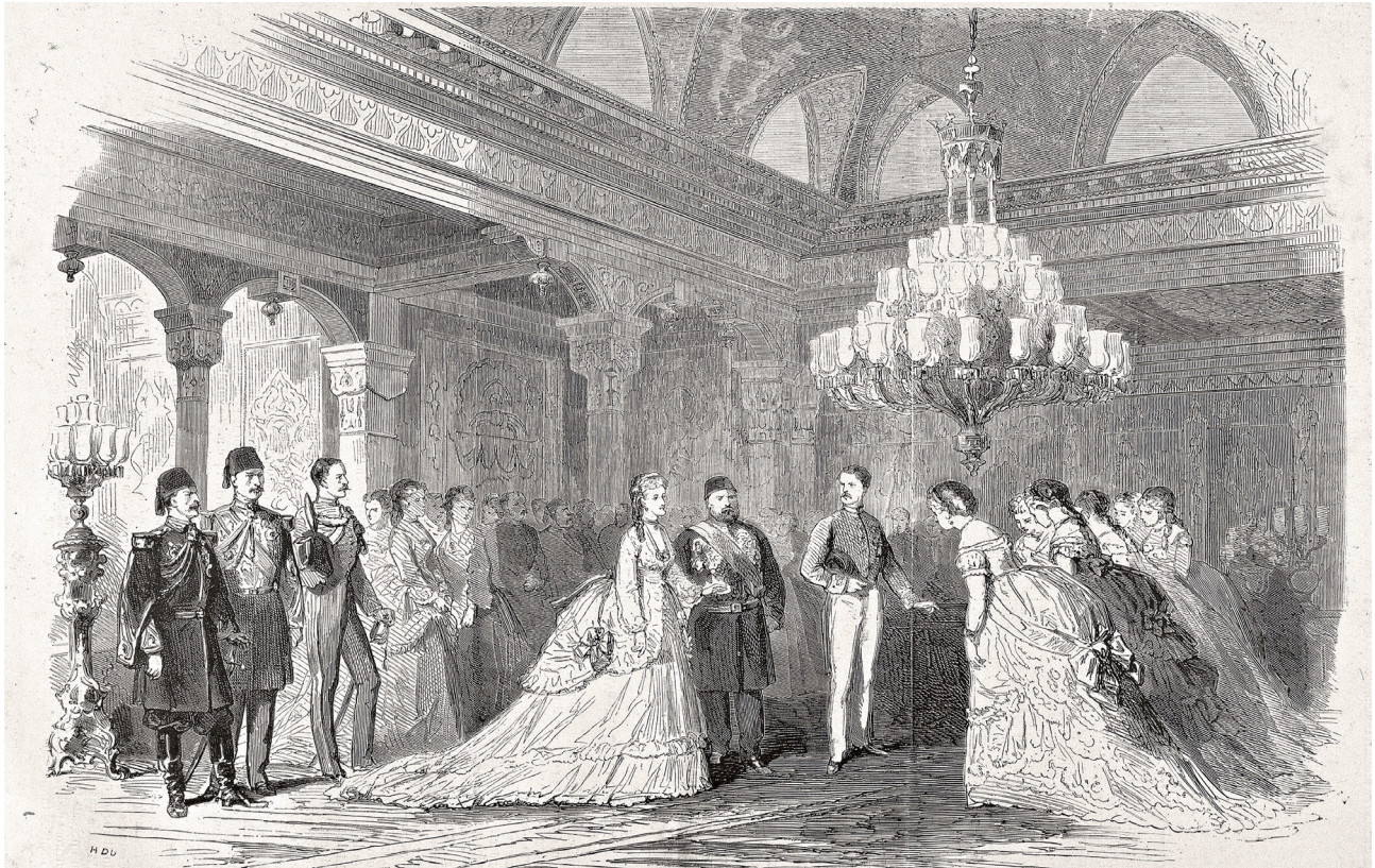
8 İmparatoriçe'nin Beylerbeyi Sarayı Mavi Salon'da karşılanması, ( L'illustration , 13 Kasım 1869, No. 1394).