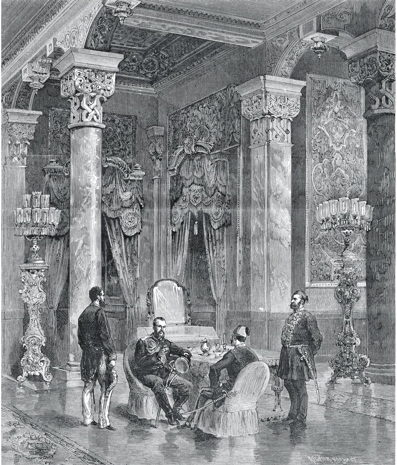
10 Grandük Nikola'nın Beylerbeyi Sarayı'nda görüşmesi, (Le Monde Illustré, 1876).

Bu öyle fevkalâde bir hadise idi ki bütün saray altüst oldu ve kendisini çocukluğunda görmüş olan