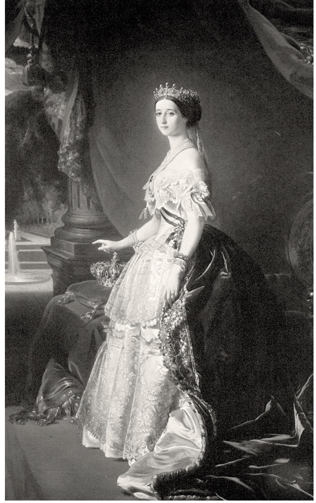
6 İmparatoriçe Eugénie, 1853, (Desmond Seaward, The Empress and Her Empire , s. 163).

Sultan Abdülaziz'in isteğiyle Sarkis Balyan'ın biçim verdiği, aynı zamanda döşenmesi ile de yakından ilgilendiği bugünkü Beylerbeyi Sarayı'nda imparatorluk döneminde ağırlanan yabancı konuklar arasında en mühim şahsiyet ve ilk büyük misafir İmparatoriçe Eugénie'dir.