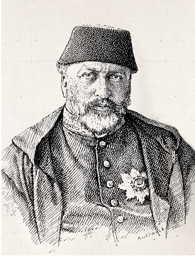
1 Antranik Efendi, Sultan Abdülaziz Portresi , (Osmanlı Ressamlar Cemiyeti Gazetesi, 25 Nisan 1328, No. 12).