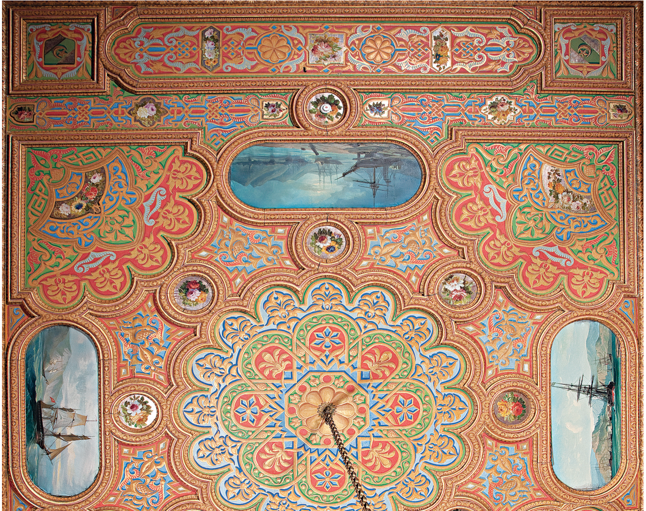
4 Beylerbeyi Sarayı 26 Numaralı Doğramalı Oda / Hünkâr Hasodası tavan detayı

Ressamın tezyinatı kabul edilen fiyata göre daha hafif yapmaması için iş tamamlandıktan sonra Ebniye İdaresi tarafından keşif ve tahmin ettirilecek, tespit edilen fiyatlardan daha noksan fiyat tahmin ve tayin edilirse ressamın hesabı önceki fiyatlarla görülecektir. Daha yüksek tahmin olursa da ressama fazla para ödenmeyecek, yine mukavelede belirlenen fiyat verilecektir. Tezyinattan beğenilmeyip değiştirilenler olursa, bunlar için ayrıca ücret ödenmeyecek ve masraf ressama ait olacaktır. Sarayın bütün tezyinatı mukavele ile bu işleri yapacak olan ressam tarafından dört ayda bitirilemezse hesabından yüzde yirmi kadarı kesilecektir. Sözü edilen süslemeler konusunda adı geçen ressamın hesabı görüldüğünde alacağı kalmışsa her hafta 30'ar bin kuruş olarak verilecektir.