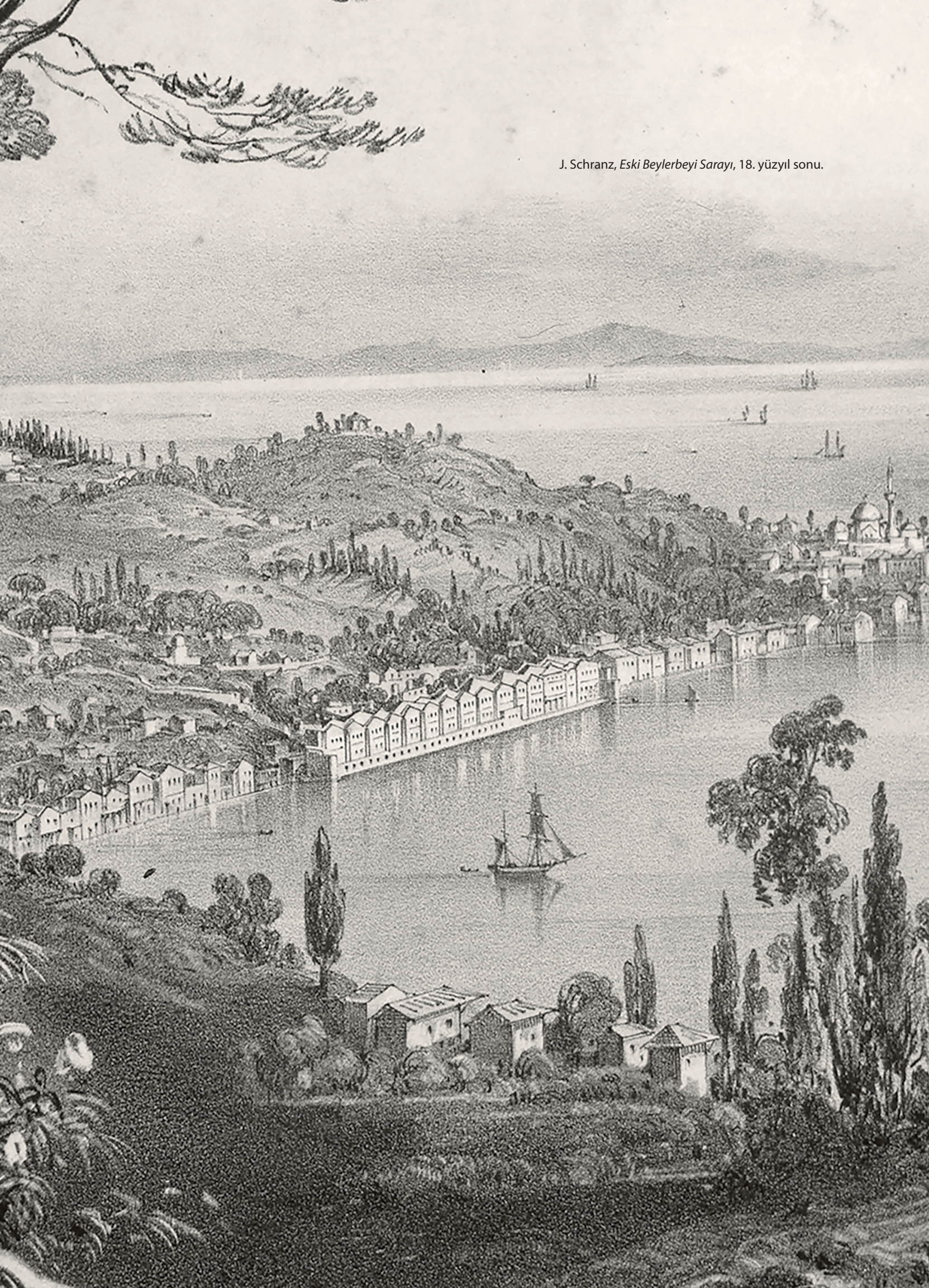
J. Schranz, Eski Beylerbeyi Sarayı , 18. yüzyıl sonu.