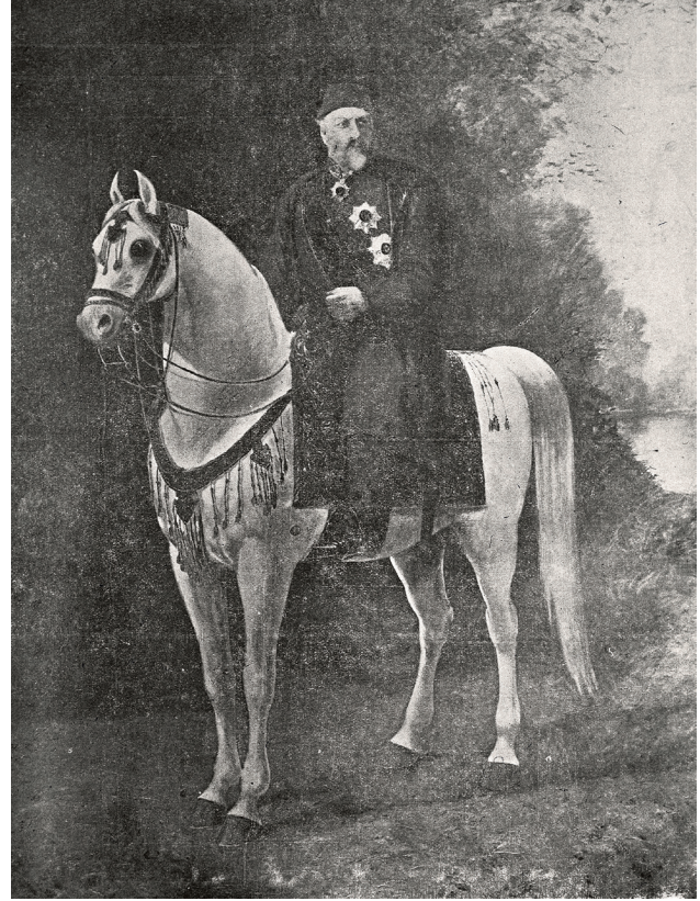
2 Abdülmecid Efendi, At Üzerinde Sultan Abdülaziz (Osmanlı Ressamlar Cemiyeti Gazetesi, 1 Şubat 1326, No. 2).

İstanbul'da, Boğaziçi'nin Anadolu Yakası'nda 19. yüzyıla kadar Beylerbeyi adına kaynaklarda rastlanmamıştır. Yaptığımız araştırma ve incelediğimiz Bostancıbaşı defterlerinde de bu adı bulamıyoruz. 1 Çengelköy'den sonra semt adı olarak Beylerbeyi yerine "İstavroz Bahçesi"ni görmekteyiz. 17. yüzyılın sonlarına kadar yaşamış olan Evliyâ Çelebi de Boğaziçi'ni anlatırken Anadolu Yakası'nda sıra ile Çengelköy, İstavroz ve Kuzguncuk'tan bahseder. Beylerbeyi adı ortada yoktur. Millî Saraylar Arşivi'nde bulunan 3024 numaralı defterde ise Beylerbeyi Sarayı'nın inşasından sonra da bu arazinin hâlâ "İstavroz" adıyla anıldığı görülür. 2 Eski zamanlarda Arhai Foisusai diye bilinen mevkiin, İmparator II.