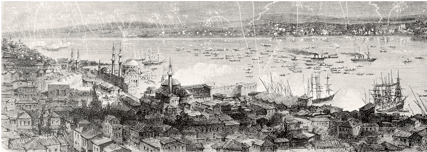
5 İmparatoriçe Eugénie, İstanbul'a geldiğinde havai fişeklerle karşılanır, ( L'illustration , 6 Kasım 1869, No. 1393).