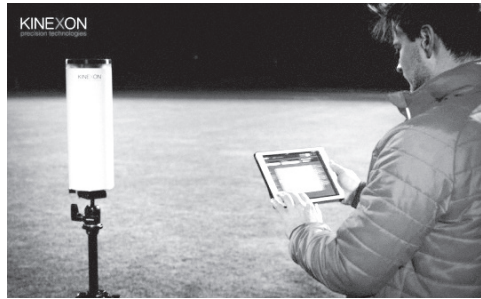
Resim 8: Kinexon ONE

Adidas'ın giyilebilir miCoach ürünüyle oyuncuların antrenmanlardaki performansı yakından izlenebilmiştir.