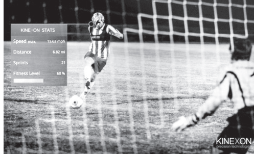
Resim 7: Kinexon ONE

Futbolcuları ve takım performansını, taktiklerini, oyun ve antrenmanlarda analiz edip ölçen Kinexon ONE, belirli hedeflere ulaşmak için doğru egzersiz çalışmalarını gerçekleştirmeyi sağlamaktadır. İçerisinde, önde gelen spor bilimcileri, antrenörler ve spor birliklerinin oyuncuların tam potansiyele ulaşmasını sağlamak için geliştirdiği ve önerdiği çeşitli egzersizleri barındırmaktadır ( https://mediatrend.mediamarkt.com.tr/dahaiyifutbolcinteknoloji/ ).