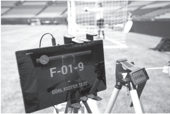
Resim 1: Hawk Eye (Şahin Gözü)

Şahin Gözü sisteminin topun çizgiyi geçmediğini göstermesi ise maç sonrası geleneksel 'golümüz çalındı' tartışmalarını ortadan kaldırmıştır. Her kale için 7 kamerayla çalışan "Şahin Gözü" sistemi hem kale çizgisini hem de topu üç boyutlu olarak yakın takibe almıştır. Sistemin çalışması için öncelikle her kale toplam 7 kamera tarafından izlenmeye alınmaktadır, akıllı yazılımlar 7 kameradan da gelen görüntüyü birleştirip 3 boyutlu tek bir kayıt hâline getirmektedir. Akıllı yazılımlar kaydı inceleyerek topun çizgiyi geçip geçmediğini belirlemede, eğer yazılımlar topun tamamının çizgiyi geçtiğine onay verirse hakemin kolundaki saate titreşim ve görüntü olarak gol mesajı gitmektedir. Futbol artık çok büyük paraların döndüğü kâr getiren bir sektör olduğundan, hakem hatalarının teknolojiyle en aza indirilmesi amaçlanmaktadır (Demir, 2017).