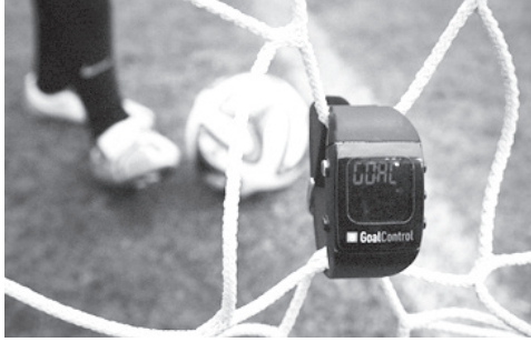
Resim 6: Goal Control

Bir futbol maçında kim ne kadar koştu, kaç doğru, kaç hatalı pas yaptı gibi temel bilgiler kadar, oyunun ağırlığını gösteren ısı haritaları gibi gelişmiş veriler de artık elde edilebilmektedir.