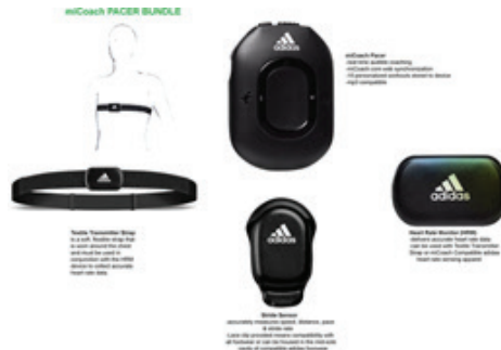
Resim 9: Adidas miCoach

Adidas'ın giyilebilir miCoach ürünüyle oyuncuların antrenmanlardaki performansı yakından izlenebilmiştir.