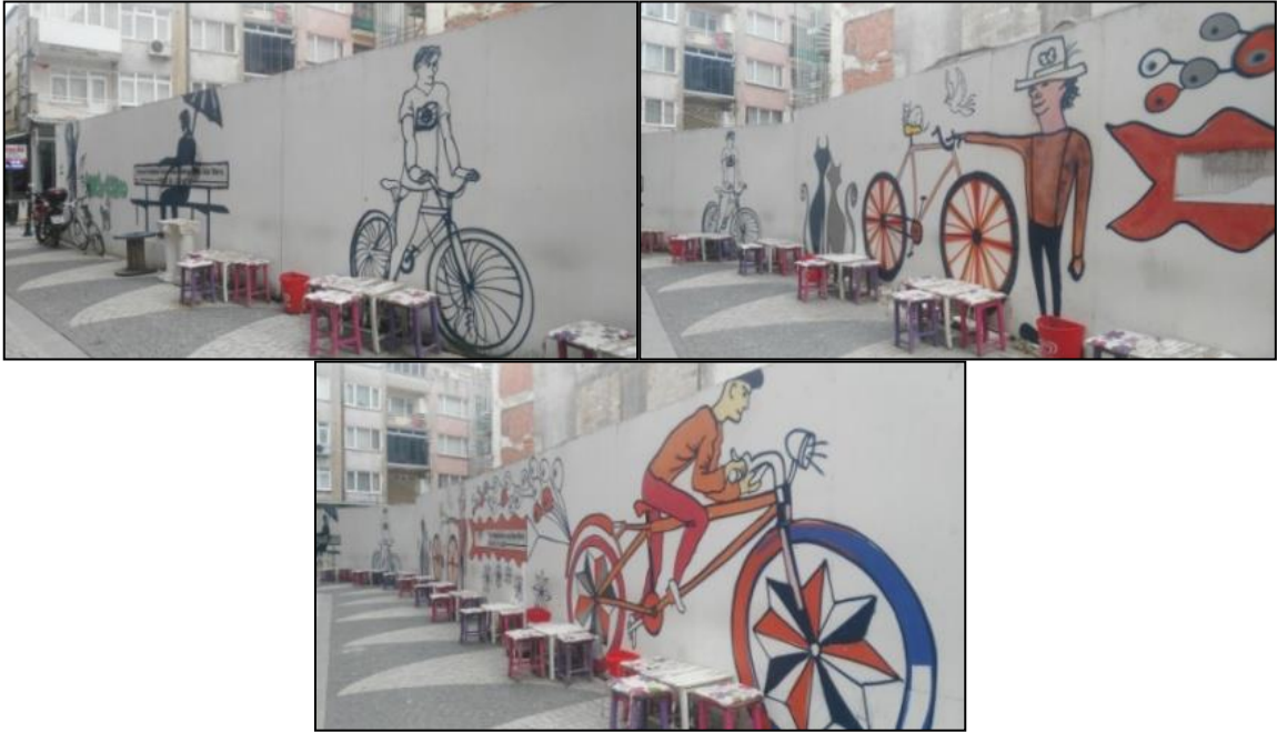
Fotoğraf 13: Alpaslan Sokak (19.03.2018)