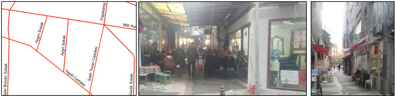
Fotoğraf 8: Milli Kuvvetler ve Yeşilli Caddeleri Arasında Geçiş Sağlayan Aygün Sokak (15.12.2018) ve Aygıt Sokak (13.01.2019)

Burada özellikle kadınların mekânsal hareketlerinin nispeten belirgin olduğu caddeler arasında geçiş sağlayan sokaklar olmaları bakımından Yeşilli Caddesi ile Milli Kuvvetler Caddesi arasında geçiş sağlayan Aygün ve Aygıt Sokak için de benzer bir gündelik inşa söz konusudur. Aygün Sokak, bir yanı erkek kuaförü (berber), bir yanı da kıraathane görünümü (içerideki masaların çay ocağının küçük masaları aksine büyük masa ve sandalyeleri, bordo masa örtüleri ve masanın etrafında oturan erkekler) bir çay ocağının konumlandığı eril bir kullanım alanıdır. Her iki yanında eril faaliyetlerin yer alması, bununla beraber sokağın kendisinin çay ocağı masa ve tabureleri ile orada her zaman oturan erkeklerin varlığı, gündelik yaşamda Yeşilli Caddesi ile Milli Kuvvetler Caddesi arasında geçiş yapmak isteyen bir kadını, bu sokağı kullanmaktan alıkoyarak bir sonraki sokak-cadde aracılığıyla geçmek zorunda bırakması bakımından cinsiyet temelinde eşitsizlik inşa eder (Fotoğraf 8a). Milli Kuvvetler Caddesi ile Yeşilli Caddesi arasında geçiş sağlayan Aygün Sokak'tan önce/sonra gelinen Aygıt Sokak da yine eril kullanımların (internet kafeler, çay ocağı ve berber) bir araya geldiği dar bir ara sokak (Fotoğraf 8b) olması bakımından da, kadınları bir sonraki ara sokaktan geçmeye zorlayarak bu eşitsizliği sürdürür.