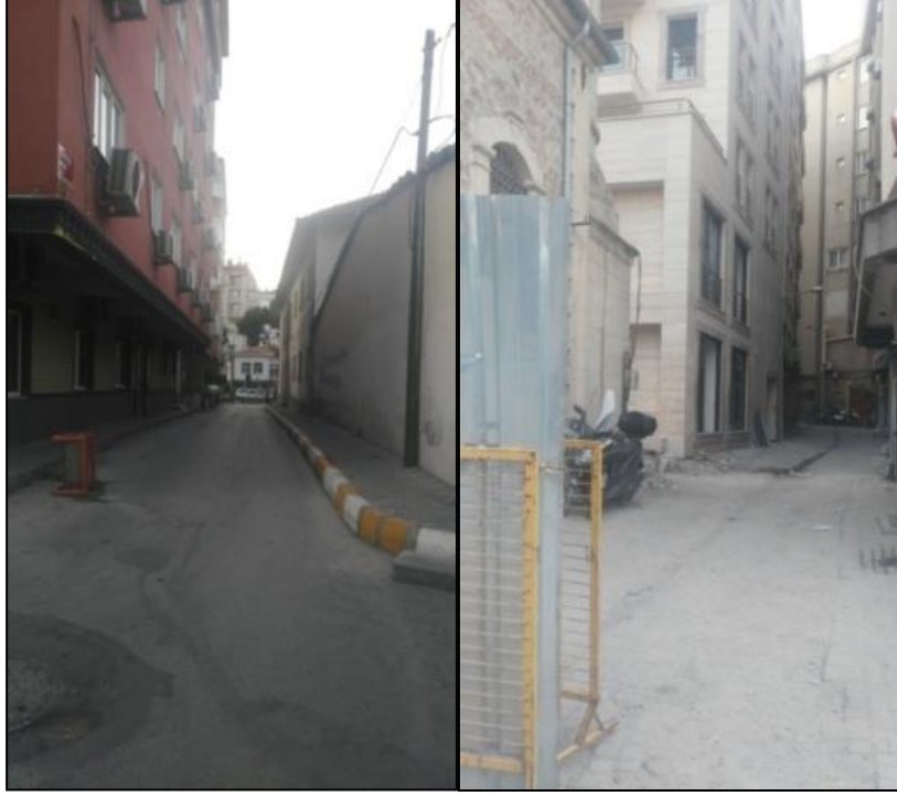
Fotoğraf 6: Muzaffer Uzkur Sokak ve Gedik Sokak (09.07.2018)