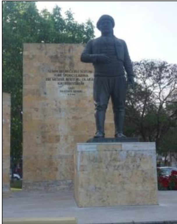
Fotoğraf 16: Kurtdereli Mehmet Pehlivan heykeli (11.05.2016)

MİA'da mekâna içkin diğer cinsiyetli inşalardan biri de heykeller ve tabelalardaki kent simgeleridir. Bu çerçevede en belirgin kentsel kamusal simge, Vasıfçınar Caddesi'nden Kızılay Caddesi'ne girişte konumlandırılan Kurtdereli Mehmet Pehlivan heykelidir (Fotoğraf 16). Kentin en merkezi ve işlek güzergâhlarından birinde konumlandırılan Kurtdereli Mehmet Pehlivan heykeli, konumu, yüksekliği, büyüklüğü ve anlamı ile tahakküm, güç ve ataerkiyi simgelemektedir. Erkek egemenliğini simgeleyen, hem sporu yapan hem de izleyicilerin erkek olduğu, dolayısıyla eril mekânlar oluşturan güreş sporlarının geleneksel olarak gerçekleştirilmesi ve kent merkezinde bu aktiviteye yönelik pano duyuruları da (Fotoğraf 20), kas gücüne dayalı hegemonik erkekliği yeniden üretmektedir. Kentin en merkezi konumlarından birinde konumlandırılmış olan Kurtdereli Mehmet Pehlivan Heykeli, kentin çeşitli yerleri ve kentsel hizmetlerde (çöp kutuları vb.) kent simgesi olarak kullanılmakta, dolayısıyla ataerki iktidar mekânda, simgeler yoluyla yeniden üretilmektedir.