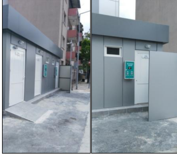
Fotoğraf 10: Robotik Otoparkın Yanında Konumlanan Kamusal Tuvaletler (11.05.2016)