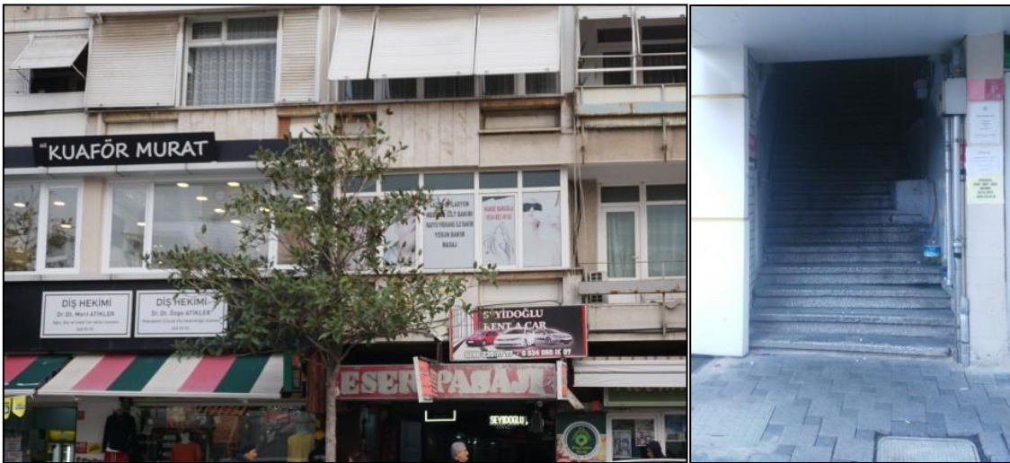
Fotoğraf 1: Anafartalar Caddesi ile Okul Sokak Arasında Geçiş Sağlayan Eser Pasajı Giriş ve Çıkışının Anafartalar Caddesi ve Okul Sokak'tan Görünümü (07.12.2018 ve 08.07.2018)