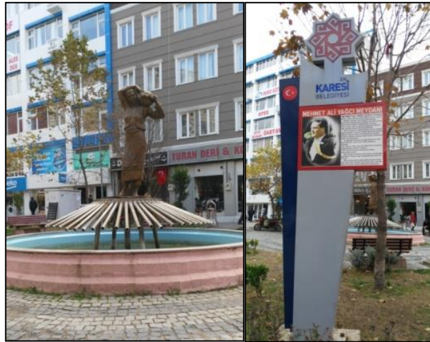
Fotoğraf 18: Turan Caddesi, Mehmet Ali Yağcı Meydanı (1.12.2016)

MİA'da bir kadın heykeli (Sarıkız Heykeli) de mevcuttur fakat Sarıkız Heykeli'nin konumlandırıldığı meydan, Kurtdereli Mehmet Pehlivan heykeli ya da Vasıfçınar Caddesi'ndeki erkek heykel gibi sık kullanılan ana yol güzergâhlarının aksine iç kesimlerde, Hasanbaba Çarşısı'nın arka cephesi olan Turan Caddesi'nde konumlandırılmıştır. Ayrıca Sarıkız Heykeli'ne rağmen meydanın adı da "Mehmet Ali Yağcı Meydanı" dır (Fotoğraf 18). Konumu ve ek bir tabela ile meydana verilen erkek adının yanı sıra Sarıkız Heykeli, giymiyle ve efsanesiyle makbul kadın kimliğinin inşasına karşılık gelmekte, dolayısıyla kentsel mekânda erilliği temsil etmektedir.