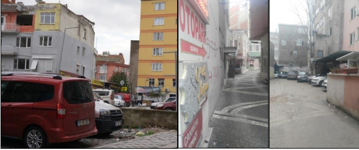
Fotoğraf 3: 1. Çakıcı Sokakta Bir Oto Yıkama ve Park Yeri (07.12.2018) ile Atalar Caddesi'nden Çankaya Çıkma Yönünde Oklarla İşaret Edilen Otopark Alanı (15.12.2018)