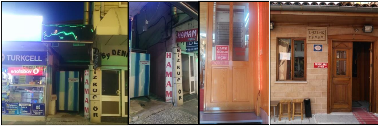
Fotoğraf 9: a. Yeşilli Hamamı (18.07.2019), b. Çarşı Hamamı (18.07.2019), c. Lazlar Hamamı (26.10.2016)