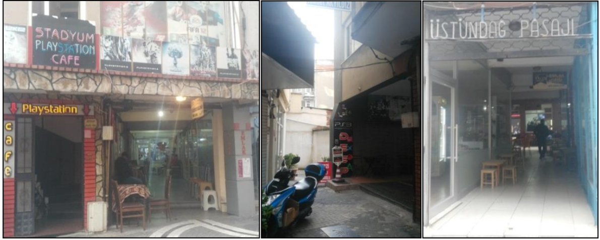
Fotoğraf 2: Yeşilli Caddesi-Çavuş Sokak Arasında Geçişi Sağlayan Bir Pasaj Girişinin Yeşilli Caddesi'nden Görünümü, Çankaya Sokak-Hükümet Caddesi Arasında Geçiş Sağlayan Bir Pasajın Çankaya Caddesi'nden Görünümü, 1. Çankaya Sokak-Abdulgafur Efendi Caddesi Arasında Üstündağ Pasajı Girişinin 1. Çankaya Caddesi'nden Görünümü (07 ve 15.12.2018)

Hemen her pasajda en az 1 berber ile birlikte pasajların karakteristiği biçiminde çay ocaklarının küçük tabureleri, daha çok erkekler kullandığı için erildir ve pasaja giriş-çıkışları etkilemesi (erkek yoğun görünüm/kullanım nedeniyle kadınların kullanımını zorlaştırması) bakımından da cinsiyetli mekânsal inşalardır. Yarı kapalı ve karanlık olmaları bakımından da pasajlar kadınların mekânsal hareketlerini kısıtlayıcı iken aynı zamanda kadınları da pasajların içerisinde yer alan faaliyetlerden dışlamaktadır. Bazılarının giriş yeri pasaj içlerinden olmakla beraber iş hanları da, kentsel kamusal işlevleri kapalı bir binada bir araya toplayan bir mekânsal düzenleme olması bakımından belli bir adres bilmeden gitmeyi zorlaştıran, bilinen bir adrese gidişler için de kapalı mekânlar olmaları bakımından kadınların mekân kullanımı açısından dezavantajlıdır.