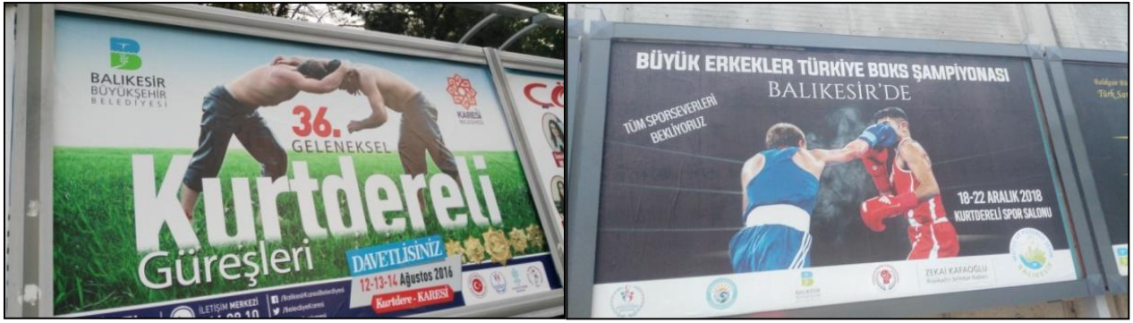
Fotoğraf 20: Kentteki Reklam Panolarında Kas Gücüne Dayalı Erkek Egemenliği (02.08.2016 ve 17.12.2018)

Mekânsal düzenlemelerin erkek bedenine göre planlanması, ortalama erkek boyunu dikkate alan mekânsal düzenlemeler vb. de gündelik yaşamda deneyimlenen eşitsiz kullanımlarla açıklanabilir. Otobüs saatlerini gösteren ilan panolarının boylarının ortalama kadın boylarını aştığı, otobüslerin tavanında asılı olan tutacak boylarının da ortalama kadın boyuna uygun olmadığı, aynı zamanda boyu kısa olduğu için otobüste ayakları yere ulaşamayan kadınlar bunun bazı örnekleridir. Bankadaki vezne boyları, parmak uçlarına basarak işlerini halletmeye çalışan bir kadın ile yine paramatikten para çekmesi gereken bir kadının paramatik boyuna yetişememesi vb. kadınlar için gündelik yaşantıyı zorlaştıran eril mekânsal inşaların diğer bazı göstergeleridir.