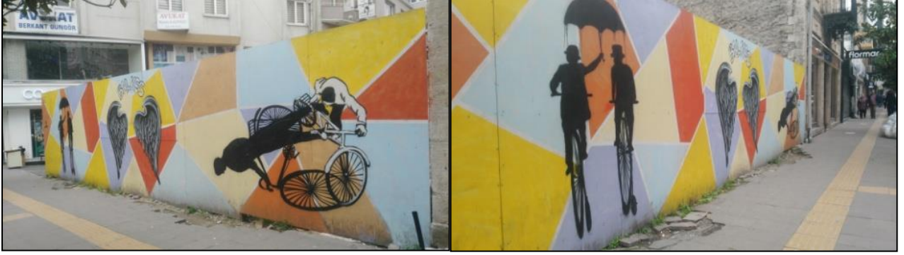
Fotoğraf 12: Milli Kuvvetler Caddesi (19.03.2018)

siyah renklerin erilliği arttırdığı, tütün-tekeli büfeleri, kıraathane, otopark, birahane gibi kullanım alanlarının da erkek yoğun kullanım mekânları olmaları aracılığıyla erkek kimliği pekiştirdiği söylenebilir. Bu kapsamda renkler ve eril kullanımlar birbirini karşılıklı olarak üretmektedir. Bu bakımdan Balıkesir kenti MİA' da son yıllarda birtakım renklendirme faaliyetleri gözlenmekteyse de, öznesi erkek olan bu renklendirmeler, kentsel kamusal mekânda bulunması meşru cinsiyetin erkek olduğunu varsaymakta ve bunu yeniden üretmektedir (Fotoğraf 12, 13, 14). Örneğin Alpaslan Sokaktaki resimlendirmede tek bir duvardaki 5 özne de erkektir. Aynı şekilde Milli Kuvvetler Caddesinde de tek bir duvardaki 4 özne de erkektir.