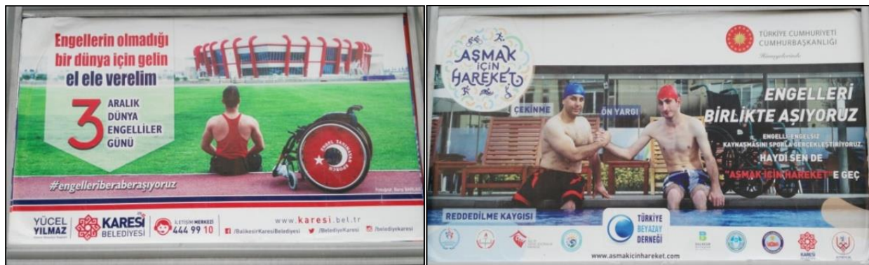
Fotoğraf 19: Kentteki Reklam Panolarında Kas Gücüne Dayalı Erkek Egemenliği (01.12.2016)

Balıkesir MİA'da mekânın eril temsillerinden bir diğeri de, reklam/duyuru panolarındaki söylemlerdir. Reklam/duyuru panolarında erkek egemen imaj, kentsel kamusal mekânda erkek egemenliğini normalleştirme aracı olarak tezahür etmekte, toplumsal/kültürel olarak eril güç, biyolojik farklılıklarla normalleştirilmektedir. Örneğin Dünya Engelliler Günü için kentin ana yol güzergâhlarında sergilenen afişlerde engelsizlik, erkek kası ile özdeşleştirilmiş, biyolojik özelliklere dayalı eril güç meşrulaştırılarak yeniden üretilmiştir (Fotoğraf 19). Kentteki duyuru panolarında pehlivan güreşleri, boks müsabakaları, okçuluk festivalleri, futbol ve basketbol da kaslı erkekler ile sembolize edilmektedir. Fotoğraf 20'deki "BÜYÜK ERKEKLER" söylemi de aynı anlamın üreticisidir.