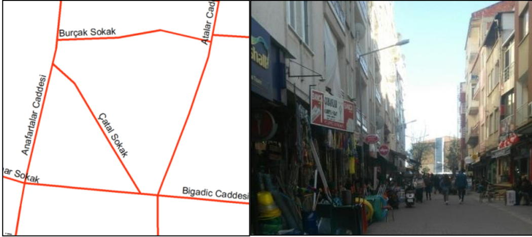
Fotoğraf 7: Anafartalar ve Bigadiç/Atalar Caddeleri Arasında Geçiş Sağlayan Çatal Sokak (13.01.2019)

taahsis edilmiş(!) faaliyet alanları belirgindir. Bu bakımdan gündelik yaşamda Anafartalar Caddesi'ndeki bir kadın Atalar ya da Bigadiç Caddesi'ne gitmek istediğinde bu ara sokağı kullanmak yerine ana cadde üzerinden geçiş yaparak zaman ve enerji kaybedecektir.