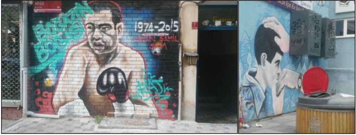
Fotoğraf 15: 4002 Sokak (08.07.2018) ve Ali Şuuri Sokak (08.07.2018)

Kent duvarlarında erkek özne ile temsil edilen kamusal insan ile birlikte, 4002 Sokak'taki "Boğazın Boğası" boksör kas gücüne dayalı erkek iktidarının mekânsal inşası iken, Ali Şuuri Sokak'ta bulunan, erkek eli öpen erkek çocuk da saygı kisvesiyle eril tahakkümün meşrulaştırılmasının ifadesi fakat aynı zamanda çocuğun yüz ifadesi de bu eril tahakkümün sorunsallaştırıcısı gibi görünmektedir (Fotoğraf 15).