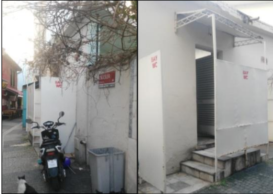
Fotoğraf 11: Çiviciler Sokak’ta Yalnızca Erkekler İçin Bir Kamusal Tuvalet (18.03.2019)