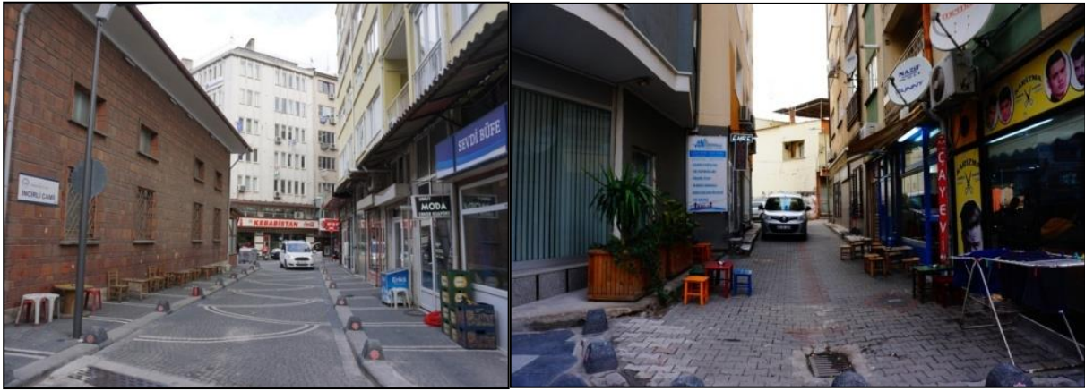
Fotoğraf 5: İncirli Camisi'nin Etrafındaki Çay Ocağı-Tabureleri ve Berberler (07.12.2018 ve 15.12.2018)

Balıkesir MİA'da tıpkı otoparklar gibi camiler de etraflarında berber ve tabureleri sokağa yayılan çay ocaklarının bir araya geldiği cami-berber-çay ocağı üçlüsü olarak bütünleşmiş eril mekânlar oluşturmakta, böylece camilerin erkeklere ait olduğu etrafındaki eril kullanımlarla belirginleşmektedir. Camilerin etrafının çay ocağı ve berberler ile çevrelenmesi, eril kullanımların mekânsal olarak bir araya gelerek, etrafındaki dar geçişlerle de desteklenmekte ve gündelik yaşamda kadınları çay ocağı ve cami kullanımından dışlamakta, böylece kadın kimliğinin ev içi inşasını pekiştirmektedir. İncirli Camisi'nin iki yanında yer alan birden fazla berber ve çay ocağı ile örneklenen bu görünüm (Fotoğraf 5) MİA'daki diğer camilerin çoğu için geçerlidir.