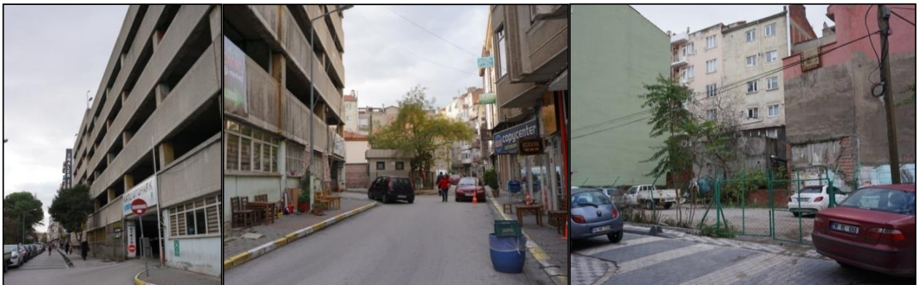
Fotoğraf 4: Katlı Otopark, Devamında İbrahim Ağa Camisi, Çıkma Sokak ve Açık Otopark Alanı (07.12.2018)

Dr. Ahmet Toprak Caddesi'nin devamında Dereboyu Caddesi, kırsal mahalle durakları ve nakliye benzeri hizmetlerin toplanma yeri ile sanayi ve oto yıkama-oto tamir faaliyetlerinin yaygın olduğu bir bölge olarak belirgin bir biçimde erildir. Gazi, Dereboyu ve Vasıfçınar Caddeleri arasındaki geniş bir alanda irili ufaklı sokaklardan oluşan bu bölge, çay ocakları, oto lastikçiler, oto yıkama ve oto tamirciler, kömürçüler, hırdavatçılar, kalaycılar, iş makineleri satıcıları ve