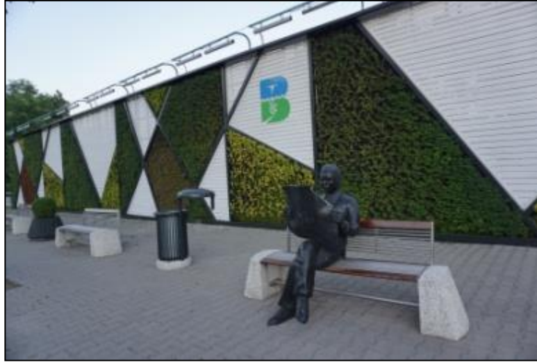
Fotoğraf 17: Vasıfçınar Caddesi'nde Konumlandırılan Erkek Heykel (11.05.2016) 2

Kentsel mekânda erilliğin semboller aracılığıyla yeniden üretildiği diğer araçlar ise kentteki levhalardır. Yayalar için oluşturulan levhalardaki insan simgesinin erkek olması, kentsel mekân üretiminde erkek egemen perspektifin ifadesidir. Aynı perspektif trafik ışıklarında, asansör simgelerinde, resmi kurum tabelalarında, çöp kutularında ve toplu taşıma araçlarında da belirgindir. Trafik levhalarının hemen hepsinde yalnızca erkek figür ile temsil edilen kamusal insan nihayet okul geçidi levhalarında kadın figür ile birlikte temsil edilmekte, ancak söz konusu levhalarda da hangi yöne doğru olursa olsun, erkek, kadından bir adım ileride, kadın erkeğin gerisinde olarak temsil edilmektedir. Tabela hangi yönü gösterirse göstere, her iki yönde de erkeğin önde, kadının geride oluşu kentsel mekânın üretiminde erkek egemen-erkek önde perspektifin ifadesidir. Kentte dikkati çeken bir diğer sembol, yine kentin ana yol güzergâhlarından birinde konumlandırılmış olan gazete okuyan erkek heykeldir. Herhangi bir geleneksel imajı da olmayan, başka bir ifadeyle herhangi bir insanı temsil eden gazete okuyan heykelin erkek olması, kamusal mekânda olması gereken/istenilen cinsiyetin erkek olduğunun mekânsal ifadesidir (Fotoğraf 17). Benzer bir mekânsal inşa, Atatürk Parkı'nda bulunan balık tutan erkek heykel için de geçerlidir.