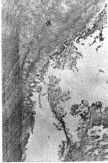
Resim: 5. Alt sağ birinci büyük azı dişinin kron pulpası kuvvetli sekonder dentin yapımı (x). Mikrofoto, H-E, x200.