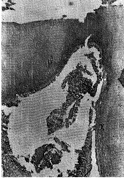
Resim: 2. Alt sađ ikinci küçük azı diřinin kron pulpası. Bořluđa bakan dentin yüzeyinde sekonder dentin yapımı (x). Mikrofoto, H-E, x80.