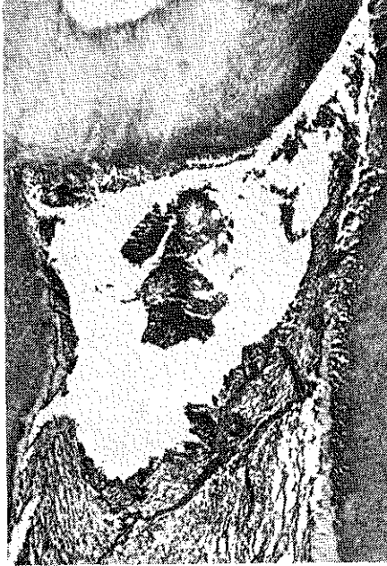
Resim: 3. Alt sol birinci küçük azı diřinin kron pulpası. Sekonder dentin yapımı (x), çok az lenfosit infiltrasyonu (a). Mikrofoto, H-E, x80.