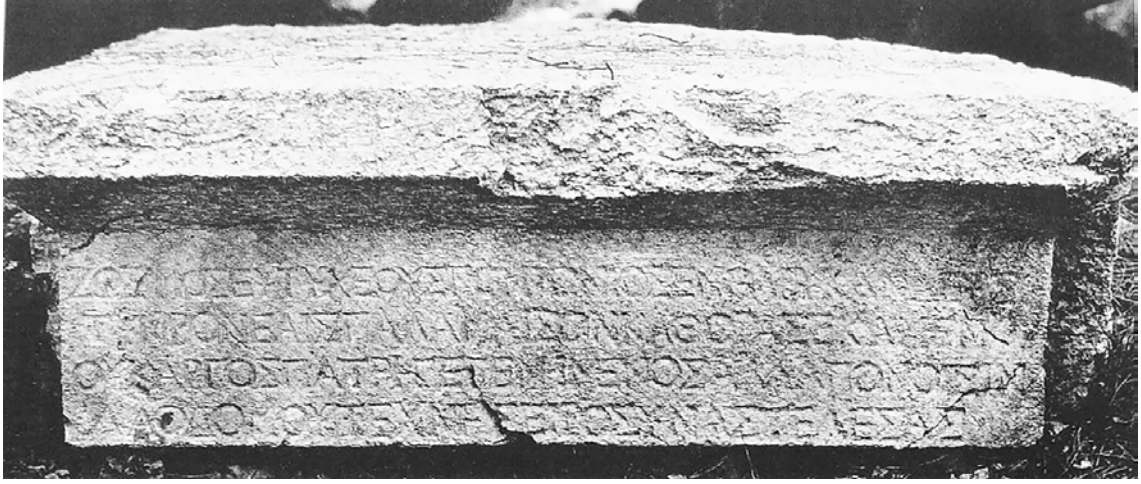
Y1: Zosimos Pomponios'un Mezar Yazıtı (Şahin 1994, Taf. 18, Nr. 108)