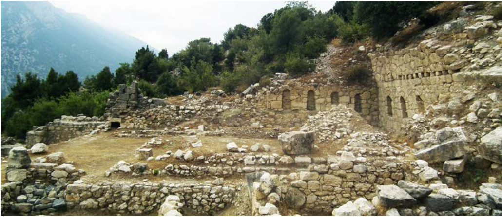
d. Traianeum (H. Sancaktar)