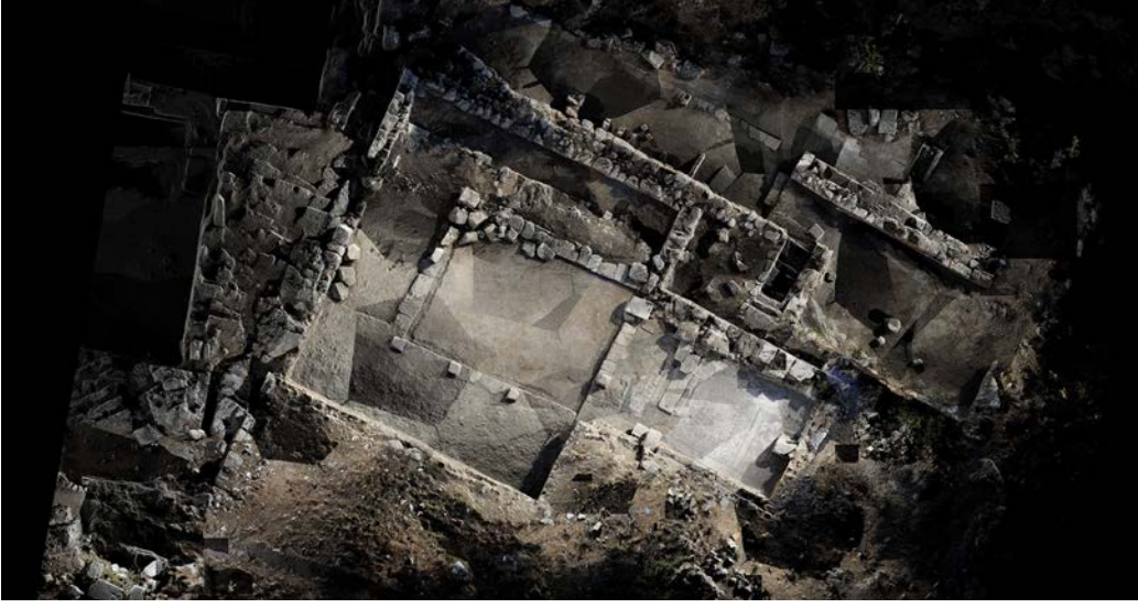
a. Sebasteion (H. Sancaktar)