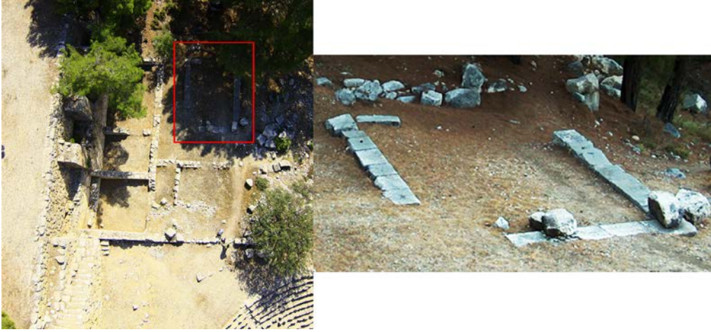
b.-c. Tiyatro Tapınağı (Kazı Arşivi)