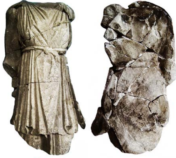
a Torso (H. Sancaktar)