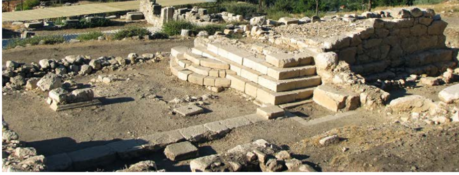
a. Podyumlu Tapınak.