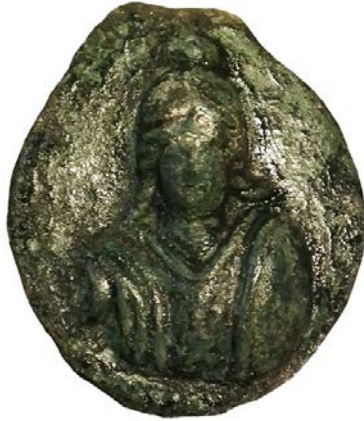
c. Athena Büstü Tasvirli Bronz Kandil Kapağı (H. Sancaktar)