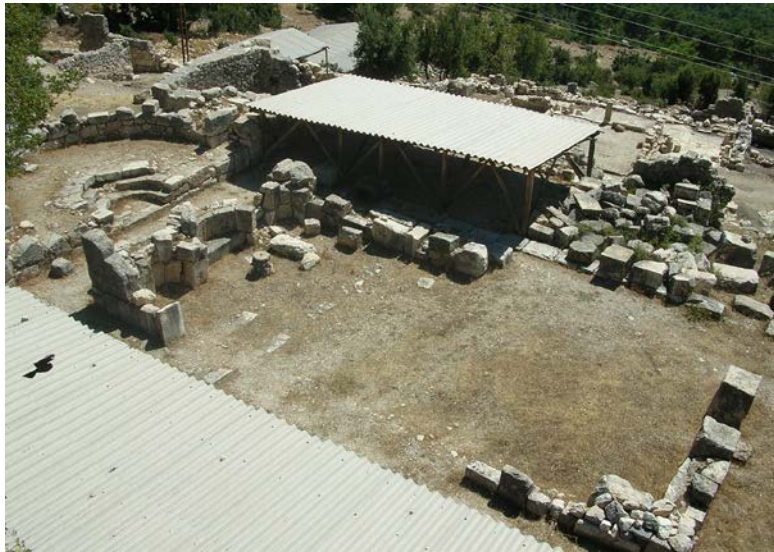
b-c. Büyük Bazilika.