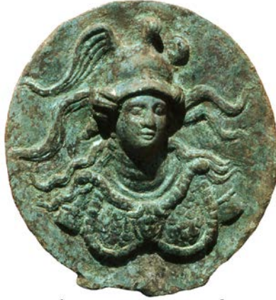
b. Athena Büstü Tasvirli Bronz Ayna (H. Sancaktar)