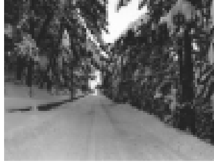
Resim-3 Yozgat Çamlığı Milli Parkı (9).

İlk Milli Parkımız olan Yozgat Çamlığı, 300 yıl önce özel bir şahıs tarafından korumaya alınmış ve 1945'te Ziraat Bakanlığı'nın emri ile devletleştirme dışında bırakılarak Yozgat Belediyesine verilmiştir. (6).