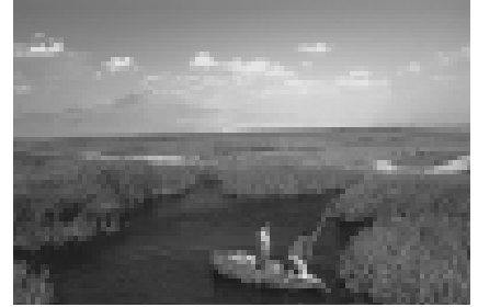
Resim 7 Sultansazlığı Milli Parkı (19).

Kayseri İli, Yeşilhisar, Develi ve Yahyalı ilçeleri arasında, yer alan Sultansazlığının kuzeyinde bölgenin en yüksek volkanik dağı Erciyes bulunur (18).