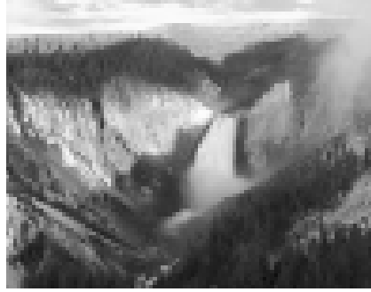
Resim -2 Yellowstone Milli Parkı (5).

Yellowstone Milli Parkının ilaıyla da bilinçli doğa koruma fikri tüm dünyaya yayılmaya başlamıştır.