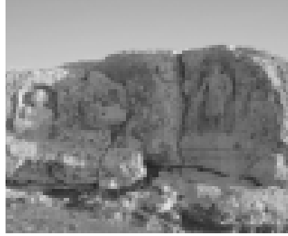
Resim 9 Soğmatar Harabeleri (23).

ve arkeolojik açıdan önemli alanlar bulunmaktadır (22). Bunlar, Han-el Ba'rur Kervansarayı, Şuayb Şehri Harabeleri ve Soğmatar Harabeleri (22).