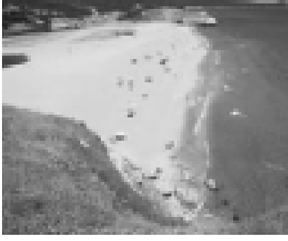
Resim 11 İğneada Milli Parkı (25).

Milli Parkın ana kaynak değerleri; Avrupa ölçeğinde çok sınırlı yayılışa sahip, korunabilmiş, yok olma tehlikesiyle karşı karşıya bulunan en önemli subasar (longos) ormanların bulunması, İğneada ve çevresinde farklı ekosistemlerin bulunmasıdır (tatlı su, tuzlu su ekosistemleri). Avrupa çapında nadir örneği ile zengin bir yaban hayatını ihtiva etmesi, delta, tatlı su bataklıkları, turba alanları, sulak saha ve orman ekosistemleri kaynak değerlerini oluşturmaktadır (22)..