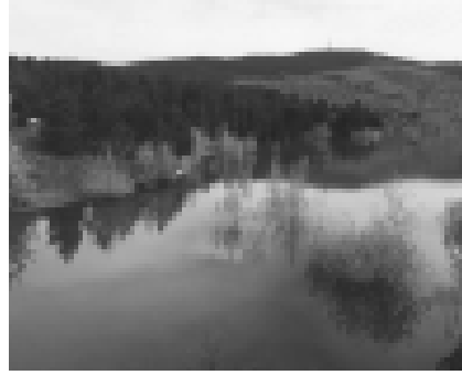
Resim 4 Yozgat Çamlığı Milli Parkı (10).

1958 yılında Yüksek İcra Vekilleri heyetinin kararı ile Milli Park haline getirilmiş, Bakanlar Kurulu Kararı ile kullanma ve İrtifak hakkı Orman Genel Müdürlüğüne verilmiştir (6).