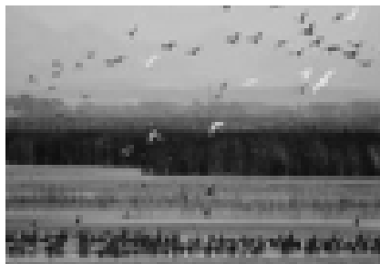
Resim 6 Gala Gölü Milli Parkı (17).

Milli Parkta yapılan çalışmalarda, çoğu ekonomik öneme sahip 20 balık, 28 sucul bitki, 134 kuş ve 71 Rotifera türü tespit edilmiştir (16).