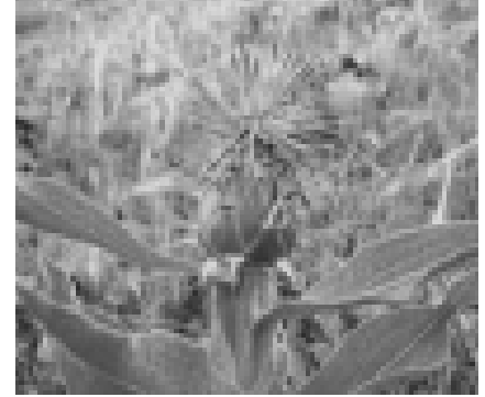
Resim 10 Peygamber Çiçeği (24).

endemik olan Peygamber çiçeğinin ( Centaurea ) 138 yıl sonra ortaya çıkması önem arz etmektedir (24).