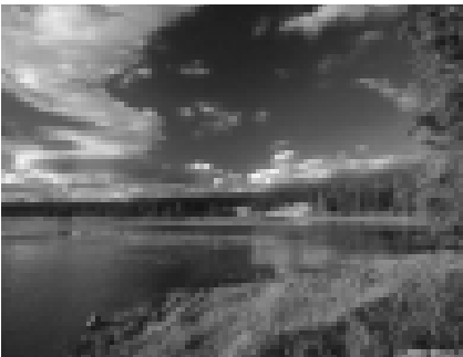
Resim - 1 Yellowstone Milli Parkı (4).

Dünyada ilk ve en çok tanınan doğa koruma alanı, ABD'de, 1872 yılında tescil edilen Yellowstone Milli Parkıdır (1).