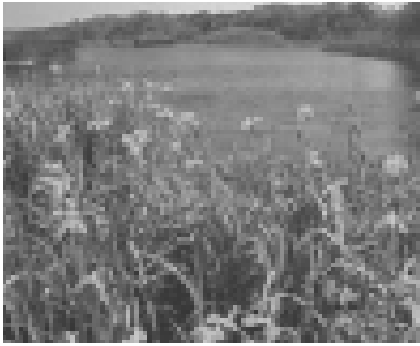
Resim 12 İğneada Milli Parkı (26).

Milli Parkın ana kaynak değerleri; Avrupa ölçeğinde çok sınırlı yayılışa sahip, korunabilmiş, yok olma tehlikesiyle karşı karşıya bulunan en önemli subasar (longos) ormanların bulunması, İğneada ve çevresinde farklı ekosistemlerin bulunmasıdır (tatlı su, tuzlu su ekosistemleri). Avrupa çapında nadir örneği ile zengin bir yaban hayatını ihtiva etmesi, delta, tatlı su bataklıkları, turba alanları, sulak saha ve orman ekosistemleri kaynak değerlerini oluşturmaktadır (22)..