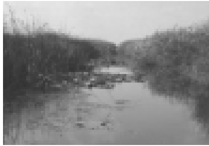
Resim 5 Gala Gölü Milli Parkı (15).

Edirne ili, Enez ve İpsala ilçeleri arasında bulunan Gala ve Pamuklu Göllerini içerisine alan 6.090 Ha. toplam alana sahip Gala Gölü Milli Parkı; 2005/8547 sayılı Bakanlar Kurulu Kararının 5 Mart 2005' te Resmi Gazetede yayımlanması ile Milli Park olarak tescil edilmiştir (14).