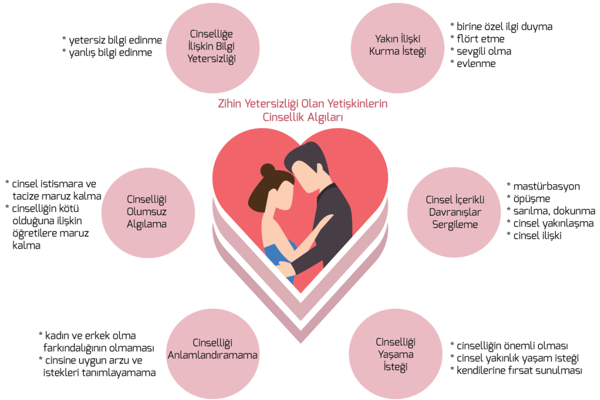
Őekil 3. Zihin yetersizliđi olan yetiřkinlerin cinsellik algıları

Parchomiuk, 2013; Rushbrooke vd., 2014). Söz edilen bu arařtırmaların sonuçları dođrultusunda zihin yetersizliđi olan yetiřkinlerin cinselliđi algılamaları çeřitli temalar altında toplanmıřtır. Bu temalar Őekil 3'te özetlenmiřtir.