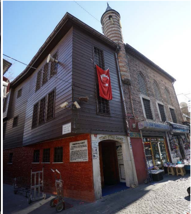
Şekil 9. (Sağda) Hacı Timurtaş Mescidi (Anonim, tb2)