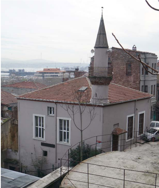
Şekil 4. Bodrum Camii (Anonim, tb1)

Bodrum Mescidi Mahallesi: Bâb-ı Meşihat'ın kuzeyindeki set duvarının aşağısındadır. Mescidin Banisi Hayrüddin Efendi, Fâtiḥ'in hocası ve Üç Mihrablı Câmî'in bânîsi olan zattan başkası olup, 1469'da Eyyüb'e defnolunmuştur. Mahalle günümüze ulaşmamıştır. Şimdi Timurtaş Mahallesi içindedir (Ayverdi, 1958: 15). Bodrum Mescidi'nin bânîsi Hayrüddin Efendi, Fatih Devri âlimlerindedir (Ünver, 1976: 53). Ayrıca Saatçi Yokuşu Cami ve Softa Hatip Camii de denilmektedir. Deprem, yangın ve kullanıma bağlı sebeplerden dolayı harap hale gelmiş, 1964 ve 1982 yıllarında onarım görmüştür (Demirtaş Mahallesi, 2019).