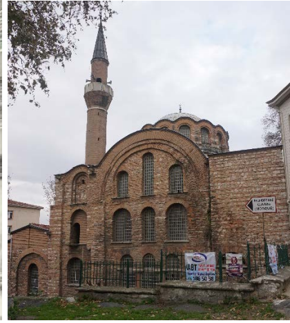
Şekil 33. (Solda) Kalenderhane Camii (Anonim, tb1) Şekil 34. (Sağda) Kalenderhane Camii (Anonim, tb2)