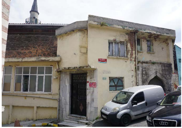
Şekil 7. (Sağda) Hoca Hamza Mescidi (Anonim, tb2)