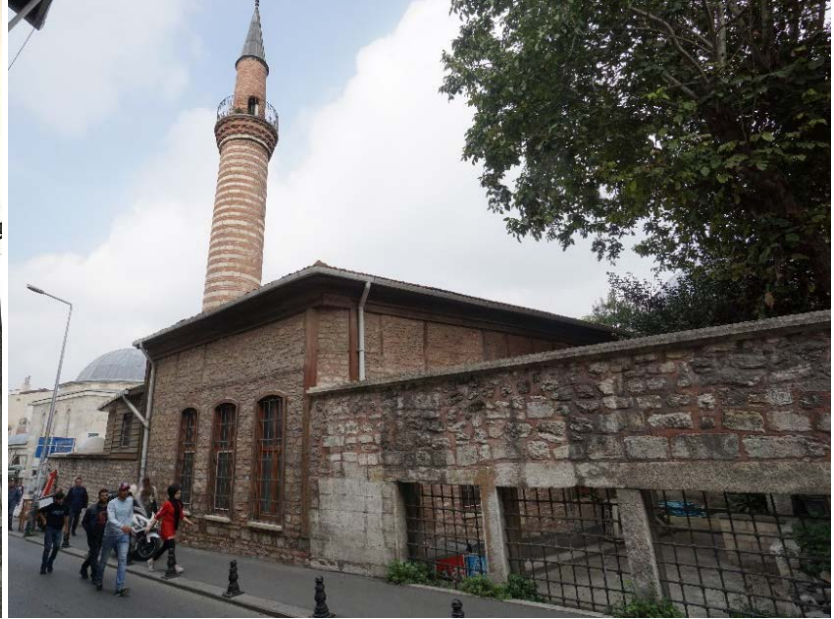
Şekil 31. (Solda) Molla Hüsrev Camii (Anonim, tb1)