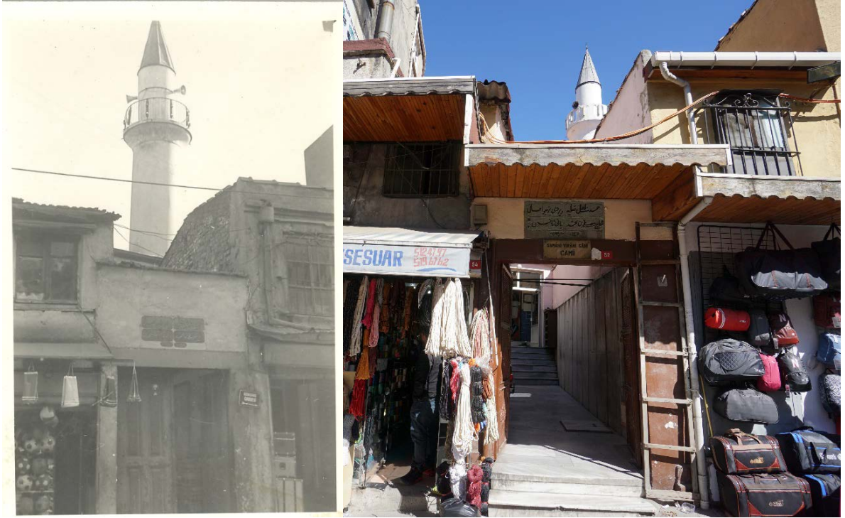
Şekil 39. (Solda) Saman Viren Mescidi (ikinci) (Anonim, tb1) Şekil 40. (Sağda) Saman Viren Mescidi (İkinci) (Anonim, tb2)