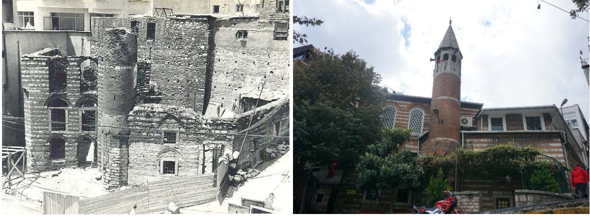
Şekil 37. (Solda) Saman Viren Mescidi (Birinci) (Anonim, tb1) Şekil 38. (Sağda) Saman Viren Mescidi (Birinci) (Anonim, tb2)

1477 tarihli vakfiyesinde çarşı civârında 9 dükkân, kendi mahallesi ve Yavaşça Şahin civarında 36 hücre ve 11 dükkân, Yavaşça Şahin Mahallesinde 8 evden önemli bir miktarda gelir tanımlanmaktadır. Günümüzde Süleymâniye Mahallesindedir.