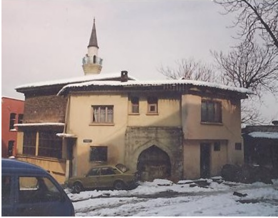
Şekil 6. (Solda) Hoca Hamza Mescidi (Anonim, tb1)

taksimâtı sırasında Timurtaş Mahallesi içinde kalmıştır. Vakfiye tarihi 1464'tür (Ayverdi, 1958: 25).