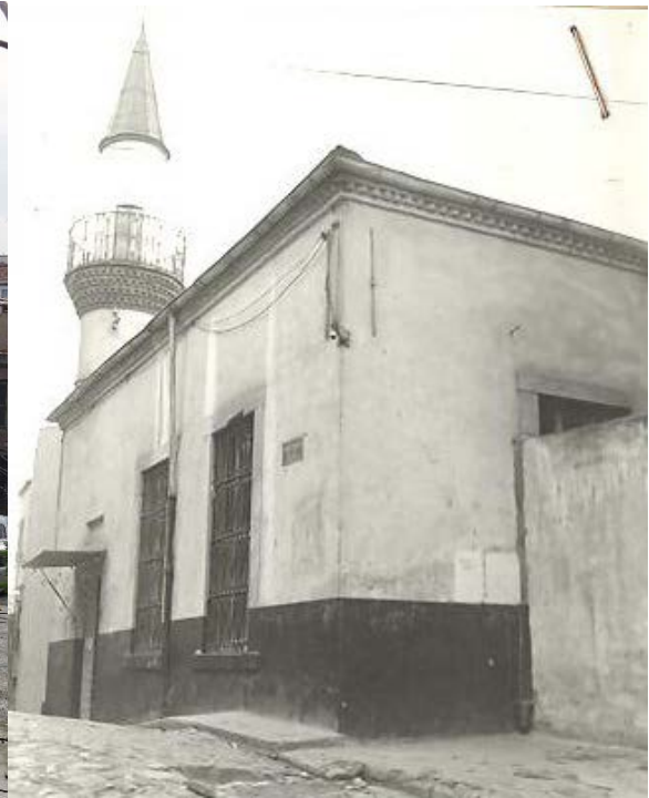
Şekil 5. Bodrum Camii (Anonim, tb2)

Hoca Hamza Mescidi Mahallesi: Uzun Çarşının batı tarafında Dökmeciler Hamamının altındaki yamaçtır. Kayıtlardaki 'Mahalle-i Mescid-i Hoca Hamza't-ül Aver' ismi ile Arslanlı Mahallesi'ni de içine almıştır. İbrahim Paşa Camii nahiyesinde 'Mahalle-i Mescid-i Hoca Hamza diye kayıtlıdır. Küçük Pazar Maliye Şubesi mahalleleri arasındadır. Mahalle