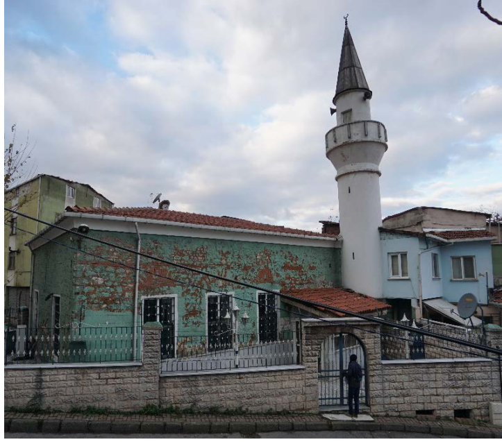
Şekil 26. (Solda) Mehmed Paşa Mescidi (Anonim, tb1) Şekil 27. (Sağda) Mehmed Paşa Mescidi (Anonim, tb2)

Sarı Bâyezid Mescidi Mahallesi: Vefâ Türbesinin kuzeyi ile Süleymâniye Külliyesinin batısındadır. Vefâ Camii Nahiyesinde Mahalle-i Mescid-i Sâru Bâyezid ismi ile kaydedilmiştir. Vakfiye tarihi 1470'tir. 1922 cetvelinde Küçük Pazar Mâliye Şubesi mahalleleri arasındadır. Hoca Gıyasüddin Mahallesi kalmaktadır (Ayverdi, 1958: 44).