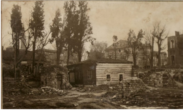
Şekil 20. Şeyh Vefa Camii (Anonim, tb1)

Şeyh Vefa'nın Kabri üzerine türbe inşa edilmiştir. Türbenin ve tekkenin çevresi zamanla büyük bir mahalleye dönmüştür. 1513'de Şeyh Vefa'nın oğlu tarafından düzenlenen vakfiyede, çeşitli gayrimenkullerin, kitapların ve tekkenin mensuplarına evler yapılması için cami çevresindeki arsaların vakfedildiği kayıtlıdır (Tanman, 1990, Katalog 5). Mahallesi, günümüzde Hoca Giyasettin ve Hacı Kadın Mahallelerinde kalmaktadır.