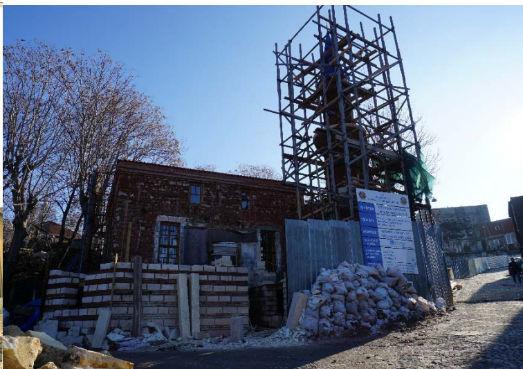
Şekil 28. (Solda) Sarı Bayezid Mescidi (Anonim, tb1) Şekil 29. (Sağda) Sarı Bayezid Mescidi (Anonim, tb2)