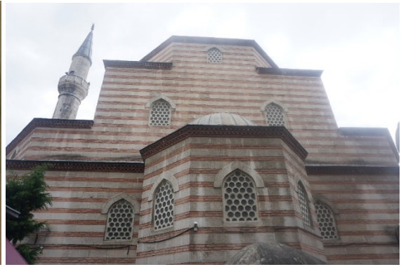
Şekil 21. Şeyh Vefa Camii (Anonim, tb2)

Unkapanı Mahallesi: Mescidi olmadığından XVI. Asırda unutulmuş, semt ismi halini almıştır (Ayverdi, 1958: 50).