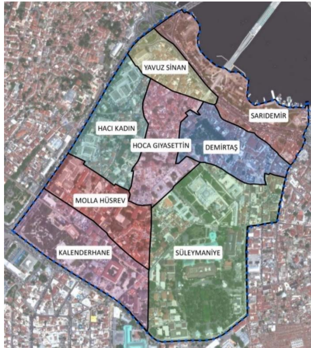
Şekil 1. Günümüzde bölgedeki mahalleler (İBB haritalar, 2019)