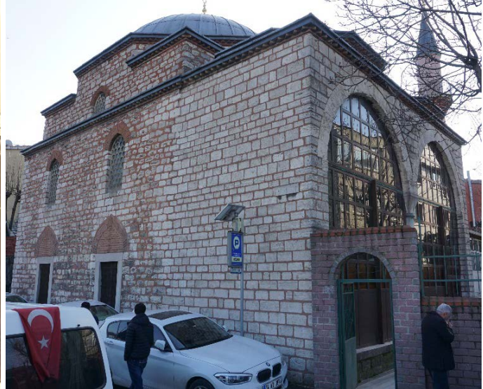
Şekil 16. (Solda) Hoca Hayrüddin Camii (Anonim, tb1) Şekil 17. (Sağda) Hoca Hayrüddin Camii (Anonim, tb2)