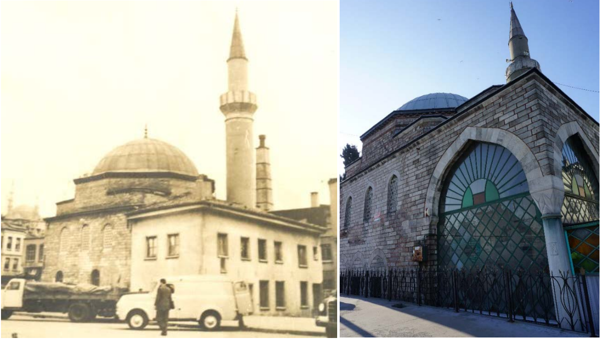
Şekil 12. (Solda) Yavuz Er-Sinan Camii (Anonim, tb1) Şekil 13. (Sağda) Yavuz Er-Sinan Camii (Anonim, tb2)

Hacı Halil Mescidi Mahallesi: Unkapanı'nda Atlama Taşı civarındadır. Vefâ Camii nahiyesinde 'Mahalle-i Mescid-i Hacı Halil' ismi ile kayıtlıdır. 1457 tarihi ile bugün İstanbul'un mevcut olan en eski mescididir. Mahallesi taksimat sırasında kaldırılarak Yavuz Er-Sinan ve Hacı Kadın Mahallelerine katılmıştır. Mescidi ibadete açıktır (Ayverdi, 1958: 22).