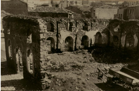
Şekil 22. (Solda) Hoca Teberrük Mescidi (Anonim, tb1)

Hoca Teberrük Mescidi Mahallesi: (Yahya Güzel Mescidi Mahallesi) Eski kırk Çeşme'den aşağı Voynuk Şücaüddin Mescidi'ne kadar olan bölgededir. Vefâ Camii nahiyesinde Mahalle-i Mescid-i Hoca Teberrük ismi ile kayıtlıdır. Vakfiye tarihi 1476'dır. Hadîka'da bulunduğu sokağa nispetle Yahya Güzel Mescidi ismi ile kaydedilmiş, mescidin yandığı ve Bağdat Ağası Osman Ağa tarafından yeniden inşa edildiği bildirilmiştir. Şehzade Başı Mâliye Şubesi mahalleleri arasındadır. Mahalle taksimatı sırasında Kırk Çeşme Mahallesi içinde kalmıştır. Mescidi yıkılmıştır (Ayverdi, 1958: 26).