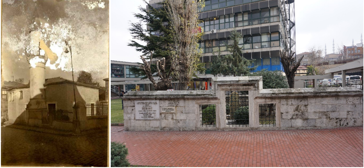
Şekil 24. (Solda) Voynuk Şücaüddin Mescidi Şekil 25. (Sağda) Voynuk Şücaüddin Mescidi

Fatih devrinin divan sahibi şairlerinden olan Necâti, 914(1508)'de vefatından sonra, Voynuk Şücaüddin mescidi yanındaki mekteb altında gömülü iken, Manifaturacılar Çarşısı önüne nakledilmiştir (Ünver, 1976: 91).