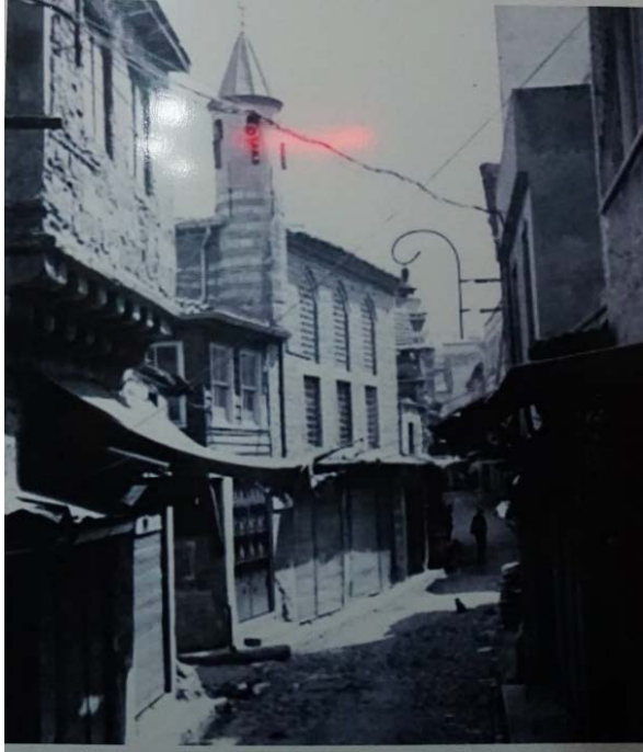
Şekil 8. (Solda) Hacı Timurtaş Mescidi (Cami girişinde duvarda asılı fotoğraf, tb)