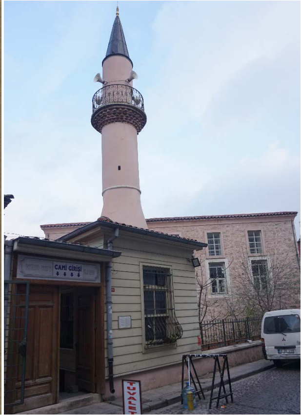
Şekil 18. (Solda) Hızır Bey Mescidi (Anonim, tb1) Şekil 19. (Sağda) Hızır Bey Mescidi (Anonim, tb2)

Şeyh Vefâ Câmî'i Mahallesi: Vefâ Meydanının doğu taraflarıdır. Câmî'nin Fâtih tarafından yaptırıldığı ve vazife tayin olunduğu vakfiyesinden anlaşılmaktadır. 1922 cetvelinde mahalle olarak geçmemiştir (Ayverdi, 1958: 48).