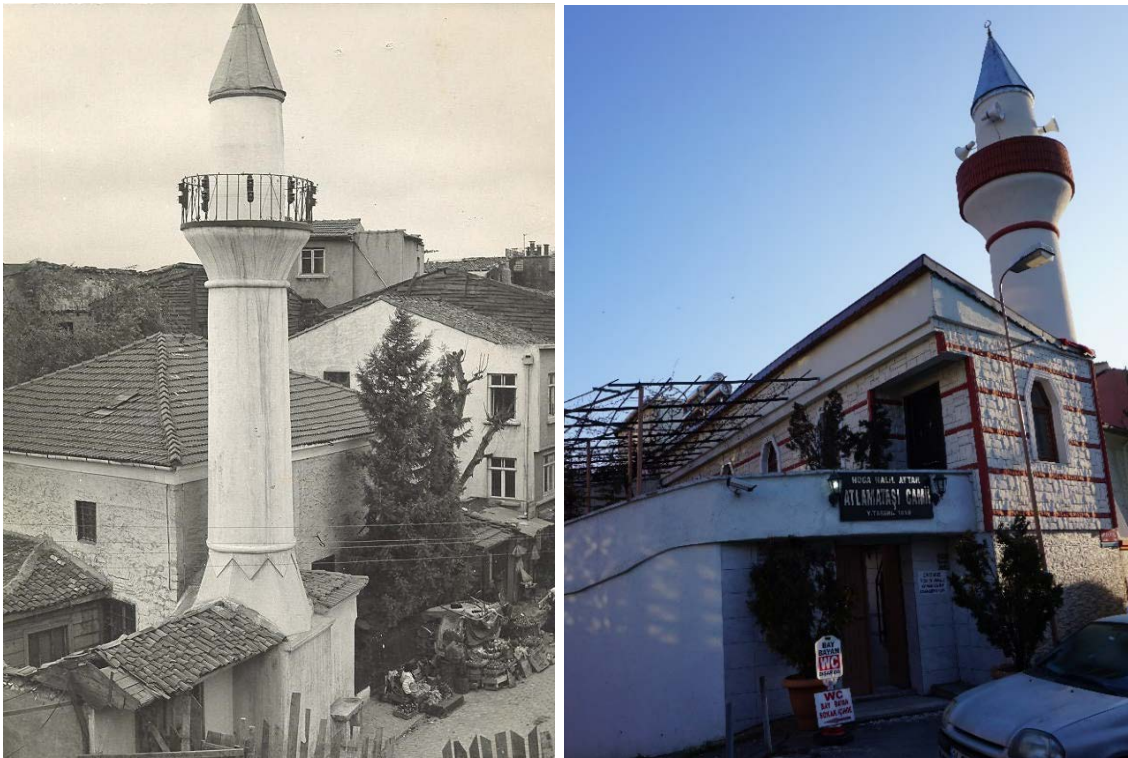
Şekil 14. (Solda) Hacı Halil Mescidi (Anonim, tb1) Şekil 15. (Sağda) Hacı Halil Mescidi (Anonim, tb2)

Hacı Halil Mescidi Mahallesi: Unkapanı'nda Atlama Taşı civarındadır. Vefâ Camii nahiyesinde 'Mahalle-i Mescid-i Hacı Halil' ismi ile kayıtlıdır. 1457 tarihi ile bugün İstanbul'un mevcut olan en eski mescididir. Mahallesi taksimat sırasında kaldırılarak Yavuz Er-Sinan ve Hacı Kadın Mahallelerine katılmıştır. Mescidi ibadete açıktır (Ayverdi, 1958: 22).