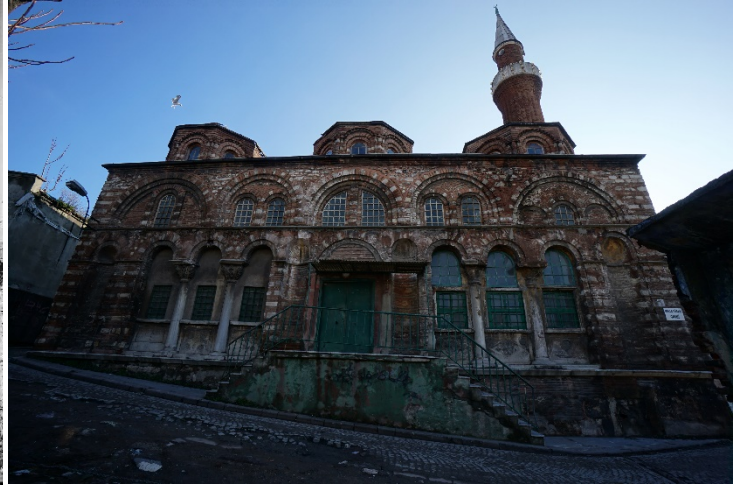
Şekil 30. (Solda) Molla Gürânî Mescidi Şekil 31. (Sağda) Molla Gürânî Mescidi