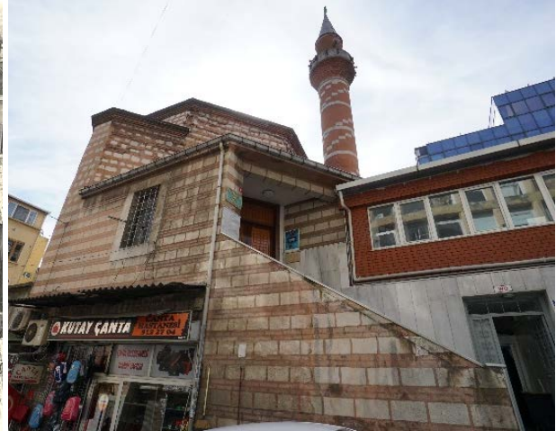
Şekil 35. (Solda) Bezzâz-ı Cedîd Mescidi (Anonim, tb1) Şekil 36. (Sağda) Bezzâz-ı Cedîd Mescidi (Anonim, tb2)

Saman Viren Mescidi Mahallesi (Birinci): (Çukur Çeşme Mescidi Mahallesi) Süleymaniye Dökmeciler Hamamı ile Uzun Çarşı arasındadır. Vâkıfi tarihi 1478'dir. Hâdika'da mescidi Çukur Çeşme ismi ile yazılıp, bânîsinin Saman Emîni Hoca Sinan olduğu ve mahallesinin bulunduğu bildirilmektedir. 1922 cetvelinde Mercan Mâliye Şubesi mahalleleri arasında Saman Virân-ı Evvel olarak kayıtlıdır. 1934 mahalle taksimatında Süleyman'ül Marûf Mahallesi içinde kalmıştır (Ayverdi, 1958: 43).