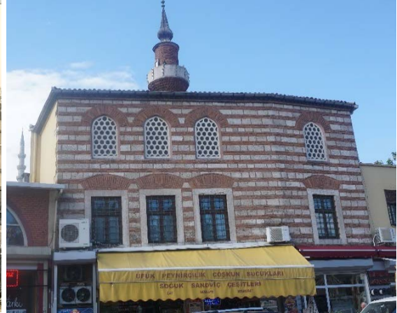
Şekil 10. (Solda) Sarı Timurcu Mescidi (Anonim, tb1) Şekil 11. (Sağda) Sarı Timurcu Mescidi (Anonim, tb2)