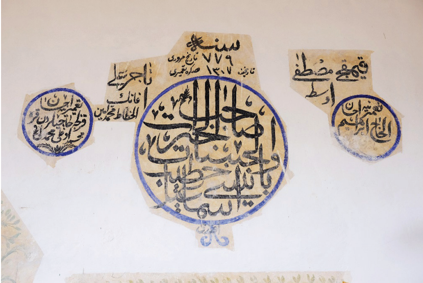
G. 14. Harim giriş açıklığı üzerindeki kitabe levhaları

Giriş açıklığının üzerinde bulunan hat yazılardan yapının inşa tarihi, onarım tarihi ve inşa ettiren kişiler hakkında ilgi çekici bilgilere ulaşmak mümkündür (G. 14) 6 . Bu yazılar farklı büyüklükteki üç dairesel çerçeve içerisine ve onların arasındaki alanlara yazılmıştır. Çok düzgün olmayan çerçeveler, çivit mavisi rengindeki konturlarla oluşturulmuştur. Yazılar yerleştirilirken herhangi bir simetri kaygısı gözetilmemiştir.