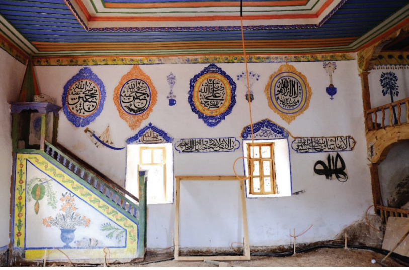
G. 7. Harim batı duvarı ve minber

Harim kuzey duvarında yer alan süsleme programı oldukça ilgi çekicidir. Süslemlerde belli bir düzen söz konusu değildir. Yüzeydeki hat levhalar ve motifler dağınık bir yayılım göstermektedir (G. 4). Giriş açıklığının üzerinde yapının inşa tarihi, onarım tarihi ve inşa ettiren kişiler hakkında bilgileri içeren hat yazılar yer almaktadır. Bu yazılar farklı büyüklükteki üç dairesel çerçeve içerisine ve onların üzerindeki alanlara yazılmıştır. Çok düzgün olmayan çerçeveler lacivert renkle oluşturulmuştur. Yazıların üzeri zamanın ve doğanın tahribatıyla kısmen solmakla birlikte iyi durumdadır. Ancak üzerlerinde geçmişte yapılan müdahalelerden çeşitli boya lekeleri kalmıştır.