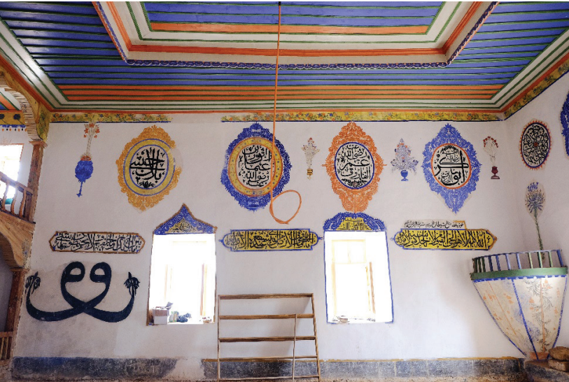
G.8. Harim doğu duvarı

Harim kuzey duvarında yer alan süsleme programı oldukça ilgi çekicidir. Süslemlerde belli bir düzen söz konusu değildir. Yüzeydeki hat levhalar ve motifler dağınık bir yayılım göstermektedir (G. 4). Giriş açıklığının üzerinde yapının inşa tarihi, onarım tarihi ve inşa ettiren kişiler hakkında bilgileri içeren hat yazılar yer almaktadır. Bu yazılar farklı büyüklükteki üç dairesel çerçeve içerisine ve onların üzerindeki alanlara yazılmıştır. Çok düzgün olmayan çerçeveler lacivert renkle oluşturulmuştur. Yazıların üzeri zamanın ve doğanın tahribatıyla kısmen solmakla birlikte iyi durumdadır. Ancak üzerlerinde geçmişte yapılan müdahalelerden çeşitli boya lekeleri kalmıştır.