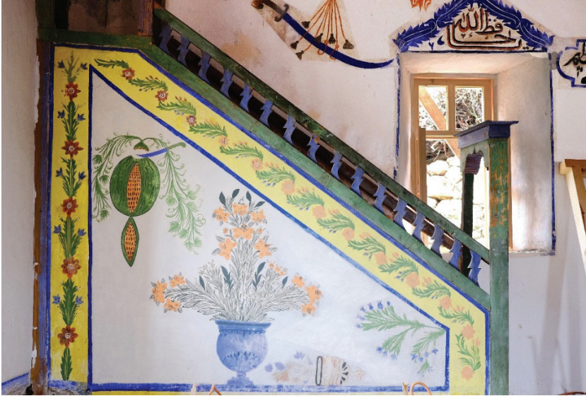
G. 13. Minber aynalığındaki kalemişi süslemeler

Harim duvarlarında da son cemaat yerinde olduğu gibi süslemelerin zeminiyle cephenin diğer zemini arasında büyük bir ton farkı bulunmaktadır.