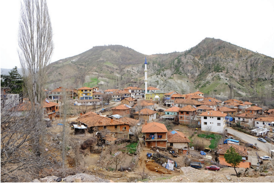
G. 1. Demirci Küpeler Köyü

Manisa'nın Demirci İlçesi'nde, adını aldığı Küpeler Köyü'nde bulunan eski cami 1 , gerek harimi çevreleyen hat levhaları gerek kalem işi süslemeleri ve gerekse usta isimlerini de içeren kitabeleriyle ilgi çekici veriler sunmaktadır. Yapı daha önce bir envanter çalışması kapsamında kısaca ele alınmış 2 ancak bugüne kadar hakkında ayrıntılı bir değerlendirme yapılmamıştır.