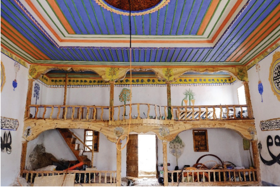
G. 6. Harimin kuzey duvarı ve kadınlar mahfili

Yapının yarım daire profilli mihrap nişi, çeyrek küre şekilli bir kavsaraya sahiptir. Niş iki yandan sütüncelere oturan bir şeritle çevrelenmektedir. Özellikle niş içerisinde bulunan süslemelerin bir dönem kötü bir biçimde elden geçirildiği anlaşılmaktadır (G. 5). Yapının ahşap minberi de süslemeleriyle dikkat çekmektedir. Minberin aynalık kısmı alçıyla sıvanmış ve bu alan tümüyle kalemî süslemelerle donatılmıştır. Mihrabın doğusunda yer alan vaaz kürsüsü de minber gibi alçıyla sıvanmış ve alçı üzeri kalemî süsleme tekniğiyle süslenmiştir.