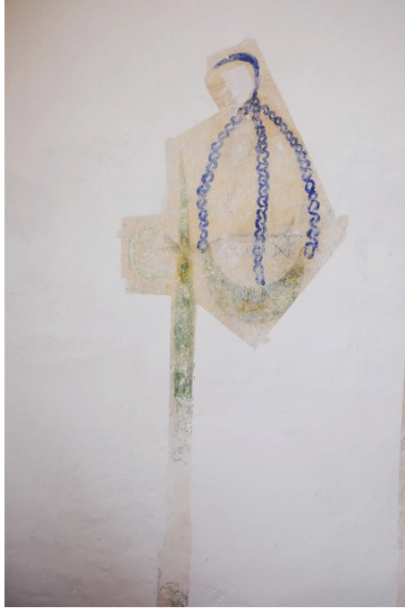
G. 9. Harim kuzey cephesindeki keşkül ve teber tasviri

Harim kuzey cephesindeki pencere açıklıklarının üzerinde, vazodan çıkan çiçek demetlerine yer verilmiştir. Yeşil yapraklı bu demetler, mavi renkli karanfil benzeri çiçeklere sahiptir. Giriş açıklığıyla doğudaki pencere açıklığı arasındaysa üzerinde meyveleriyle birlikte bir nar ağacı betimlenmiştir.